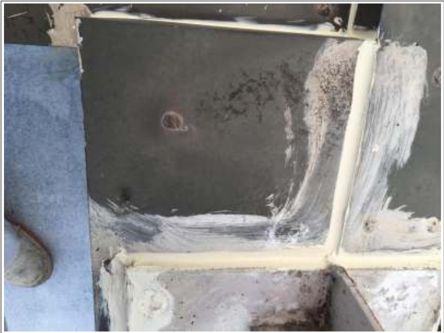
笠木 シーリング補修