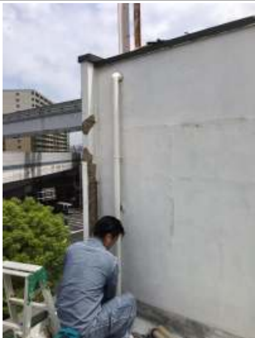
樋 取り換え 施工中