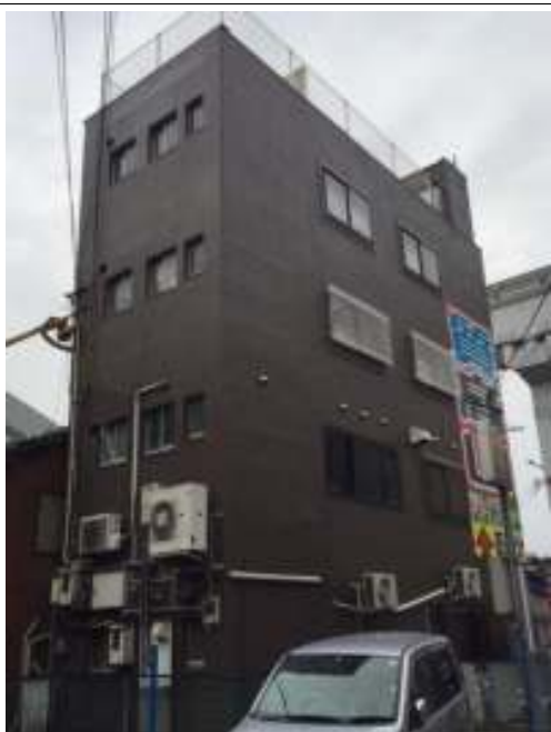
外壁 上塗り施工後