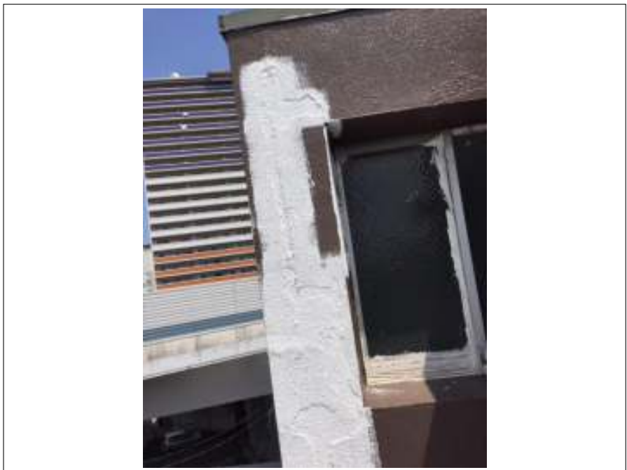
外壁 下地処理施工後