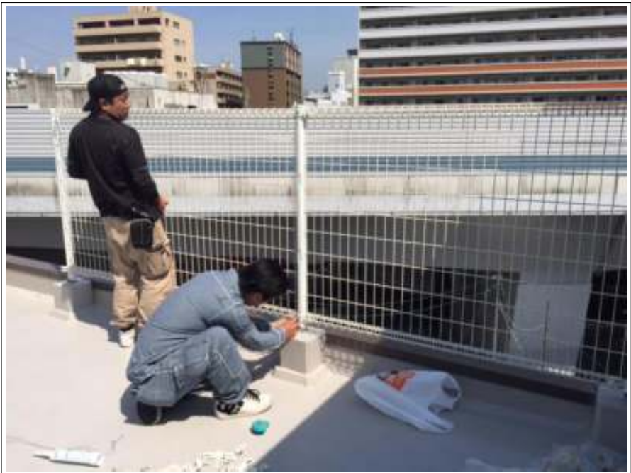
フェンス取付施工中