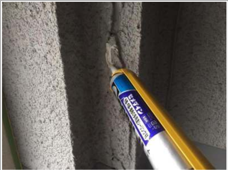
内部クラック補修 施工中