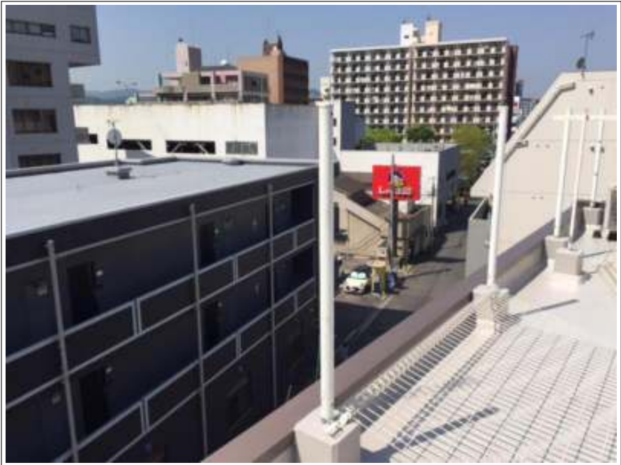
フェンス取付施工中