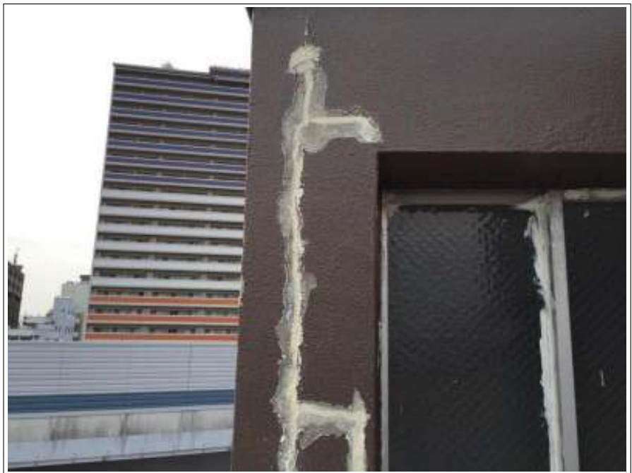
外壁 下地処理施工前