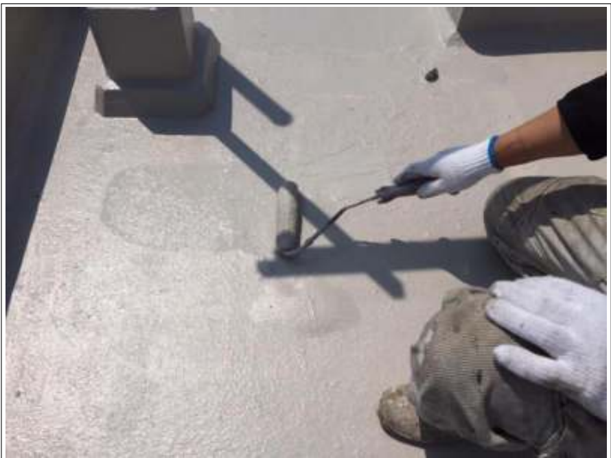
防水部 上塗り施工中