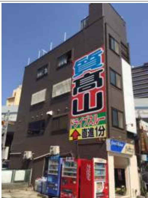
外壁 上塗り施工後