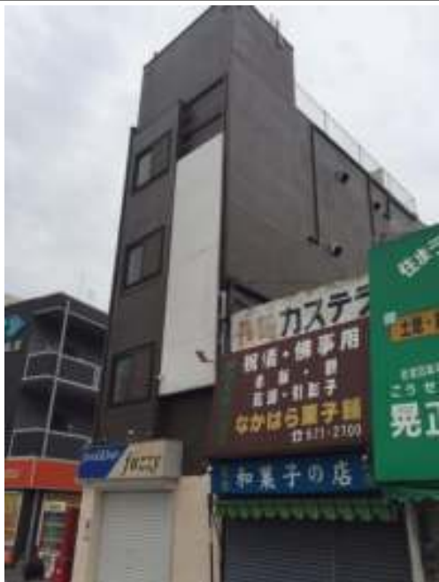
外壁 上塗り施工後