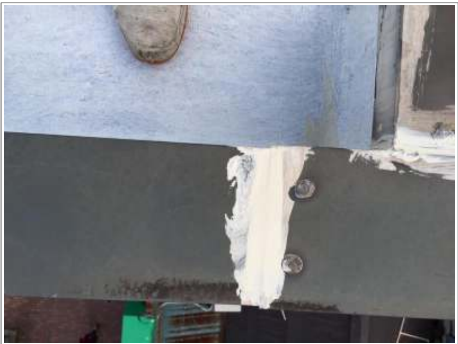
笠木 シーリング補修