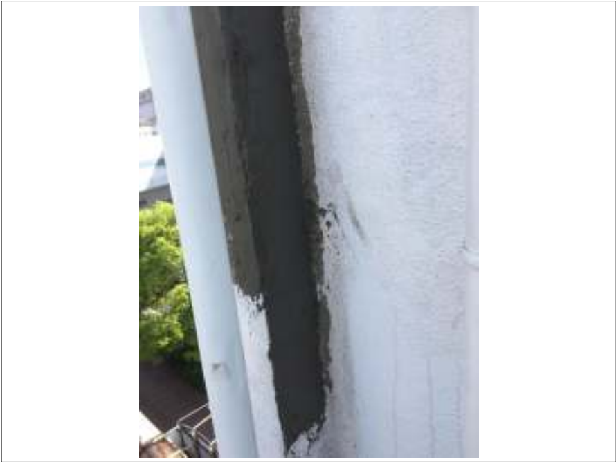
外壁 下地処理施工中