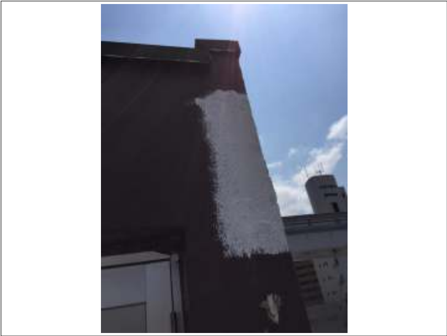
外壁 下地処理施工後