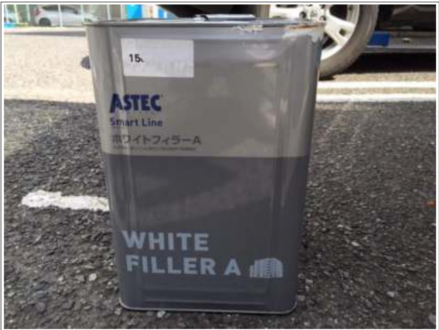
外壁 下塗使用材料