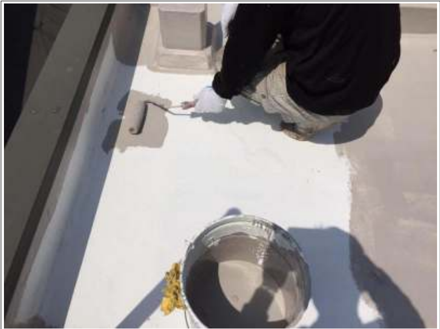
防水部 中塗り施工中