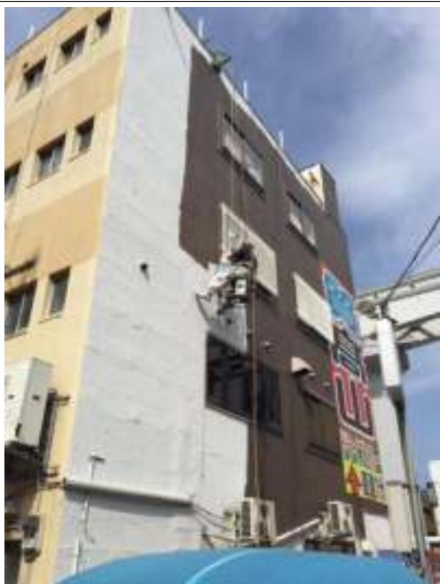
外壁 中塗り施工中