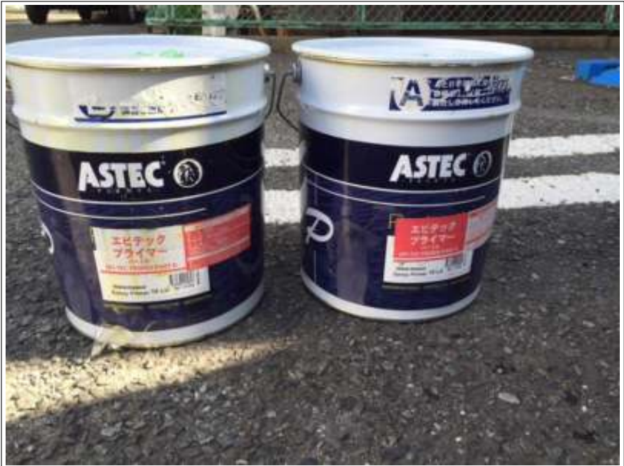
屋上 下塗使用材料