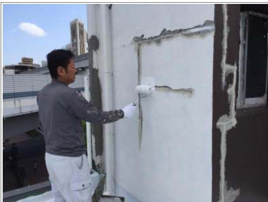
外壁 下地処理施工中