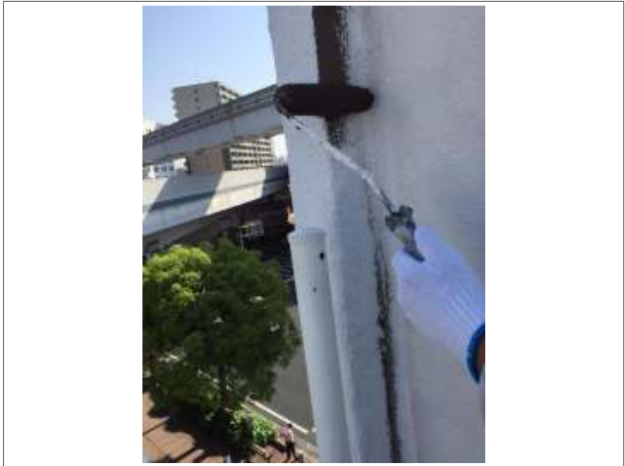
外壁 中塗り施工中