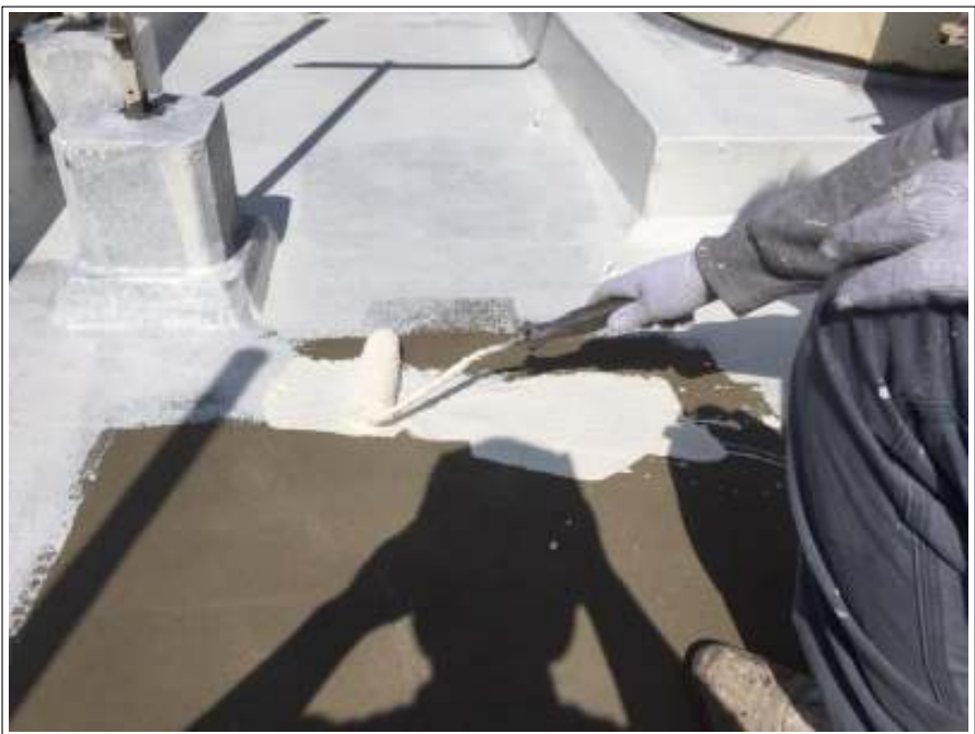
防水部 下塗り施工中