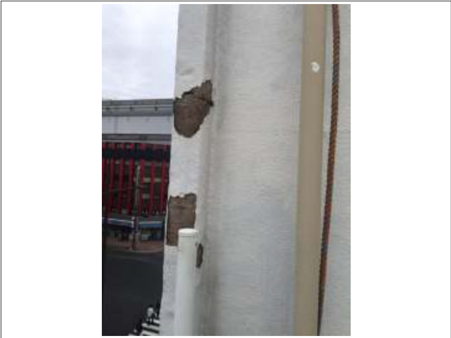
外壁 下地処理施工前