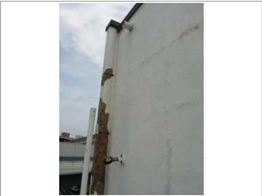
樋 取り換え 施工中