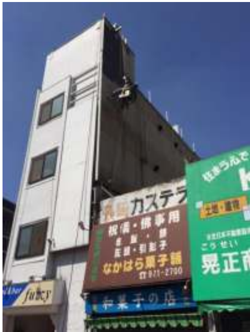
外壁 中塗り施工中