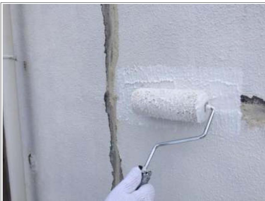
外壁 下地処理施工中