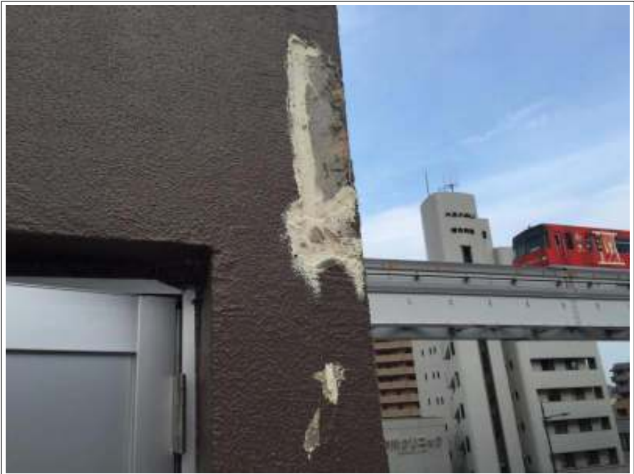
外壁 下地処理施工前