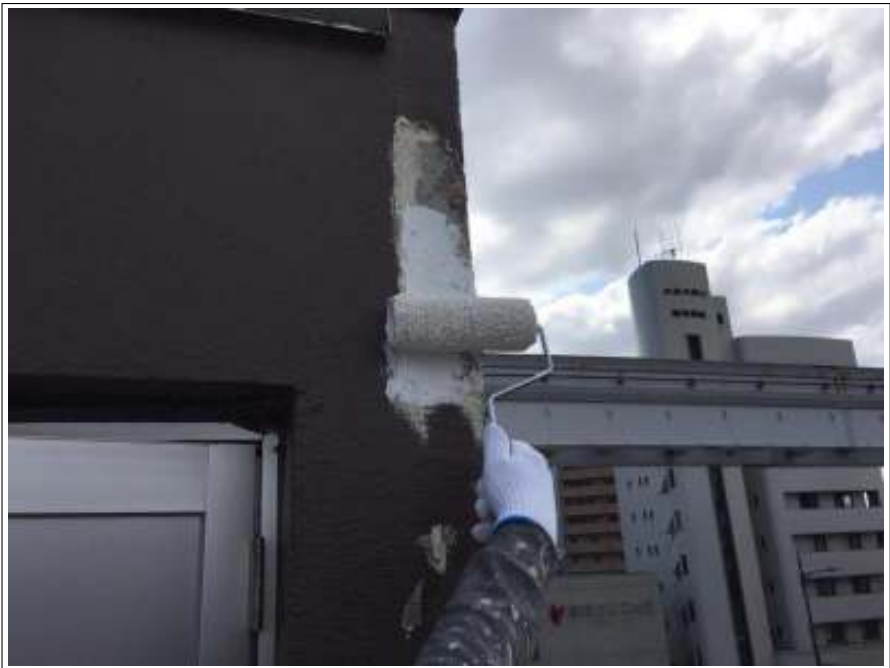
外壁 下地処理施工中