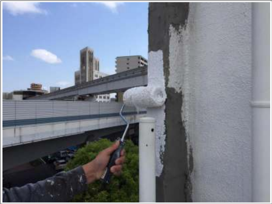
外壁 下地処理施工中