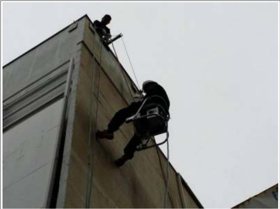
外壁 下塗り施工中