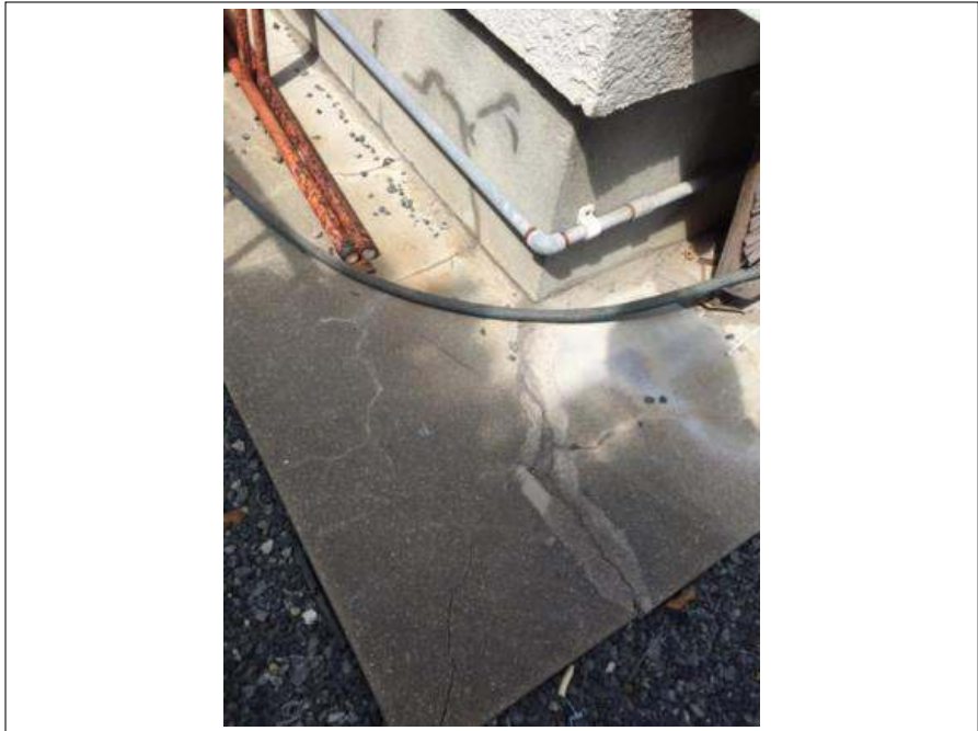
犬走り クラック部