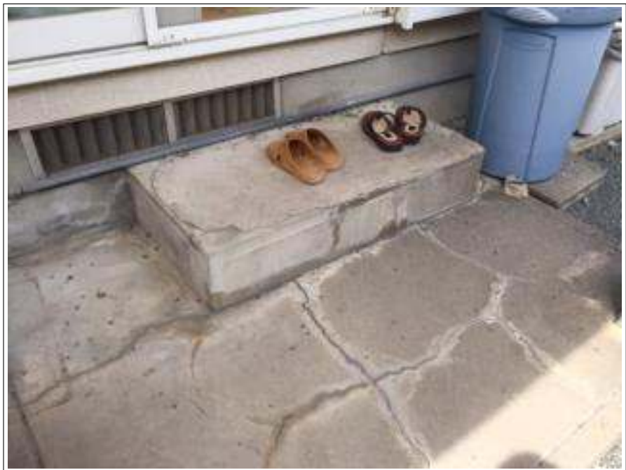
犬走り クラック部