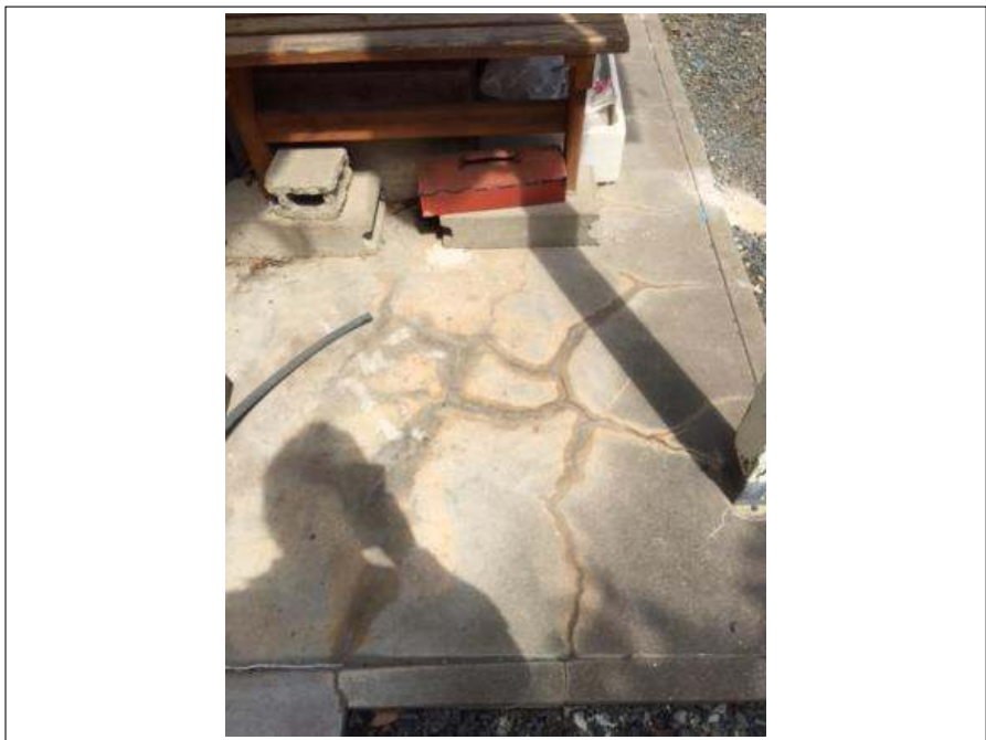
犬走り クラック部