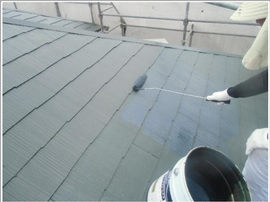
屋根塗装上塗り施工中