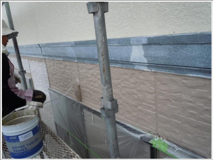
外壁塗装中塗り施工中