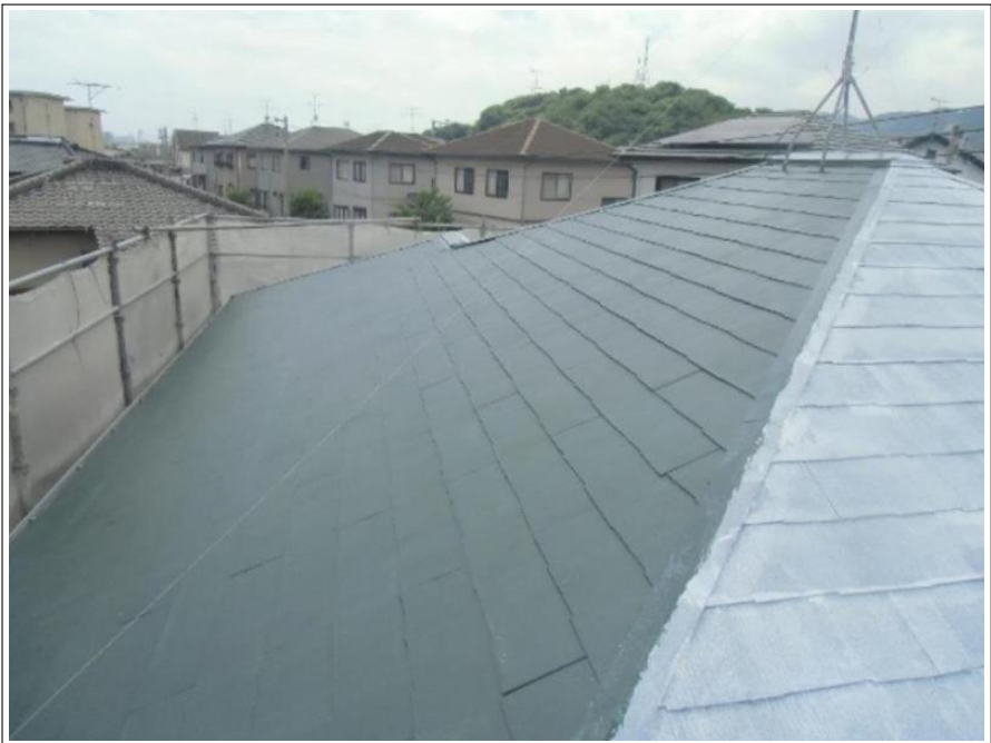
屋根塗装中塗り施工中