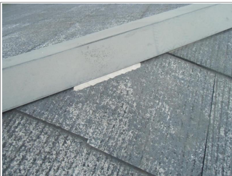
屋根棟鉄板ラバー止め施工完了