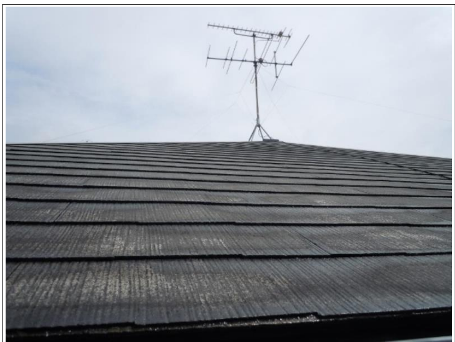
屋根高圧洗浄施工完了