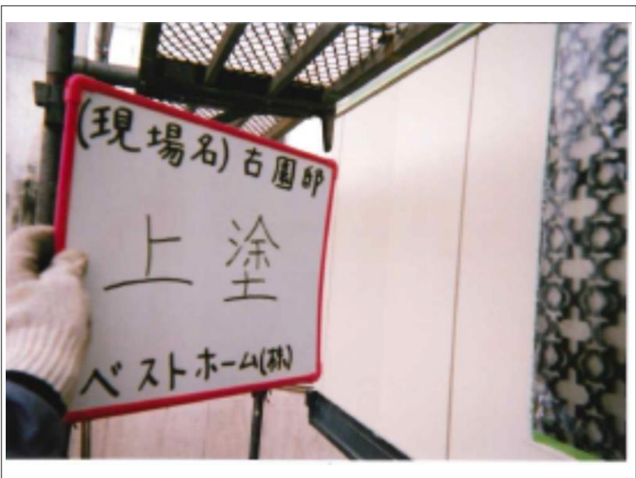
外壁塗装上塗り施工完了