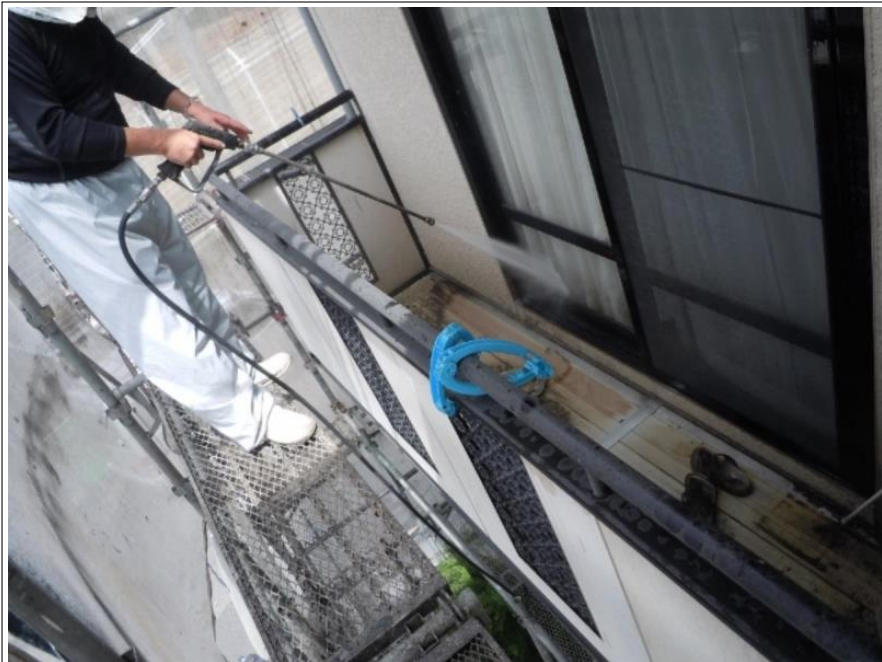
窓高圧洗浄施工中