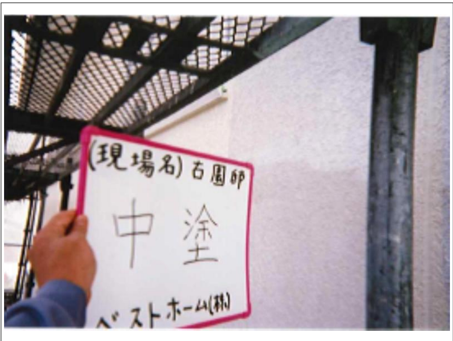
外壁塗装中塗り施工完了