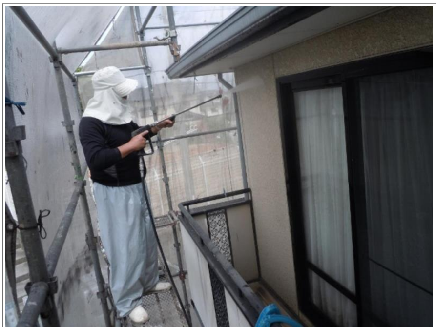
外壁高圧洗浄施工中