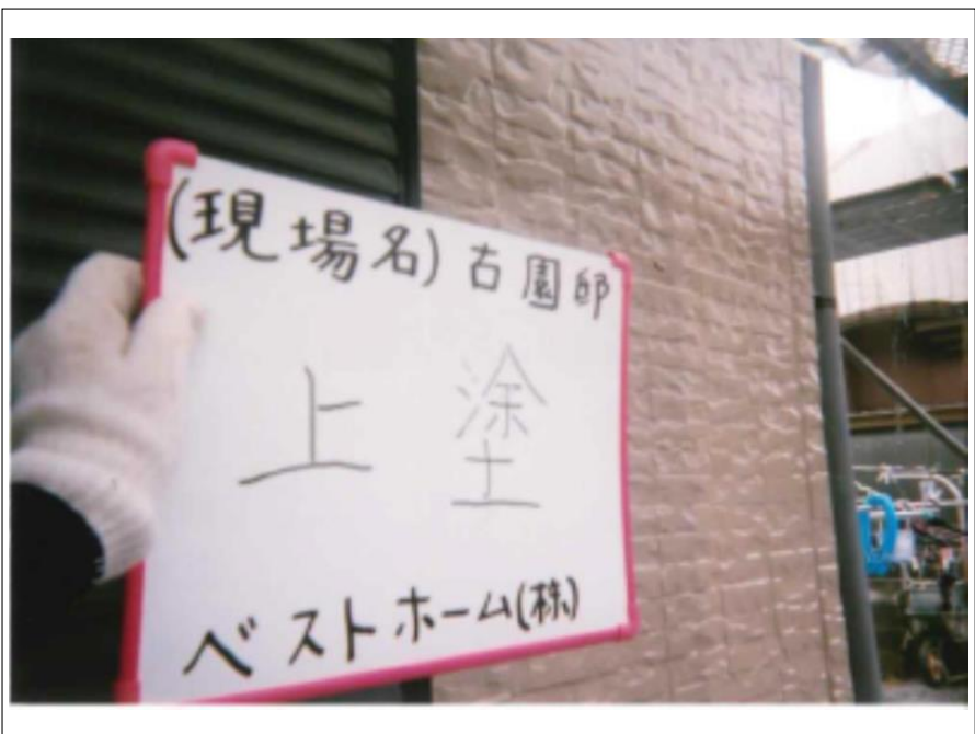
外壁塗装上塗り施工完了