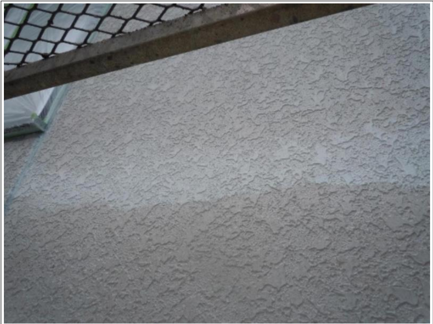
外壁塗装下塗り施工完了