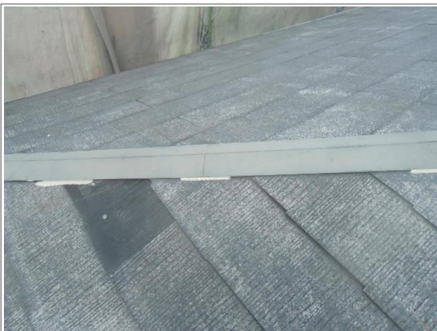
屋根棟鉄板ラバー止め施工完了