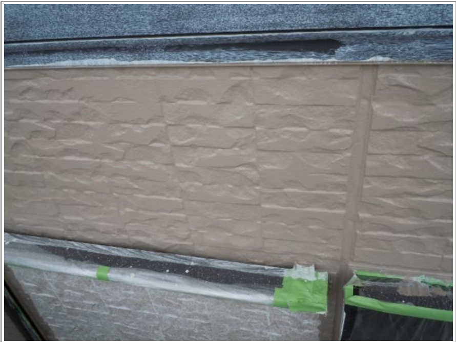
外壁塗装中塗り施工完了