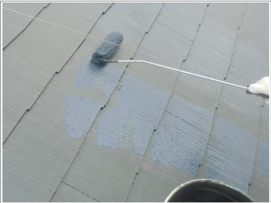
屋根塗装上塗り施工中