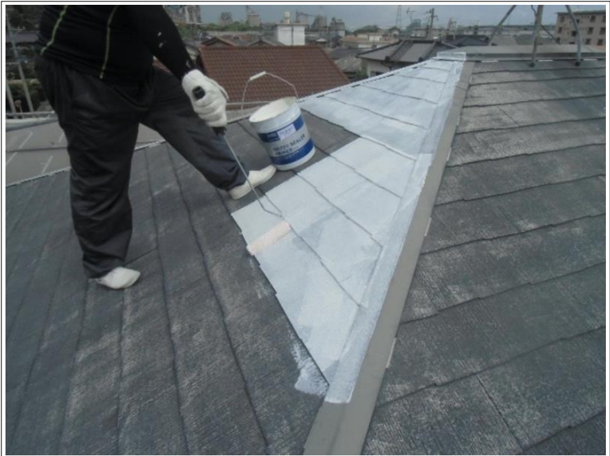
屋根塗装下塗り施工中