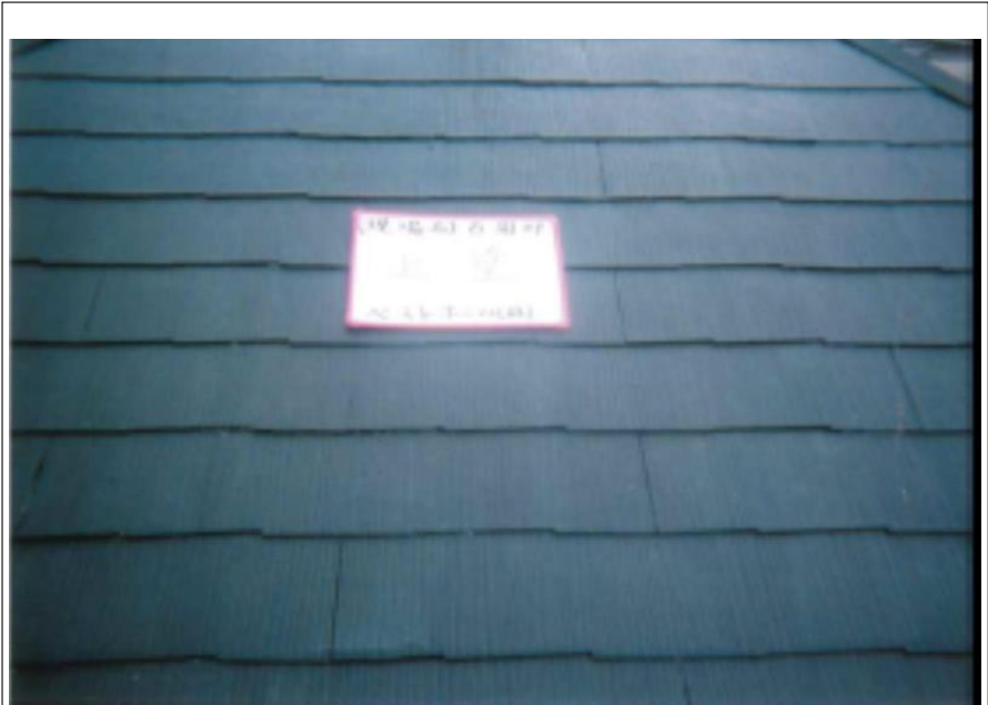
屋根塗装上塗り施工完了