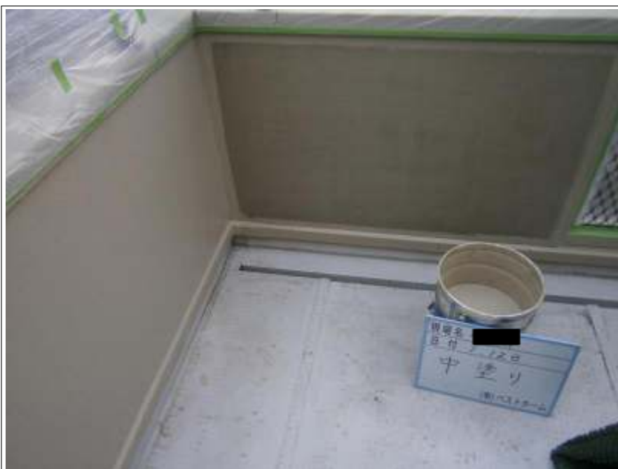
ベランダ防水中塗り施工中