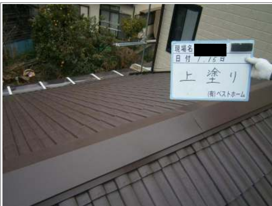
屋根上塗り施工完了