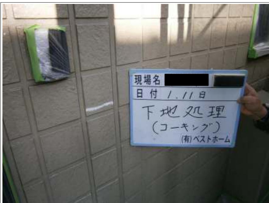
下地処理コーキング施工中