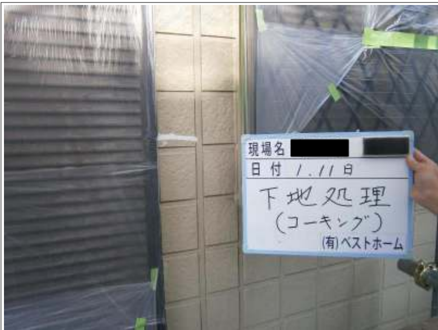
下地処理コーキング施工中