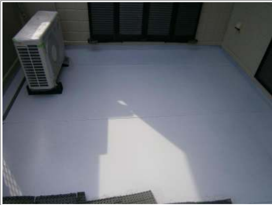
ベランダ防水上塗り施工完了