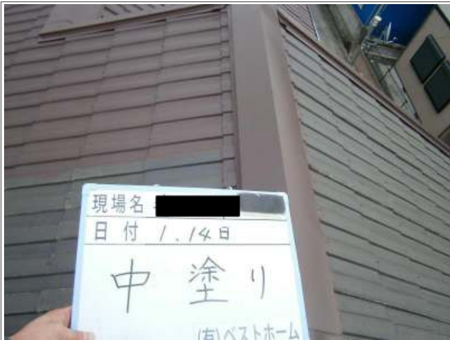
屋根中塗り施工中