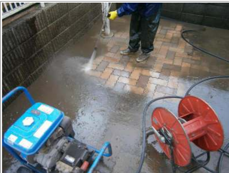
玄関前タイル高圧洗浄施工状況