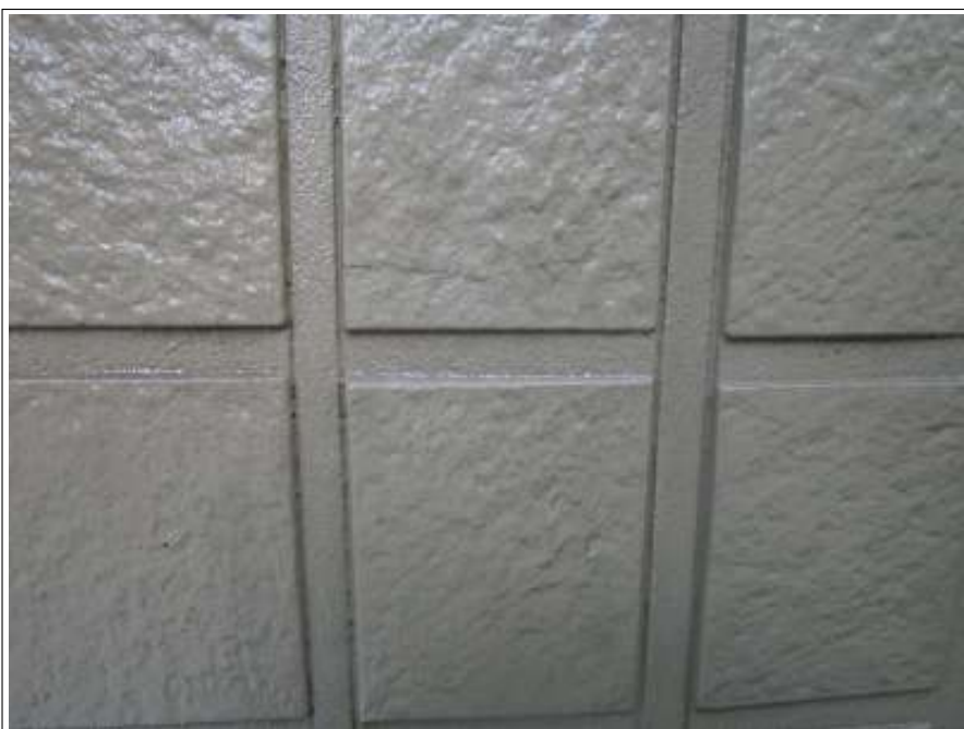
下地処理コーキング施工前