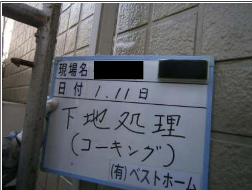
下地処理コーキング施工完了