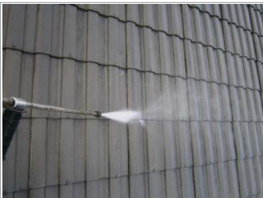
屋根高圧洗浄施工状況