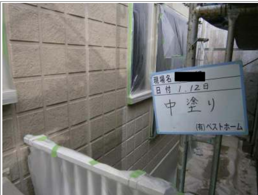
外壁中塗り施工中