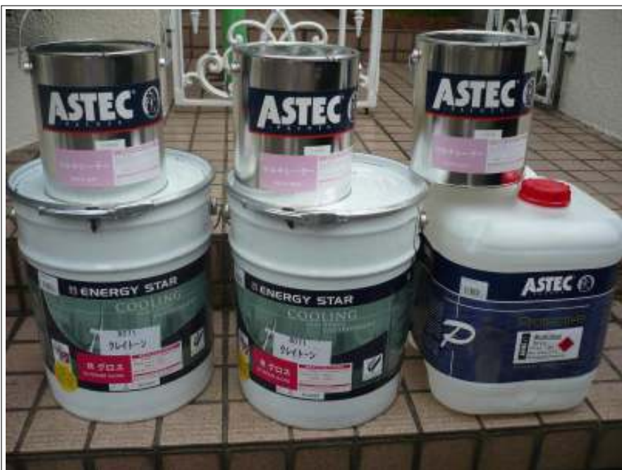
屋根中塗り・上塗り塗料缶