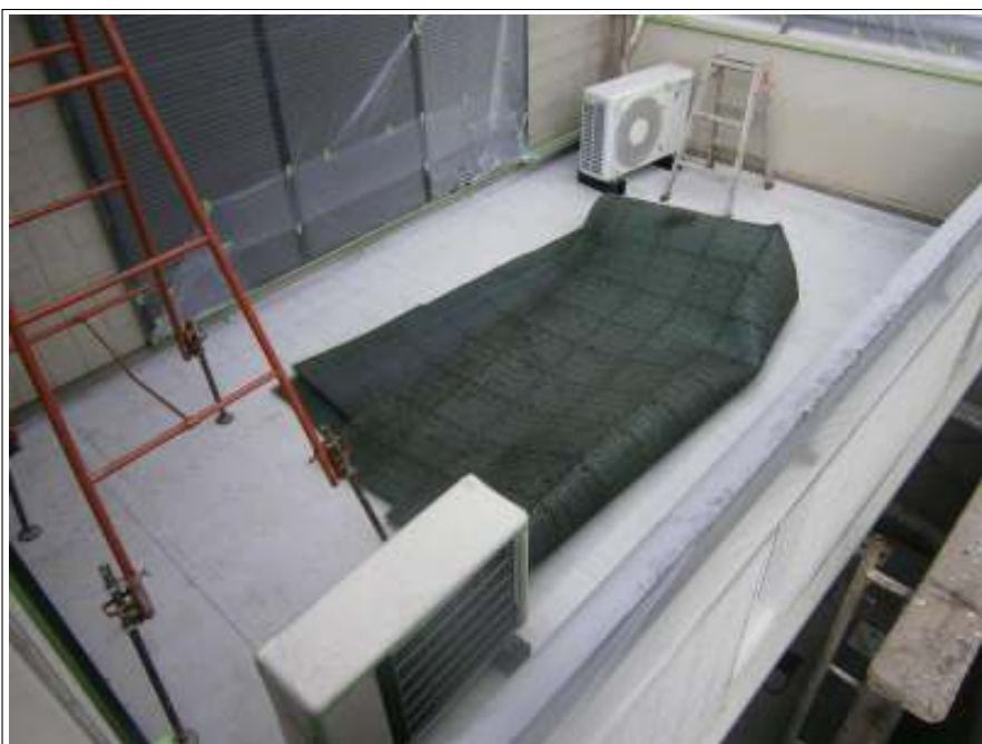
ベランダ高圧洗浄施工状況