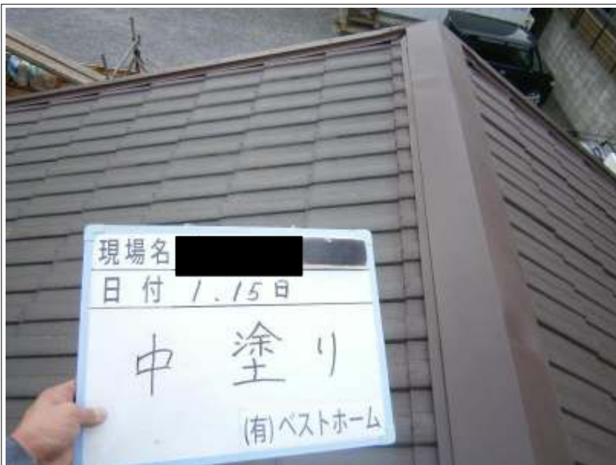
屋根中塗り施工完了