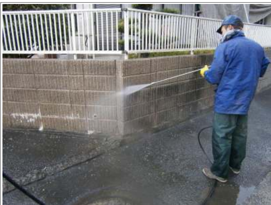
ブロック塀高圧洗浄施工状況