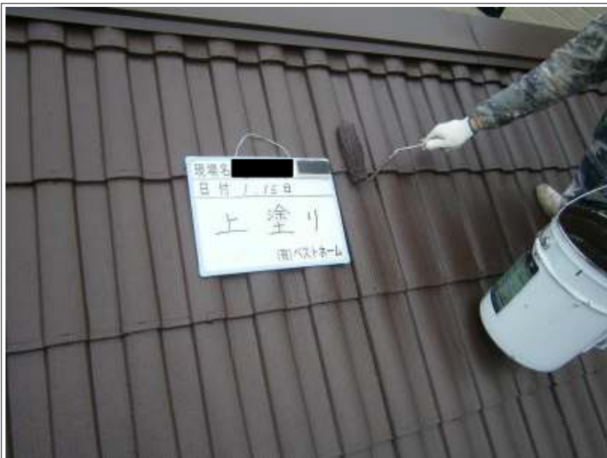
屋根上塗り施工中