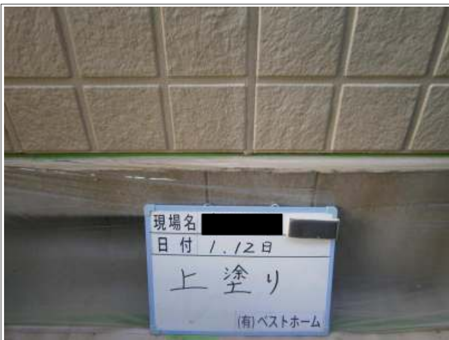
外壁上塗り施工中