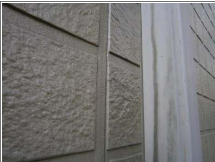
下地処理コーキング施工完了