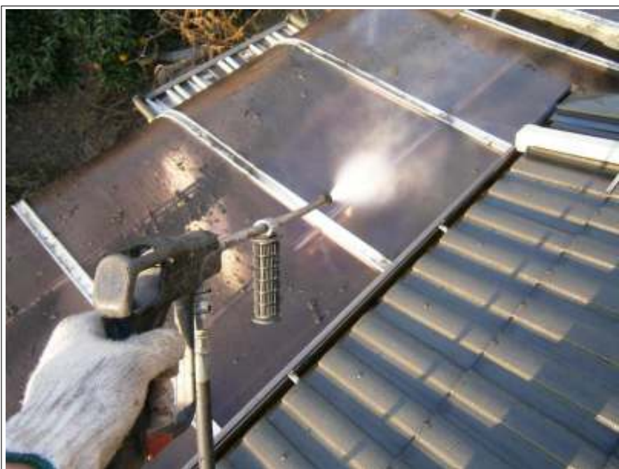
カーポート洗浄施工状況