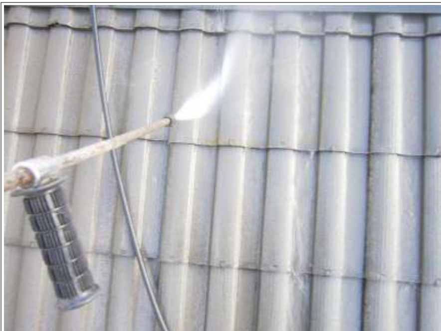
屋根高圧洗浄施工状況