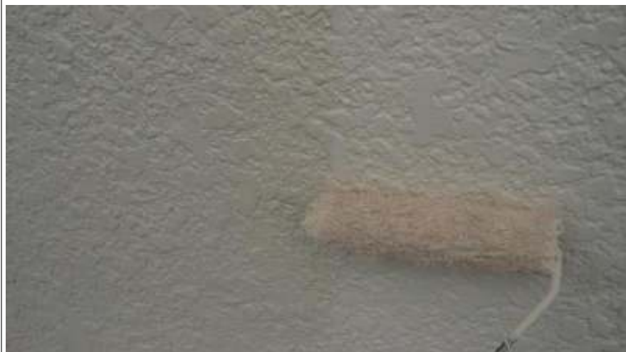
外壁上塗り塗装施工中