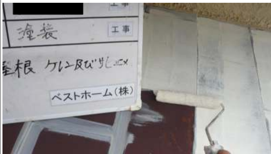
玄関屋根 ケレン及びサビ塗め