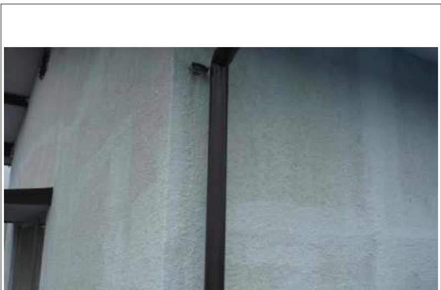
外壁下塗り塗装施工後