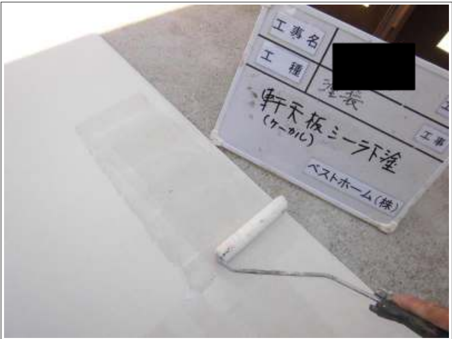
軒天板下塗り塗装施工中