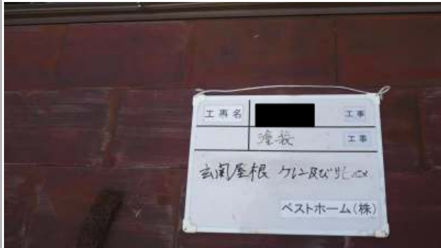
玄関屋根 ケレン及びサビ塗め前