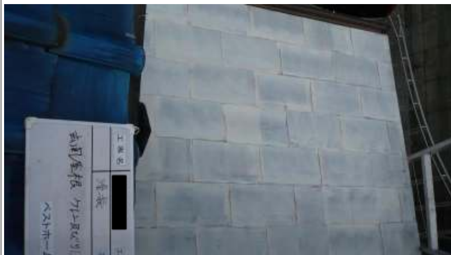
玄関屋根 ケレン及びサビどめ