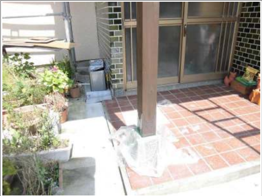
玄関部柱塗装施工 上塗り