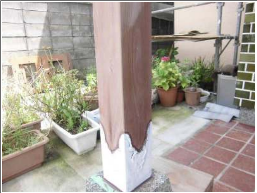
玄関部柱 塗装施工 サビ塗め