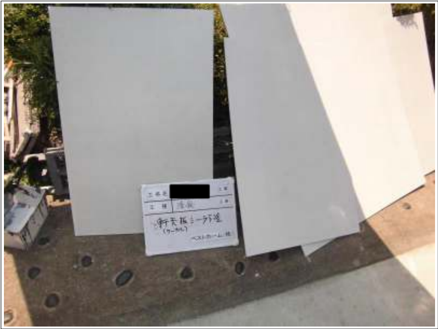
軒天板塗装施工後