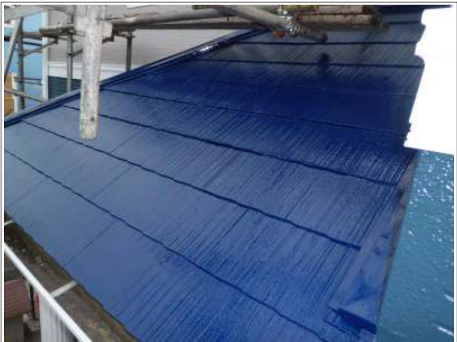
屋根上塗り施工中