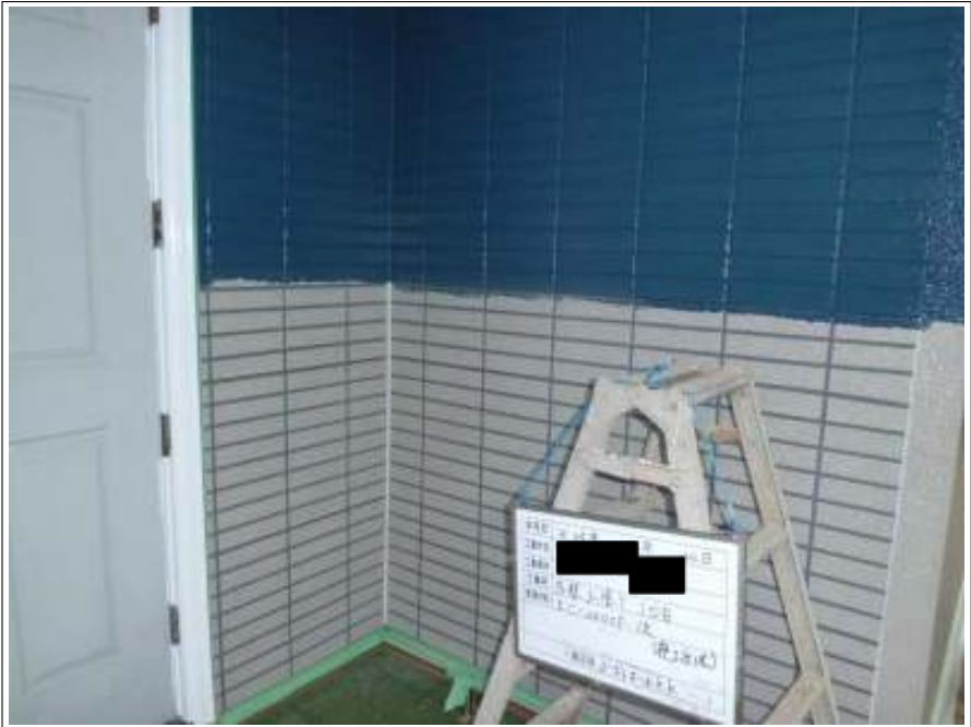
外壁上塗り1回目施工中