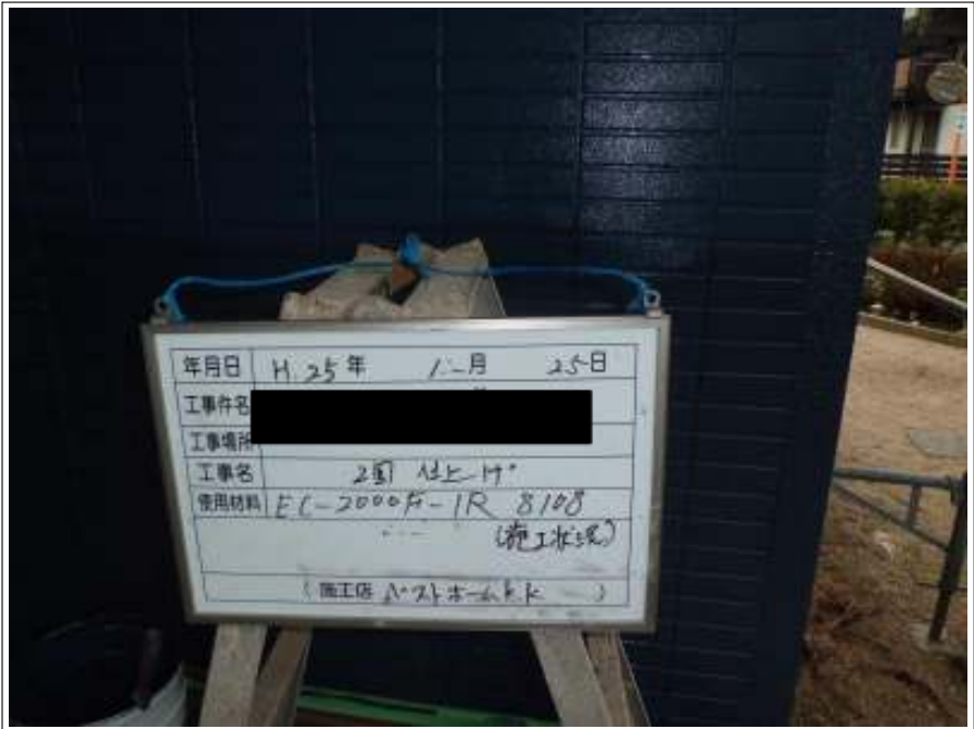
外壁上塗り2回目施工中