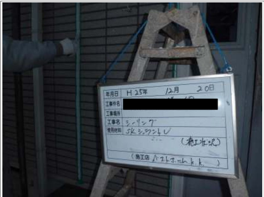
シーリング施工中