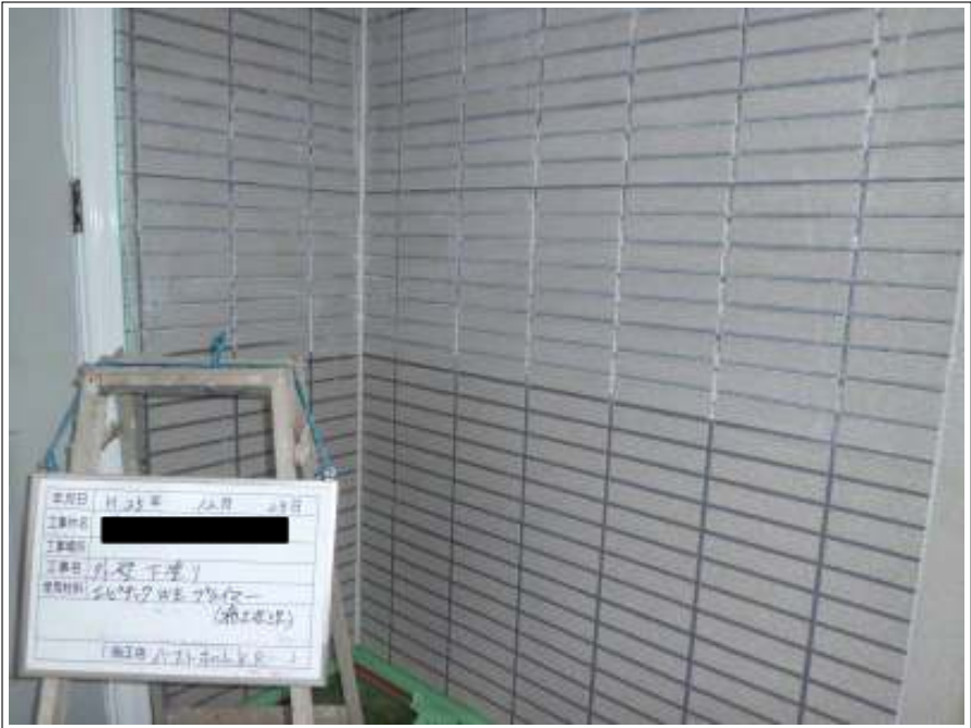
外壁下塗り施工中