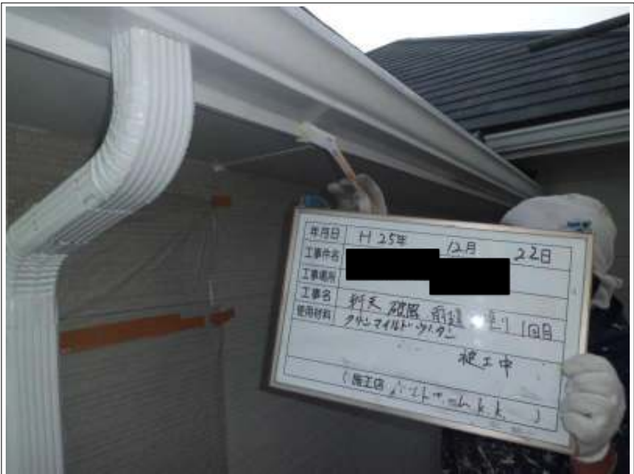
軒天・破風・雨樋上塗り施工中