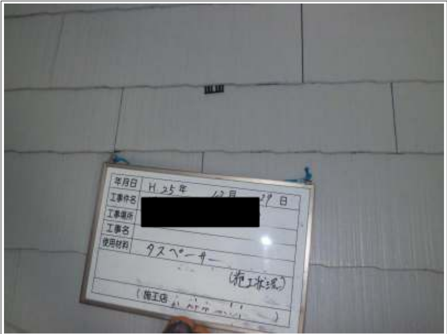
屋根タスペーサー取付施工中