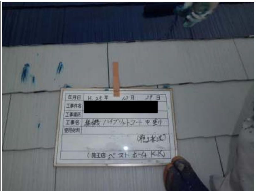
屋根中塗り施工中