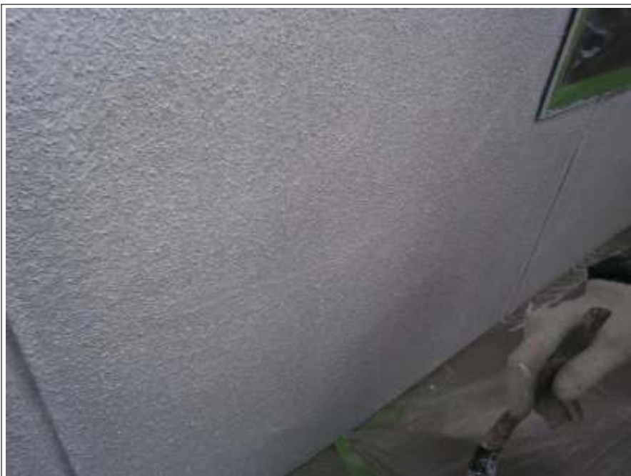
クラック補修施工完了