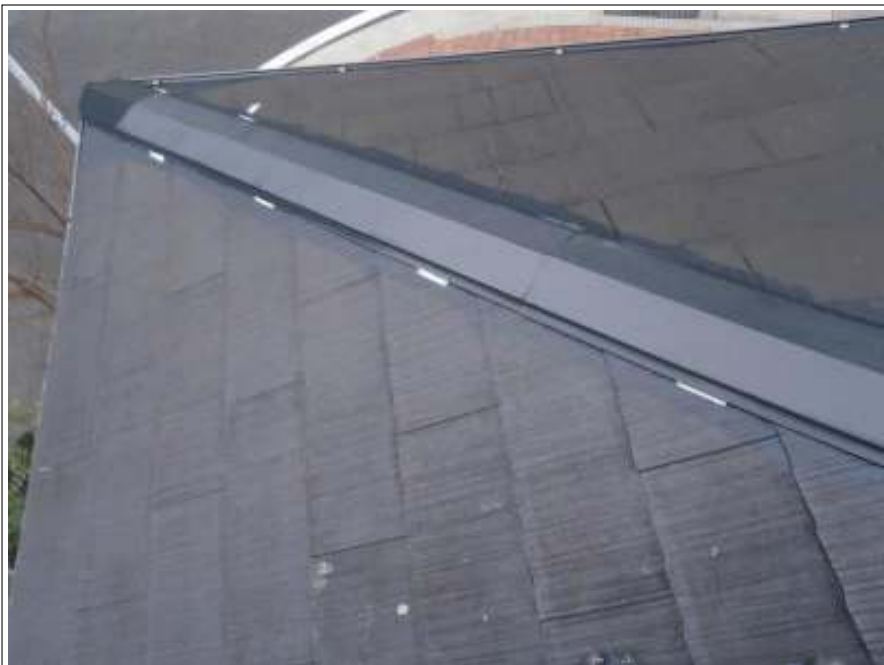
ラバー止め施工完了