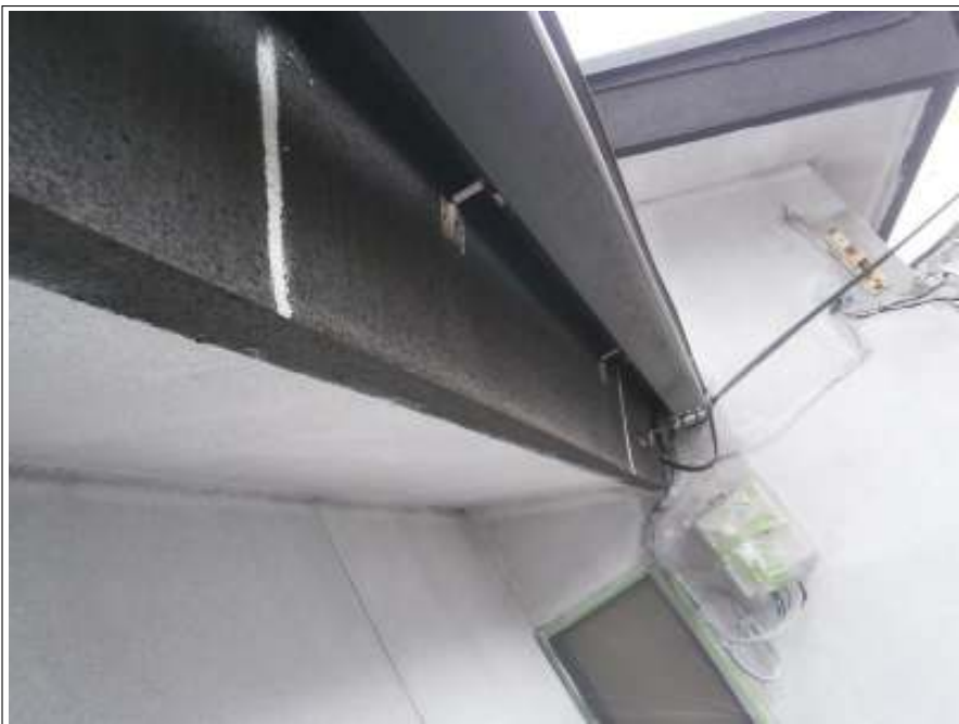
クラック補修施工完了