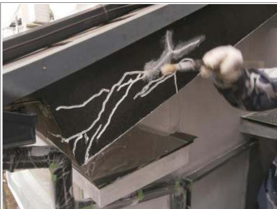
クラック補修施工状況