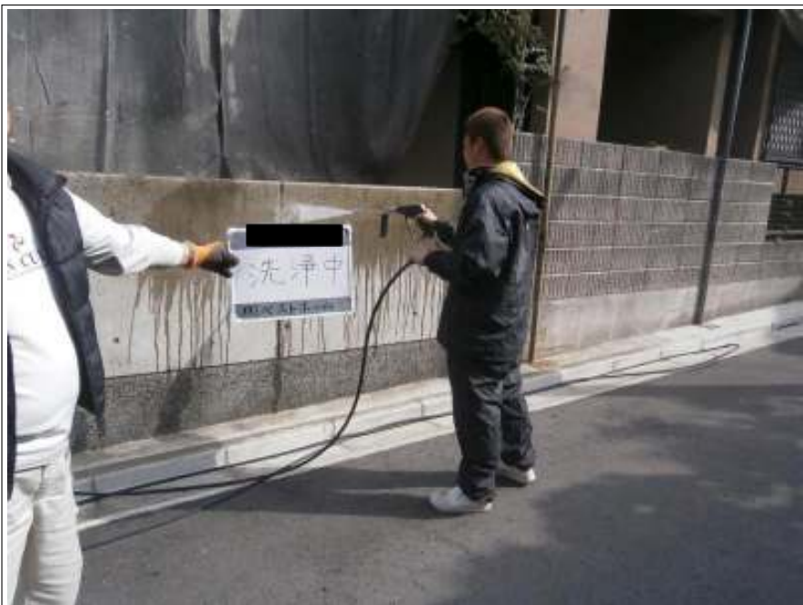
外塀高圧洗浄施工状況