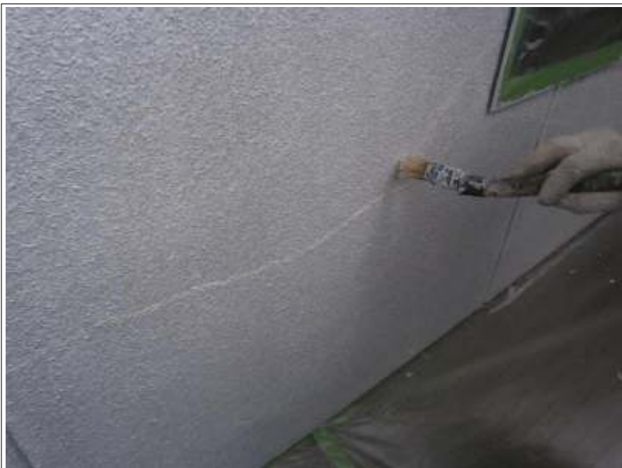
クラック補修施工状況