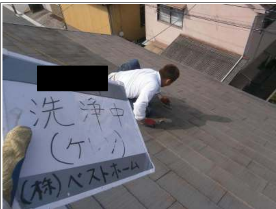
ケレン作業施工中