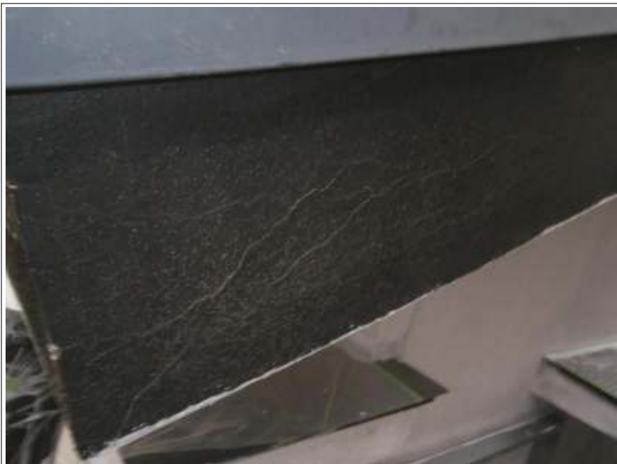
クラック補修施工前