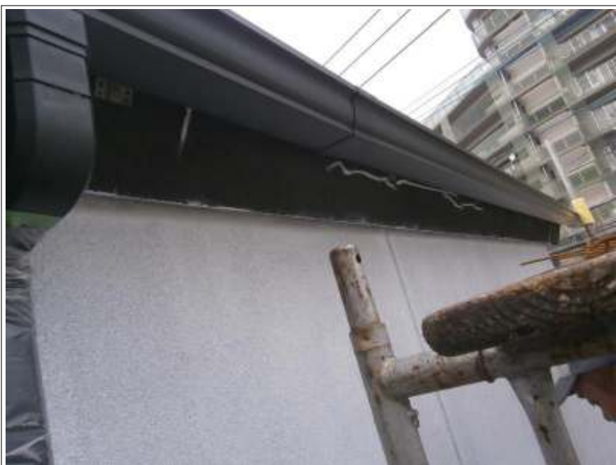
クラック補修施工完了