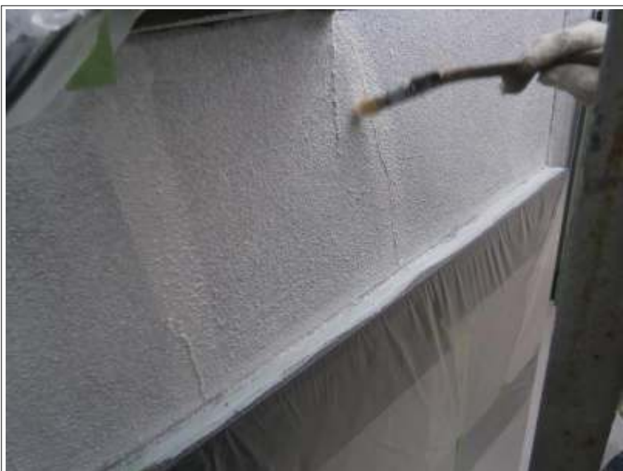
クラック補修施工中