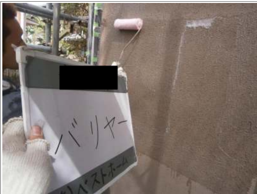
バリアー施工状況