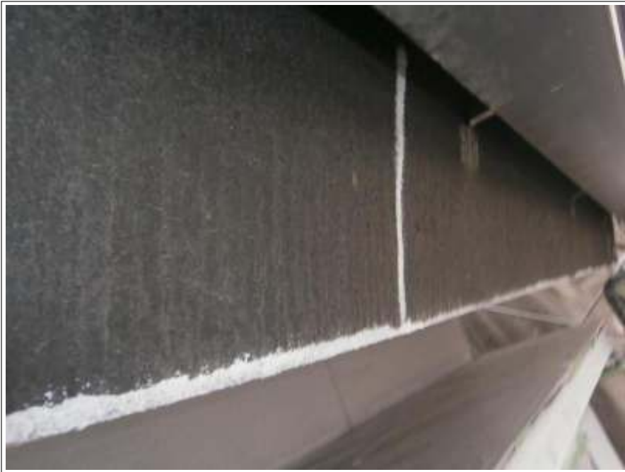
クラック補修施工完了