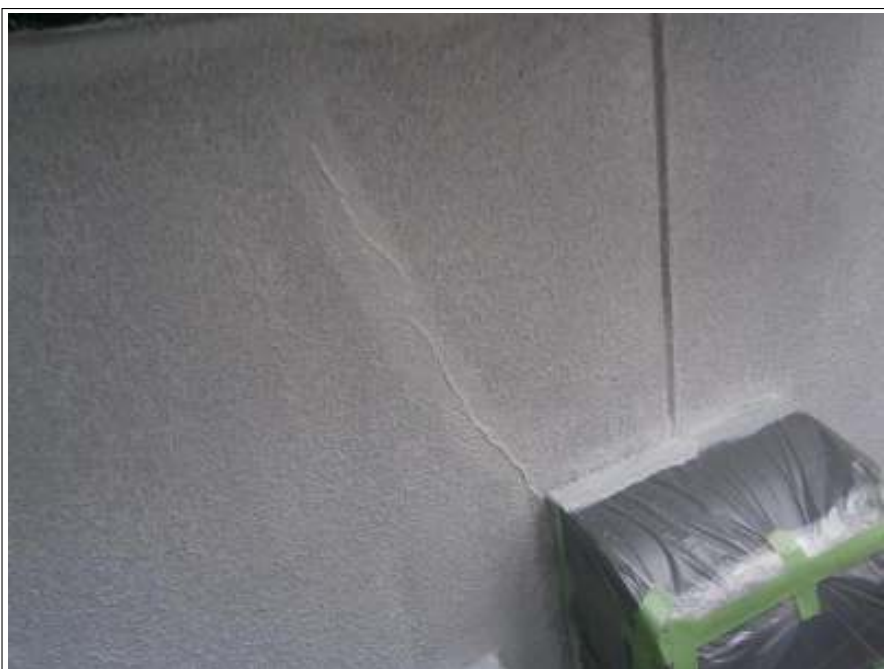
クラック補修施工状況