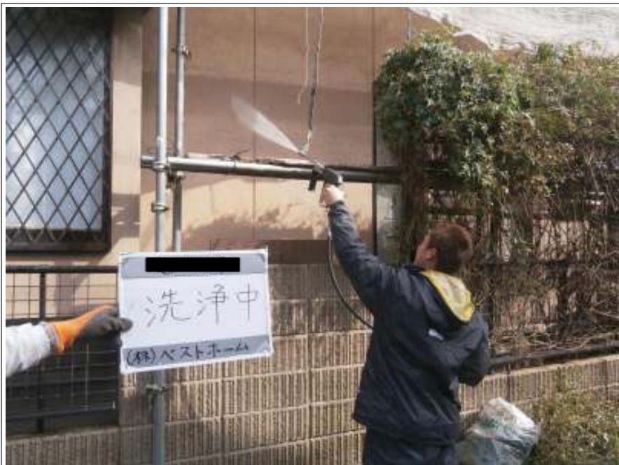
高圧洗浄施工状況