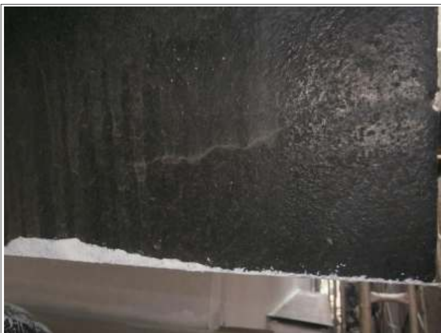
クラック補修施工前