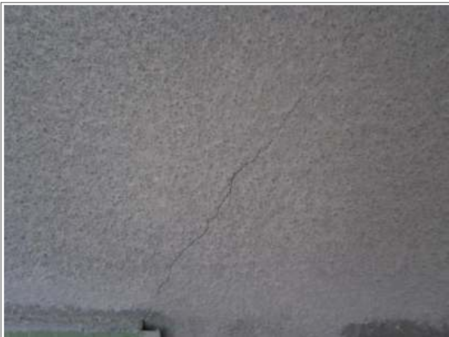
クラック補修施工前