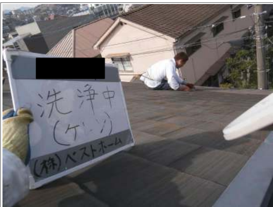
ケレン作業施工状況