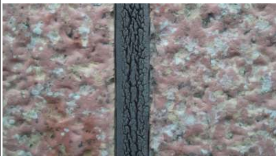
外壁パネル シーリング部