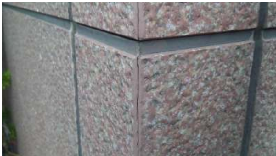
外壁パネル コーナー隙間