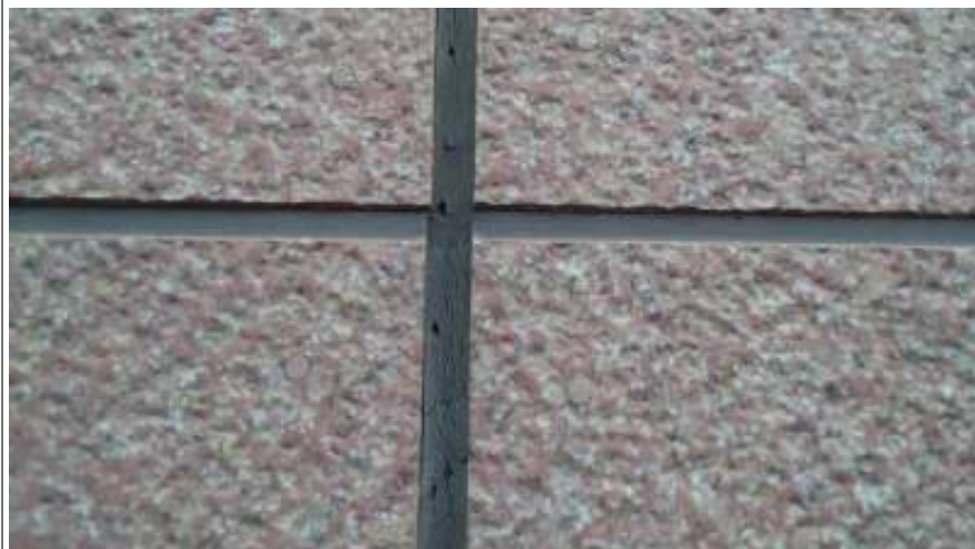
外壁パネル シーリング部