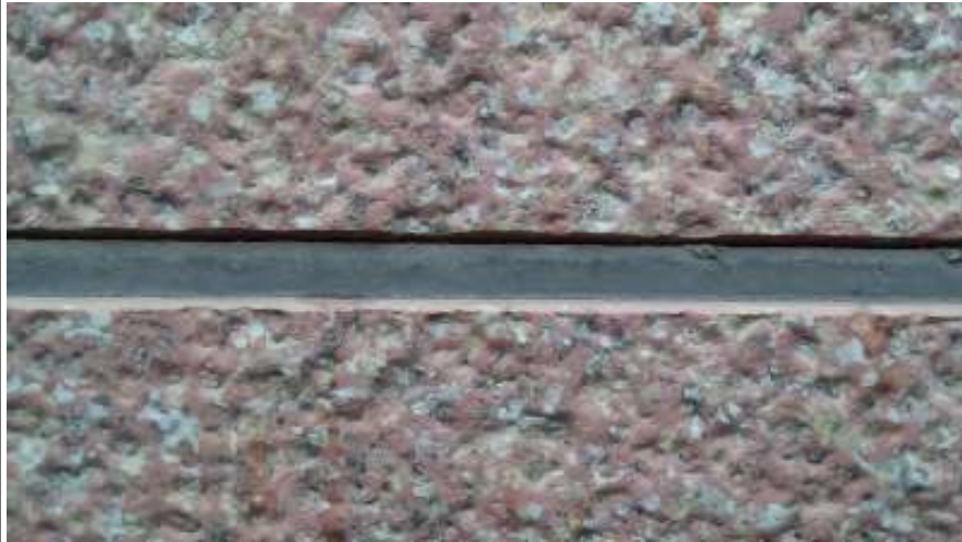
外壁パネル 反りによる隙間