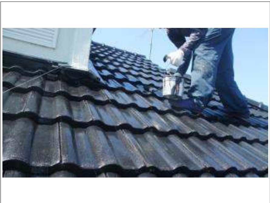
屋根塗装上塗り施工中