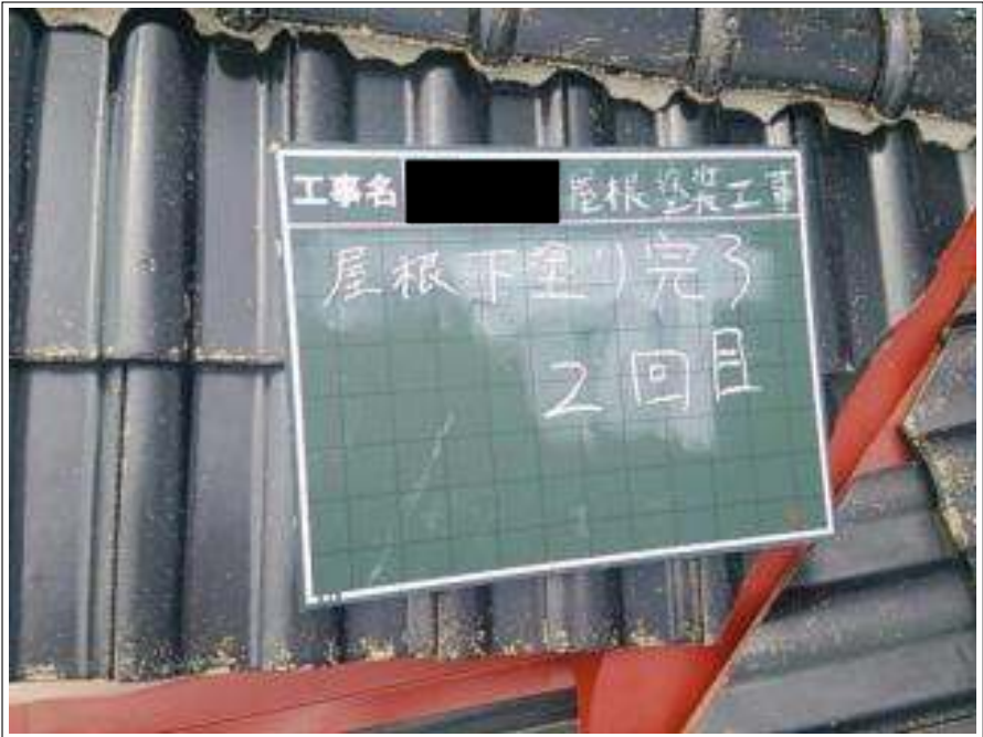
屋根塗装下塗り 2 回目施工完了