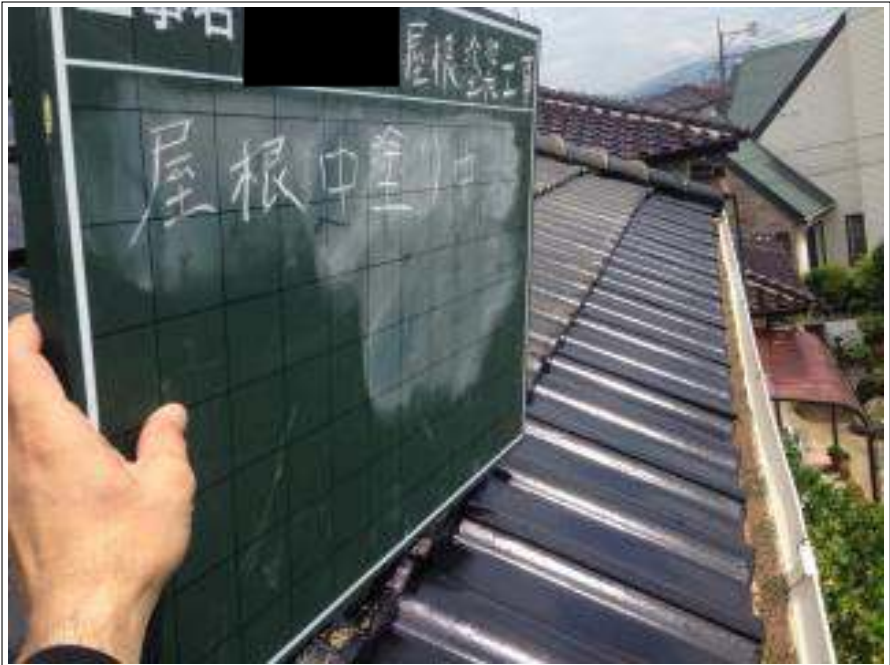
屋根塗装中塗り施工中