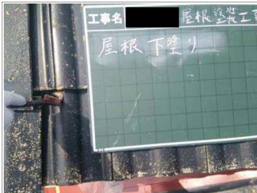
屋根塗装下塗り 1 回目施工中