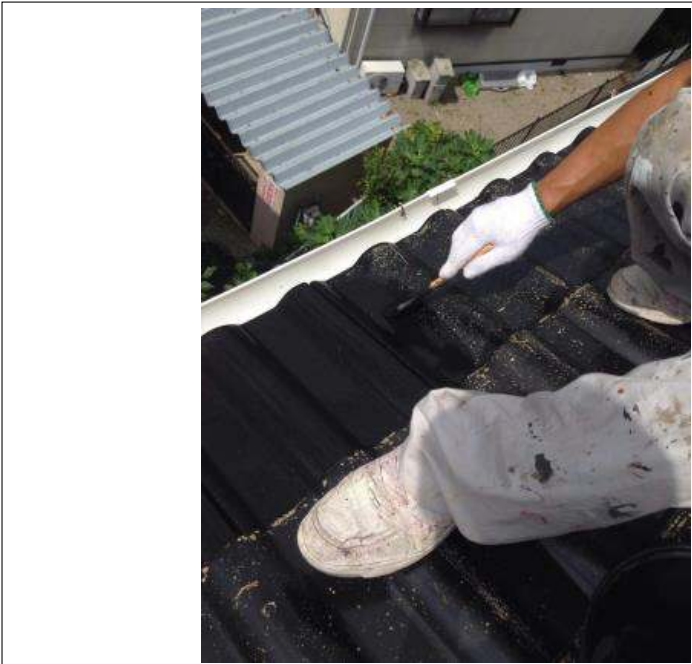
屋根塗装中塗り施工中