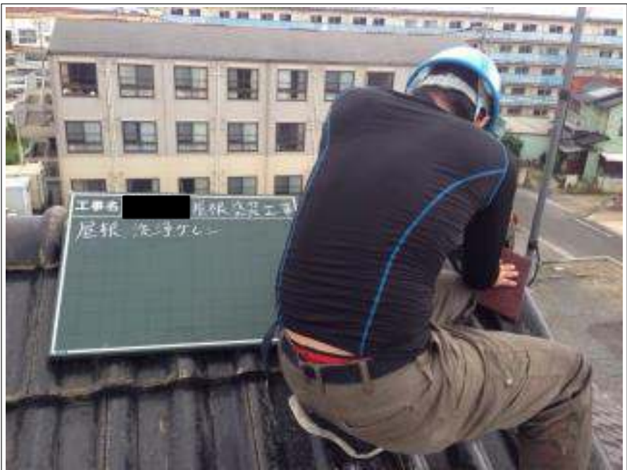
屋根ケレン施工中