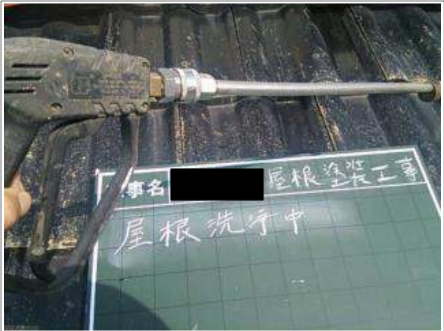
屋根高圧洗浄施工中