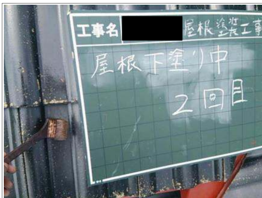
屋根下塗り 2 回目施工中