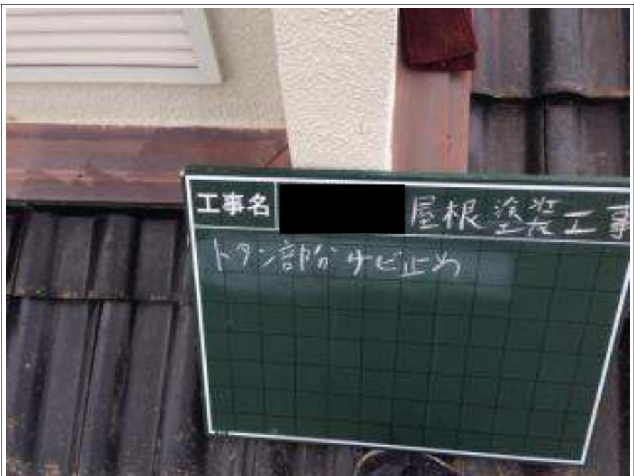
トタン部分サビ止め施工前