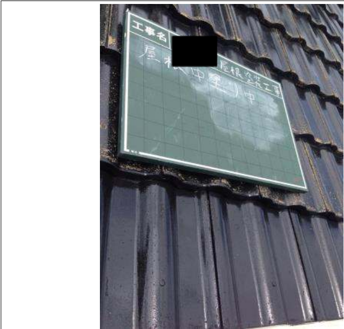
屋根塗装中塗り施工中