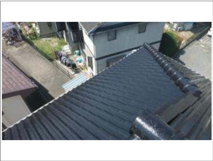
屋根塗装施工完了