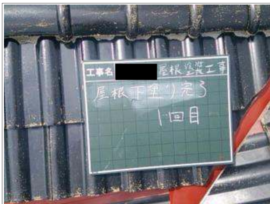
屋根塗装下塗り 1 回目施工完了