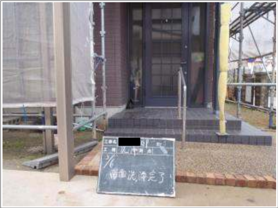
外壁南面高圧洗浄施工完了