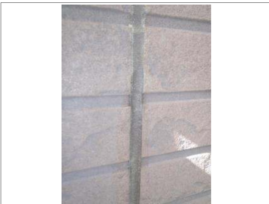
外壁コーキングプライマー塗布施工完了