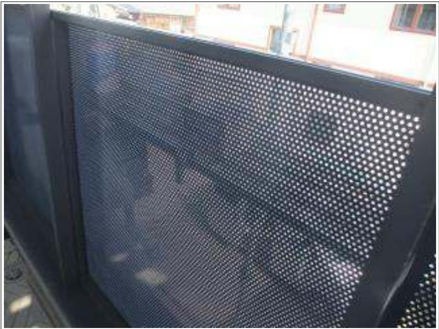
ベランダ鉄部塗装施工完了