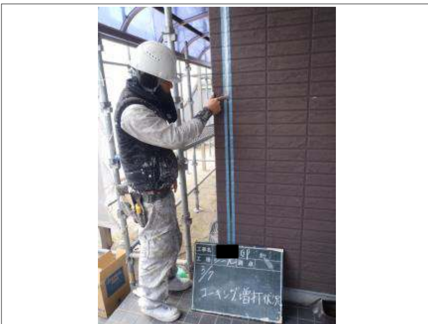
外壁コーキング打増施工中