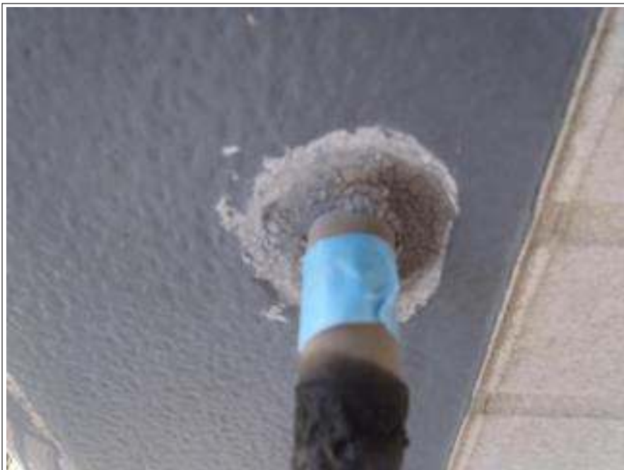
コーキング劣化部分