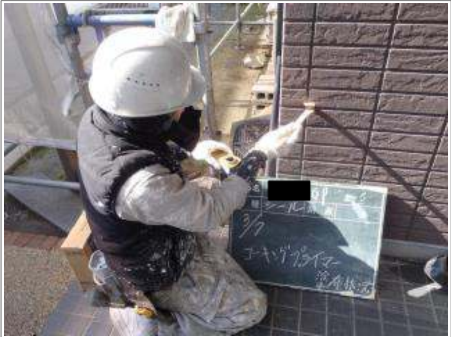
外壁コーキングプライマー塗布施工中