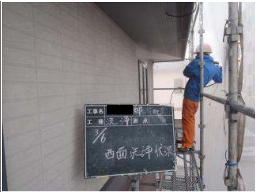
外壁西面高圧洗浄施工中