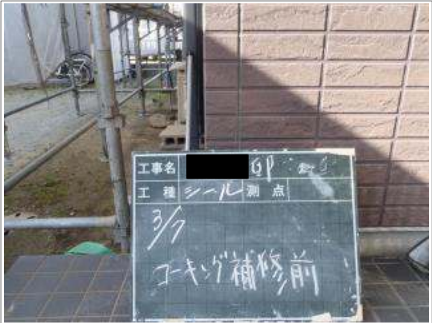
外壁コーキング補修施工前