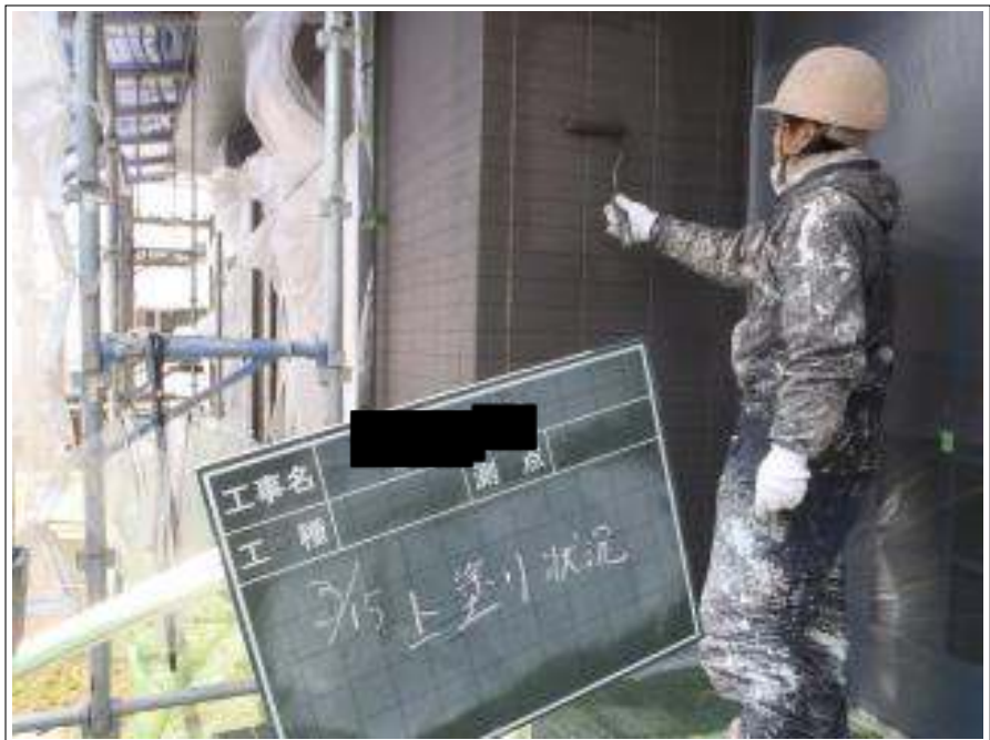
外壁塗装上塗り施工中