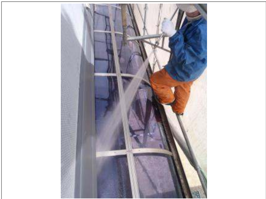
テラスアクリル板高圧洗浄施工中