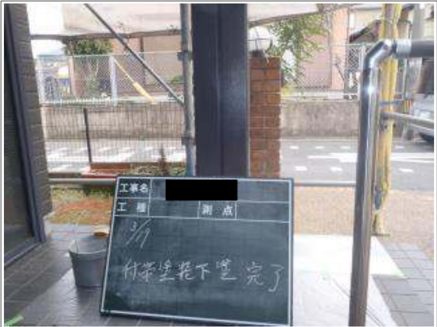
付帯塗装下塗り施工完了