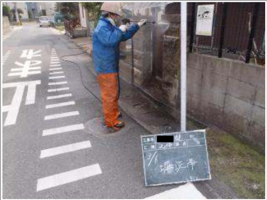
塀高圧洗淨施工中