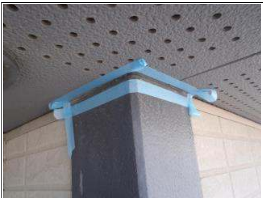
コーキング劣化部分