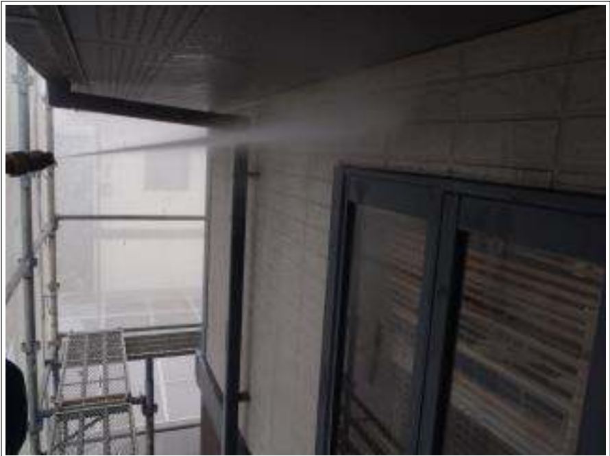
外壁東面高圧洗浄施工中