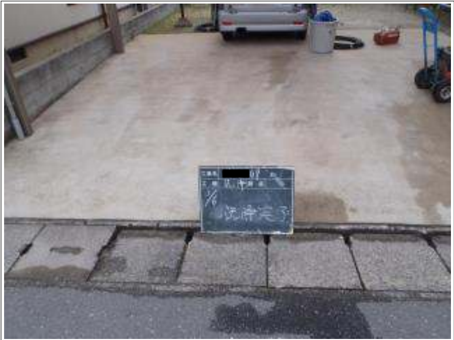
土間高圧洗淨施工完了