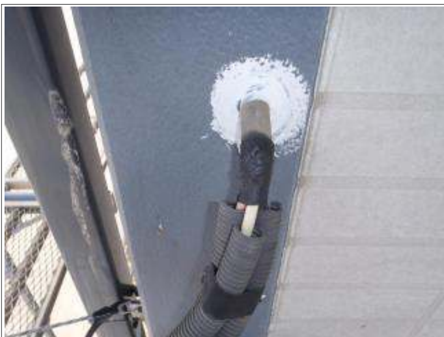
コーキング打増施工完了