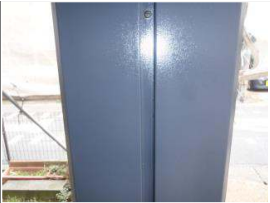
付帯塗装上塗り施工完了