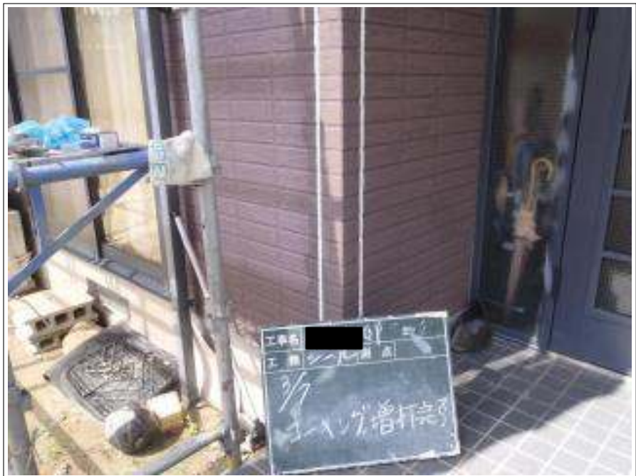
外壁コーキング増打施工完了