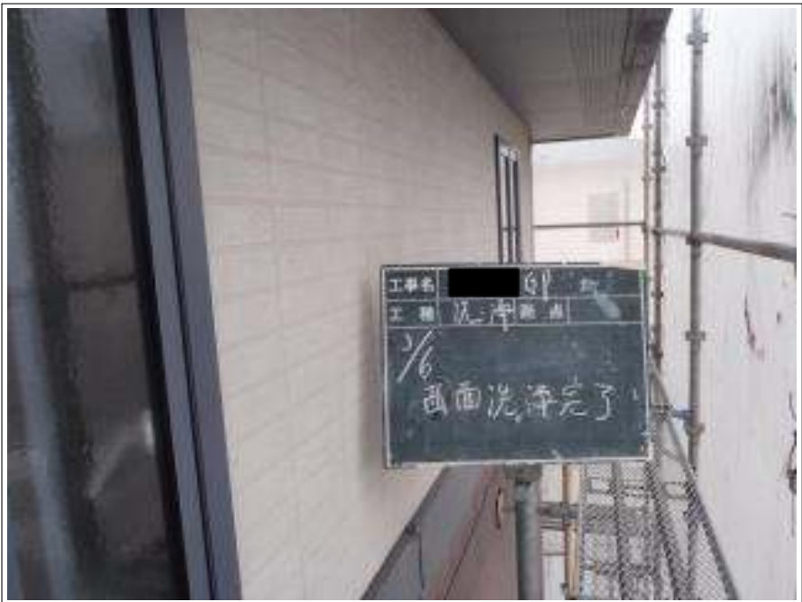
外壁西面高圧洗浄施工完了