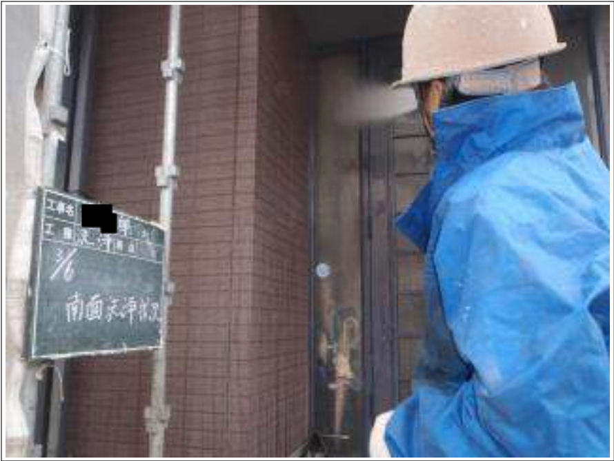
外壁南面高圧洗浄施工中