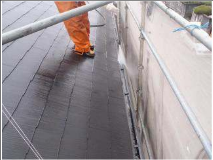
樋高圧洗浄施工中