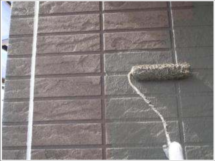
外壁塗装中塗り施工中