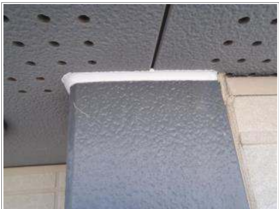
コーキング増打施工完了