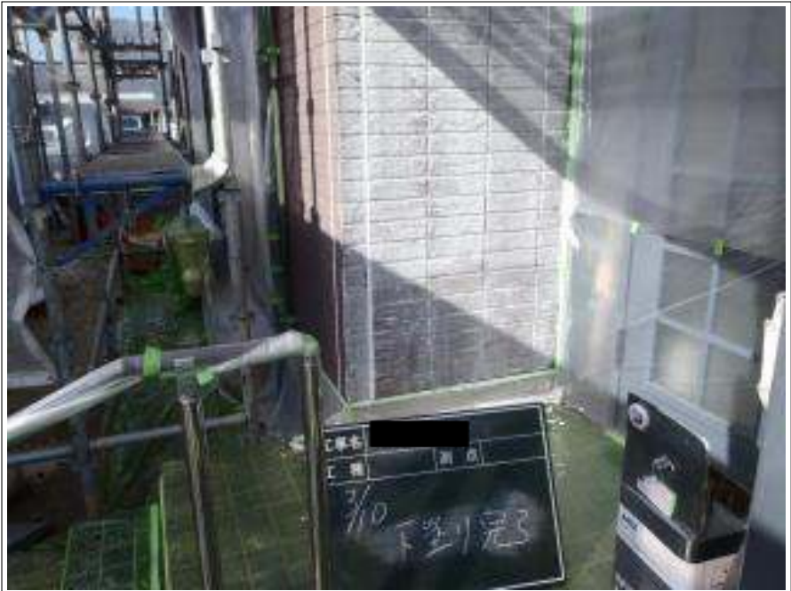
外壁塗装下塗り施工完了