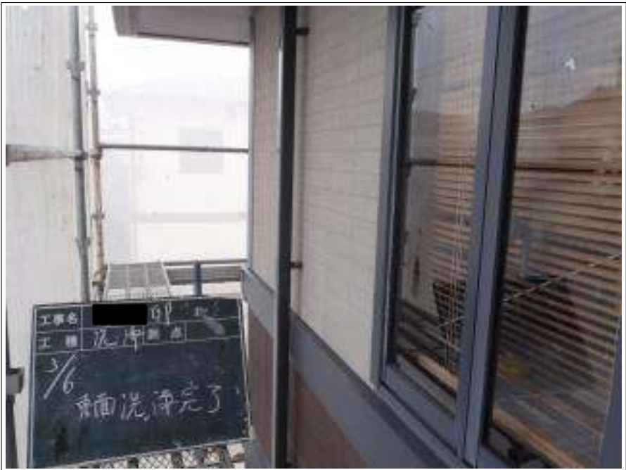
外壁東面高圧洗浄施工完了