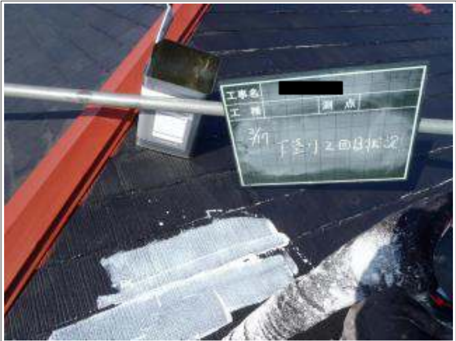
屋根塗装下塗り2回目施工中