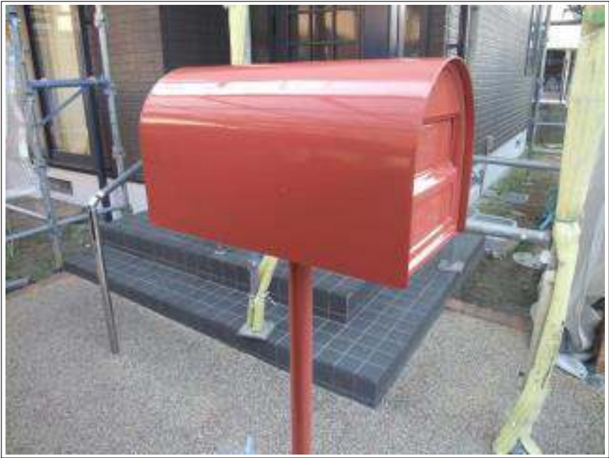
ポスト塗装施工完了