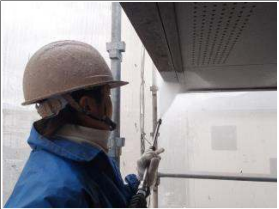
軒天高圧洗浄施工中