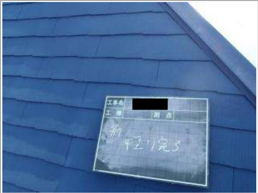
屋根塗装中塗り施工完了