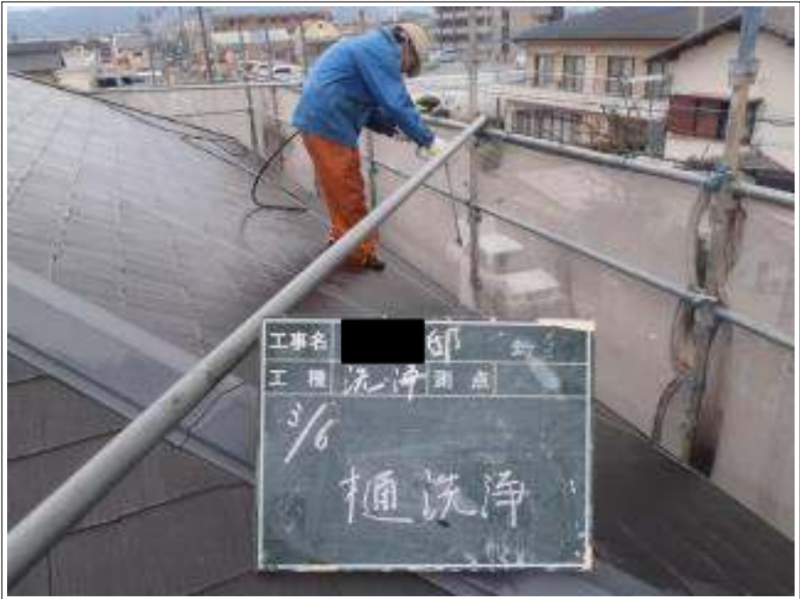
樋高圧洗浄施工中