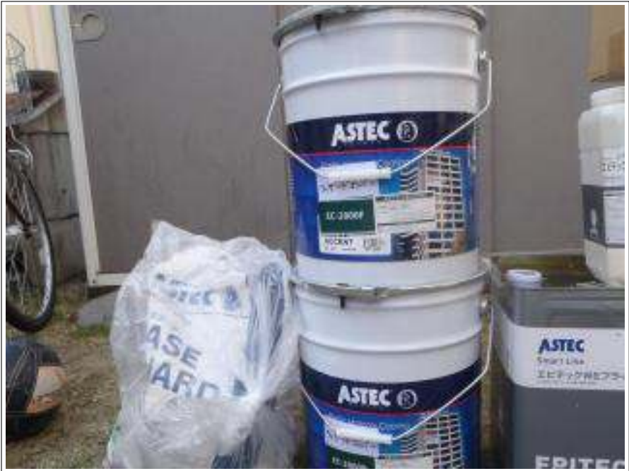
外壁上塗り使用材料