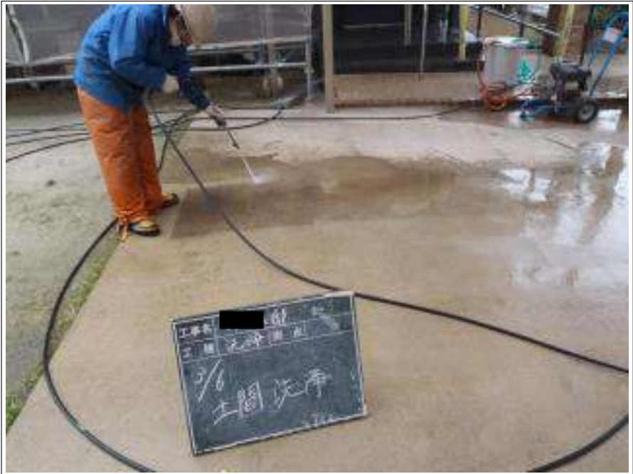
土間高圧洗淨施工中