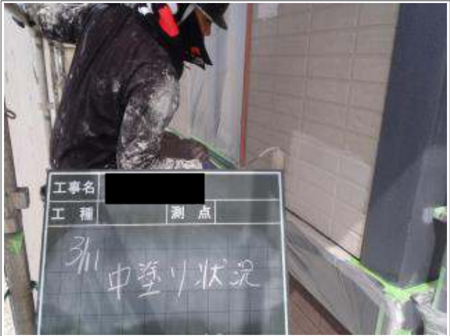
外壁塗装中塗り施工中