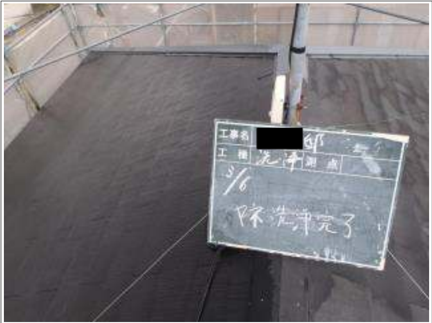
屋根高圧洗浄施工完了