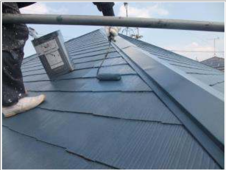
屋根塗装上塗り施工中