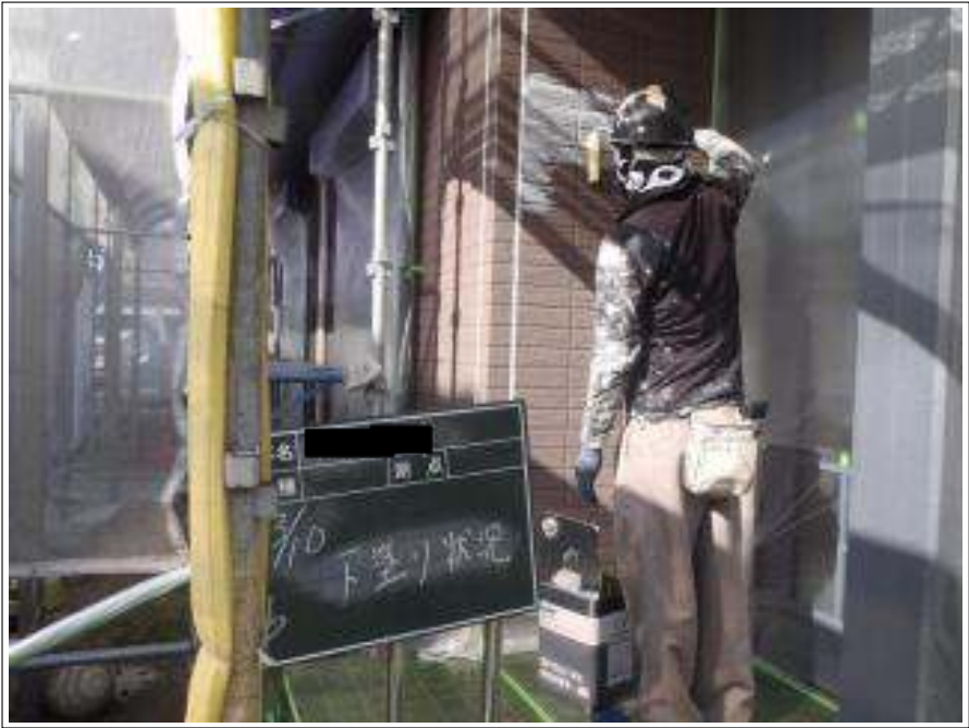
外壁塗装下塗り施工中