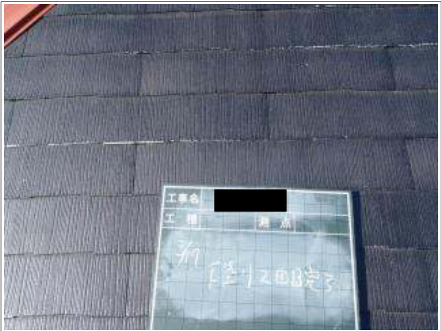
屋根塗装下塗り2回目施工完了