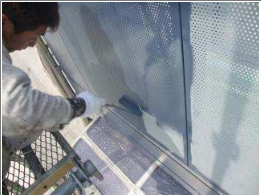
ベランダ鉄部塗装施工中