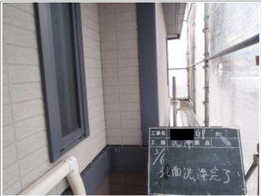
外壁北面高圧洗浄施工完了