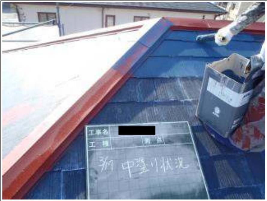
屋根塗装中塗り施工中