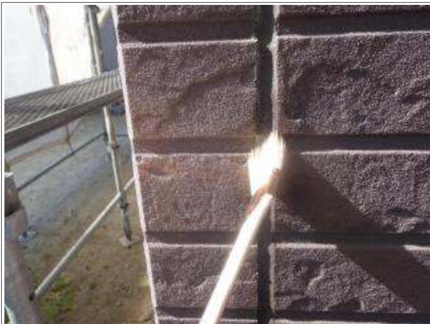
外壁コーキングプライマー塗布施工中