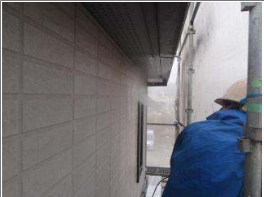
外壁北面高圧洗浄施工中