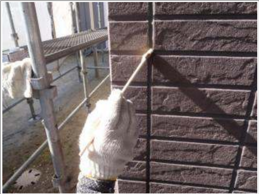
外壁コーキングプライマー塗布施工中