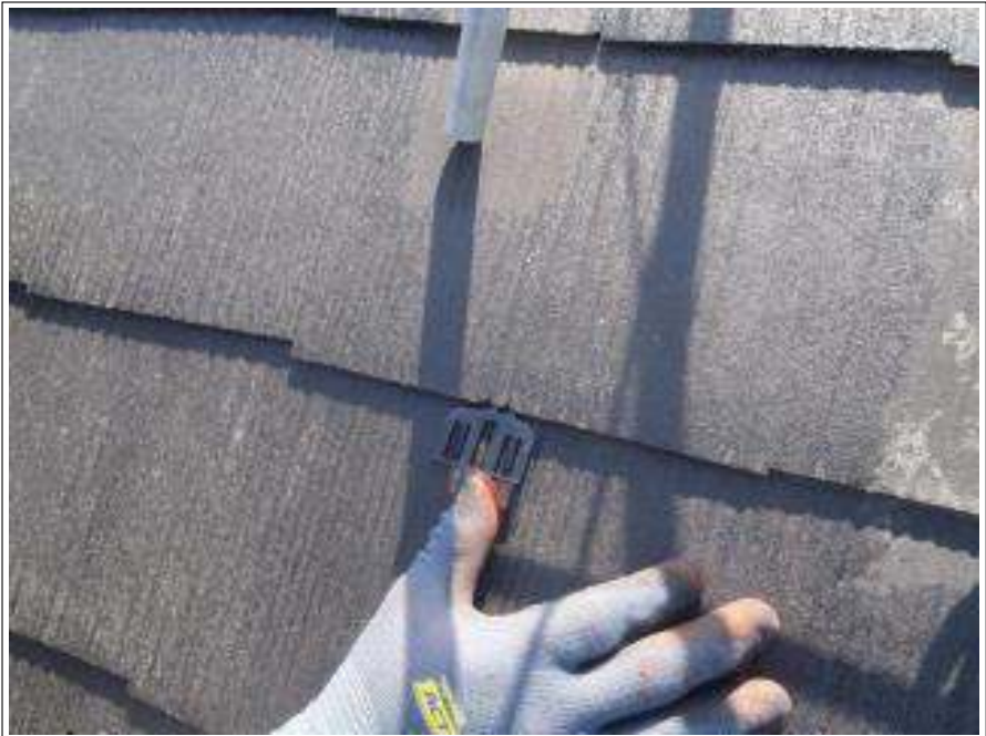
屋根タスペーサ施工中