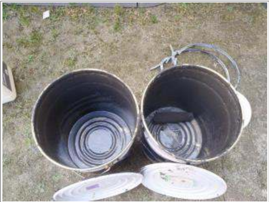
外壁上塗り使用材料空缶