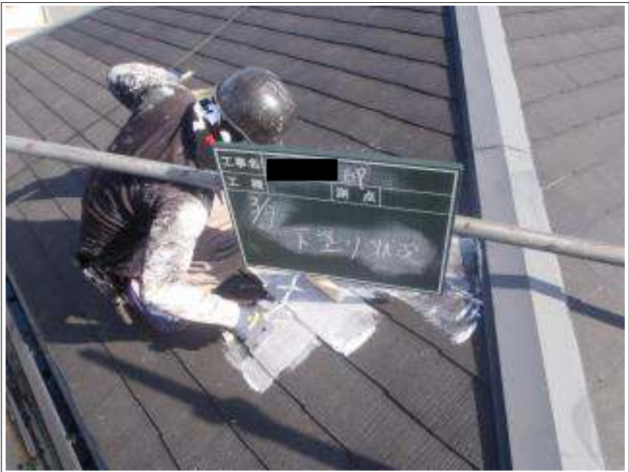
屋根塗装下塗り施工中