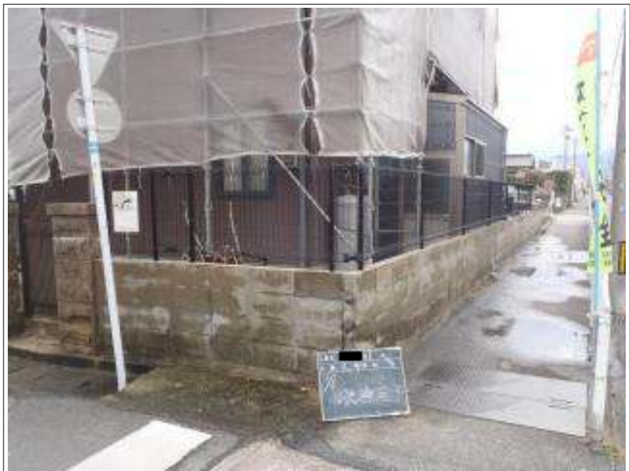
高圧洗浄施工完了