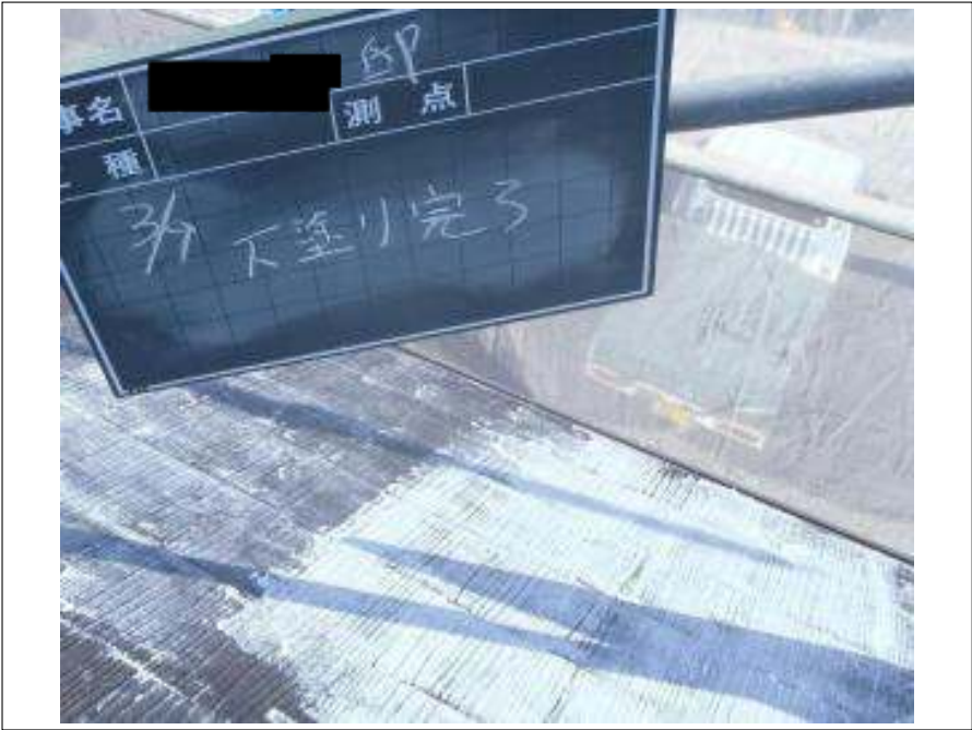
屋根塗装下塗り施工完了