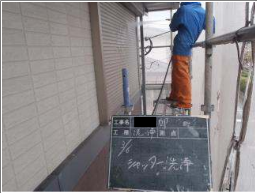
シャッター高圧洗浄施工中