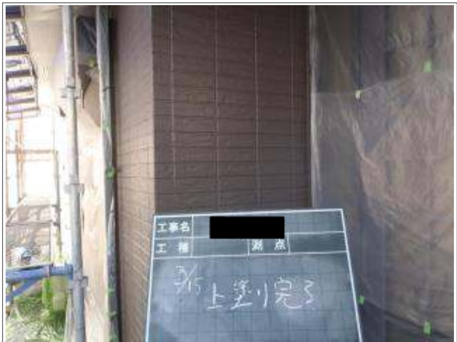
外壁塗装上塗り施工完了