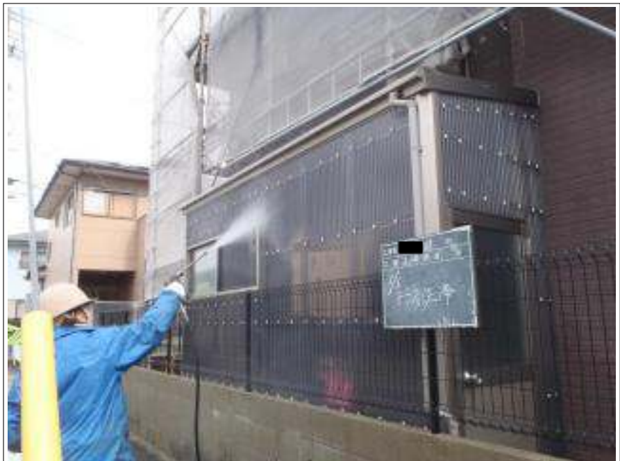
ストックヤード高圧洗浄施工中