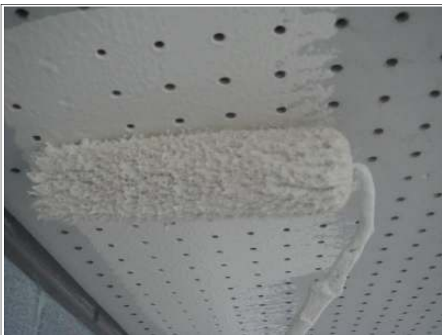
軒天塗装 1 回目施工中