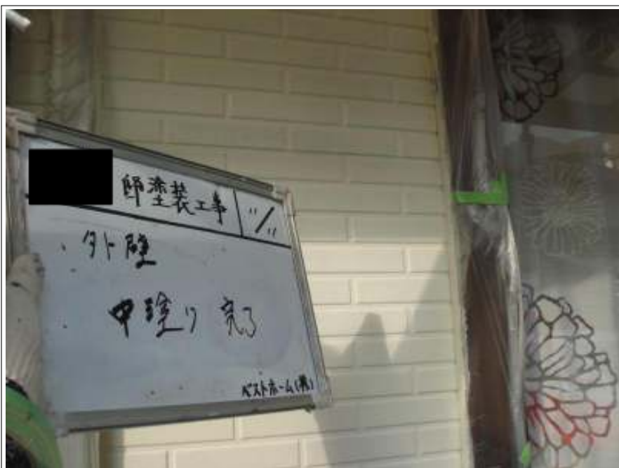
外壁塗装中塗り施工完了