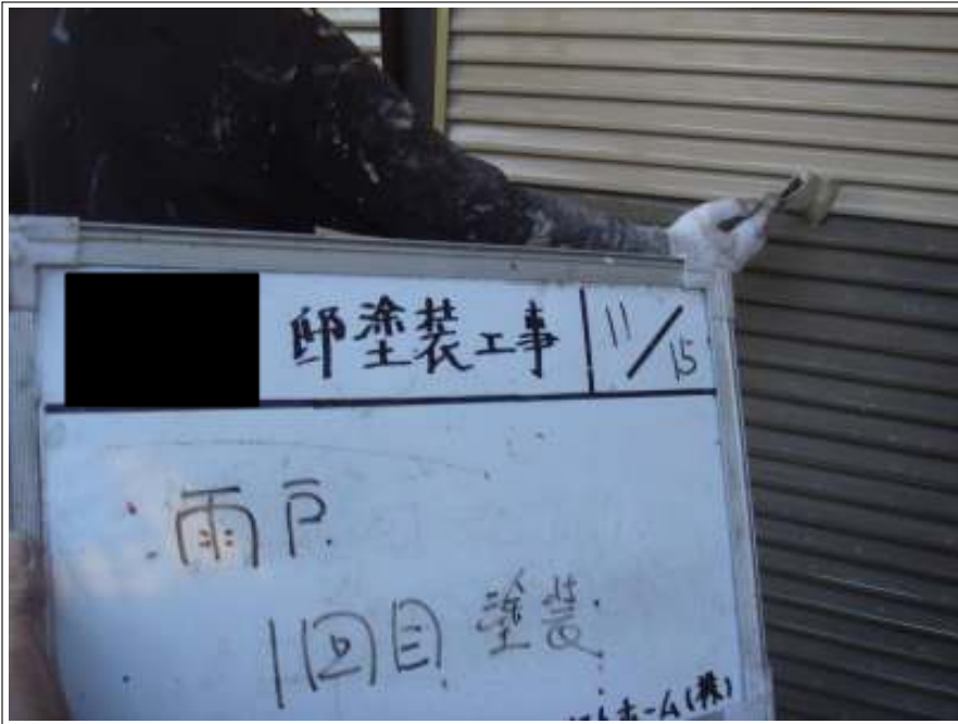
雨戸塗装 1 回目施工中