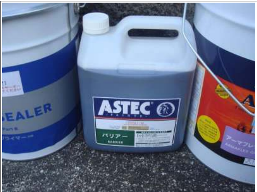
屋根・外壁使用材料