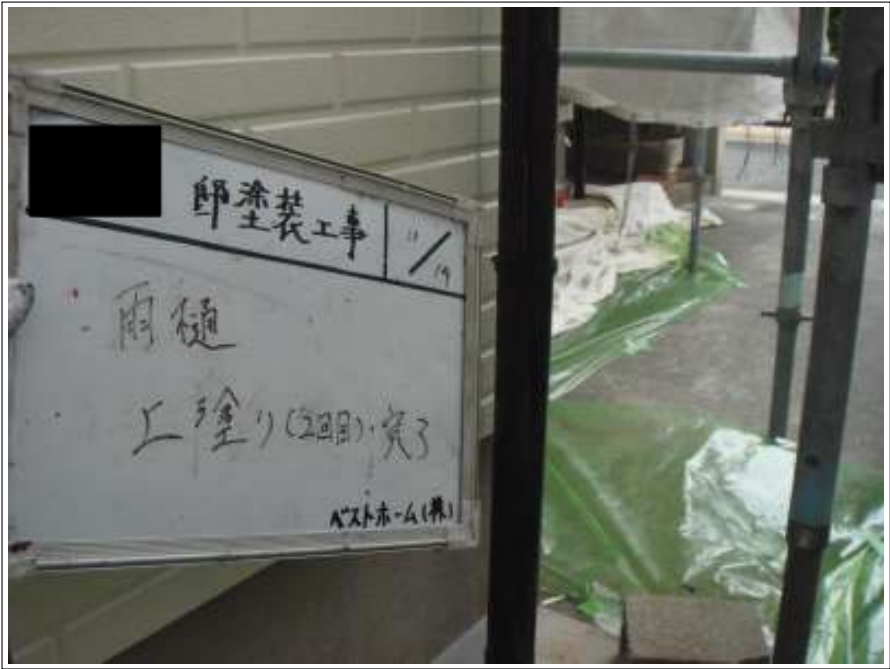
樋塗装 2回目施工完了