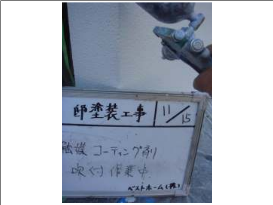
塀光触媒コーティング施工中