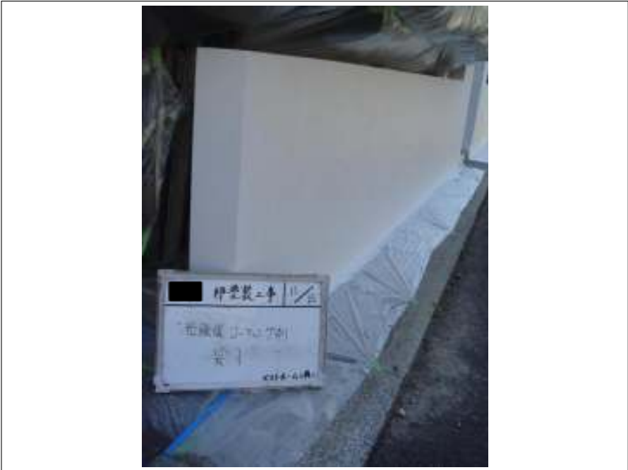
塀光触媒コーティング施工完了