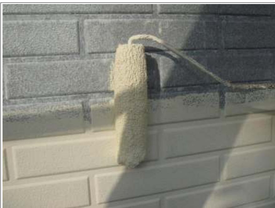
外壁塗装中塗り施工中