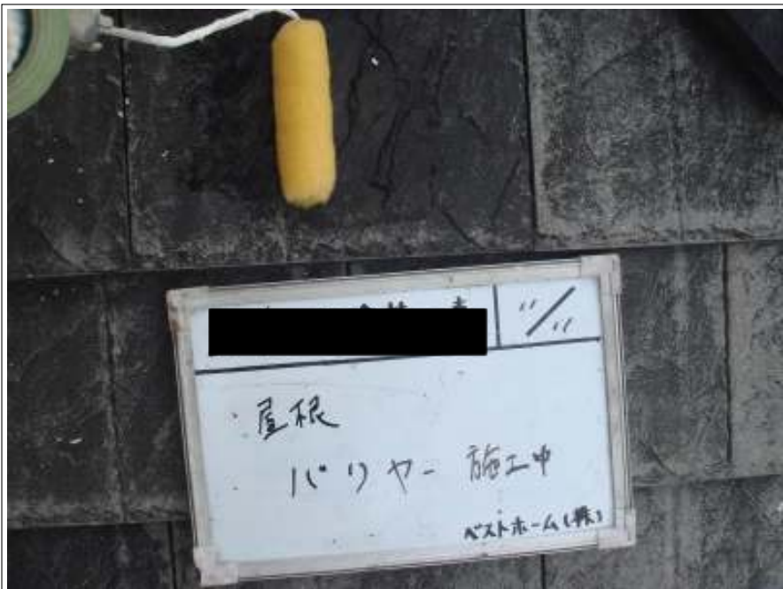
屋根バリヤー施工中