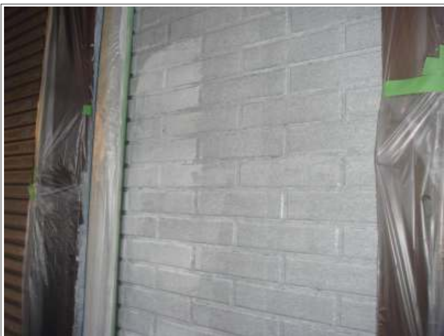
外壁塗装下塗り施工完了