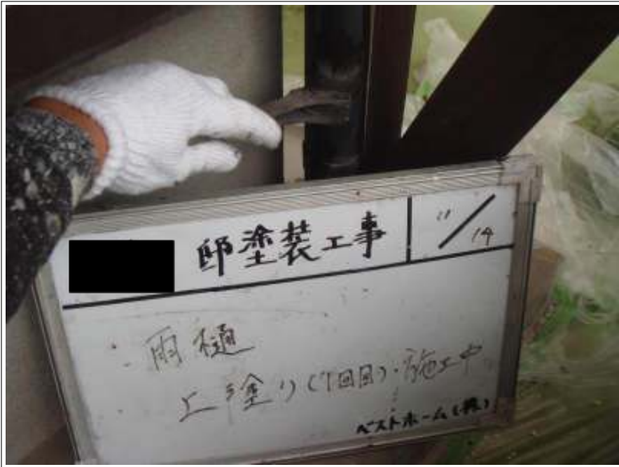
樋塗装 1回目施工中