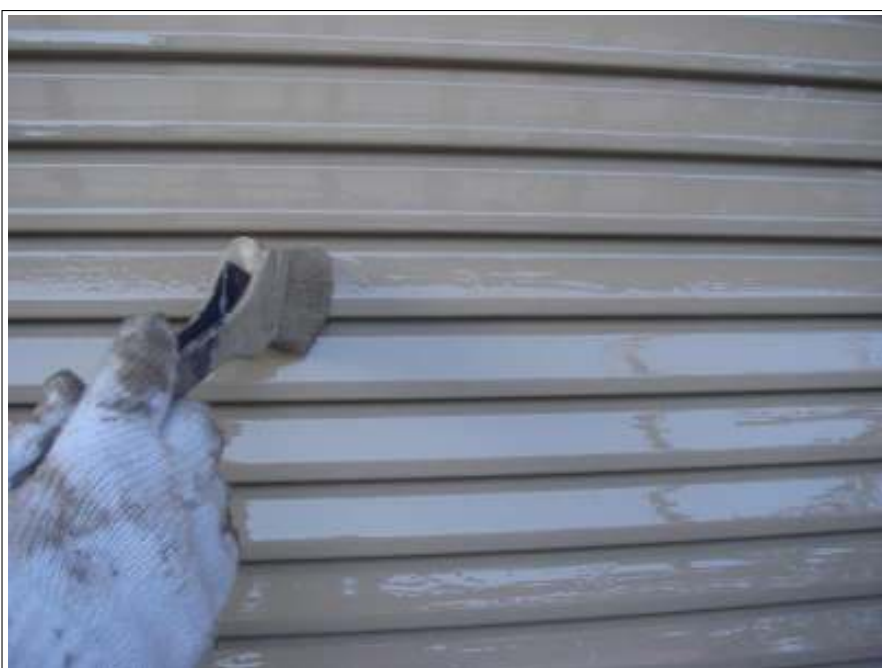
雨戸塗装 2回目施工中