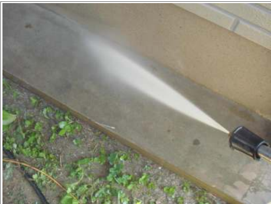
土間高圧洗浄施工中