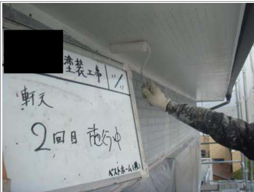
軒天塗装 2回目 施工中