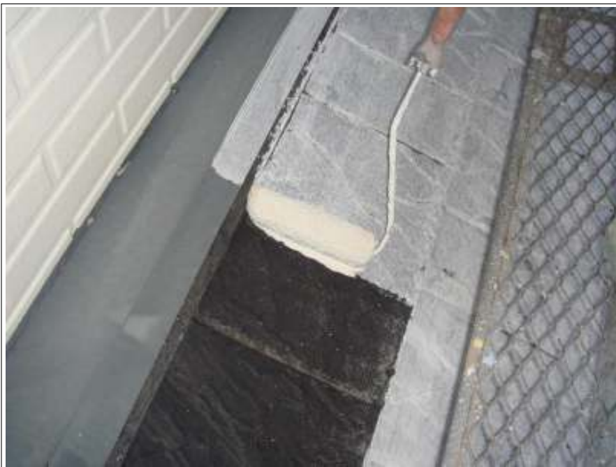
屋根塗装下塗り施工中