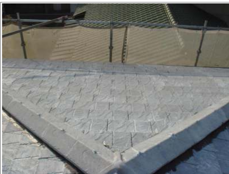
屋根バリヤー施工完了