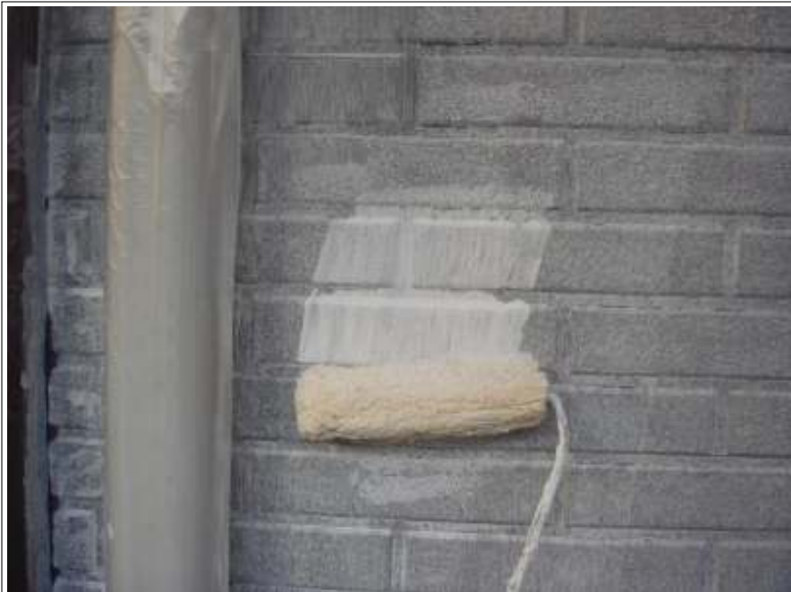
外壁塗装下塗り施工中