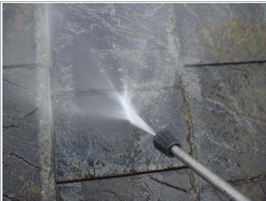
屋根高压洗净施工中