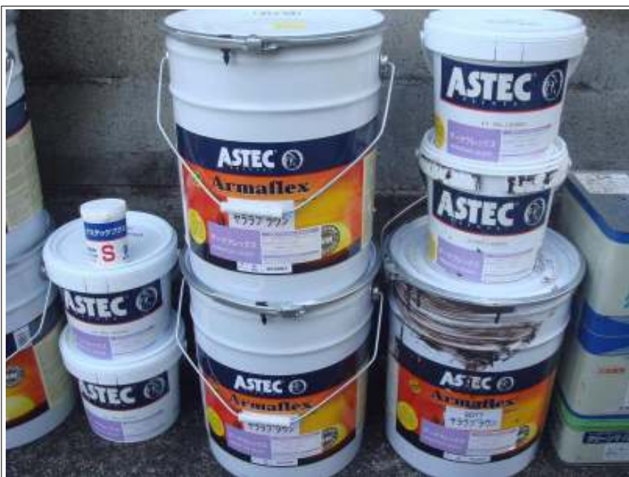
屋根中・上塗り使用材料