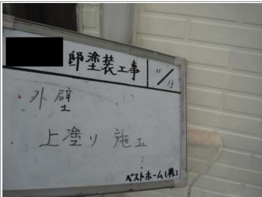
外壁塗装上塗り施工中