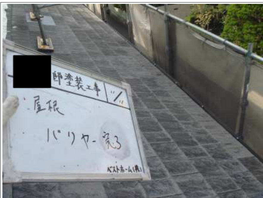
屋根バリヤー施工完了