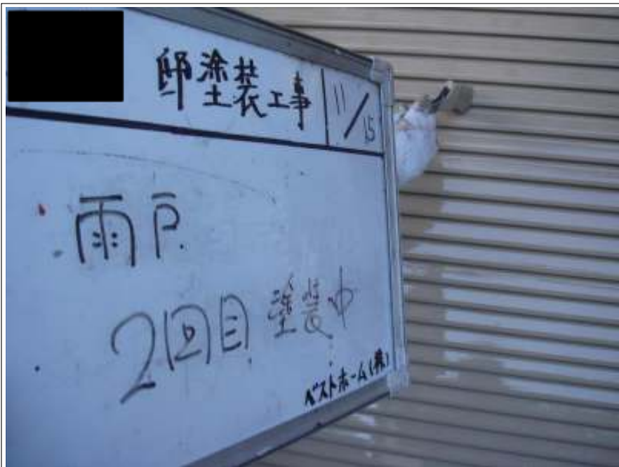
雨戸塗装 2回目施工中