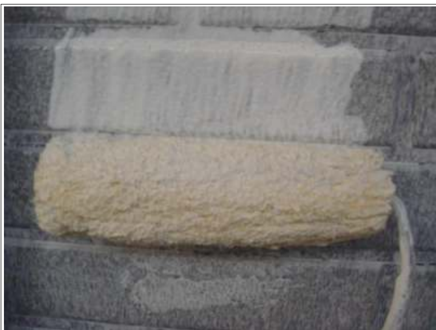
外壁塗装下塗り施工中