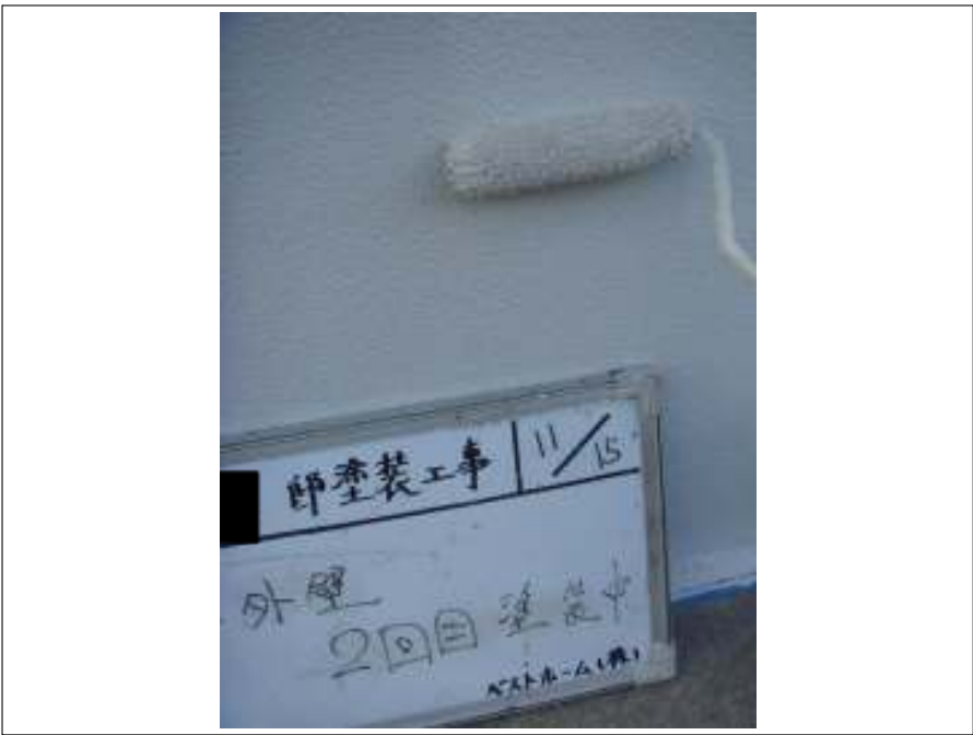
塀塗装 2回目施工中