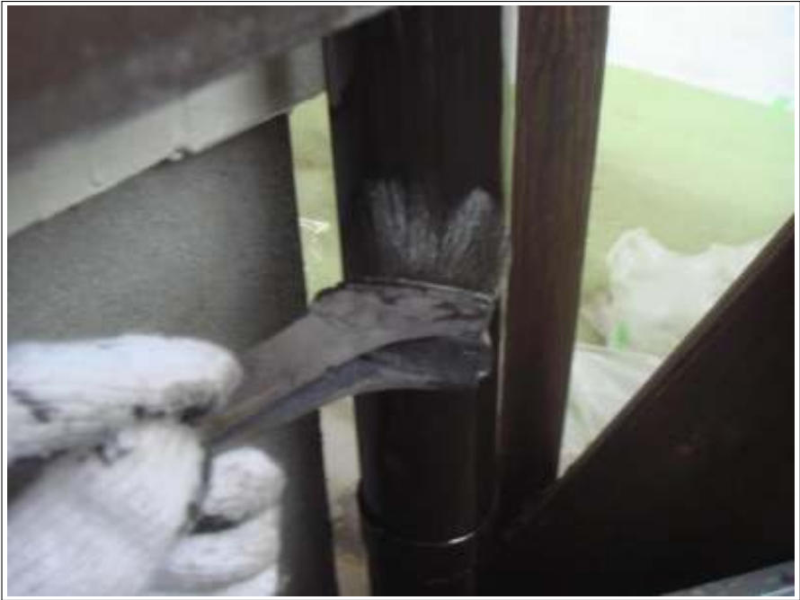
樋塗装 2回目施工中