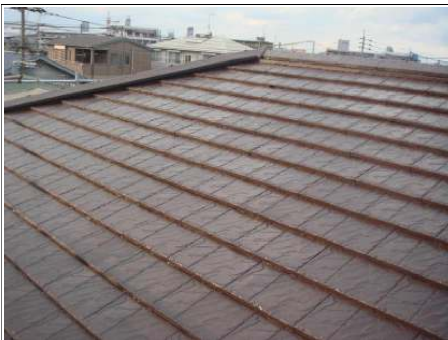
屋根塗装上塗り施工完了