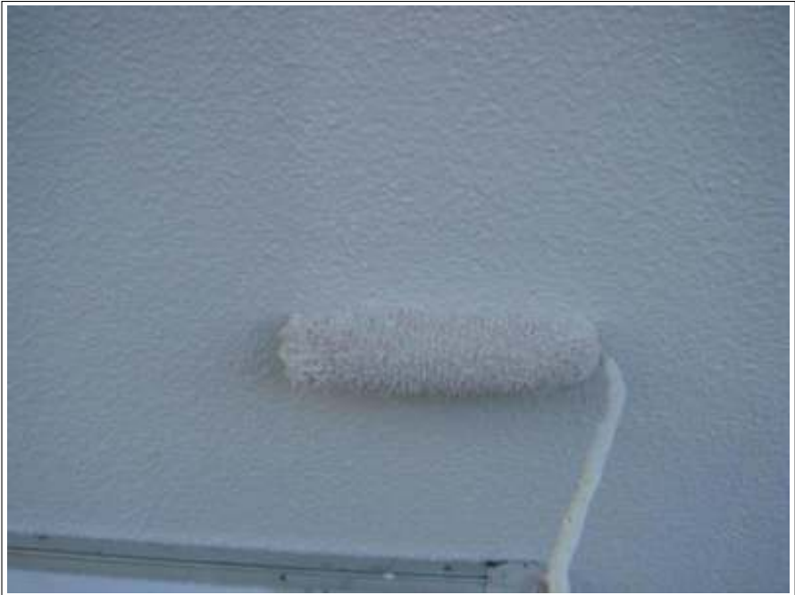
塀塗装 2回目施工中