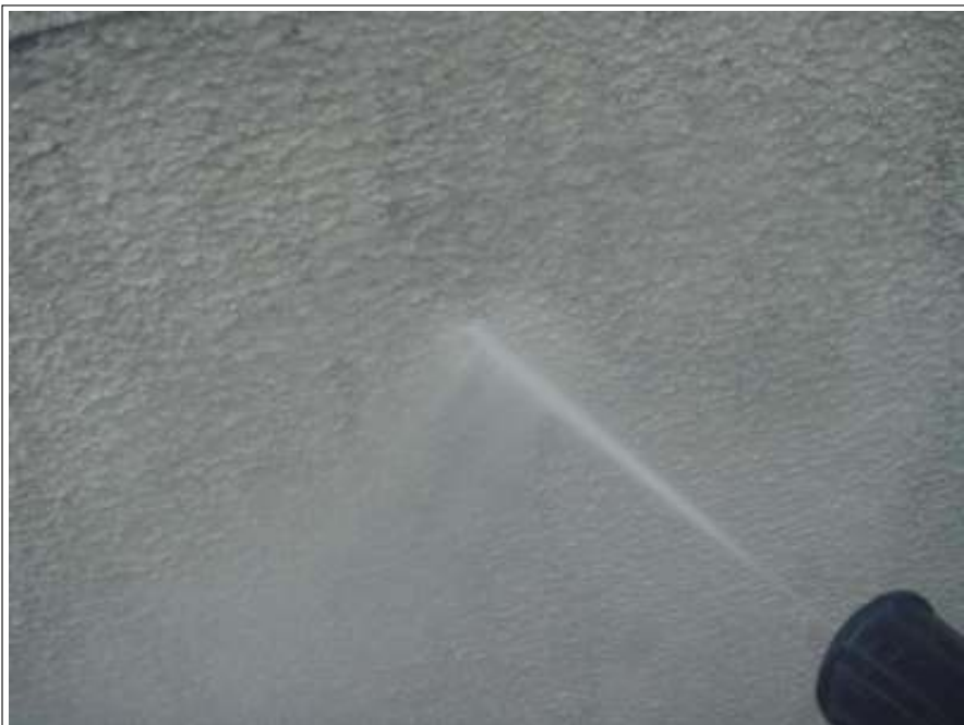
塀高圧洗淨施工中