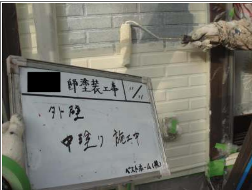
外壁塗装中塗り施工中