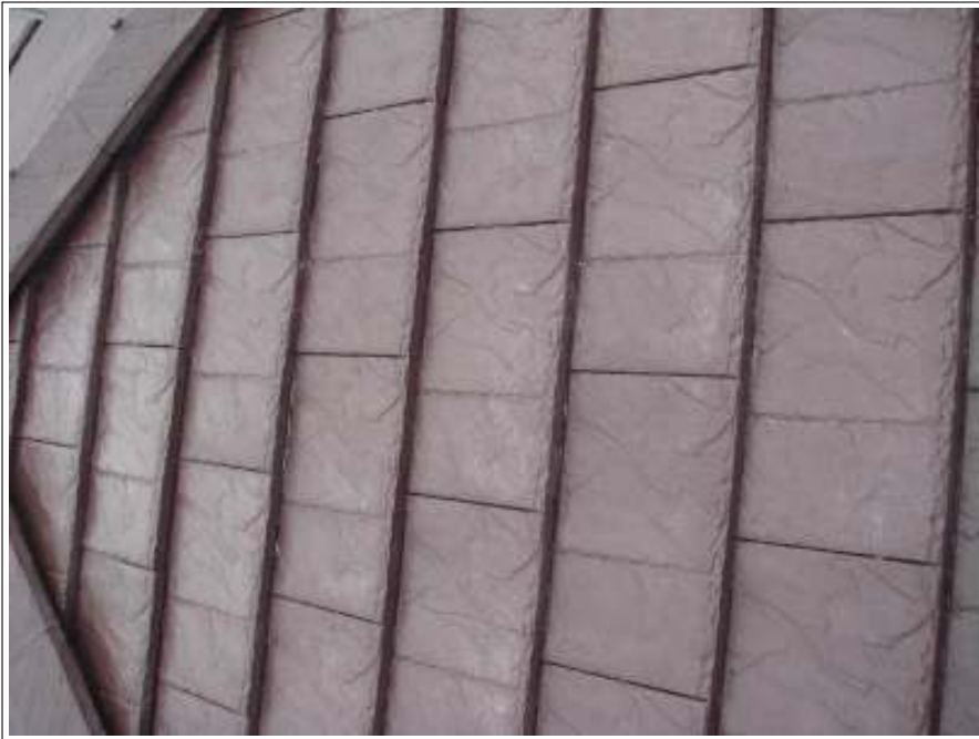
屋根塗装中塗り施工完了