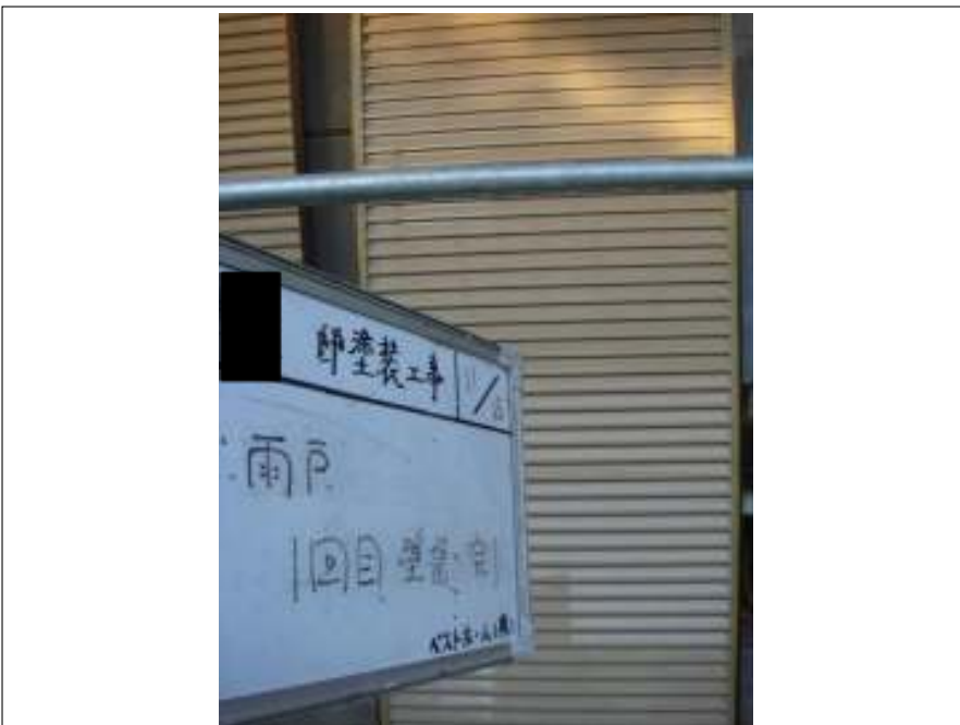
雨戸塗装 1 回目施工完了