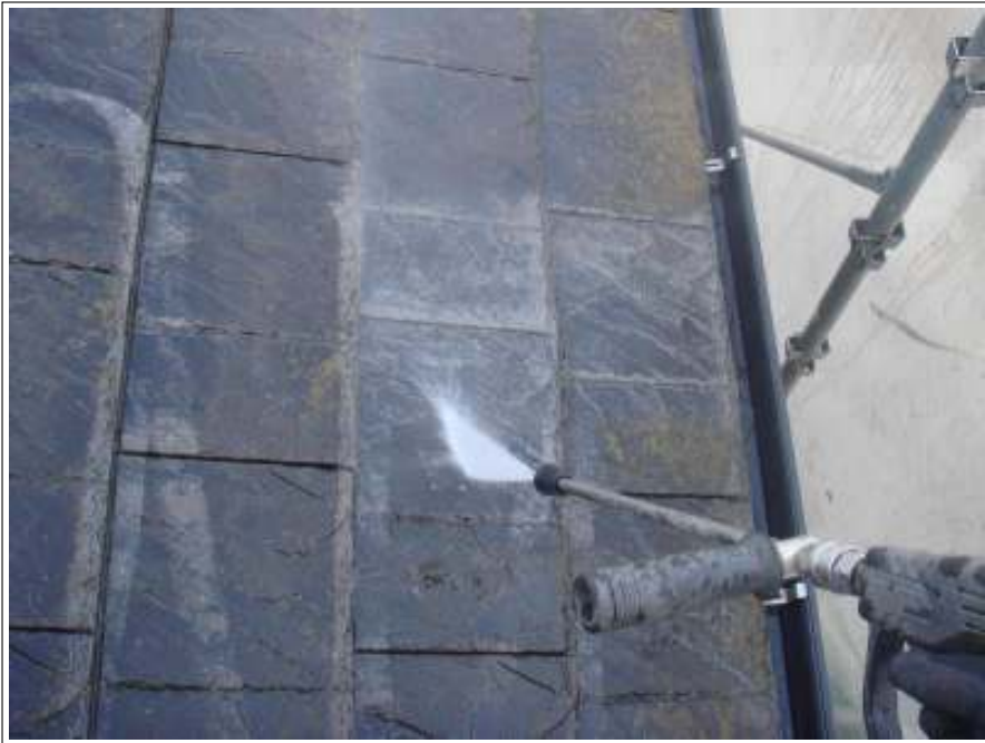
屋根高压洗净施工中