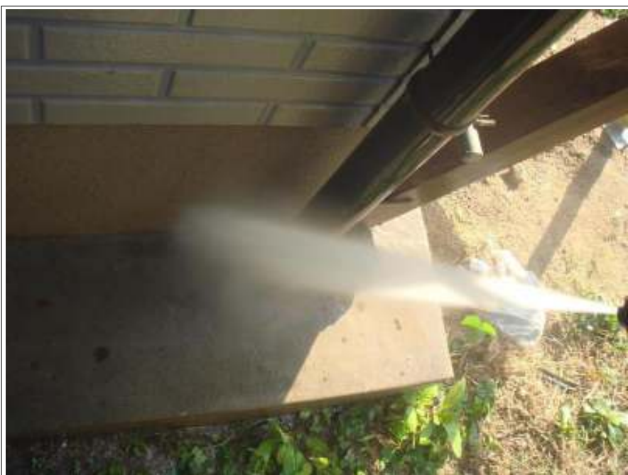
土間高圧洗浄施工中