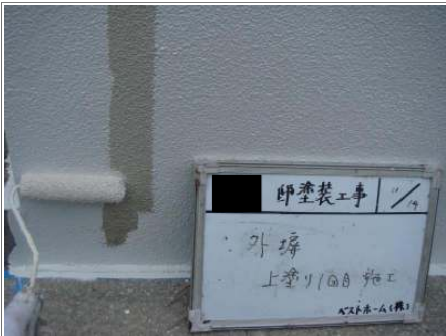
塀塗装 1 回目施工中