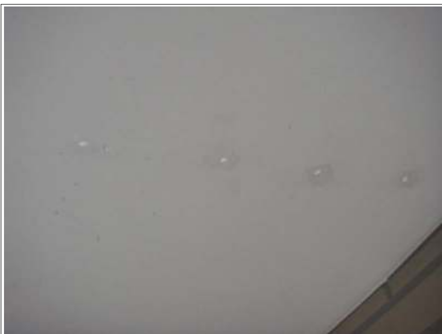
軒天ビス後補修施工後