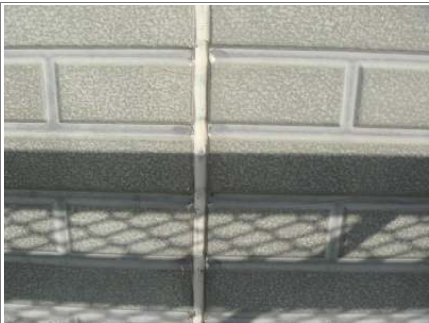
外壁シーリング補修施工完了