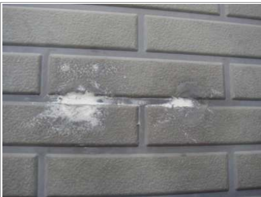
外壁補修施工完了