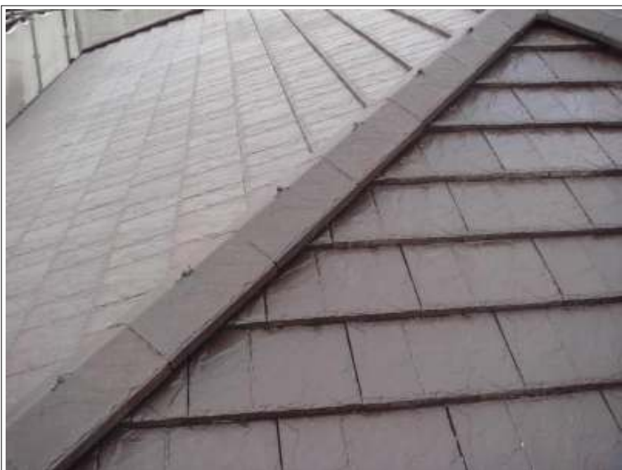
屋根塗装中塗り施工完了