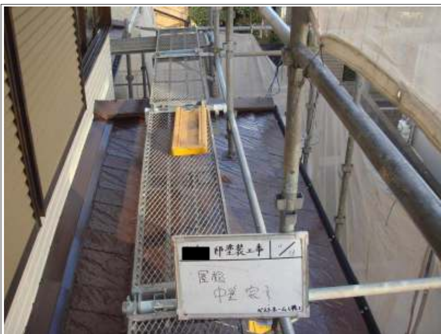
屋根塗装中塗り施工完了