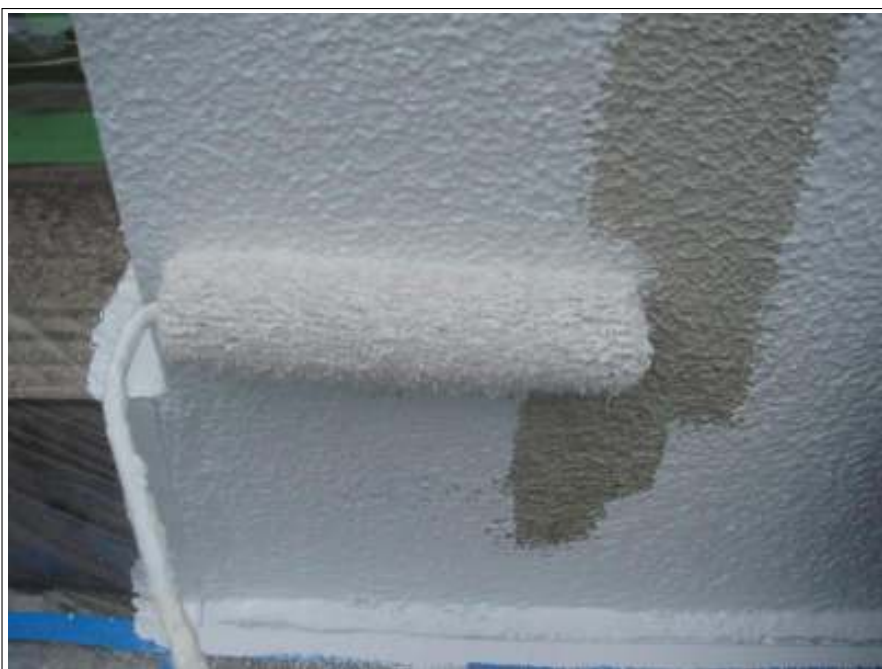
塀塗装 1 回目施工中