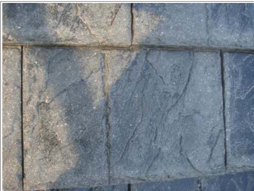
屋根高压洗净施工完了