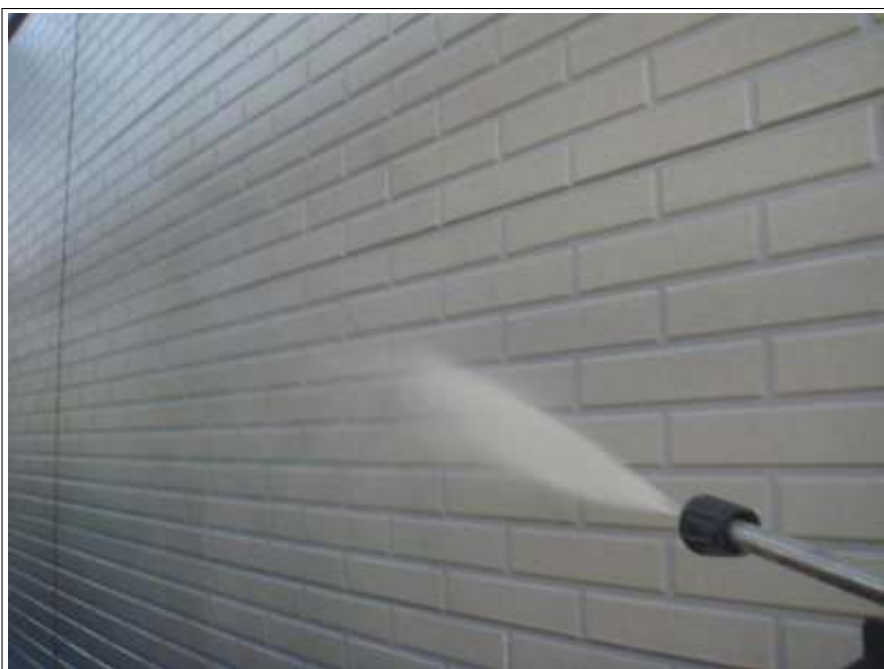
外壁高压洗净施工中