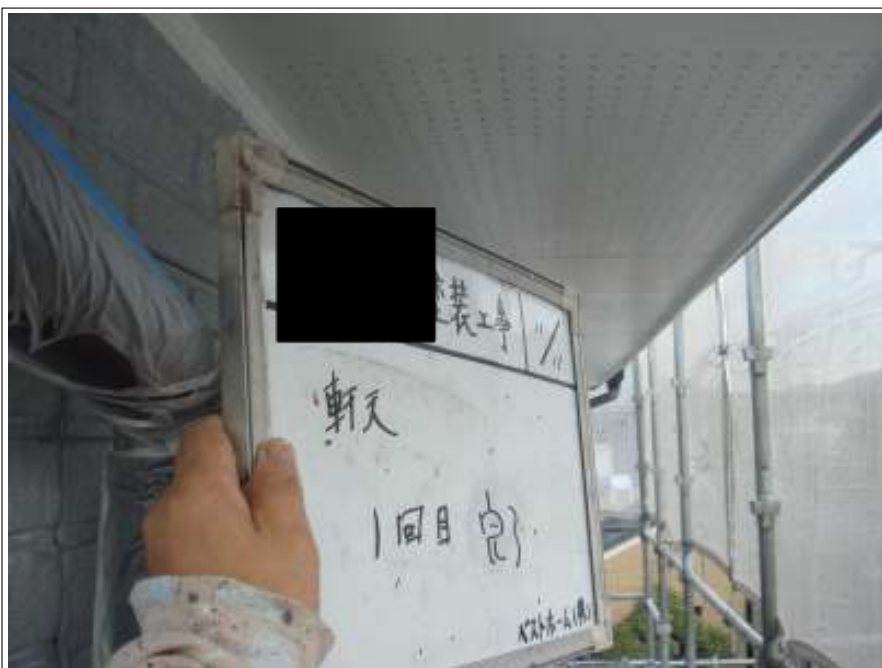
軒天塗装 1 回目施工完了