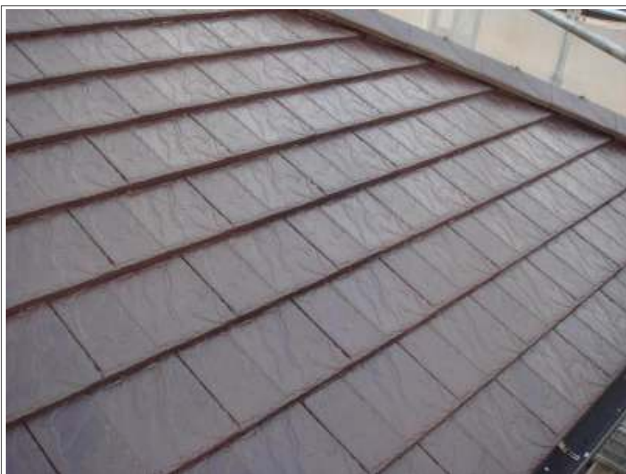
屋根塗装上塗り施工完了