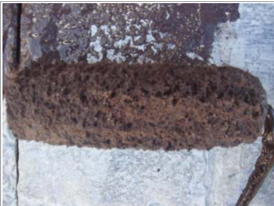
屋根塗装中塗り施工中