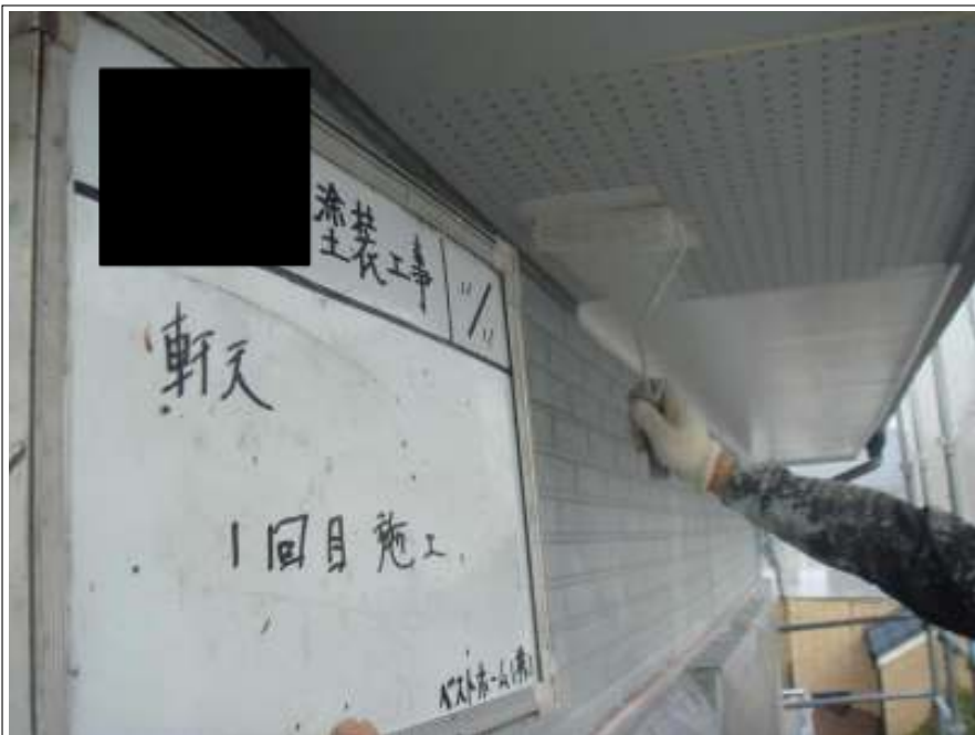
軒天塗装 1 回目施工中