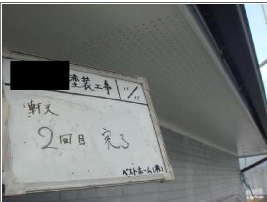
軒天塗装 2回目 施工完了