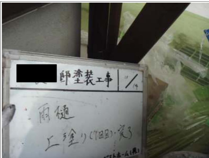
樋塗装 1回目施工完了