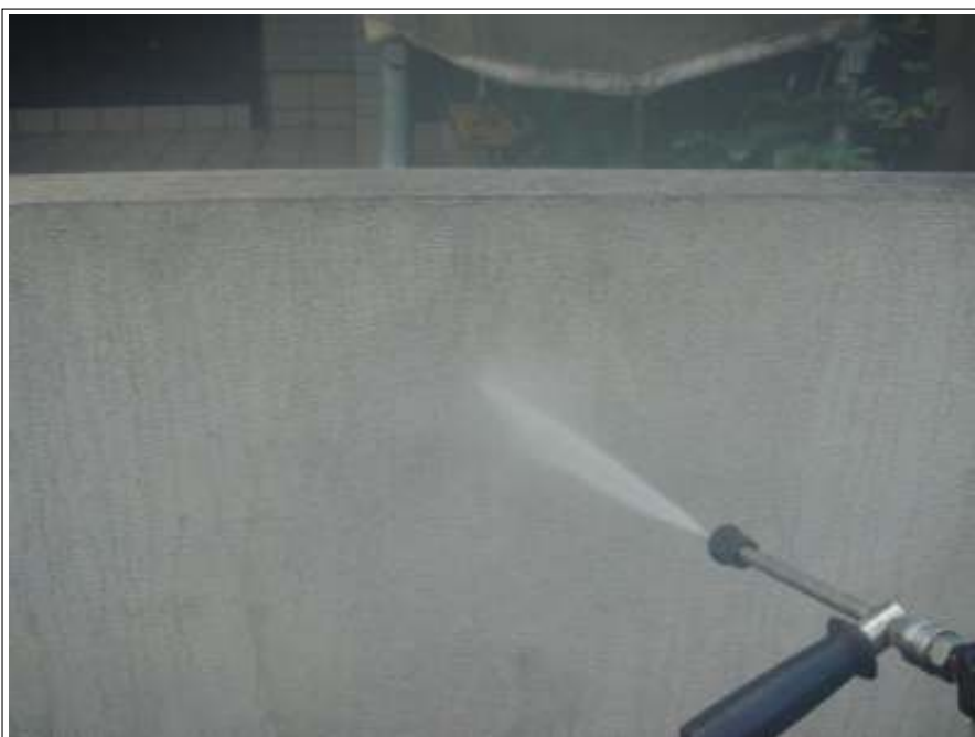
塀高圧洗浄施工中