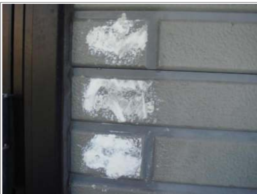
外壁補修施工完了