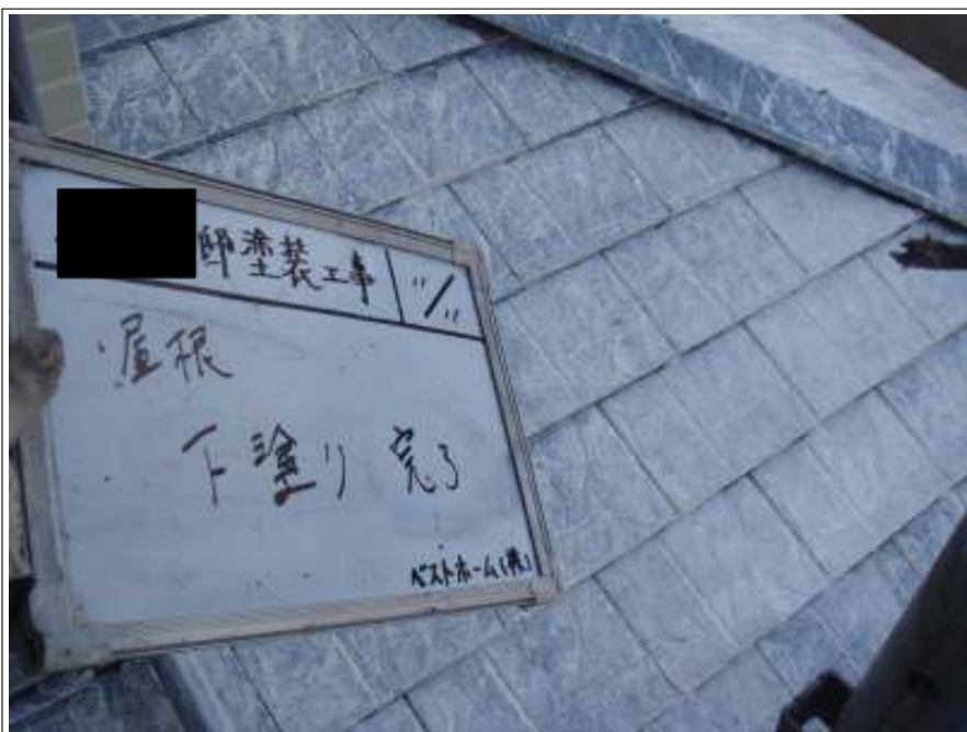
屋根塗装下塗り施工完了