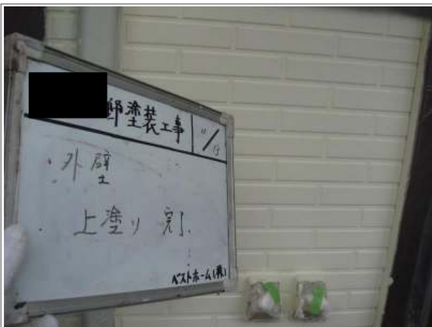
外壁塗装上塗り施工完了