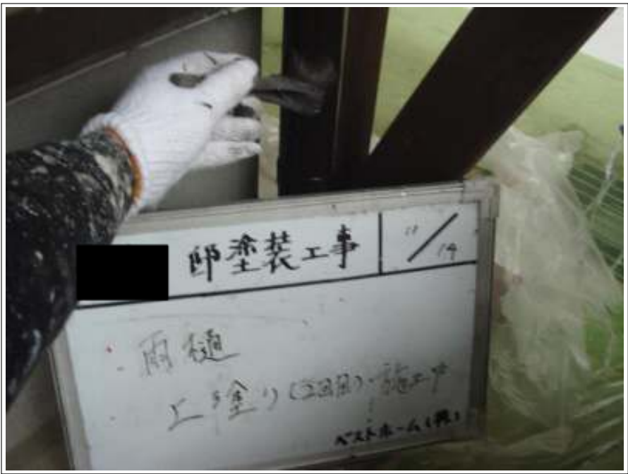
樋塗装 2回目施工中