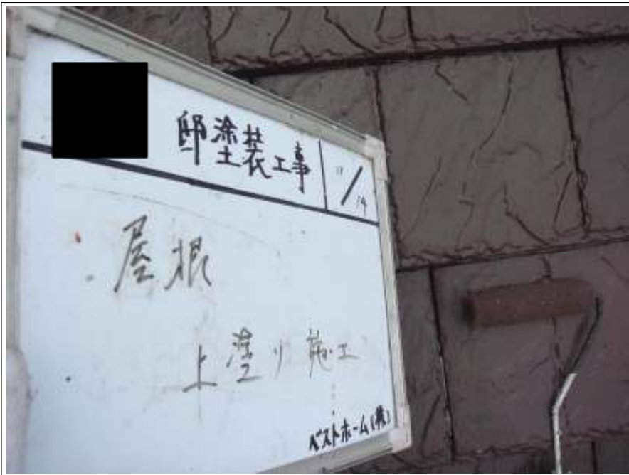
屋根塗装上塗り施工中