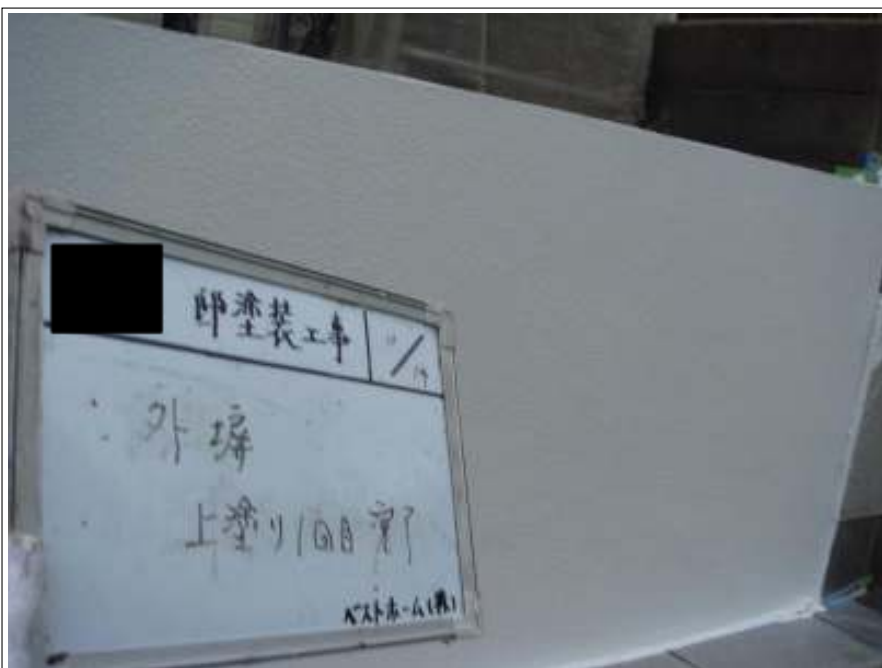
塀塗装 1 回目施工完了