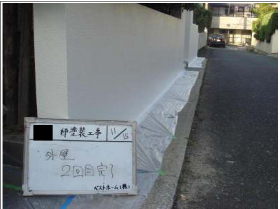
塀塗装 2回目施工完了