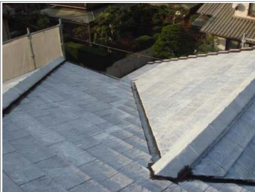
屋根バリヤー施工完了