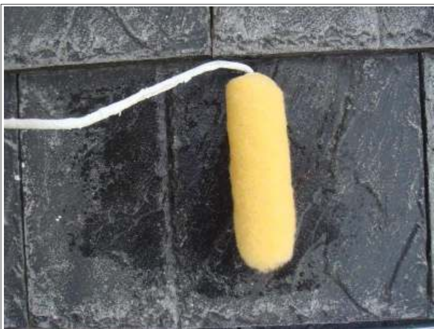
屋根バリヤー施工中