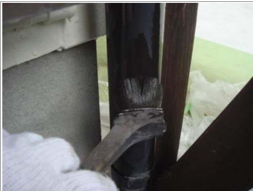
樋塗装 1回目施工中