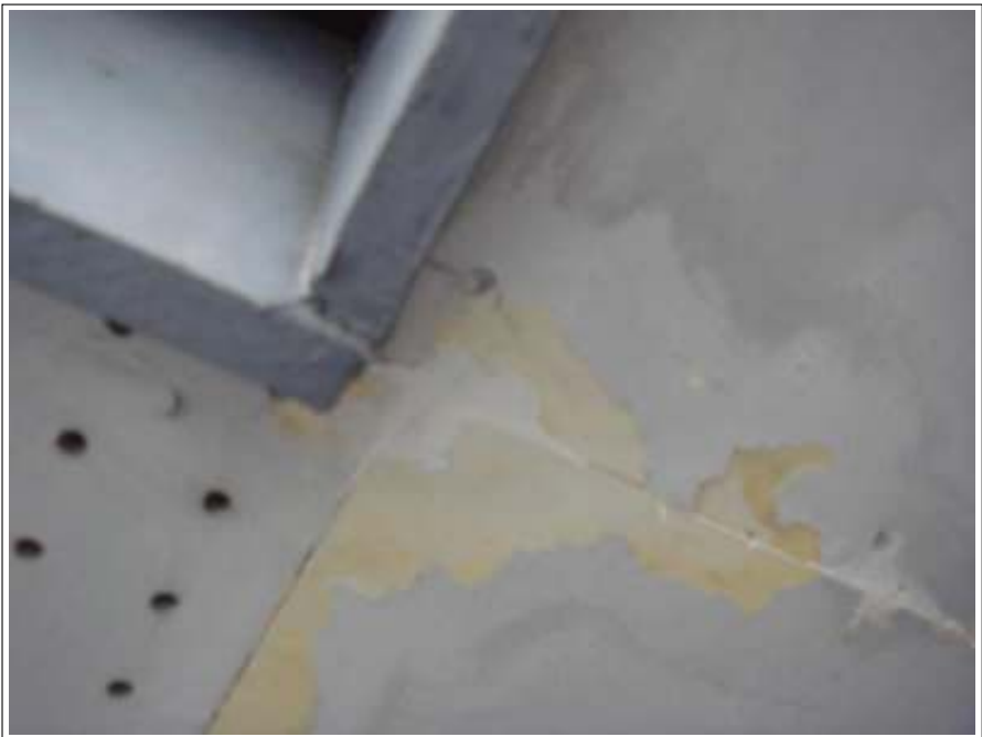
軒天補修施工完了