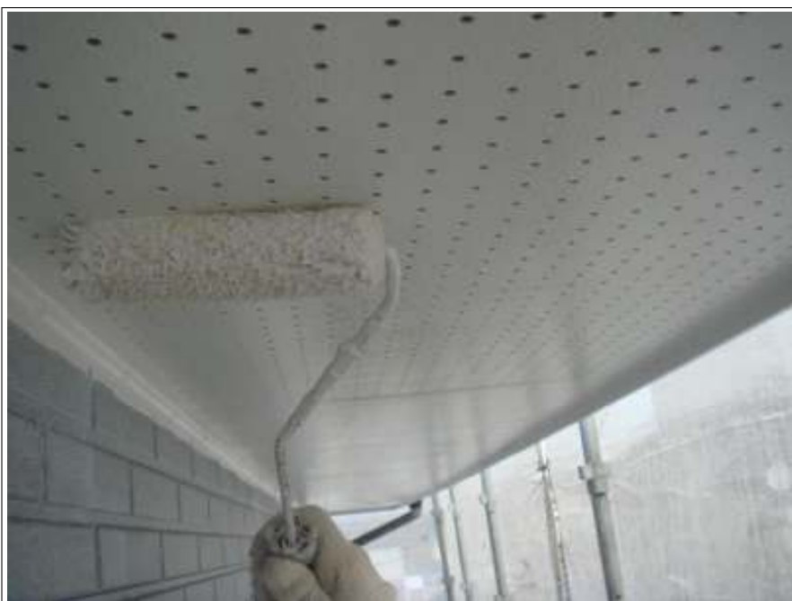
軒天塗装 2回目 施工中