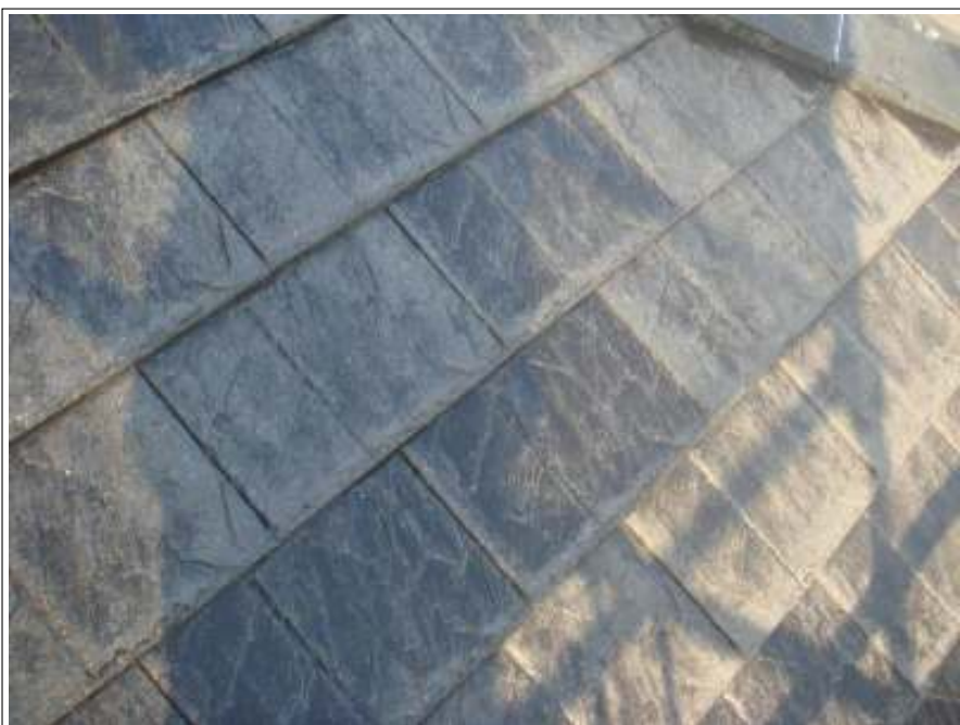
屋根高压洗净施工完了