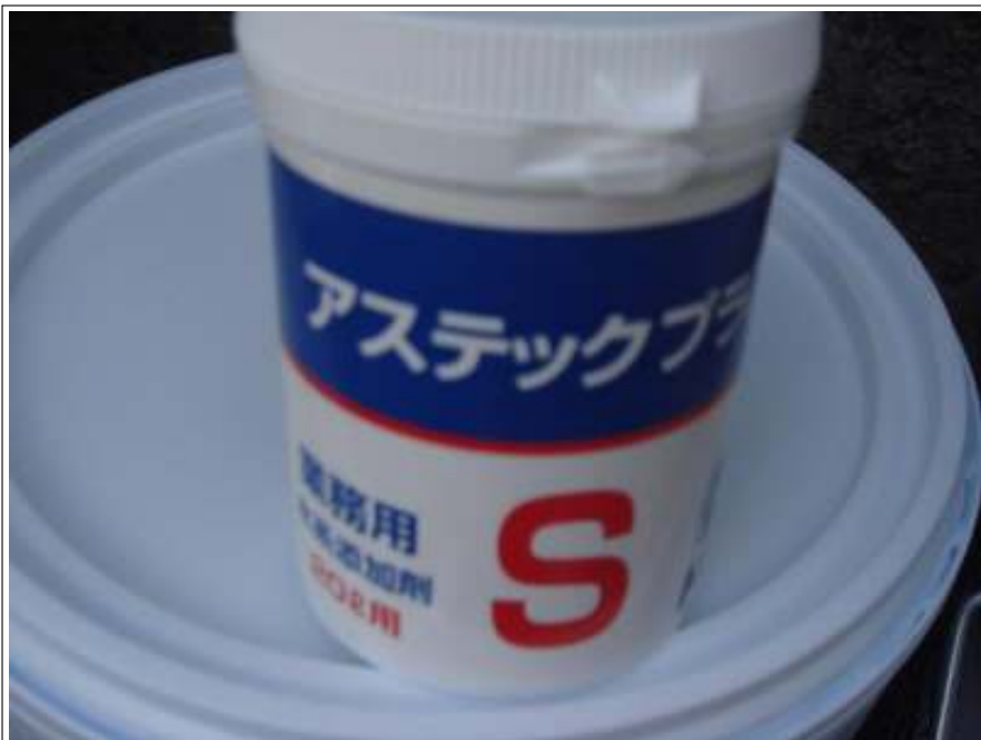
アステックプラス S