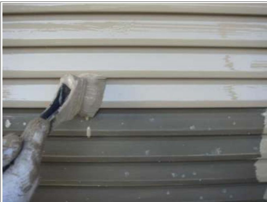
雨戸塗装 1 回目施工中