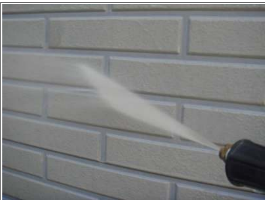
外壁高压洗净施工中