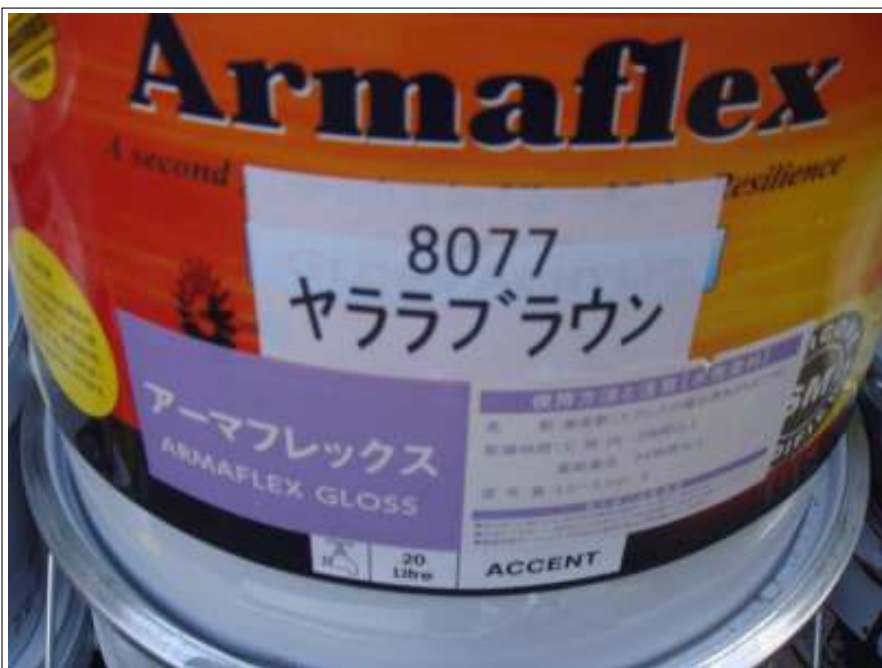
屋根中・上塗り使用材料