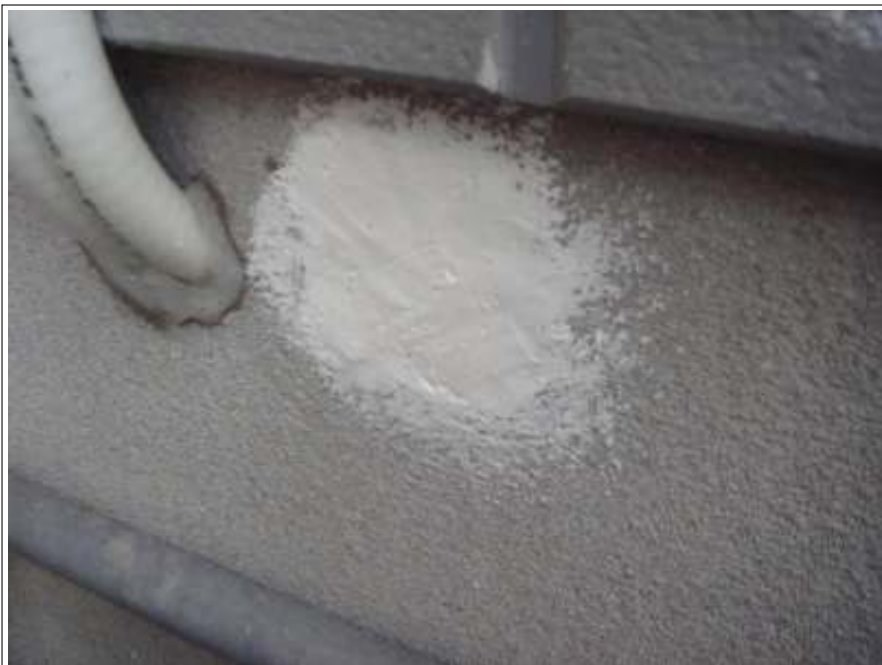
外壁補修施工完了