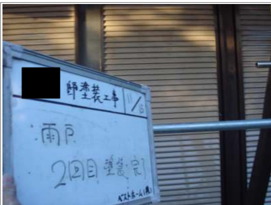
雨戸塗装 2回目施工完了