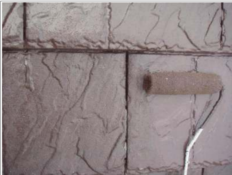
屋根塗装上塗り施工中