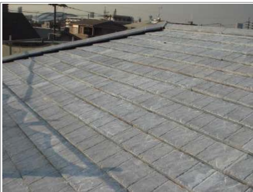
屋根バリヤー施工完了