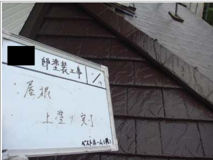
屋根塗装上塗り施工完了