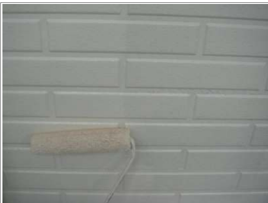
外壁塗装上塗り施工中