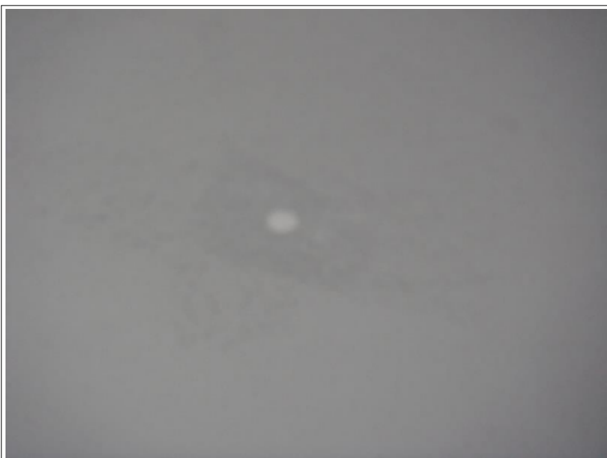
軒天ビス後補修施工後