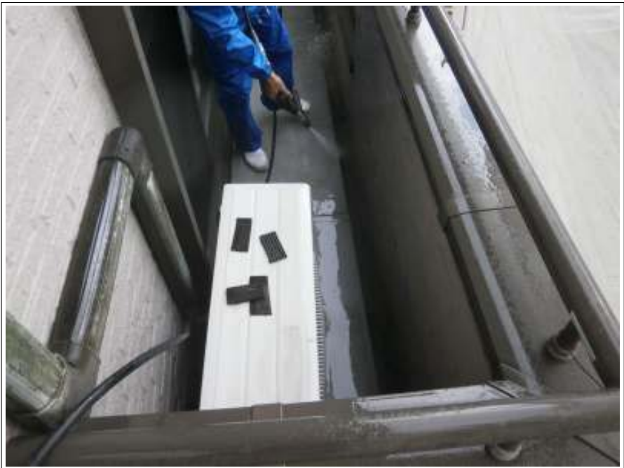
ベランダ高圧洗浄施工中