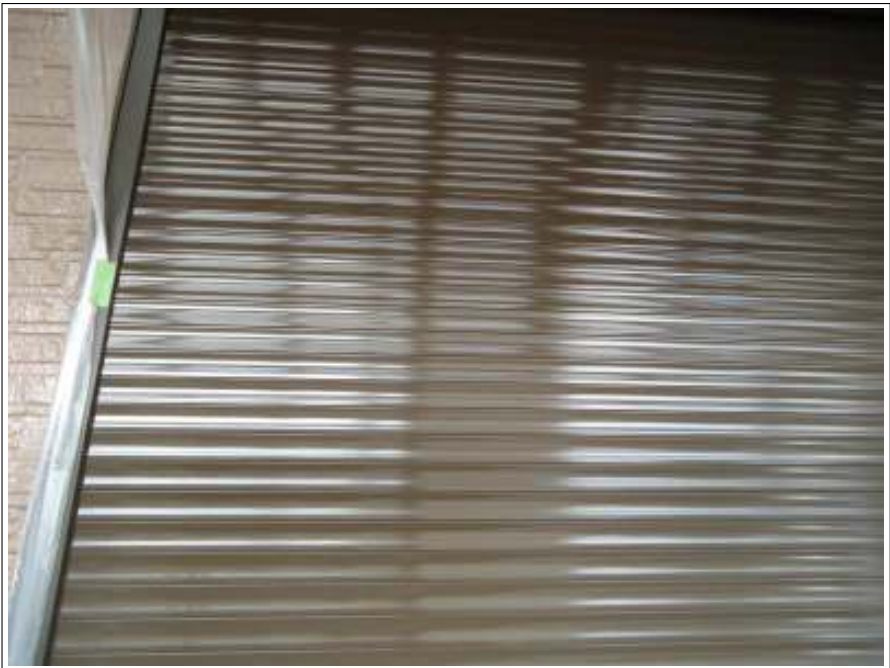
シャッター塗装施工完了