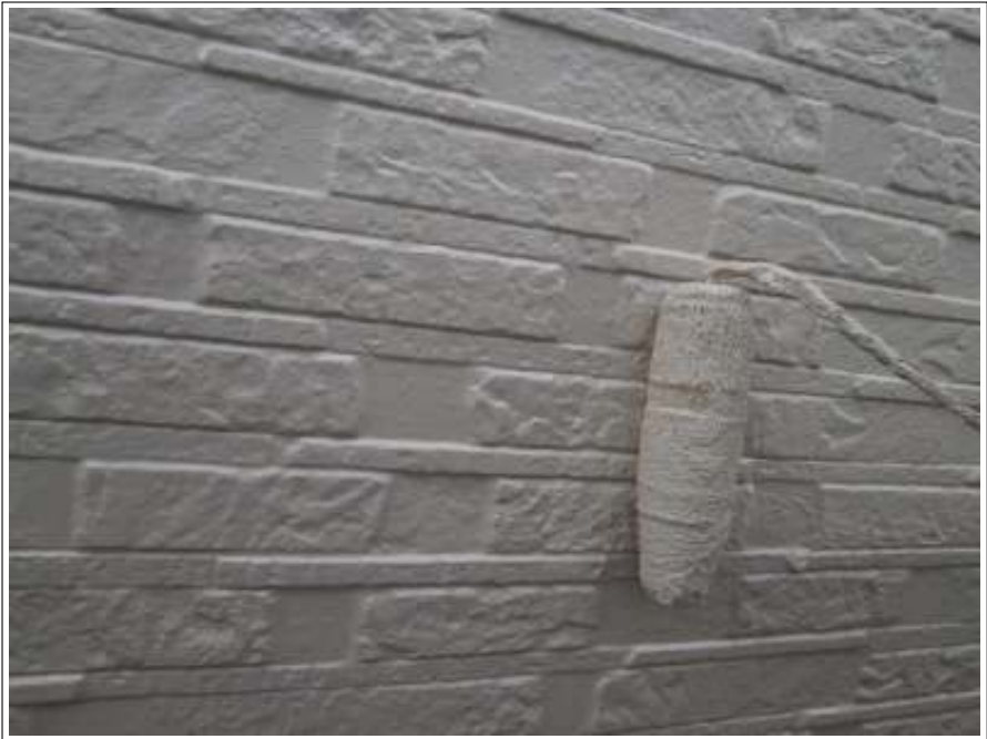
外壁塗装上塗り 2 回目施工中