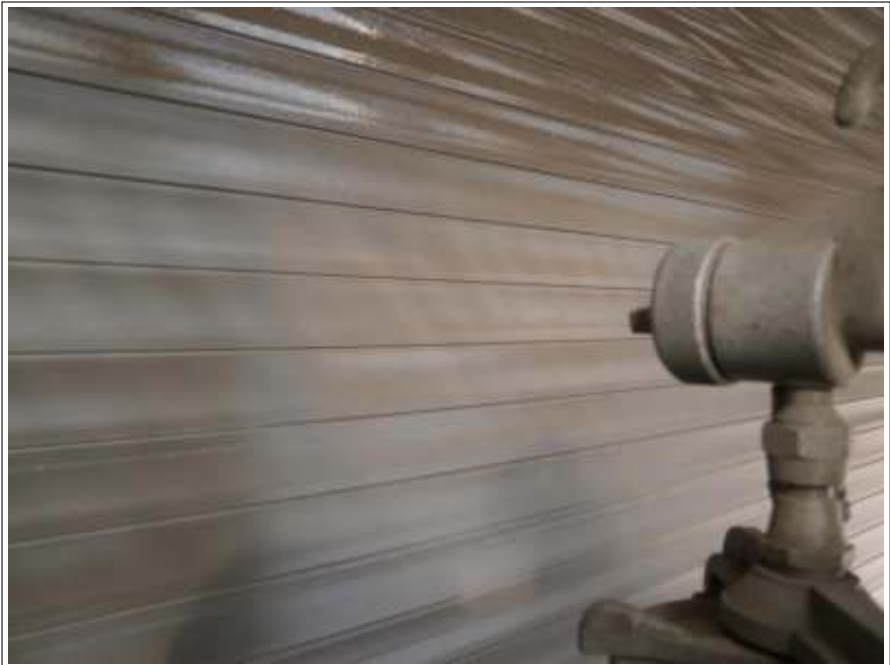
シャッター塗装施工中