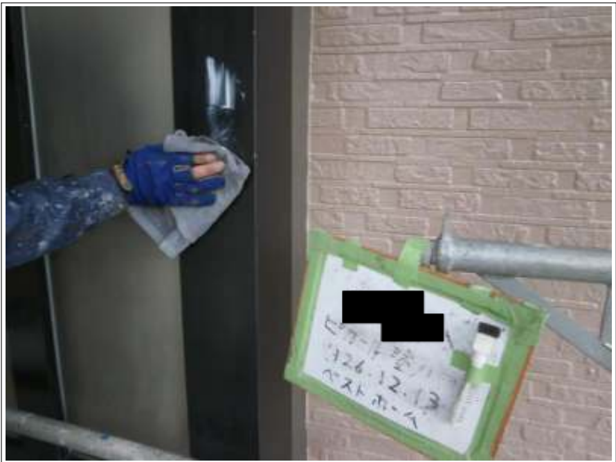
アルミ外壁拭き磨き施工中