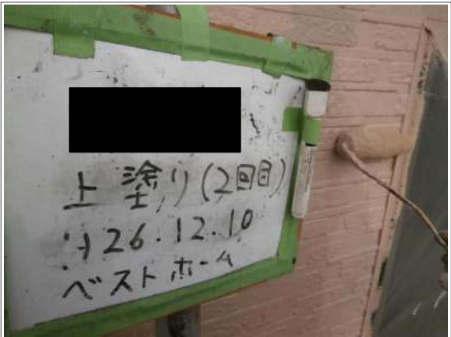
外壁塗装上塗り 2 回目施工中