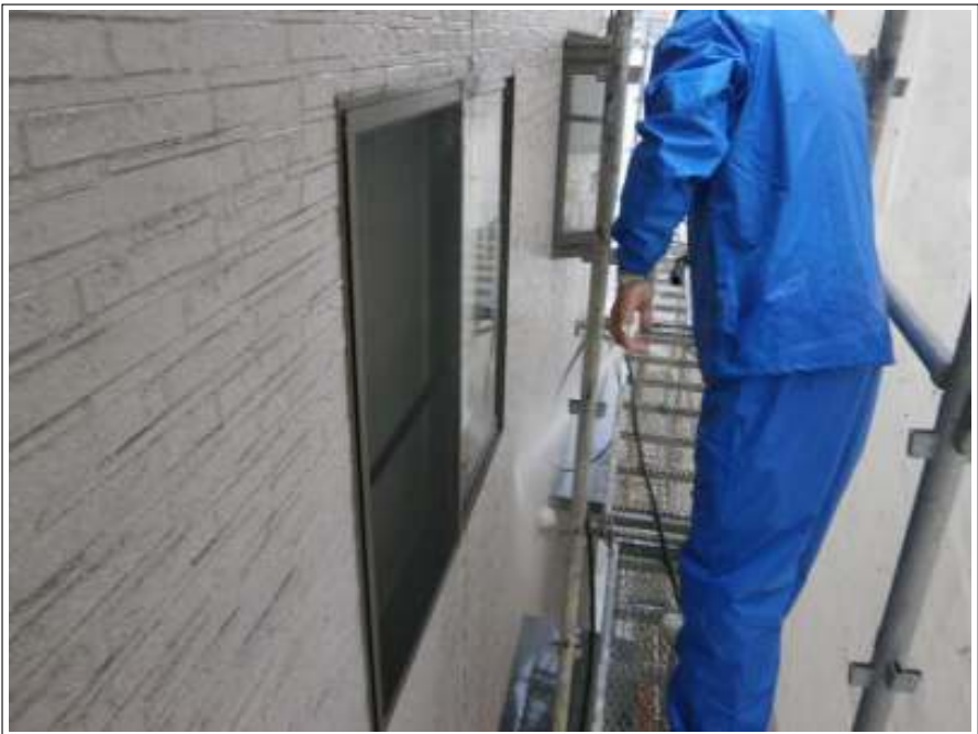
外壁高圧洗浄施工中