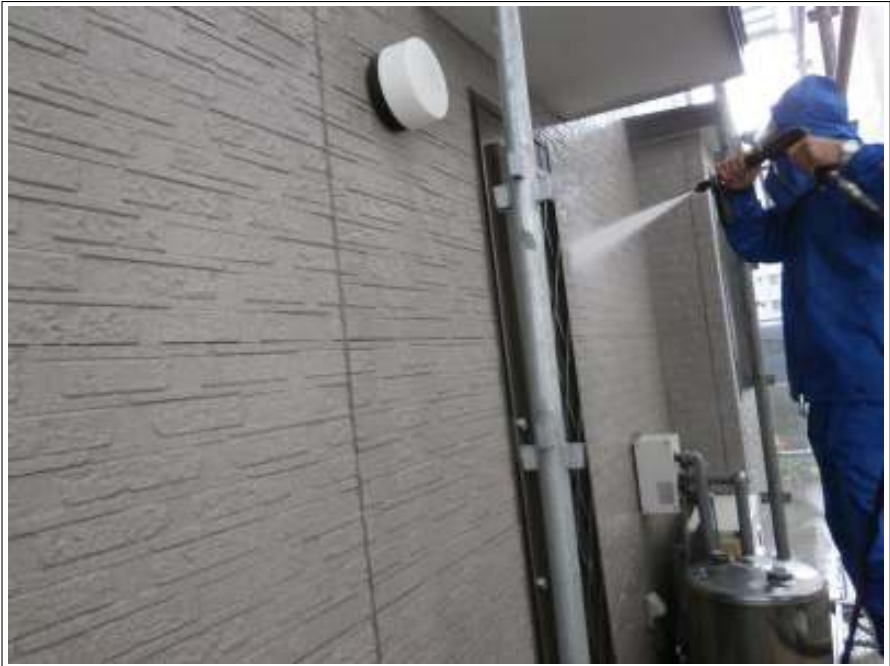
外壁高圧洗浄施工中