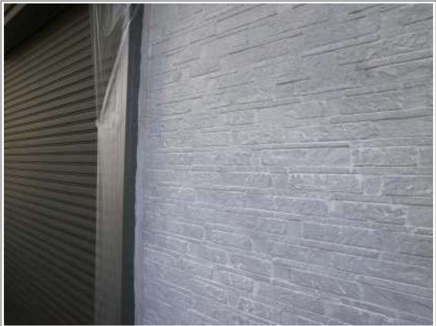
外壁塗装下塗り施工完了