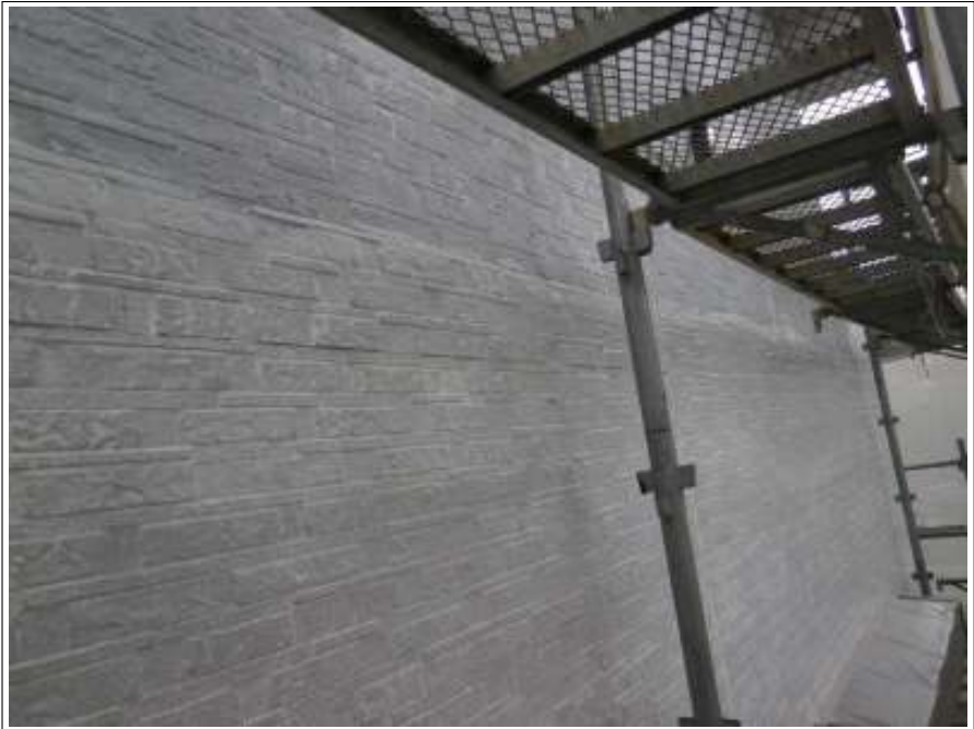
外壁塗装下塗り施工完了