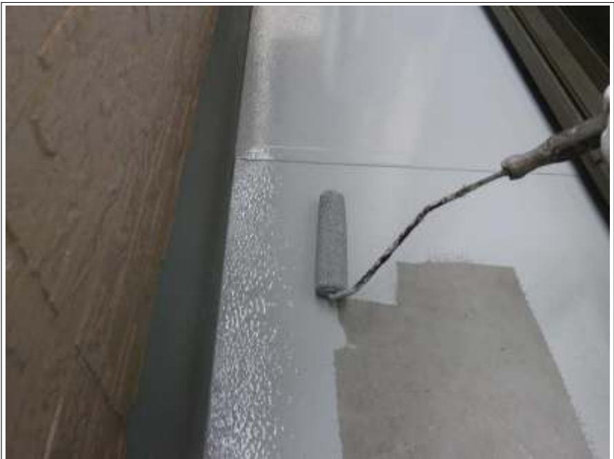
ベランダ塗装 2回目施工中