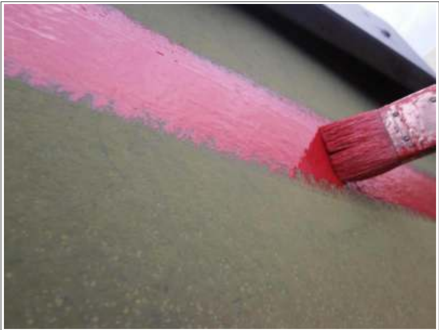
破風板ラインアクセント施工中