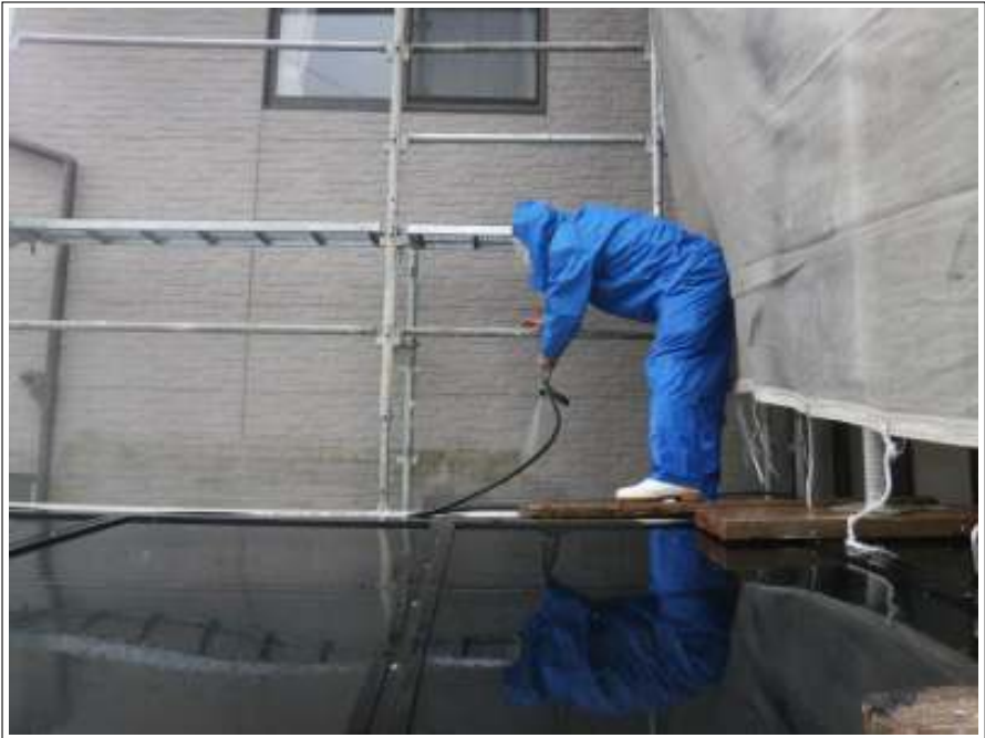
外壁高圧洗浄施工中