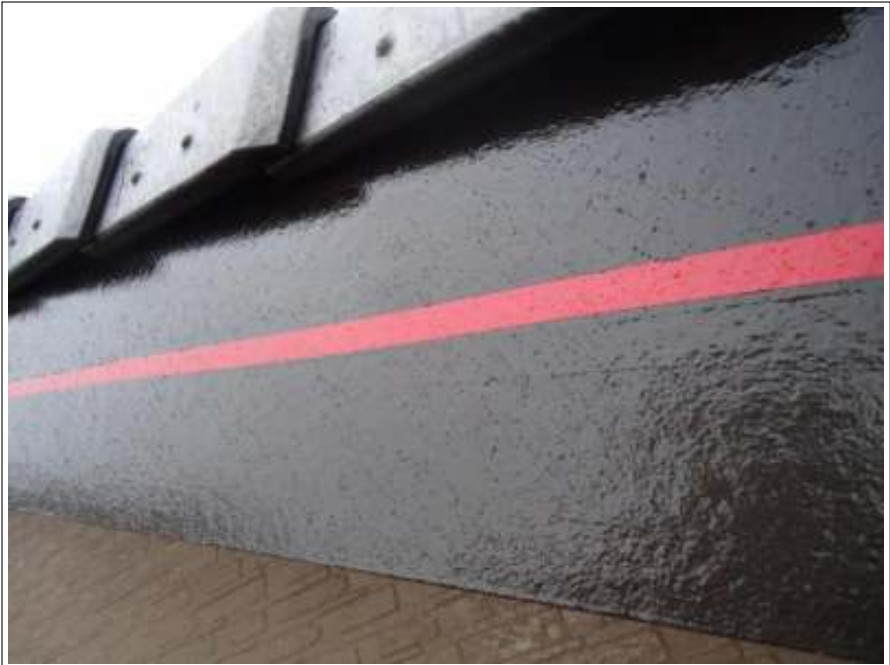
破風板塗装施工完了