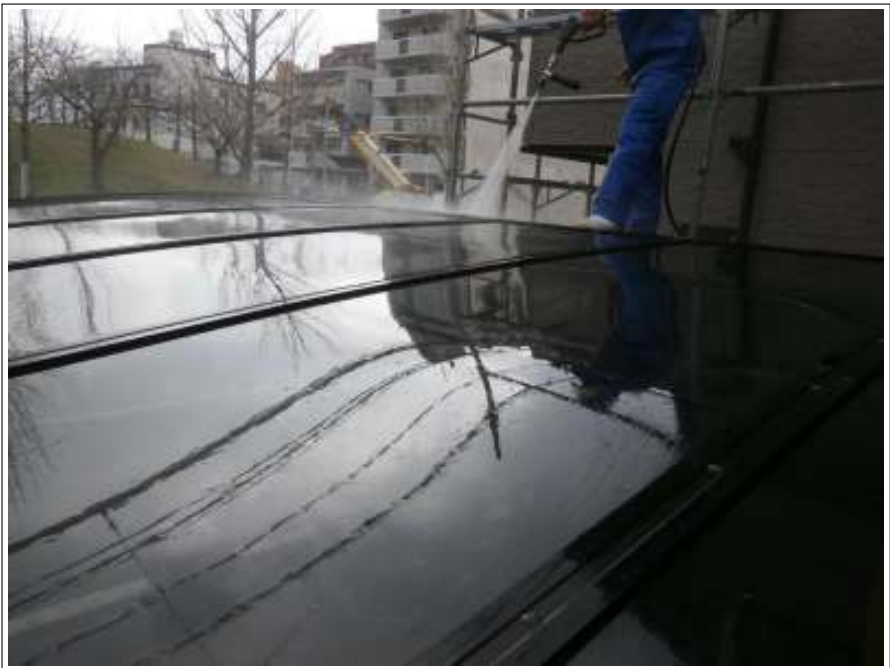
カーポート高圧洗浄施工中