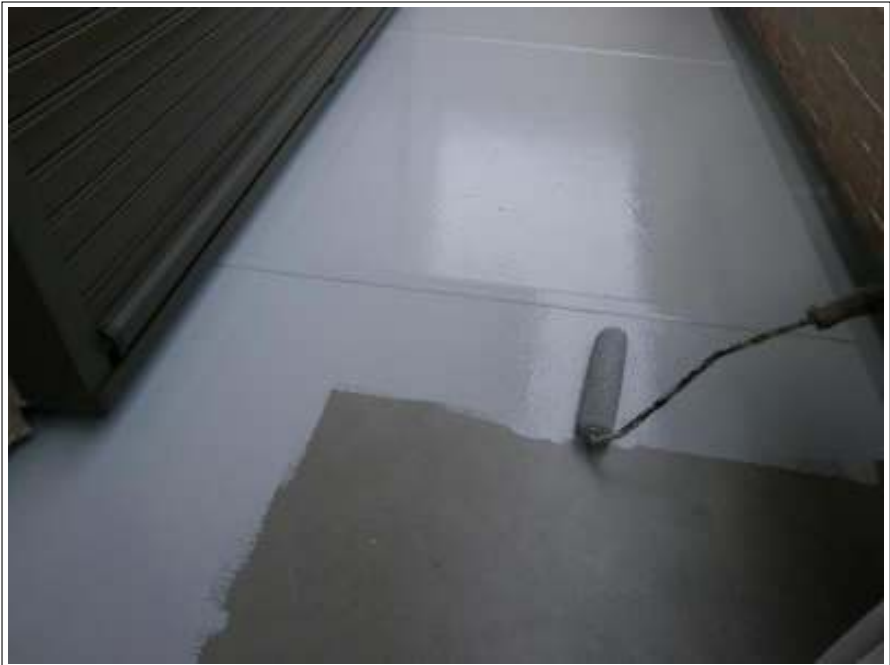
ベランダ塗装 2回目施工中