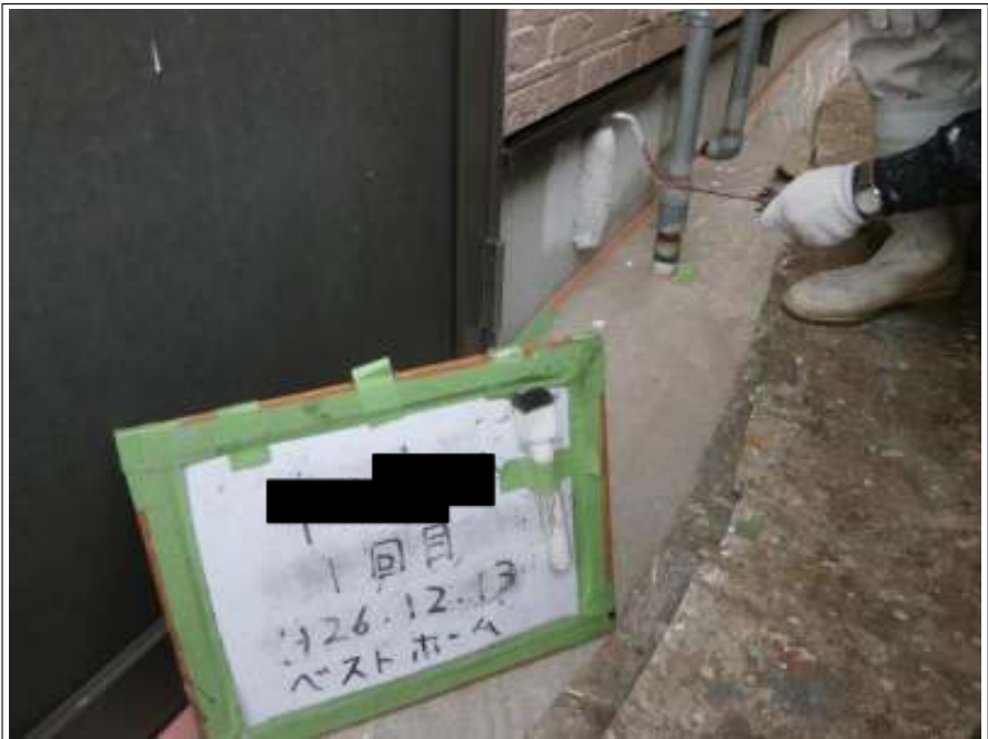
基礎塗装 1 回目施工中