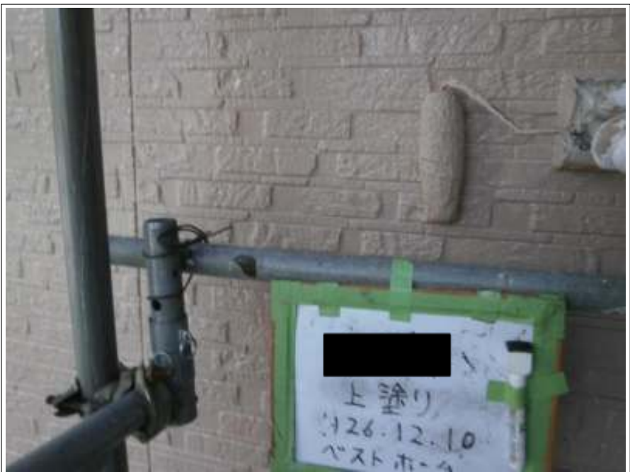
外壁塗装上塗り 1 回目施工中