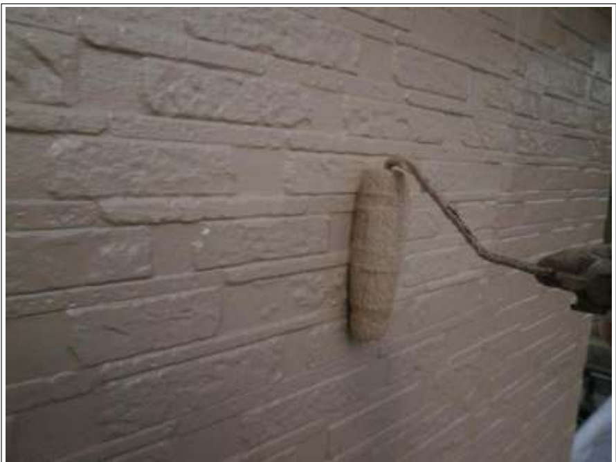
外壁塗装上塗り 2 回目施工中