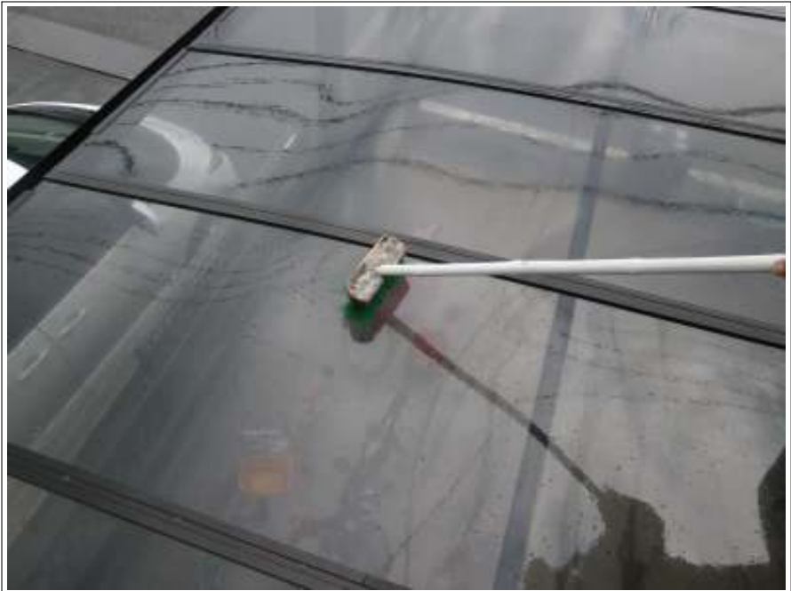
カーポート洗浄施工中