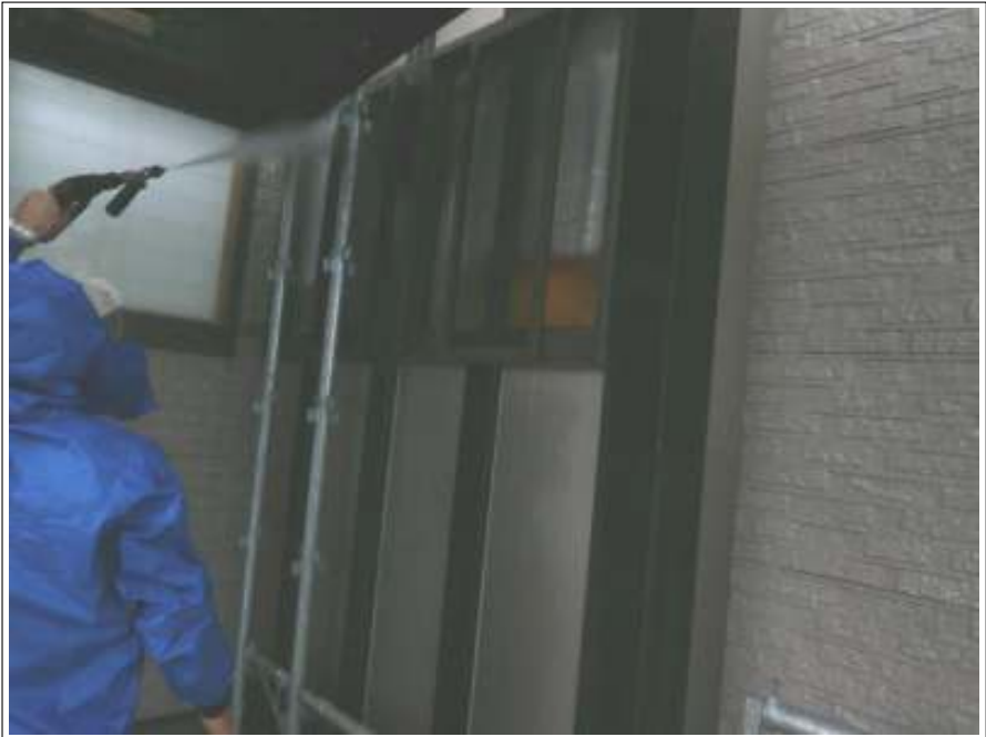
アルミ外壁高圧洗浄施工中