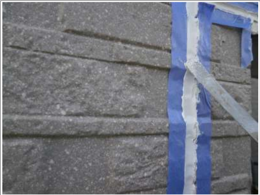
外壁シーリング補修施工中