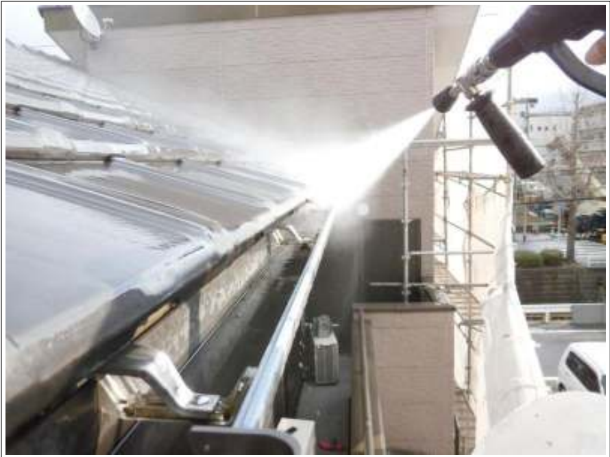
樋高圧洗浄施工中