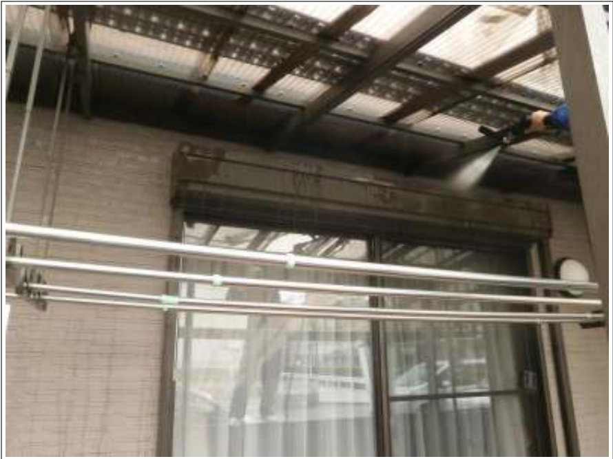
シャッター高圧洗浄施工中