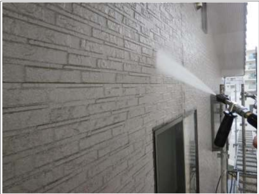
外壁高圧洗浄施工中