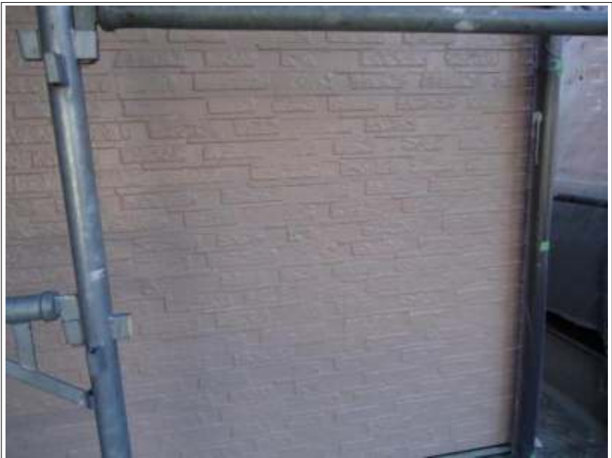
外壁塗装上塗り 1 回目施工完了