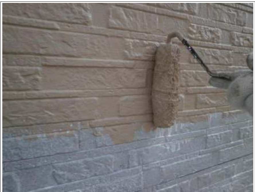
外壁塗装中塗り施工中