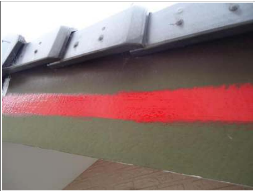
破風板ラインアクセント施工完了