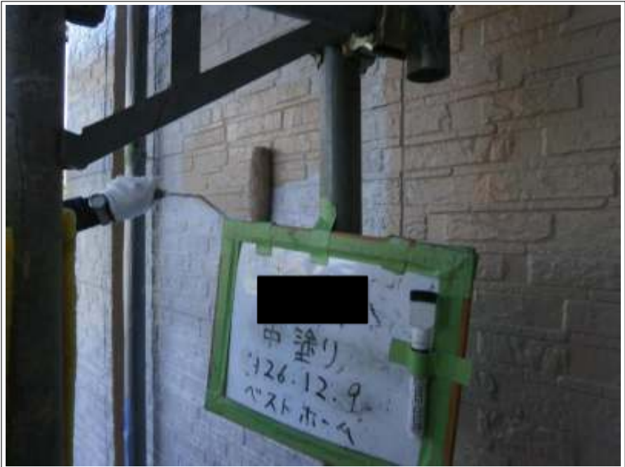
外壁塗装中塗り施工中