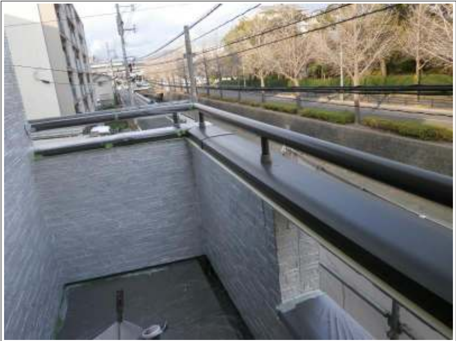
外壁塗装下塗り施工完了