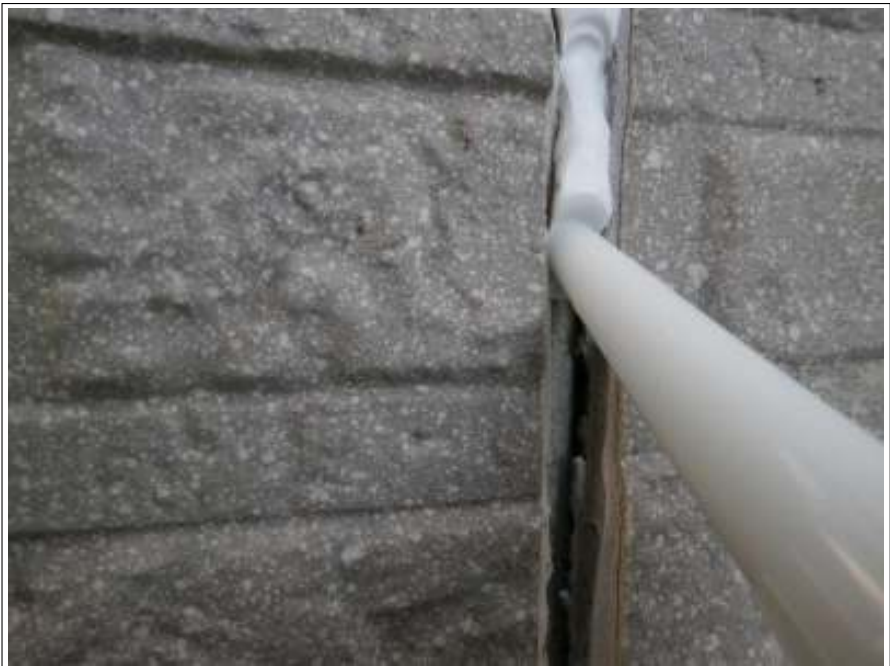
外壁シーリング補修施工中