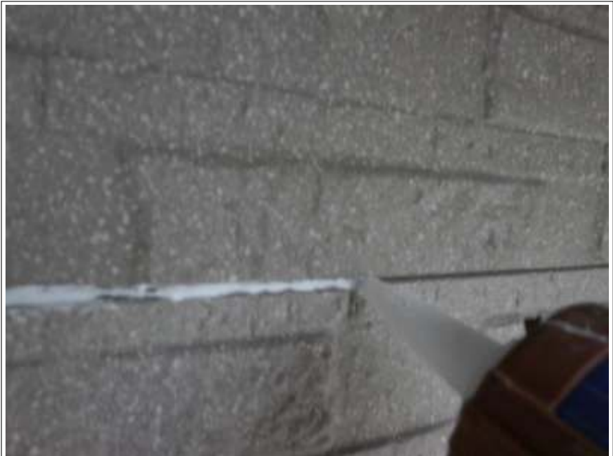
外壁シーリング補修施工中