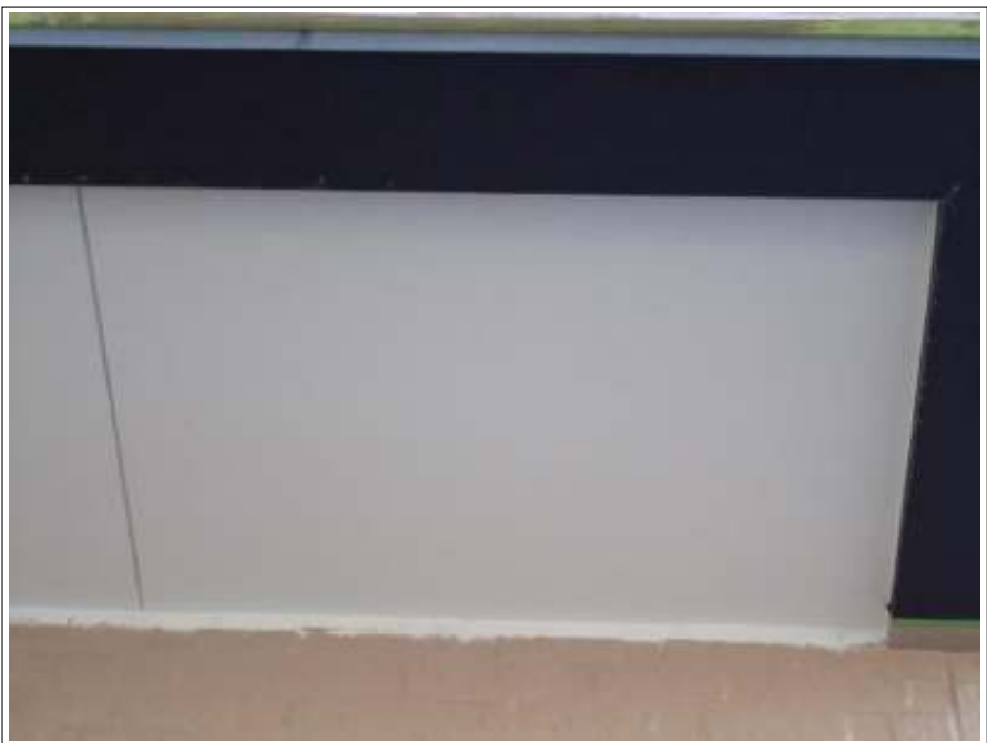
軒天塗装施工完了