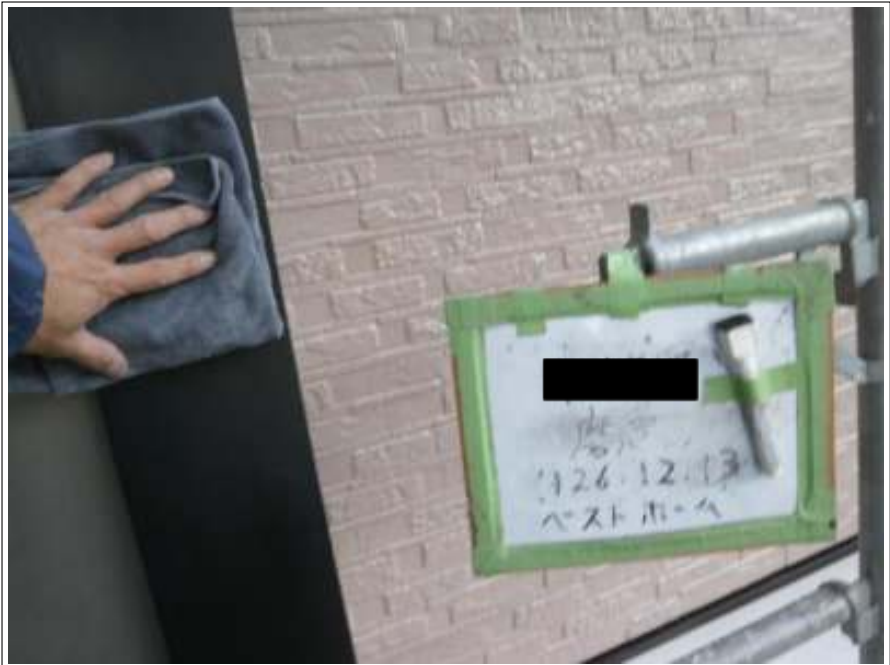
アルミ外壁拭き磨き施工中