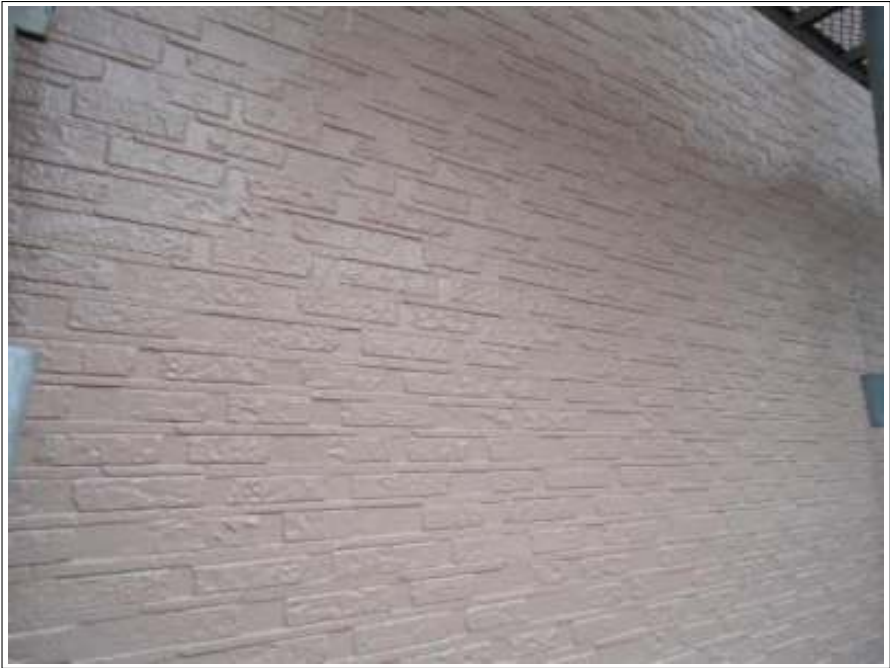
外壁塗装上塗り 2 回目施工完了