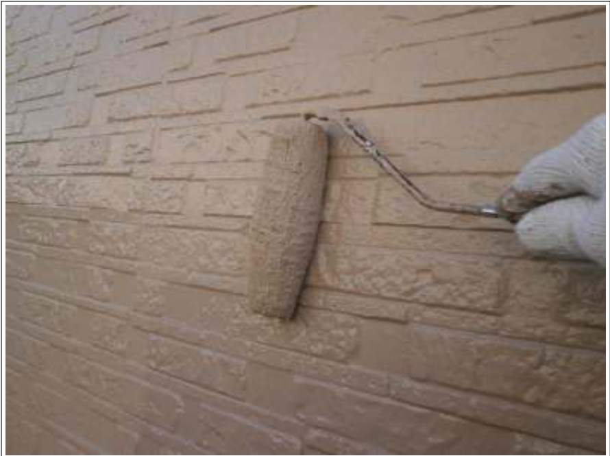
外壁塗装上塗り 2 回目施工中