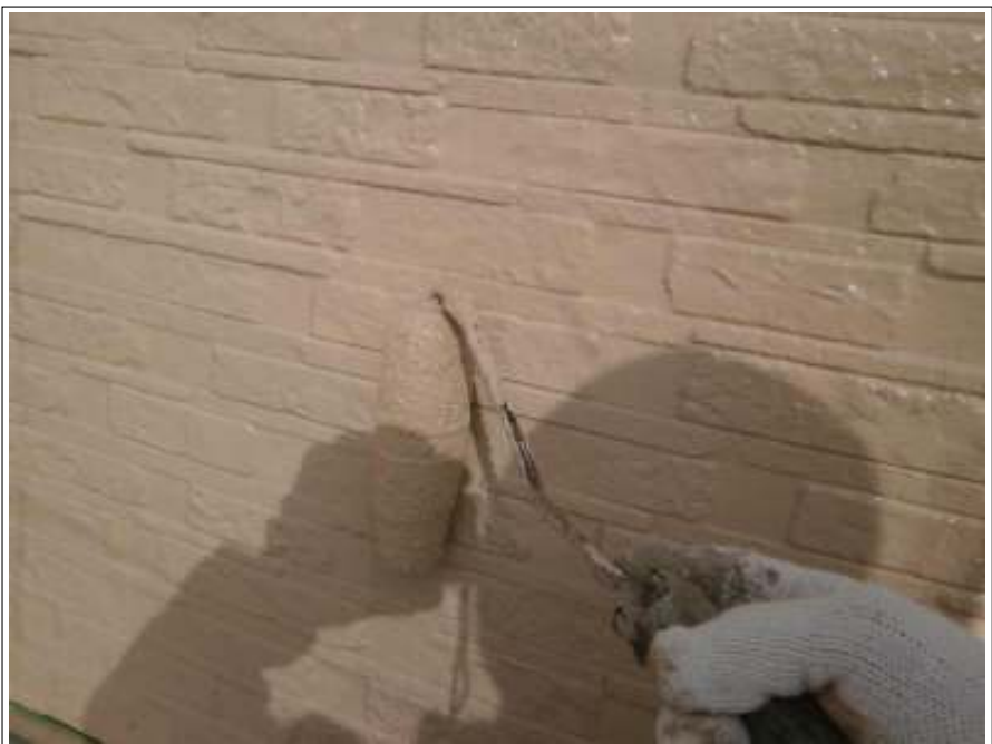
外壁塗装上塗り 2 回目施工中