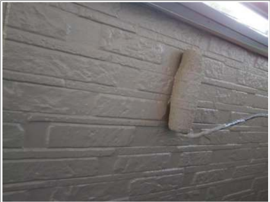
外壁塗装上塗り 1 回目施工中