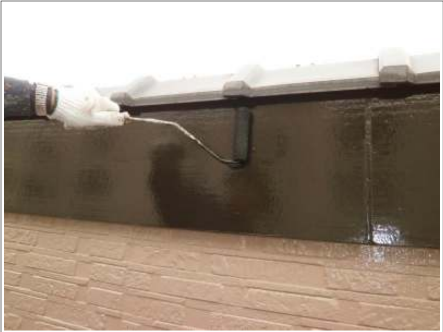
破風板塗装施工中