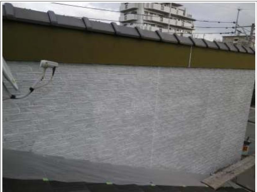
外壁塗装下塗り施工完了