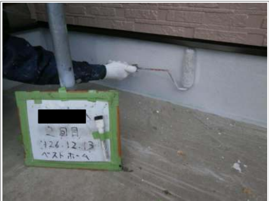
基礎塗装 2 回目施工中