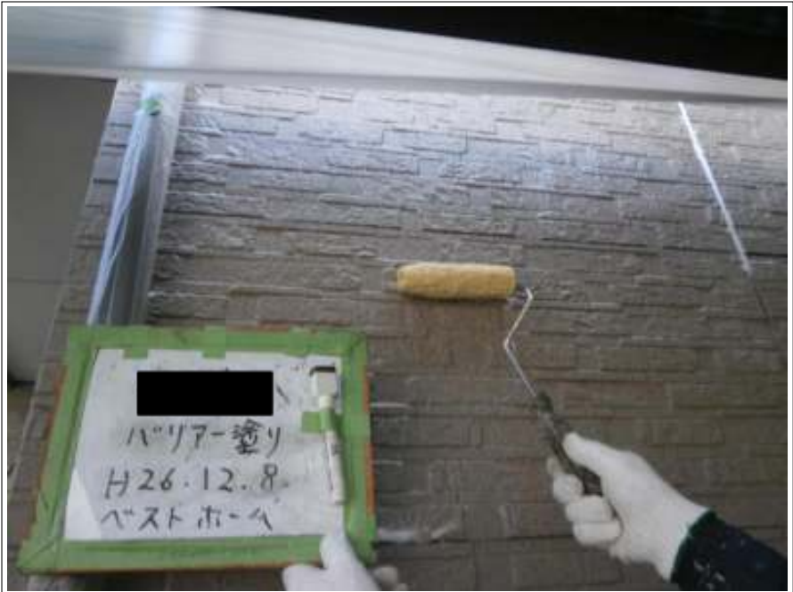
外壁バリアー施工中