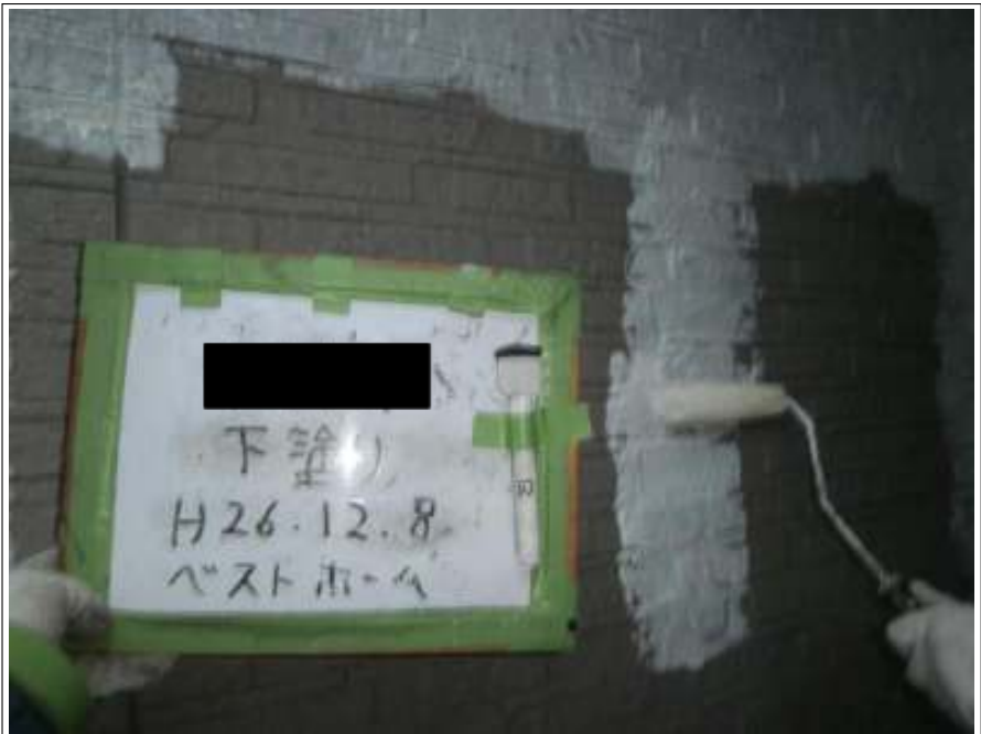
外壁塗装下塗り施工中