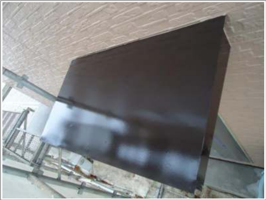
小庇塗装施工完了