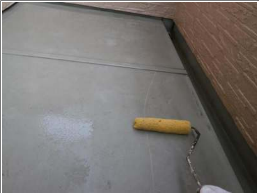
ベランダ塗装 1 回目施工中