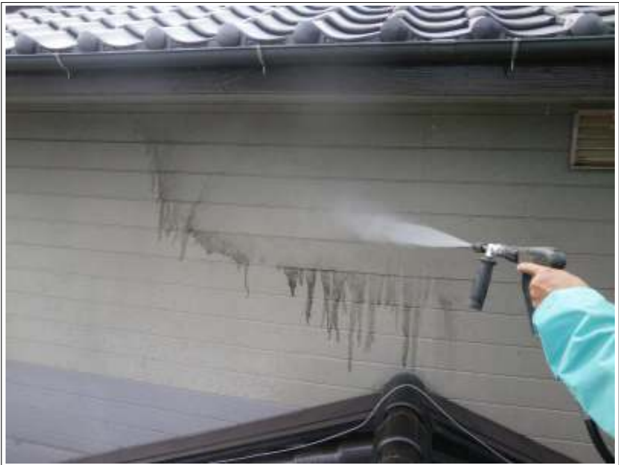
外壁高圧洗浄施工中