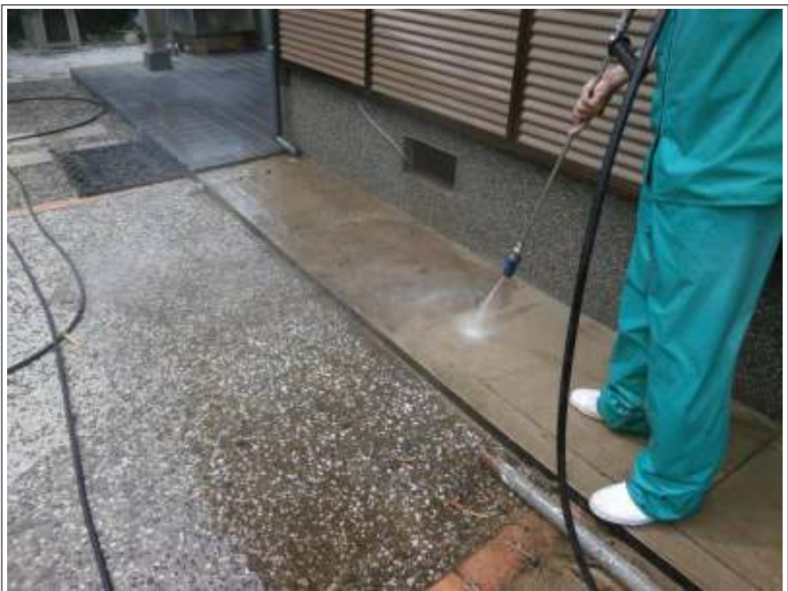
土間高圧洗浄施工中