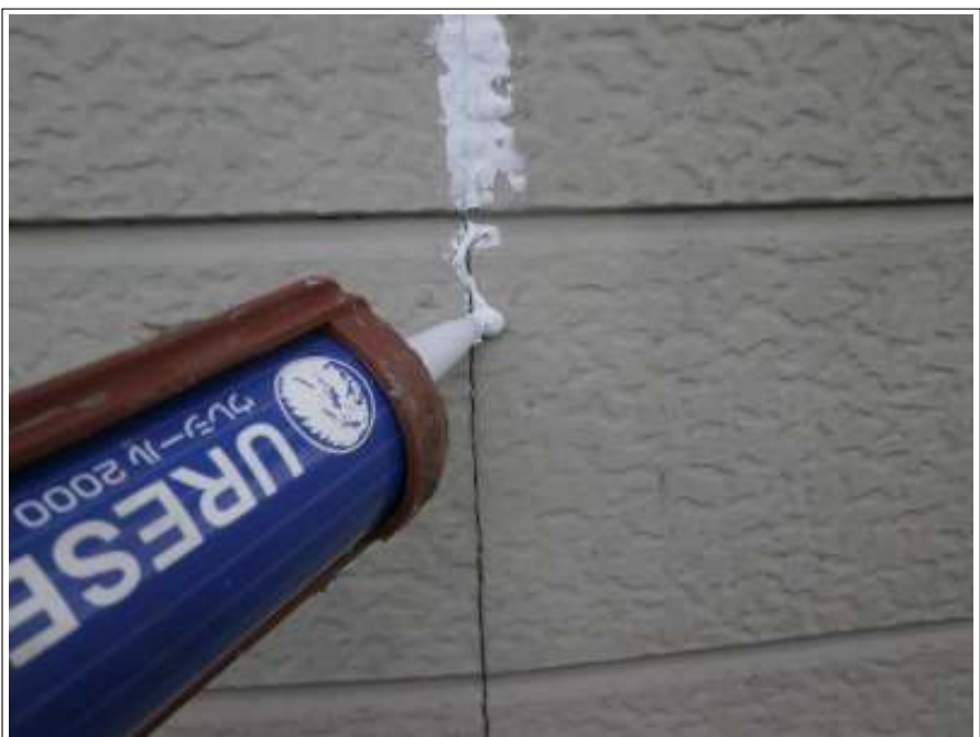
シーリング補修施工中