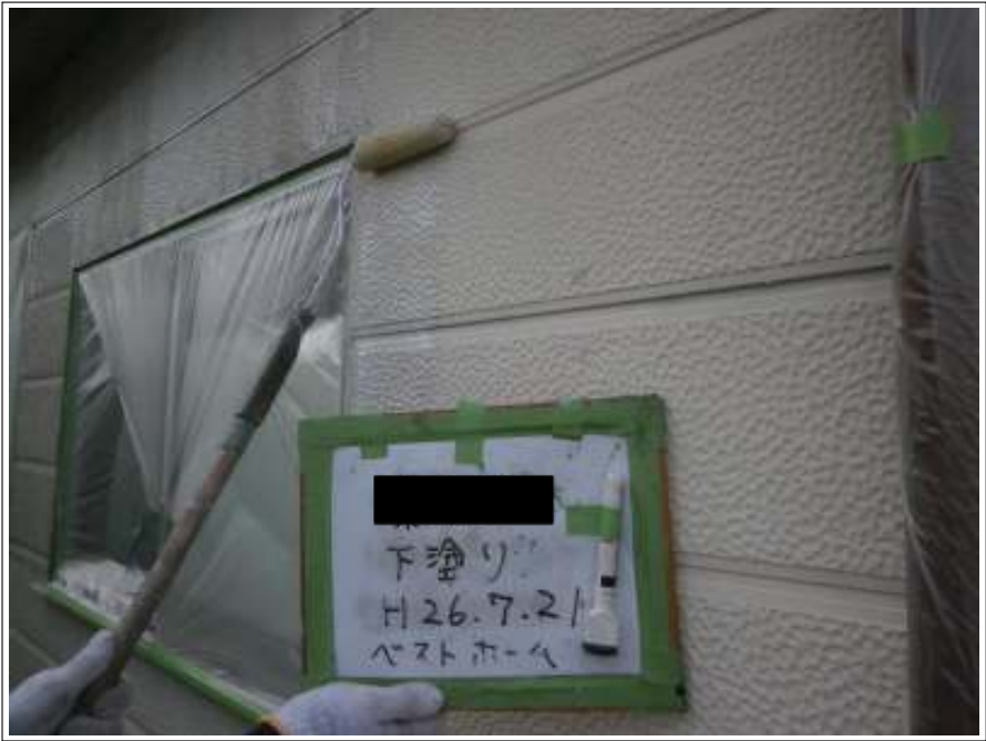
車庫外壁下塗り施工中