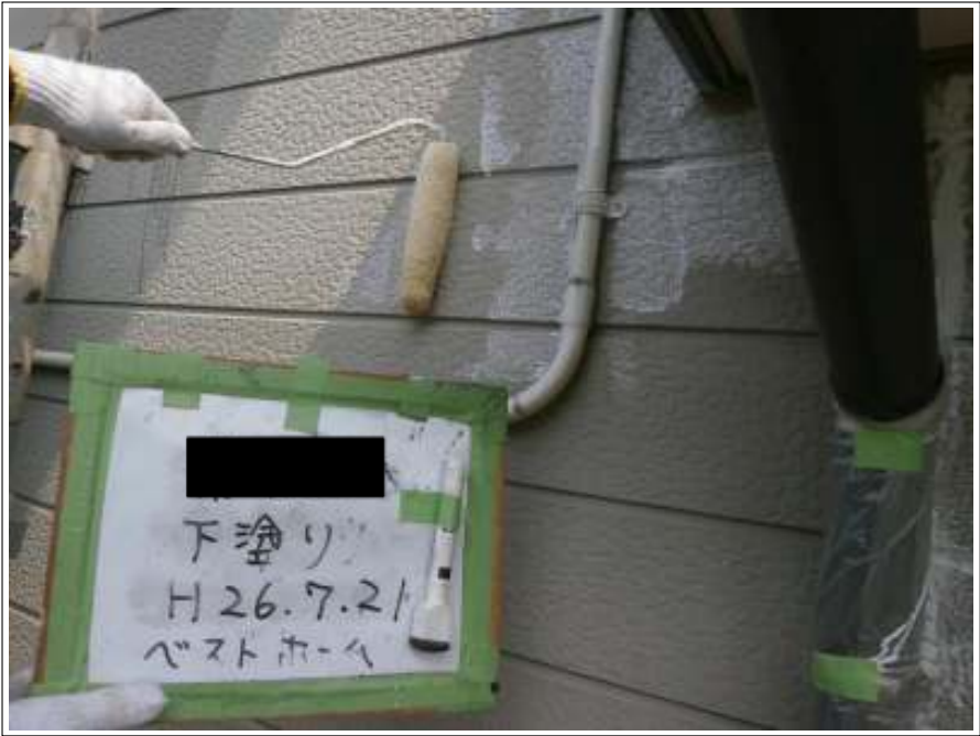
サイディング部外壁下塗り施工中