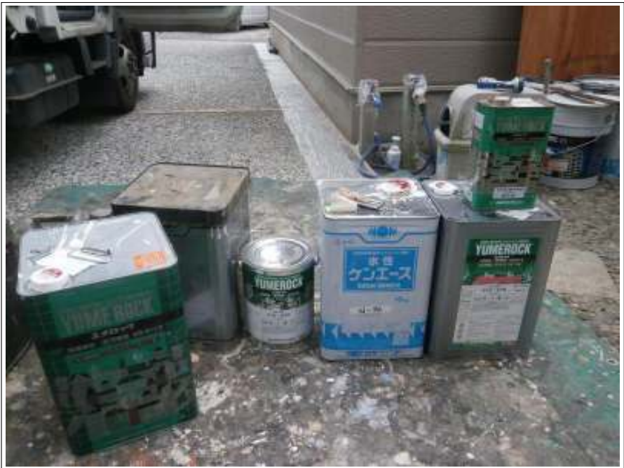
使用材料（付帯部分）