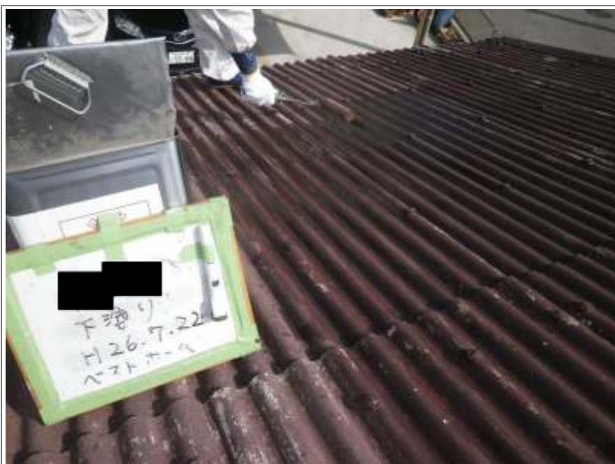
車庫屋根下塗り施工中