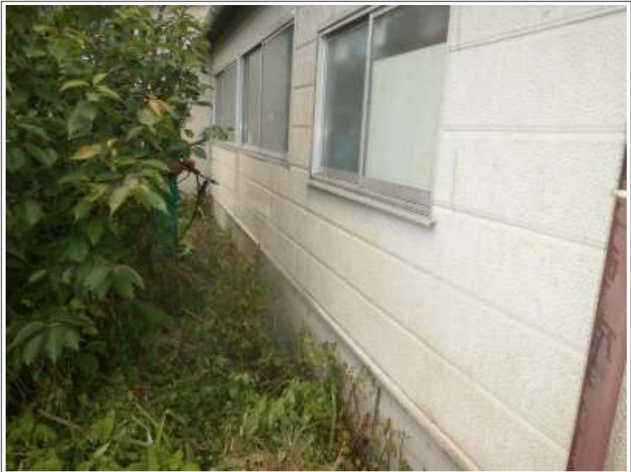
車庫外壁高圧洗浄施工後