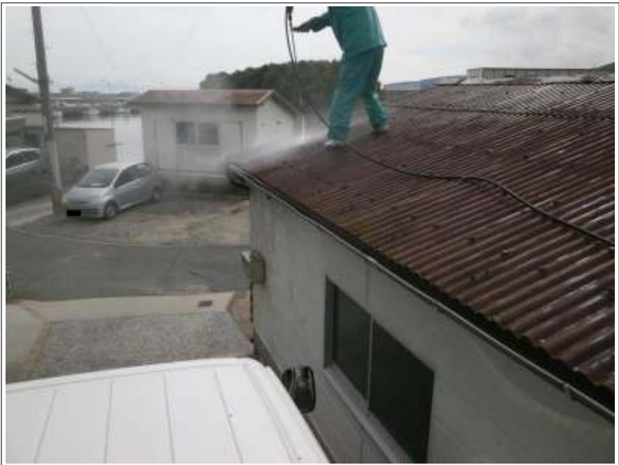
車庫屋根高圧洗浄施工中