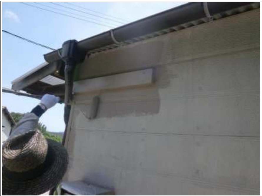
車庫外壁中塗り施工中