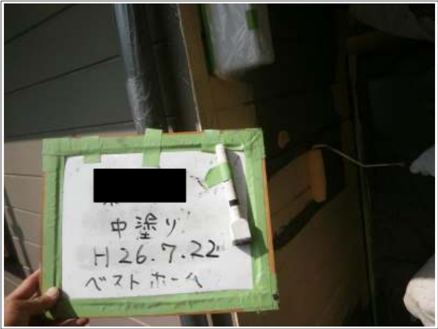
サイディング部外壁中塗り施工中