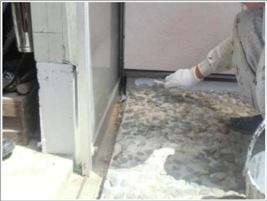
車庫基礎塗装施工中