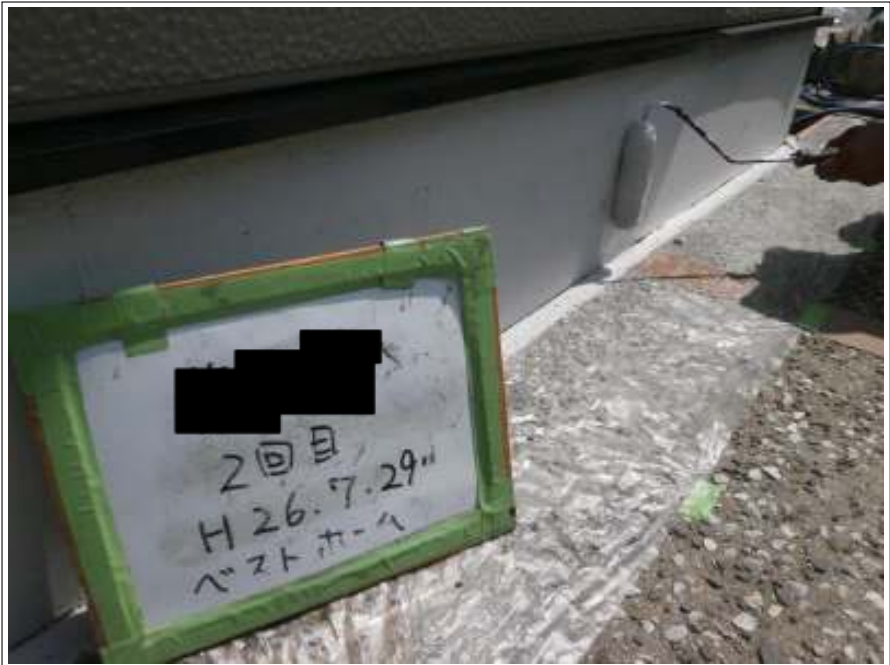
車庫基礎塗装施工中（2回目）