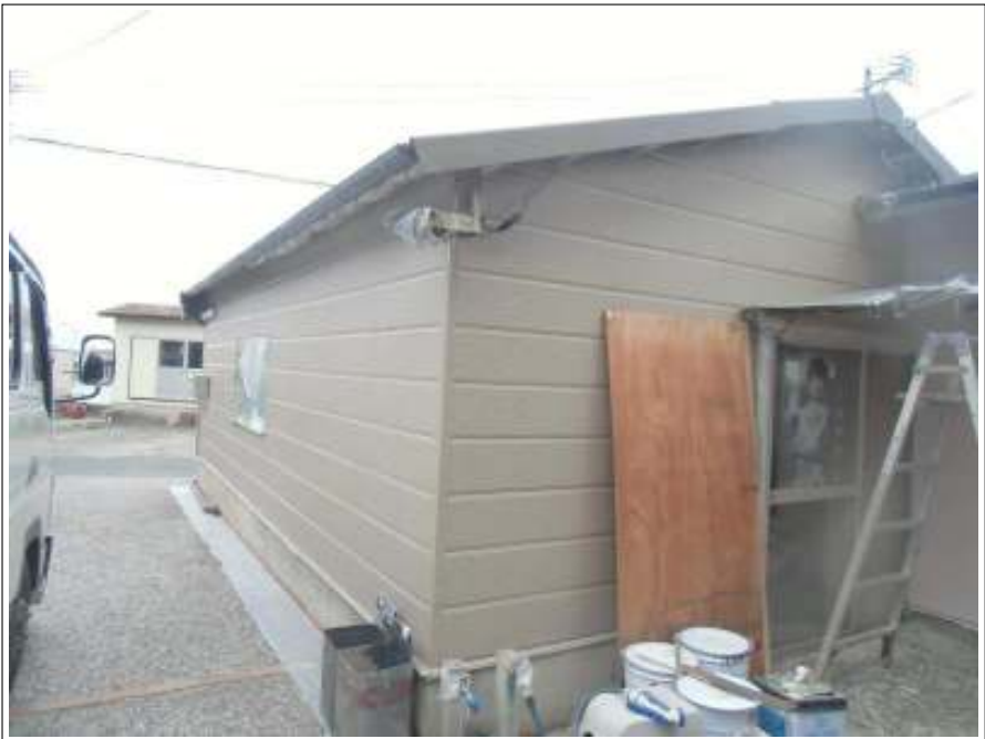
車庫外壁上塗り施工後