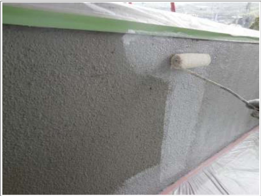
モルタル部外壁下塗り施工中