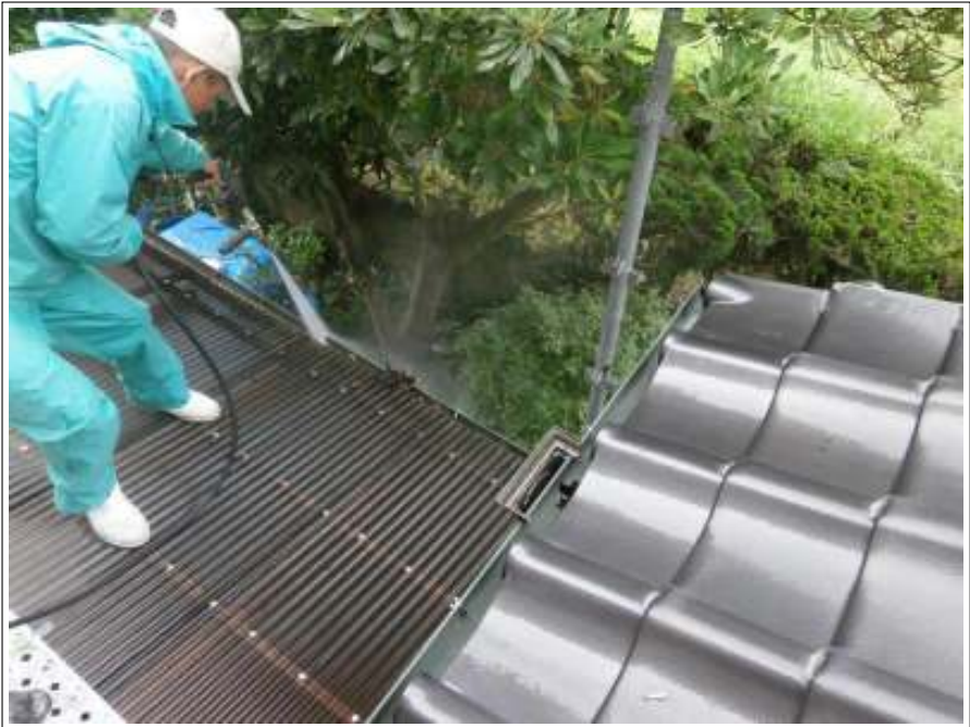
横樋高圧洗浄施工中