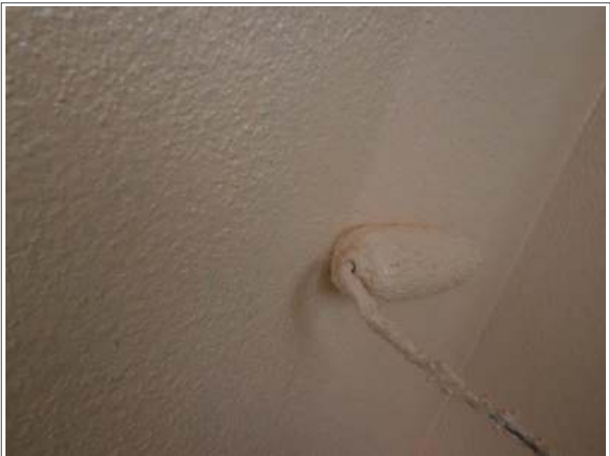
モルタル部外壁上塗り施工中