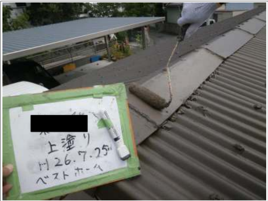
車庫屋根上塗り施工中