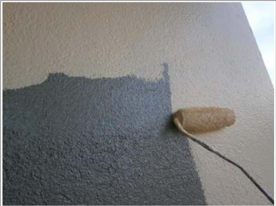
モルタル部外壁中塗り施工中