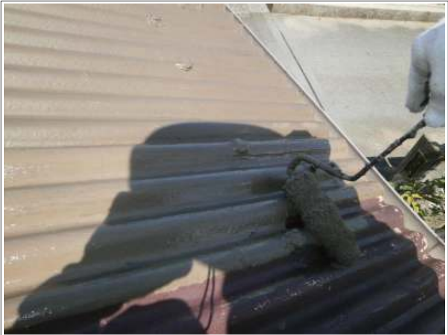
車庫屋根中塗り施工中