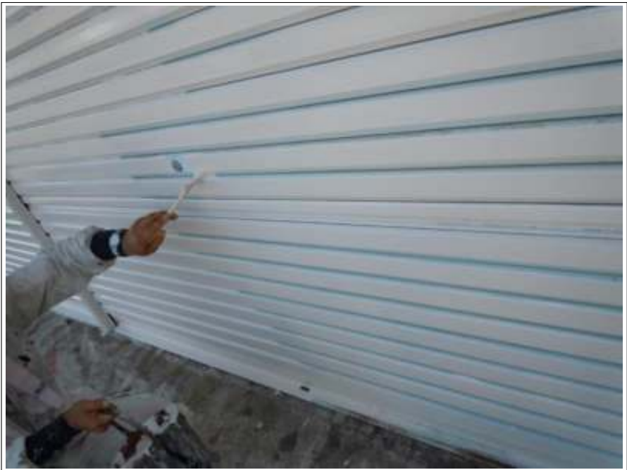
車庫シャッター塗装施工中