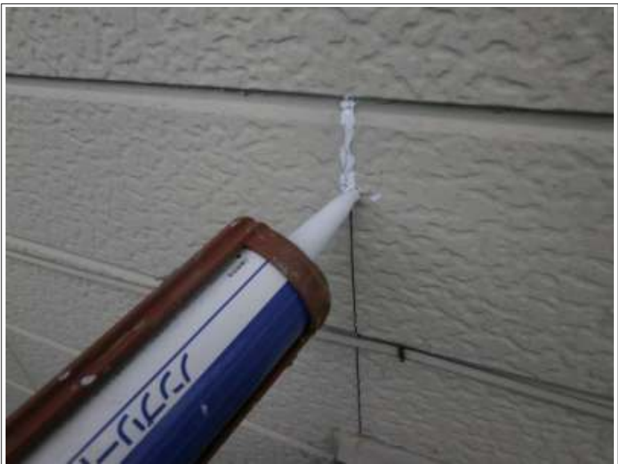
シーリング補修施工中