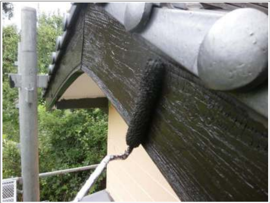
破風板塗装施工中