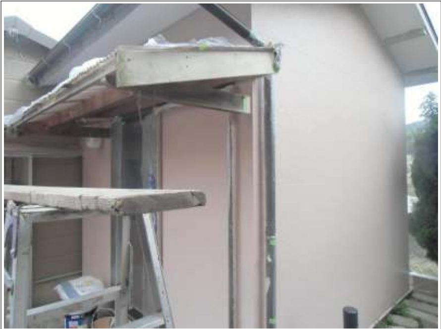
車庫外壁上塗り施工後