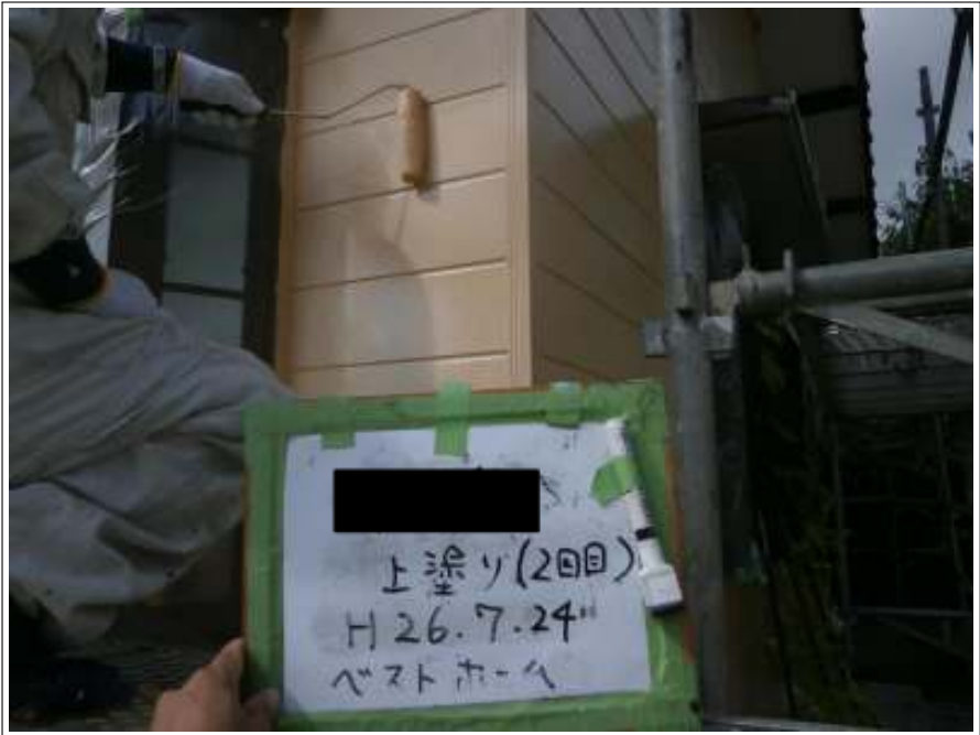
サイディング部外壁上塗り施工中 (2回目)