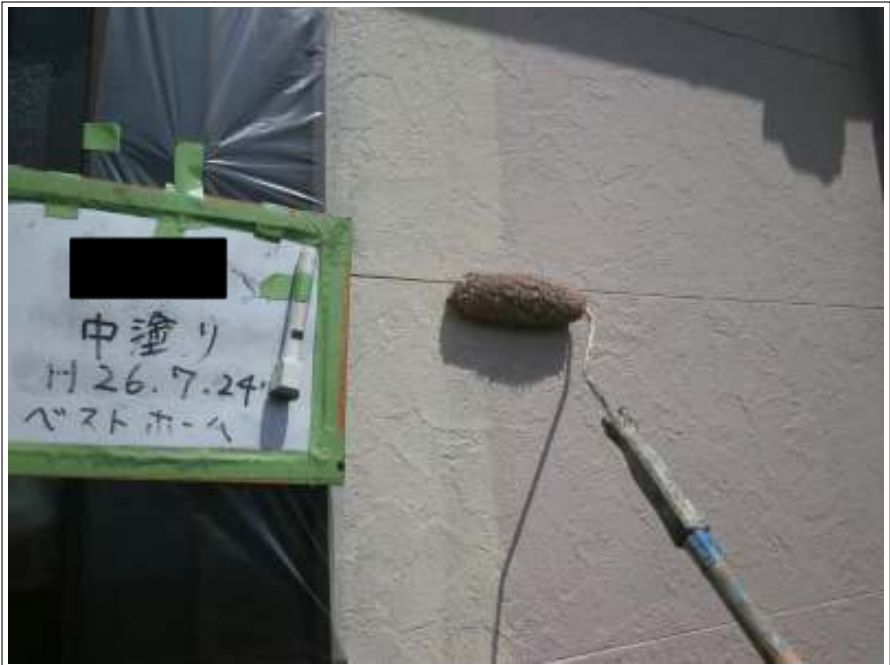
車庫外壁中塗り施工中