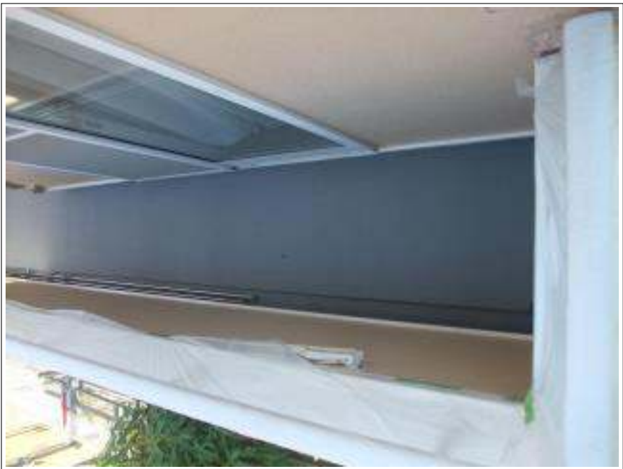
ベランダ床 施工完了