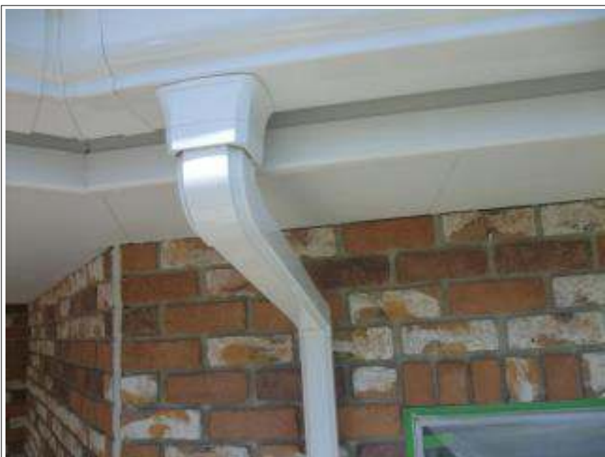
雨樋 上塗り施工完了