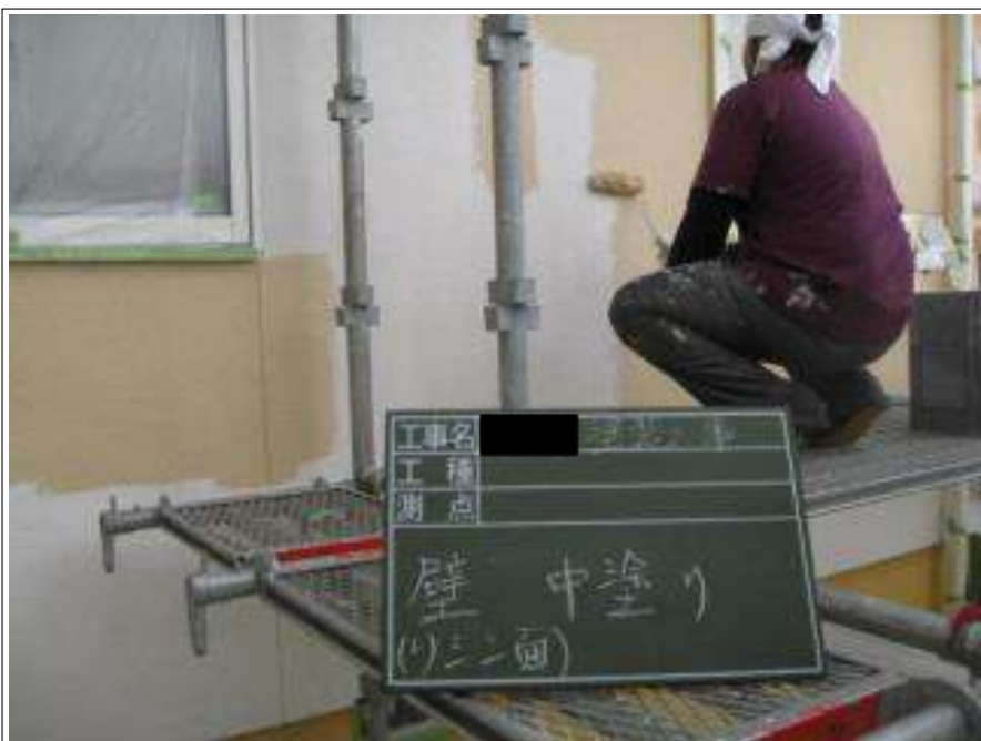
外壁 中塗り施工中