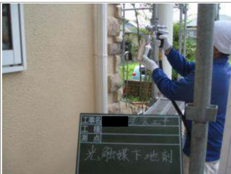
外壁レンガ部 下塗り施工中