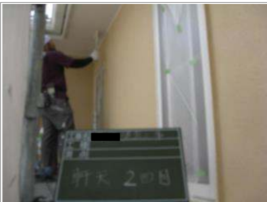
軒天 上塗り施工中(2回目)