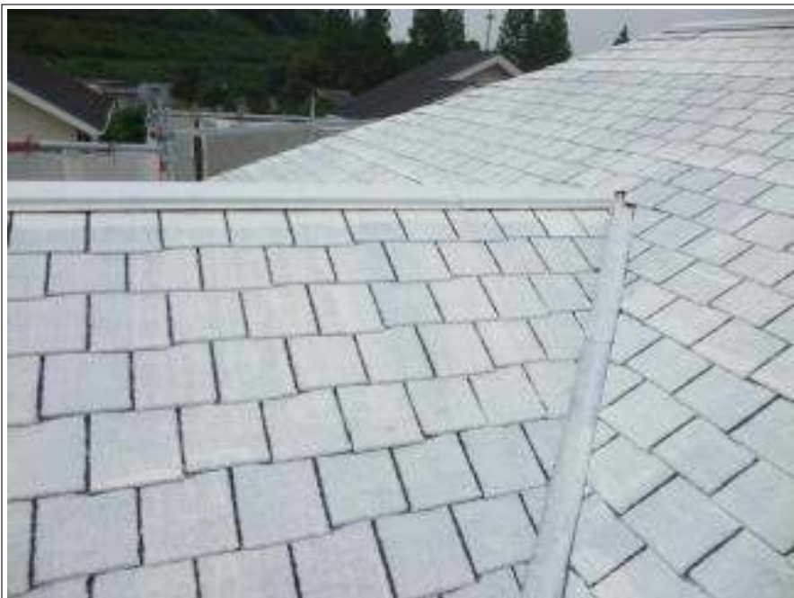
屋根 下塗り施工完了