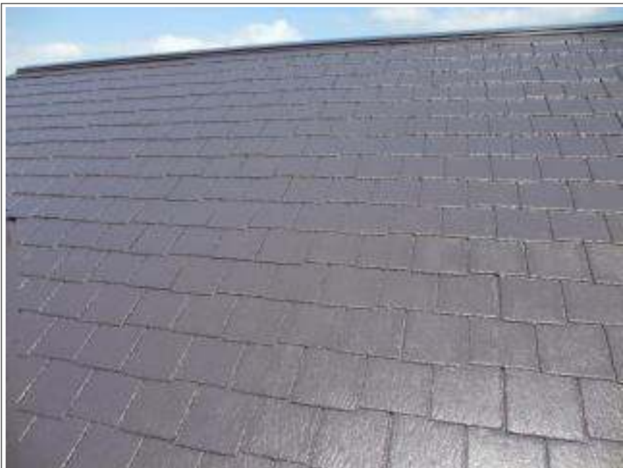
屋根 上塗り施工完了