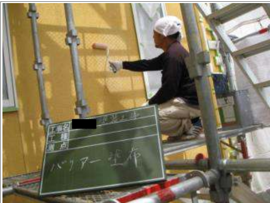
外壁 バリアー塗布施工中