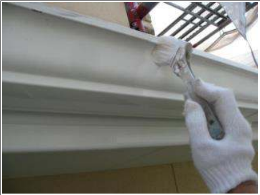
雨樋 上塗り施工中