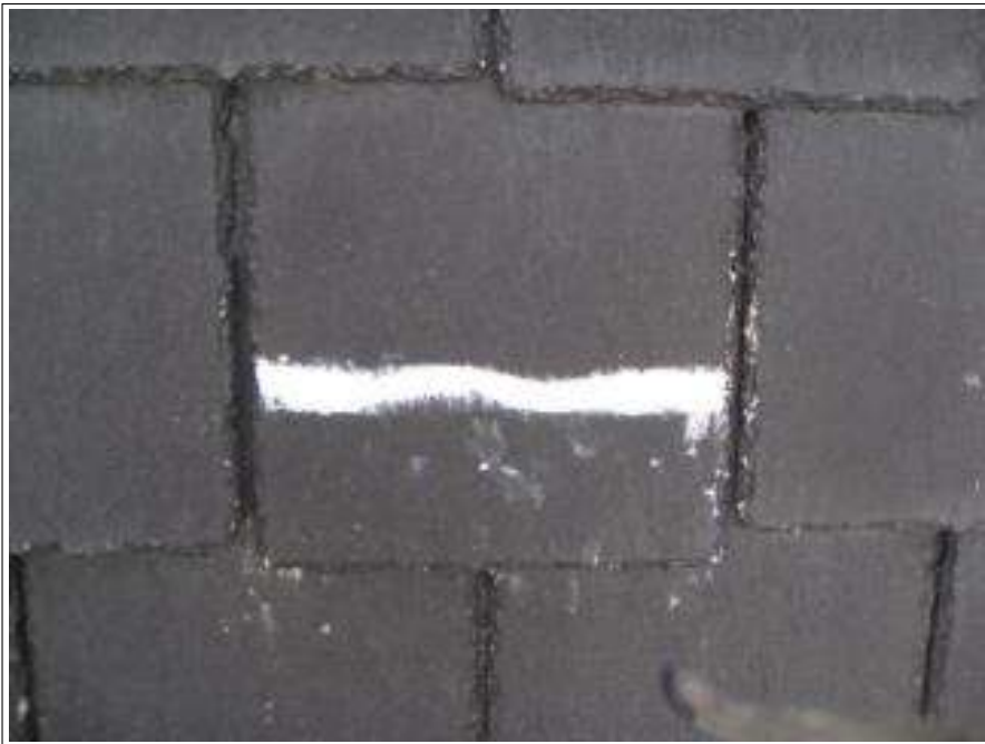
屋根 クラック補修施工後