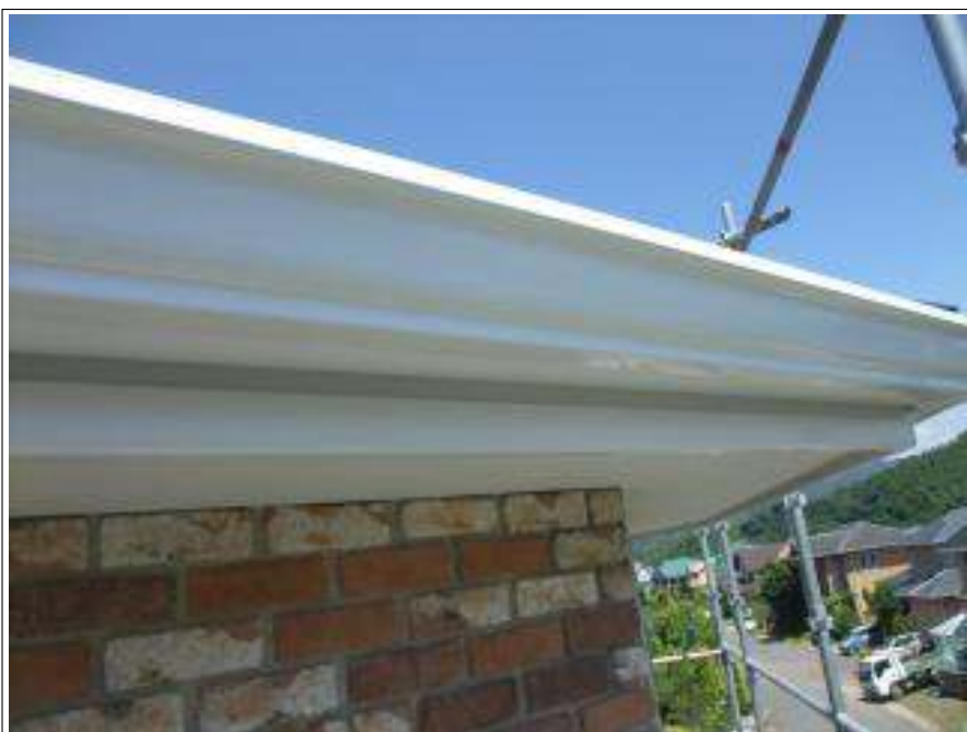
雨樋 上塗り施工完了