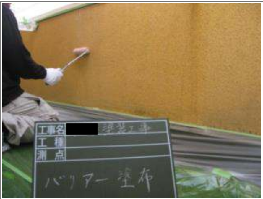
基礎 バリアー塗布施工中