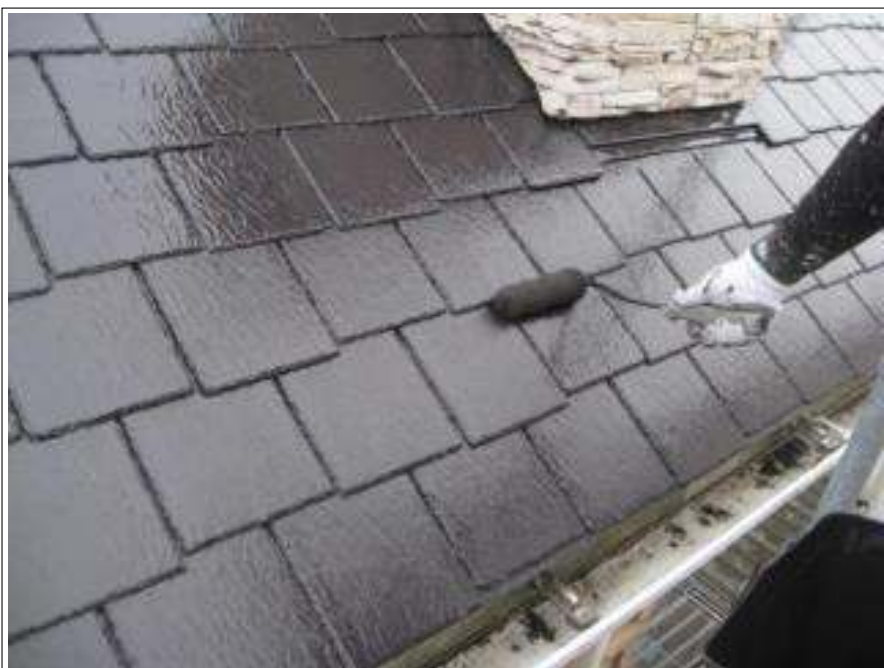
屋根 上塗り施工中