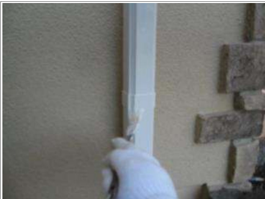
雨樋 上塗り施工中