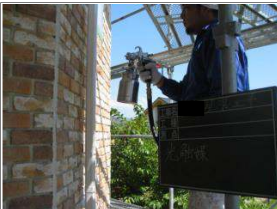
外壁レンガ部 光触媒施工中