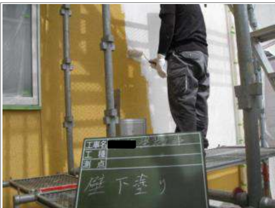
外壁 下塗り施工中