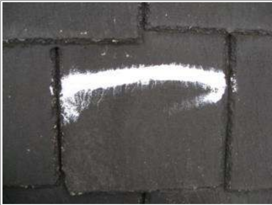
屋根 クラック補修施工後