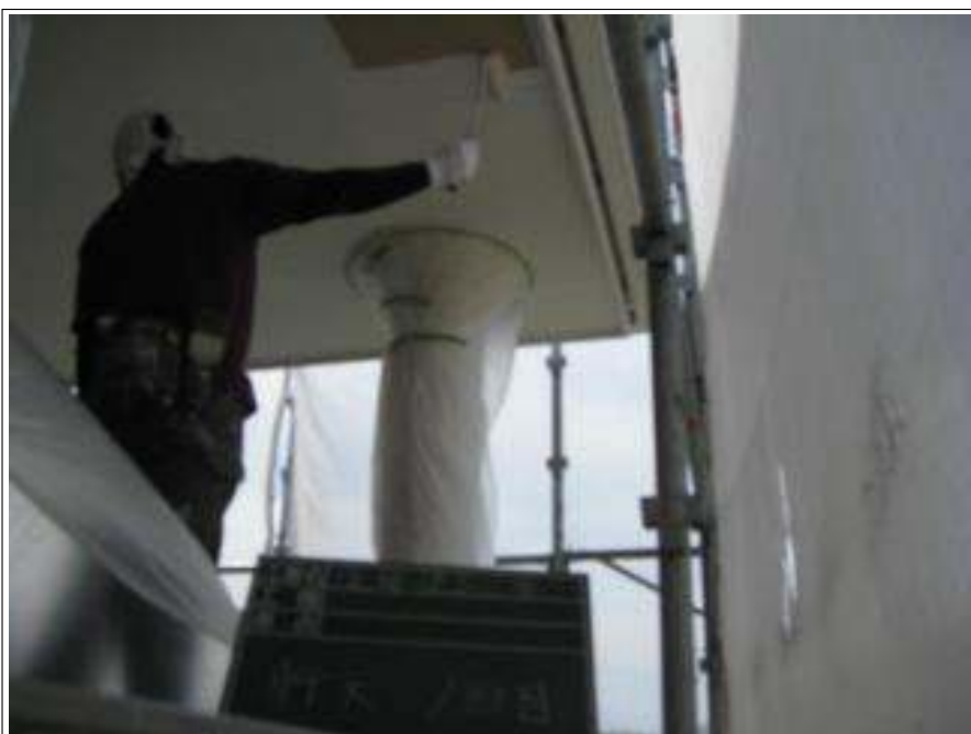
軒天 上塗り施工中(1回目)