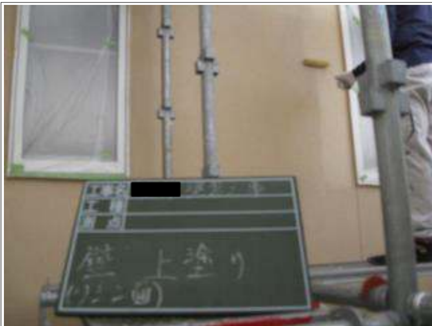
外壁 上塗り施工中