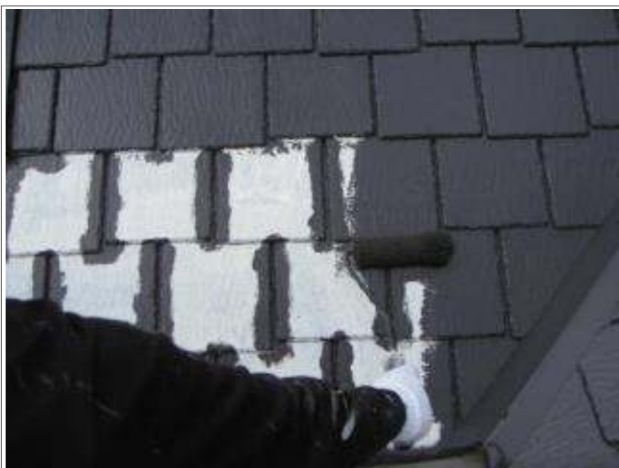
屋根 中塗り施工中