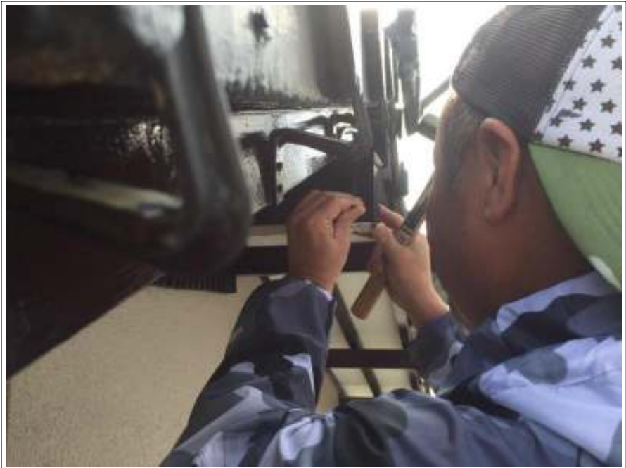
柵 ビス止め施工中