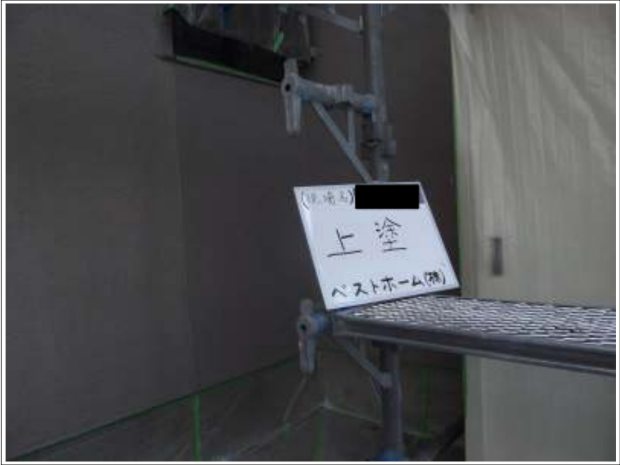
外壁 上塗り施工完了