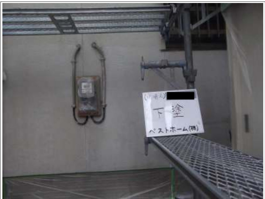
外壁 下塗り施工完了