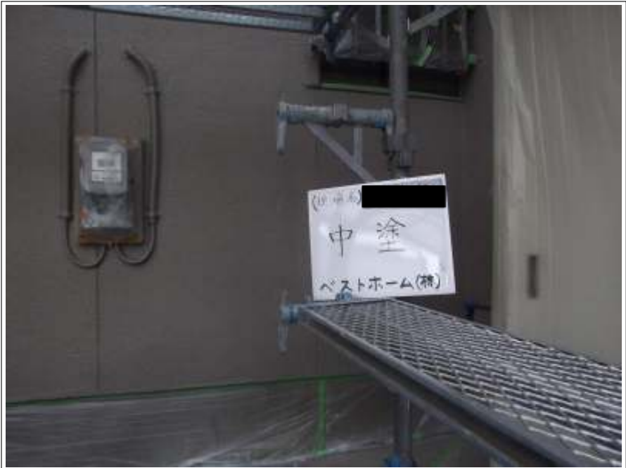
外壁 中塗り施工完了