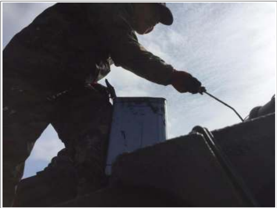
屋根 上塗り施工中