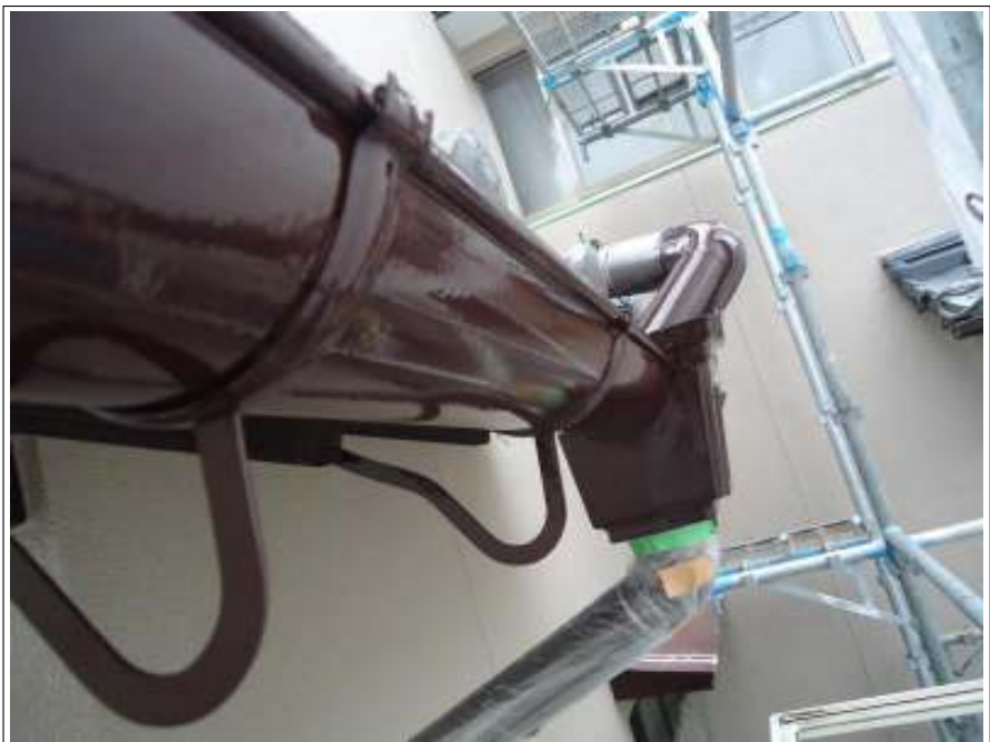
雨樋塗装 施工完了