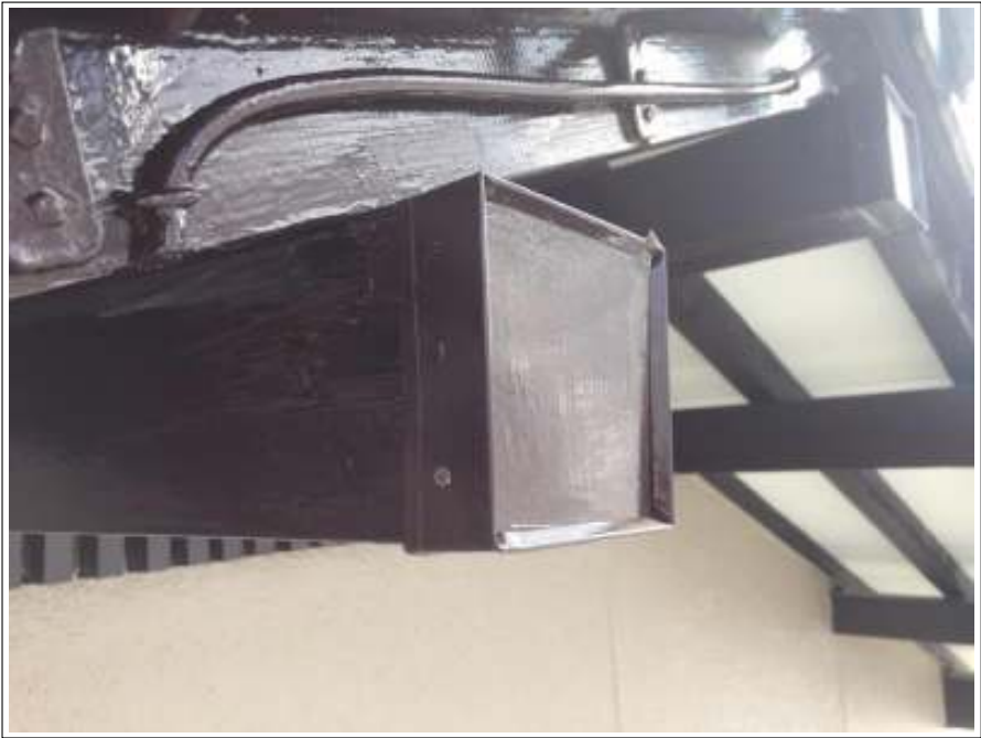
柵 ビス止め施工完了