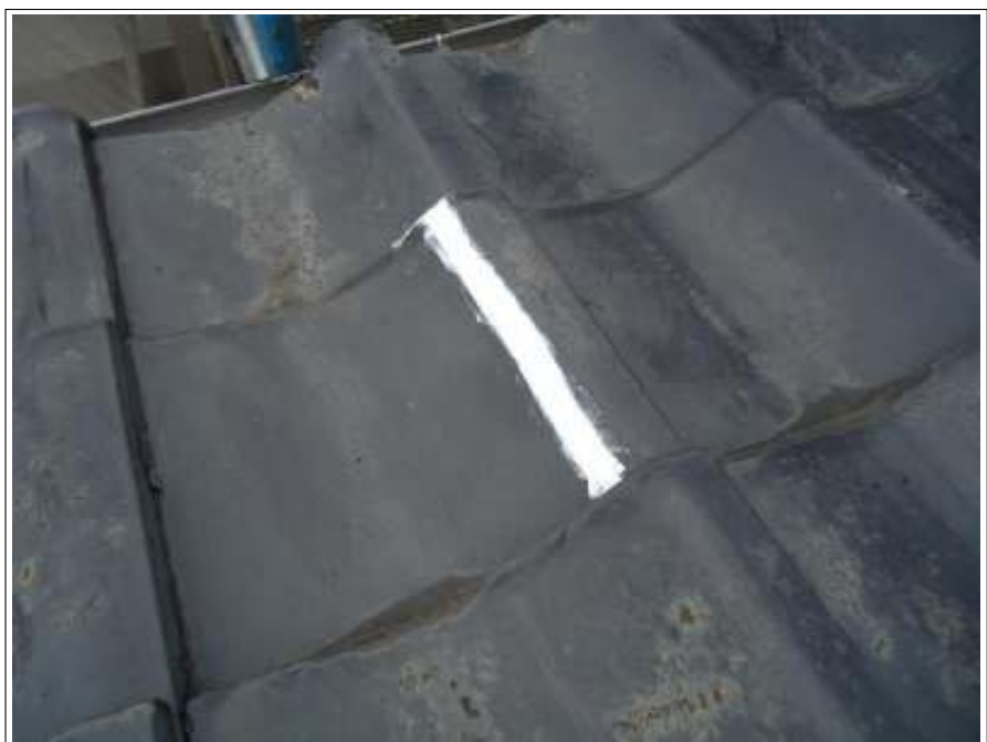
屋根 補修施工完了