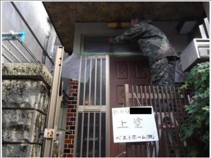
外壁 上塗り施工中