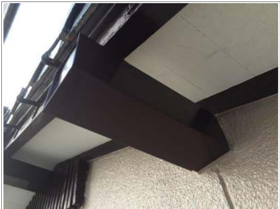
桁破損部 板金補修施工後