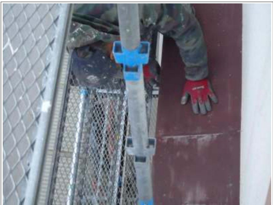
小庇 ケレン施工中