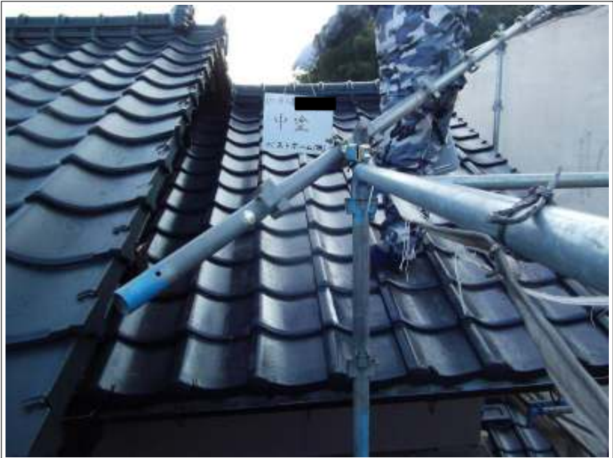
屋根 中塗り施工完了