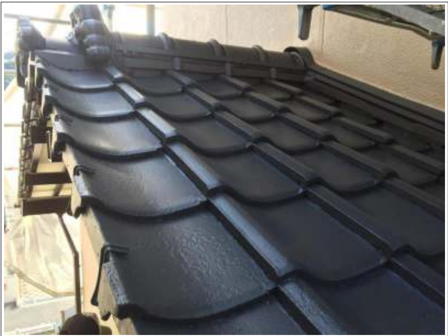
屋根 上塗り施工完了