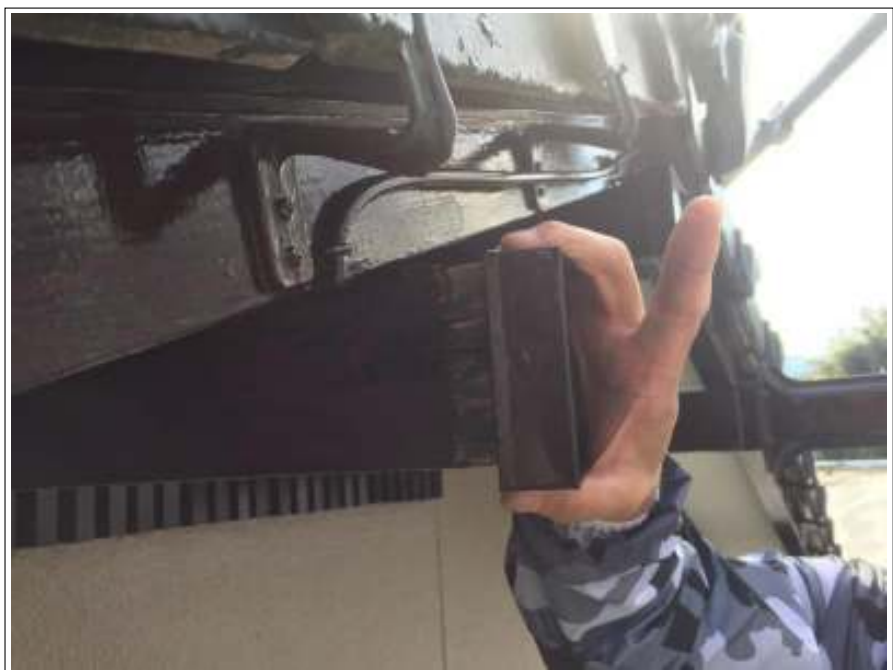
桁 ビス止め施工中