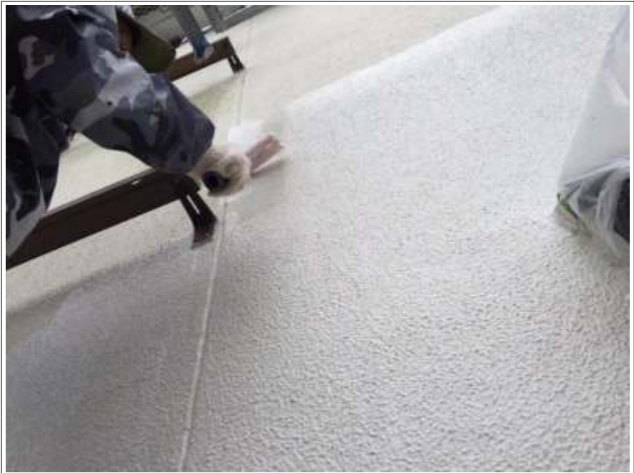
外壁 下塗り施工中