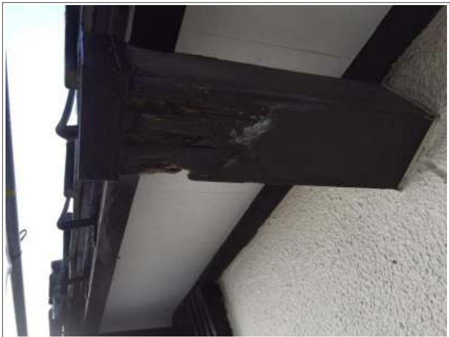
桁破損部 板金補修施工前