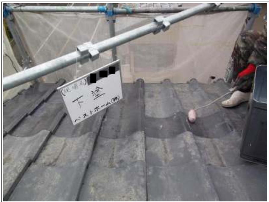
屋根 下塗り施工中