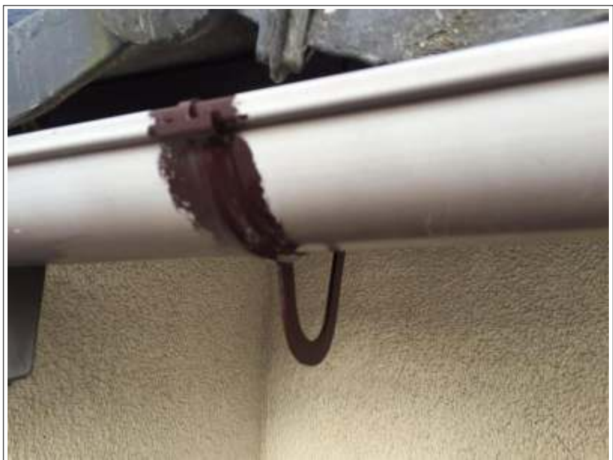
鉄部 サビ止め施工中