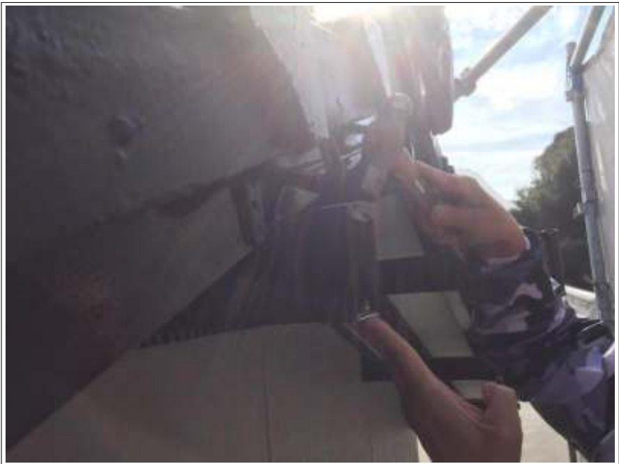
柵 ビス止め施工中