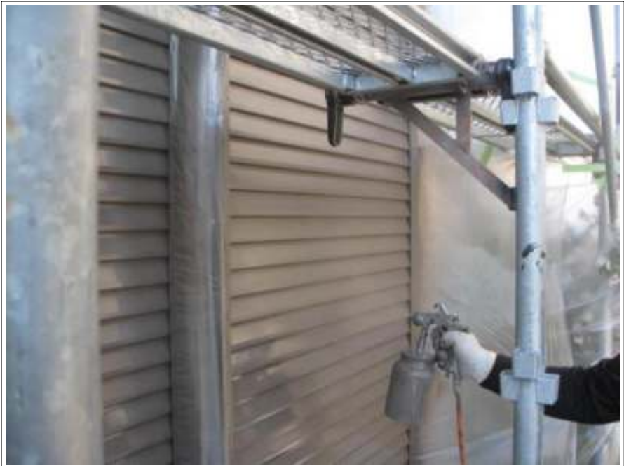
雨戸 上塗り施工中