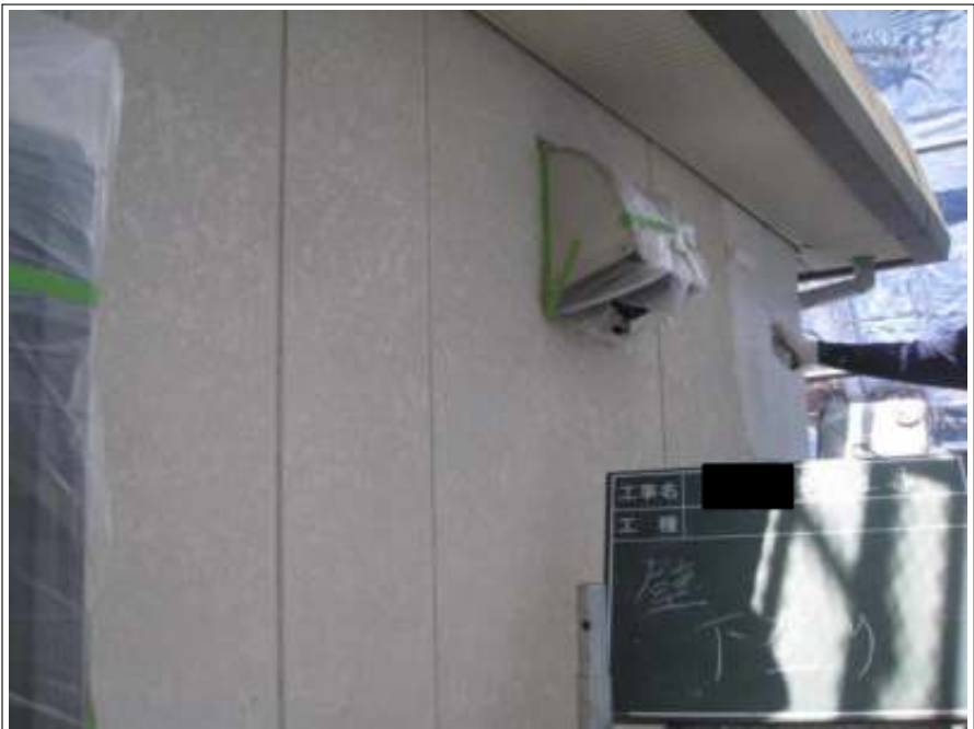
外壁 下塗り 施工中