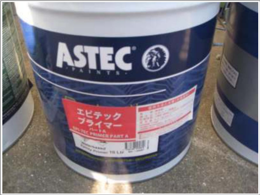
屋根 下塗り使用材料