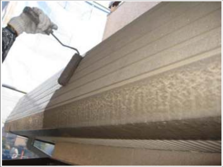
パラペット上塗り(1回目) 施工中