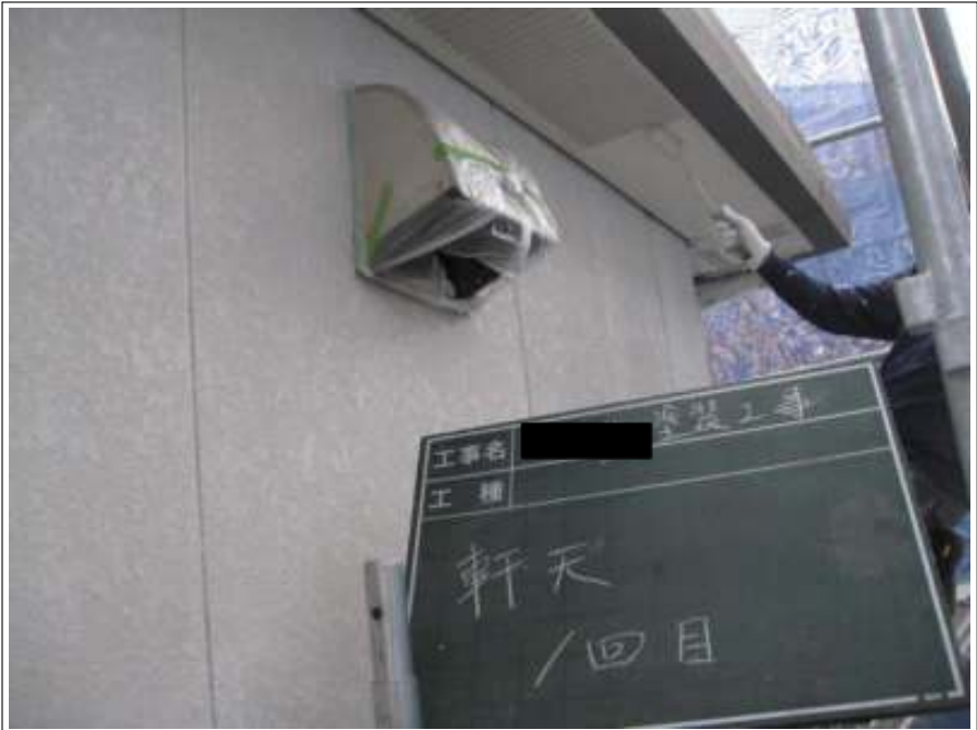
軒天 上塗り（1回目）施工中