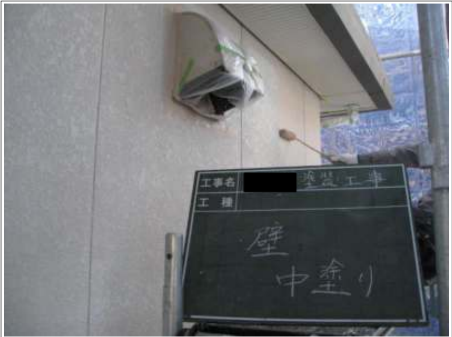
外壁 中塗り施工中