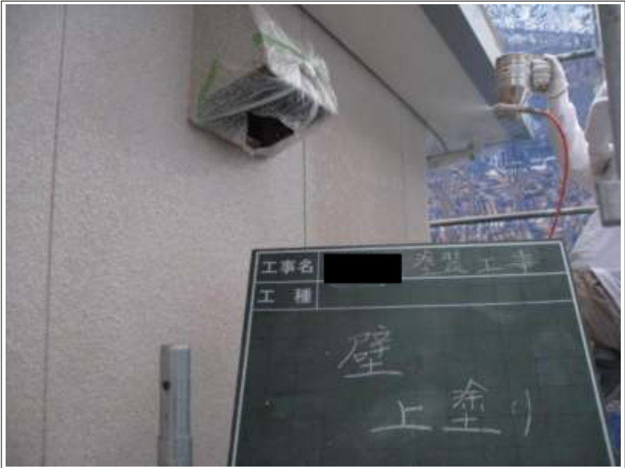
外壁 上塗り施工中