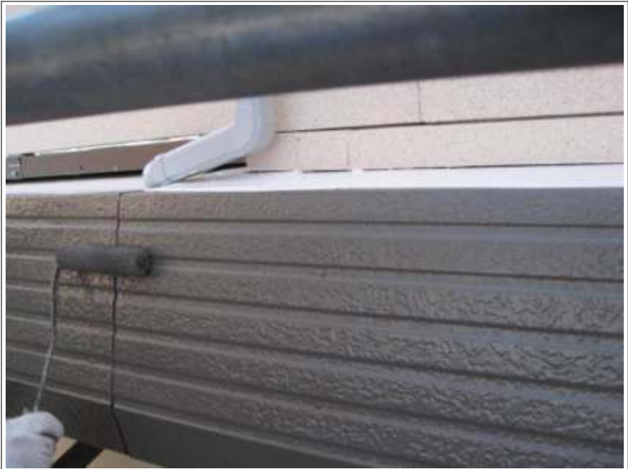
パラペット上塗り(2回目) 施工中