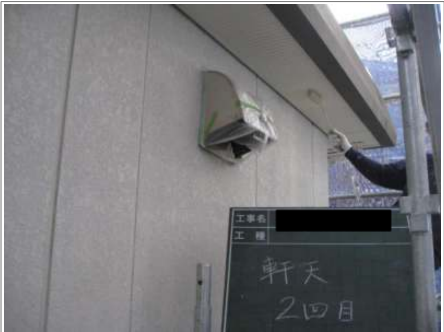
軒天 上塗り（2回目）施工中