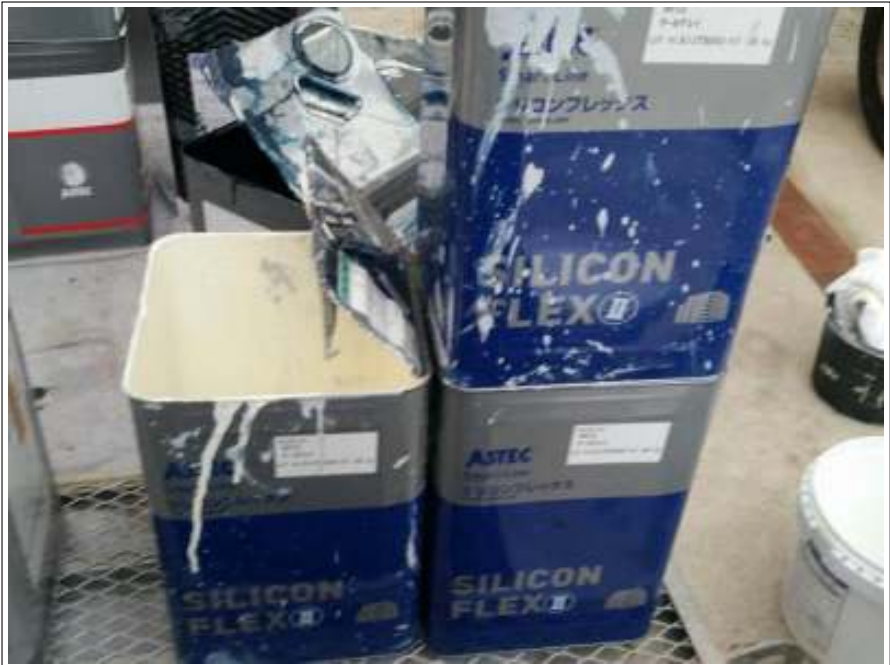
外壁 下塗り使用材料空缶