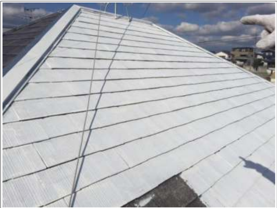
屋根 下塗り施工中