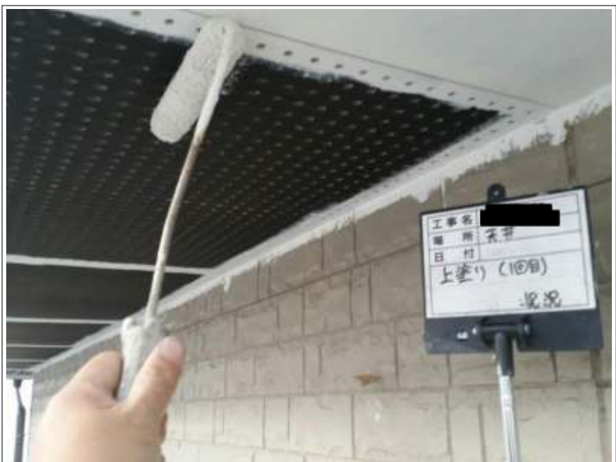
軒天 上塗り施工中