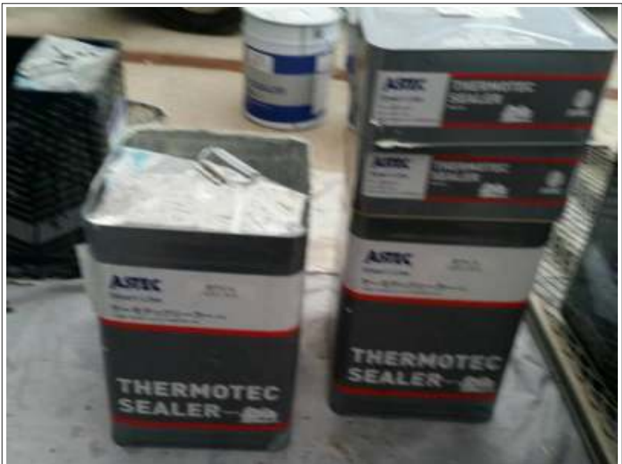
屋根 下塗り使用材料空缶