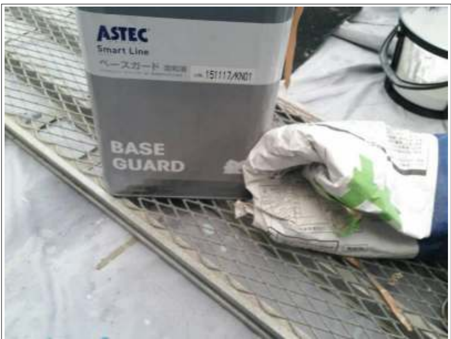
基礎塗り 使用材料