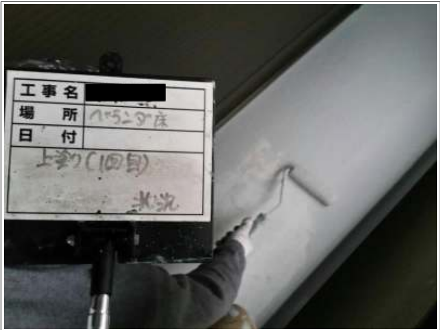
ベランダ床 上塗り(1回目) 施工中