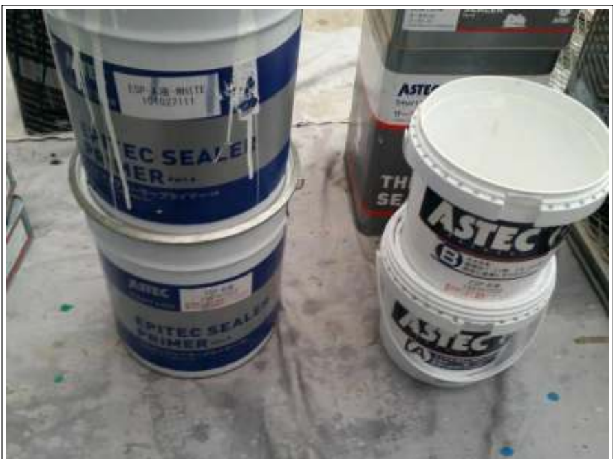
外壁 下塗り使用材料空缶