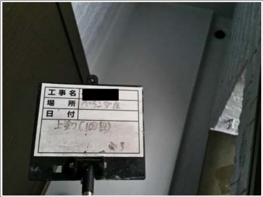
ベランダ床 上塗り(1回目) 施工完了