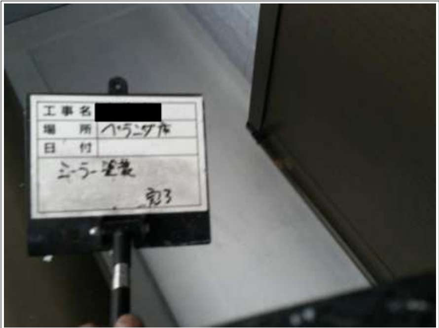
ベランダ床 下塗り施工完了