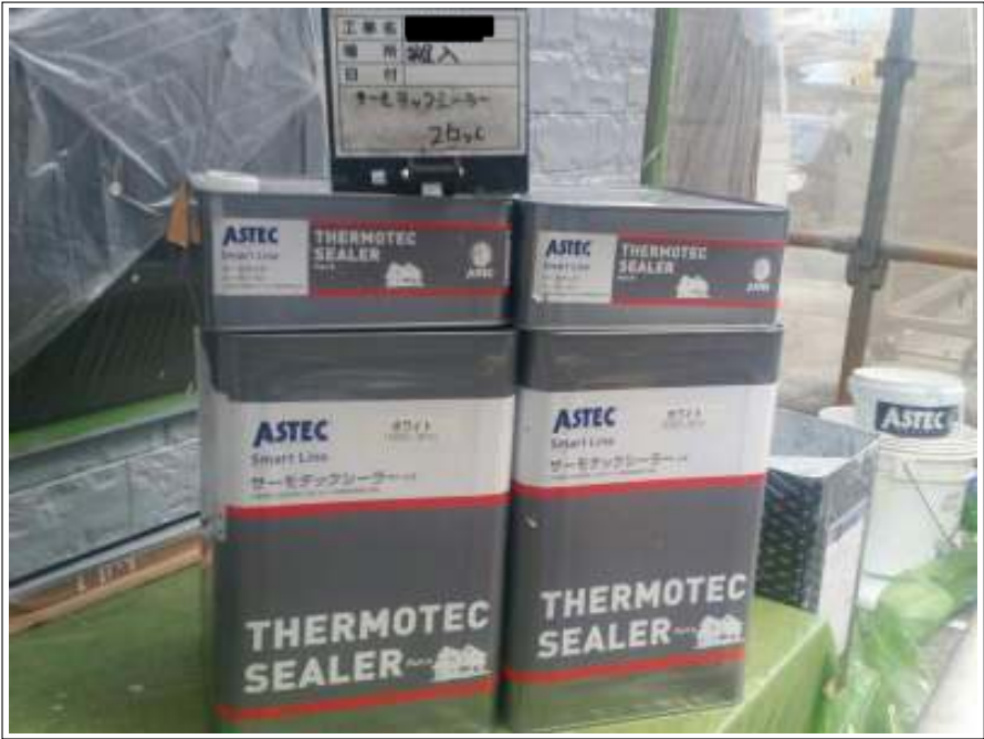
屋根 下塗り使用材料