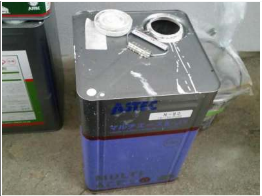
付帯 使用材料空缶