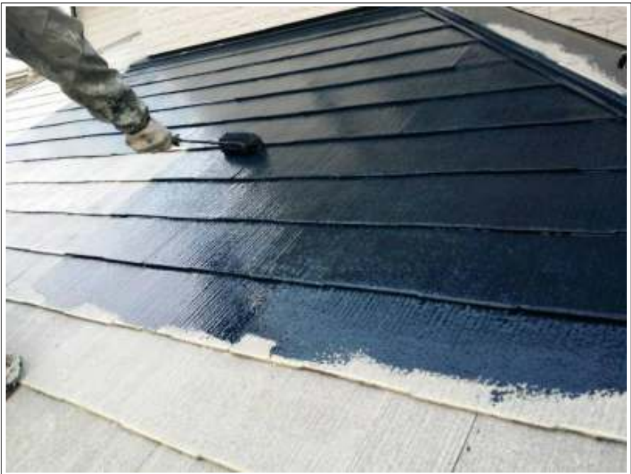
屋根 中塗り施工中