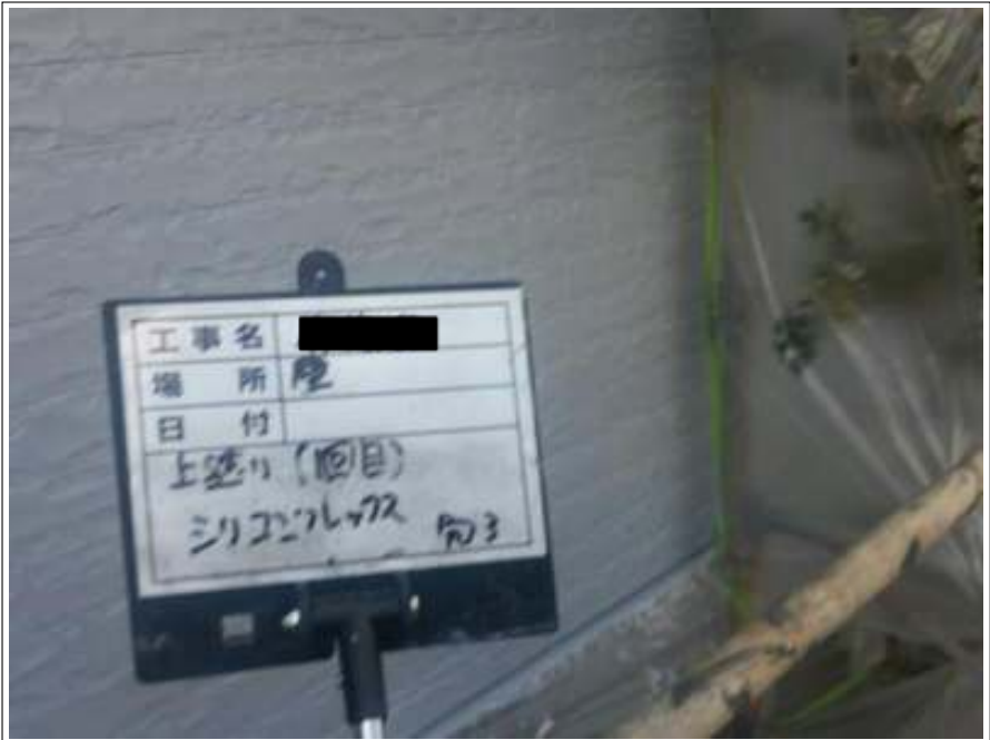
外壁 上塗り（1回目）施工完了