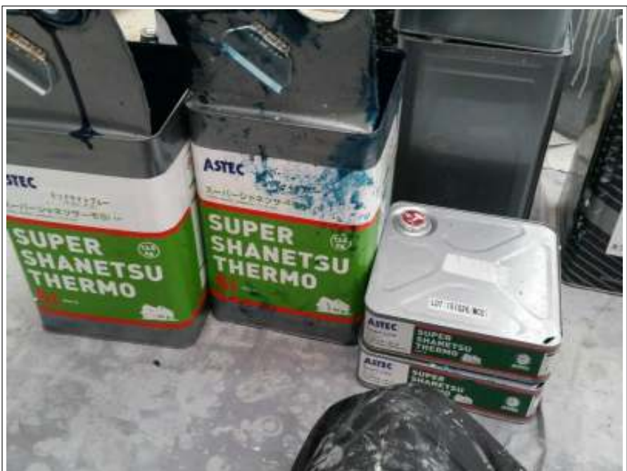
屋根 上塗り使用材料空缶