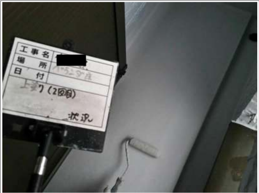
ベランダ床 上塗り(2回目) 施工中