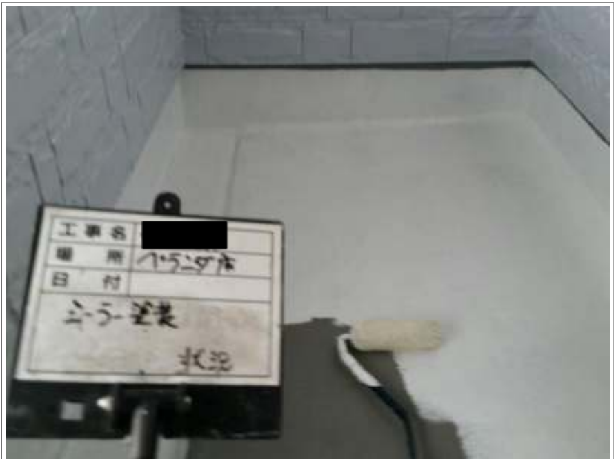
ベランダ床 下塗り施工中