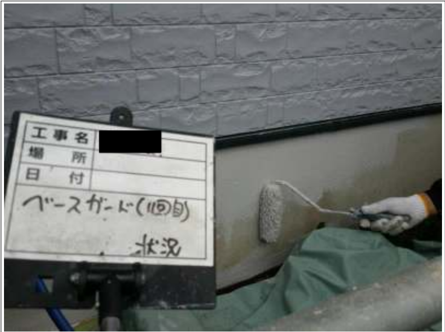
基礎 上塗り（1回目）施工中