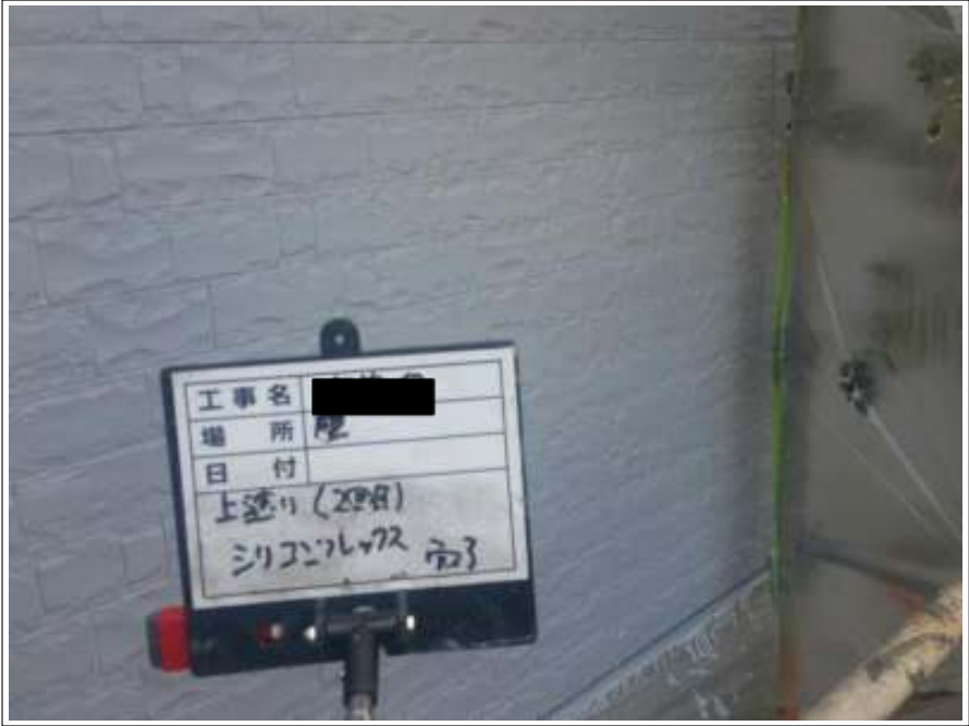
外壁 上塗り（2回目）施工完了