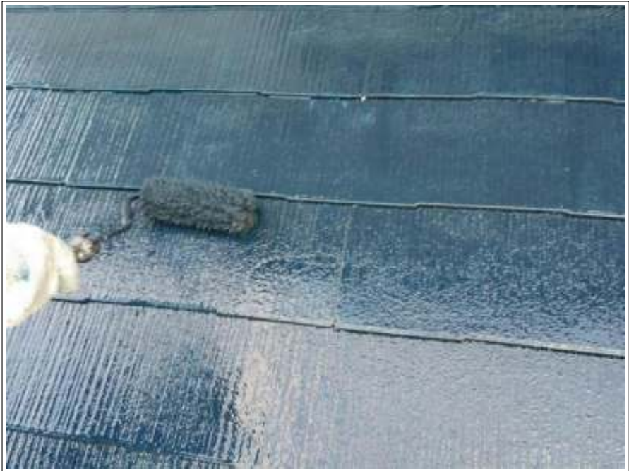
屋根 上塗り施工中