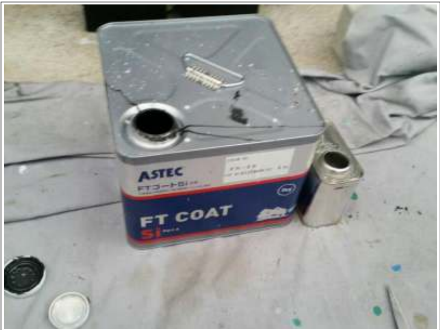
付帯 使用材料空缶