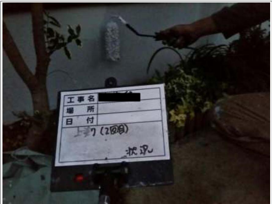
基礎 上塗り（2回目）施工中