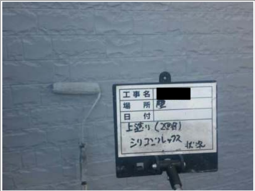
外壁 上塗り（2回目）施工中