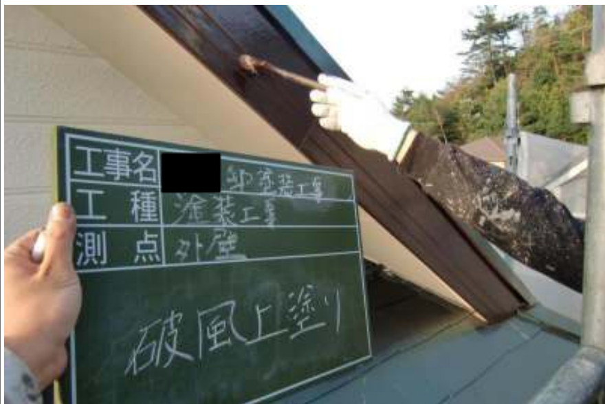
破風板二回目施工中