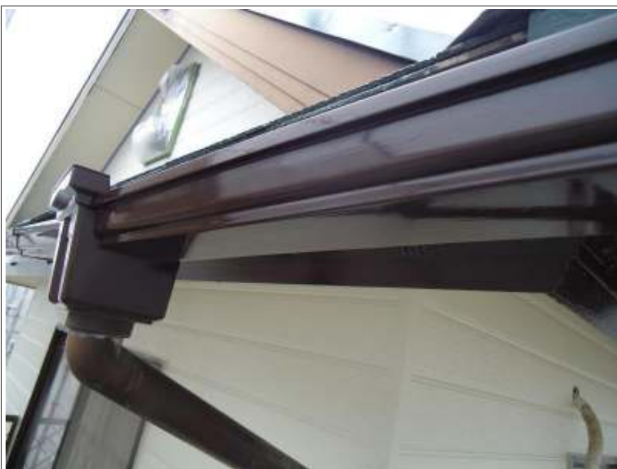
樋上塗り施工完了