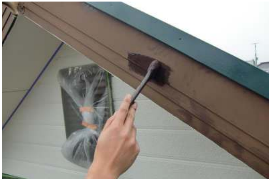
破風板塗装一回目施工中