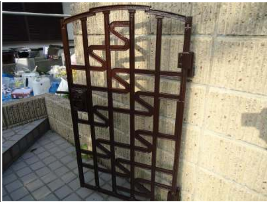
門扉塗装施工完了