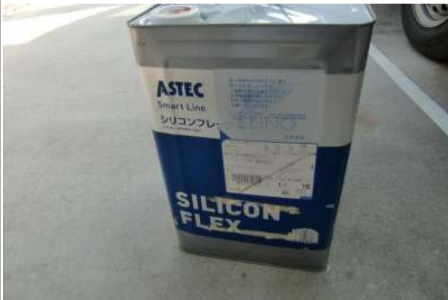
外壁用仕上塗料缶