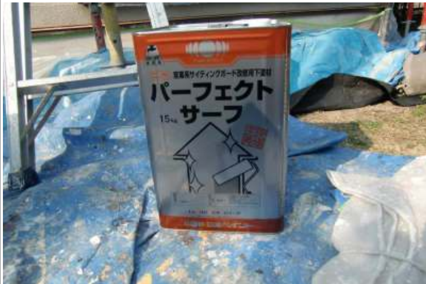
外壁下塗り塗料缶