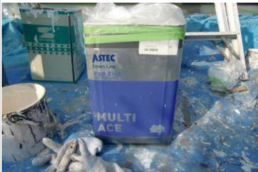
軒天上塗り塗料缶