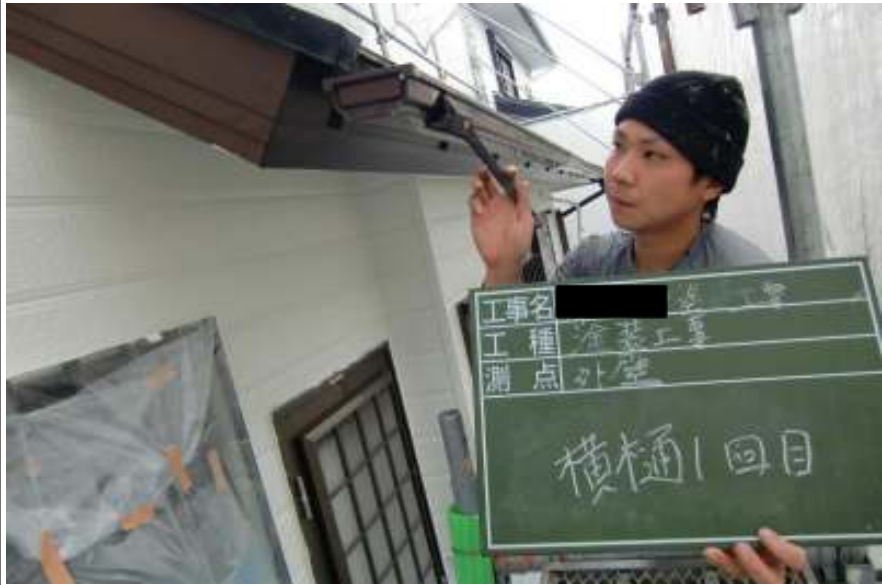
樋一回目塗装施工中