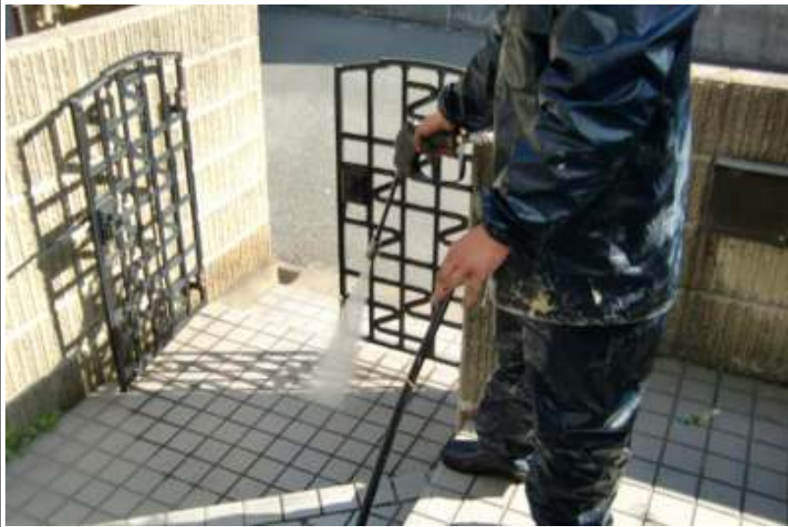
玄関前高圧洗浄中