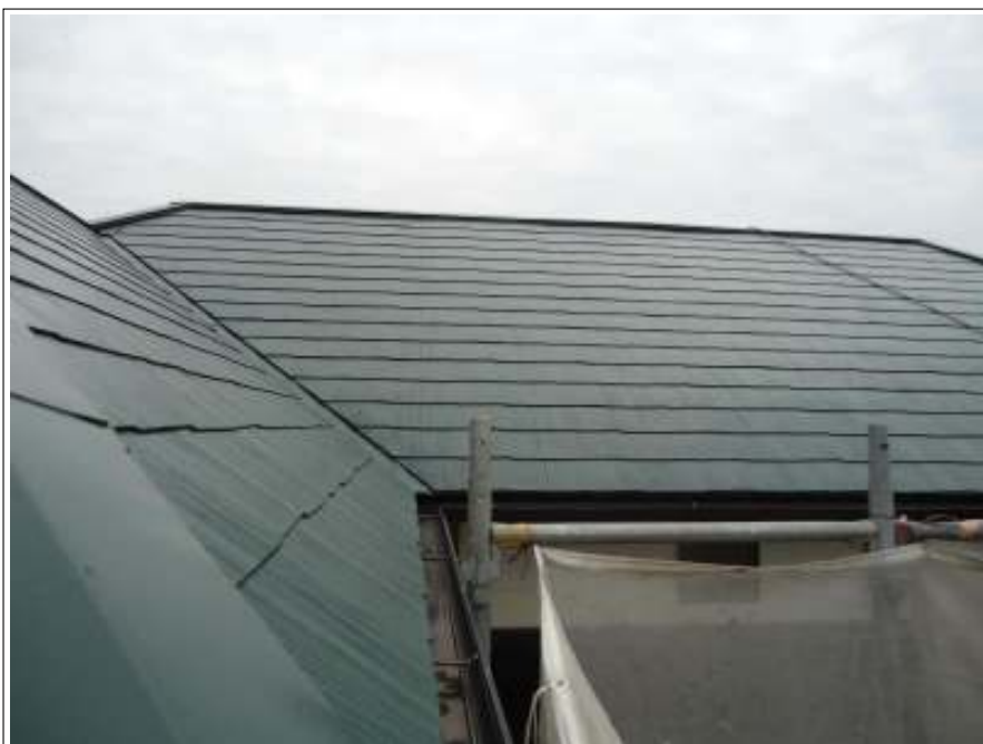
屋根塗装上塗り施工完了