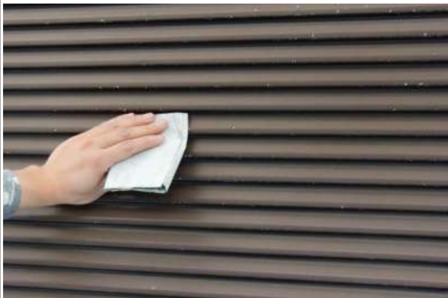
雨戸ケレン施工中