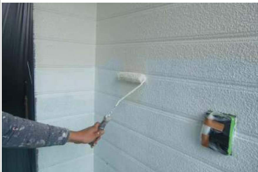
外壁塗装中塗り施工中