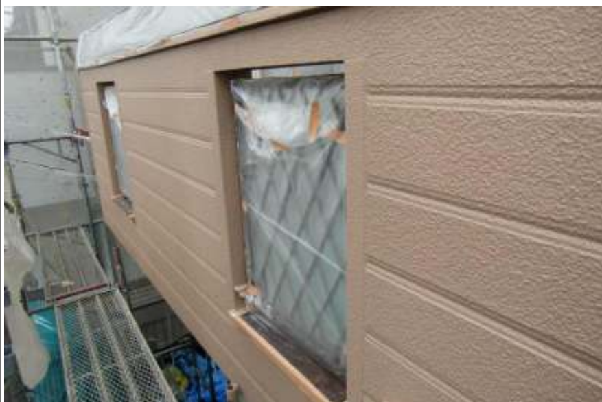
外壁塗装上塗り施工完了