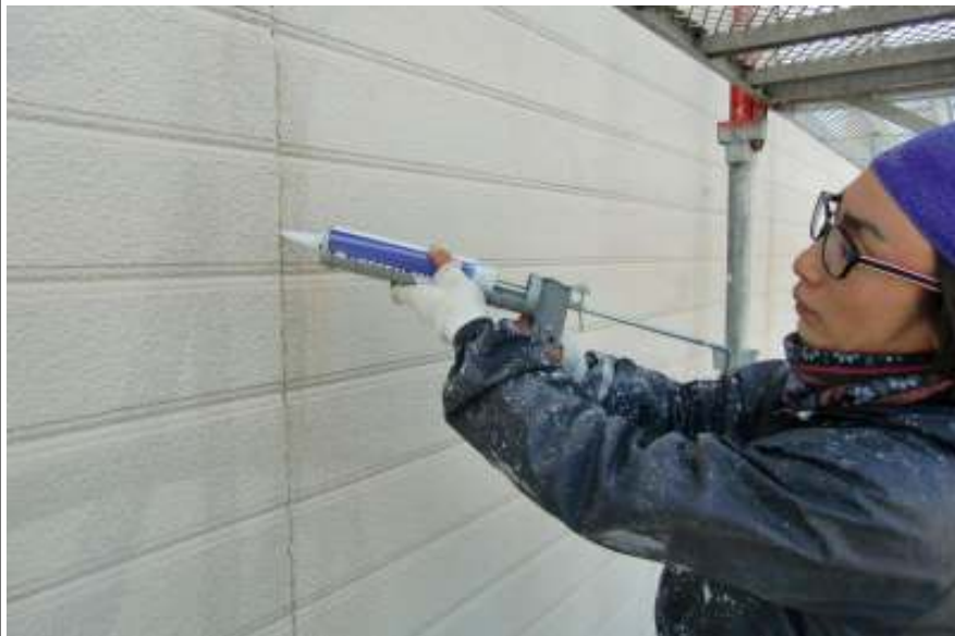
外壁シーリング施工中