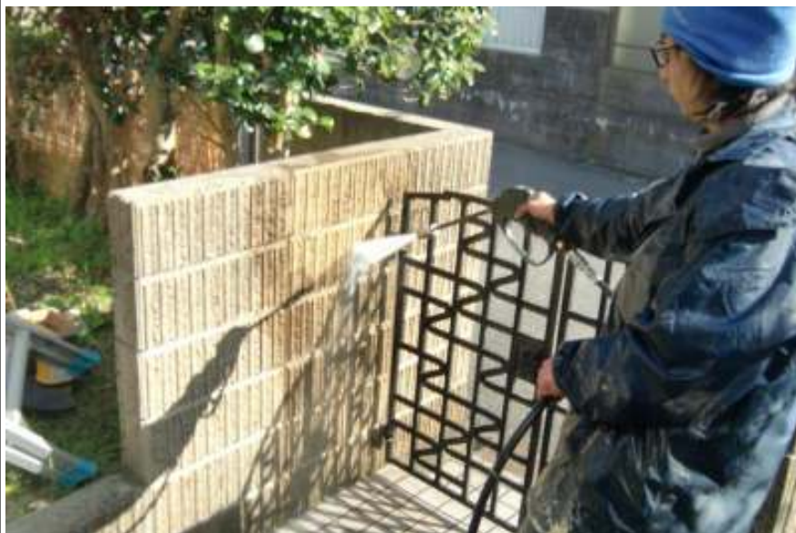
玄関壁高圧洗浄中