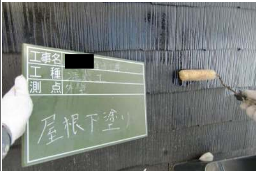
屋根塗装下塗り施工中