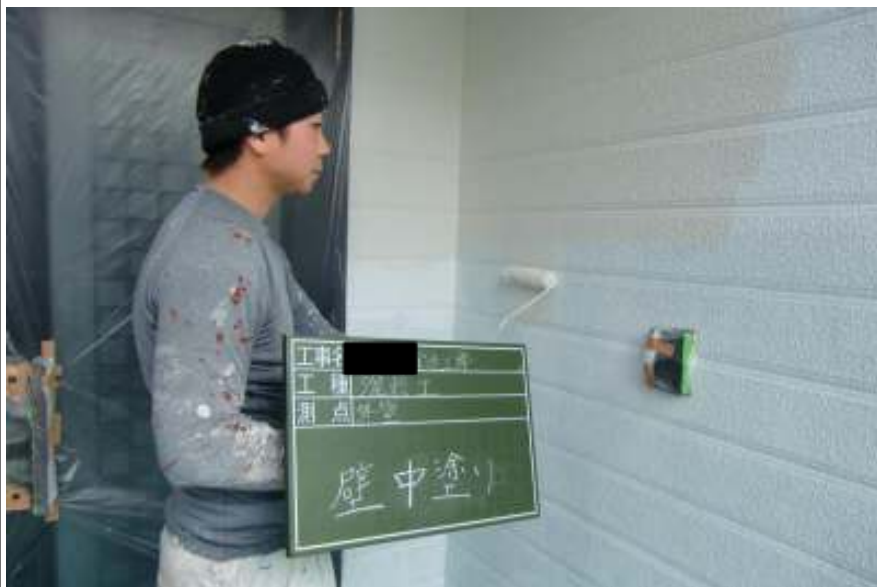
外壁塗装中塗り施工中