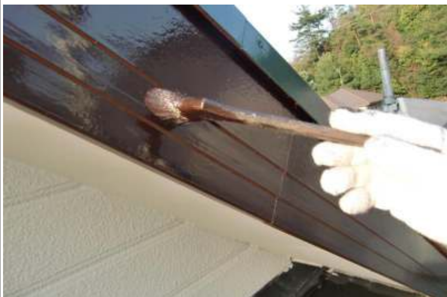
破風板二回目施工中