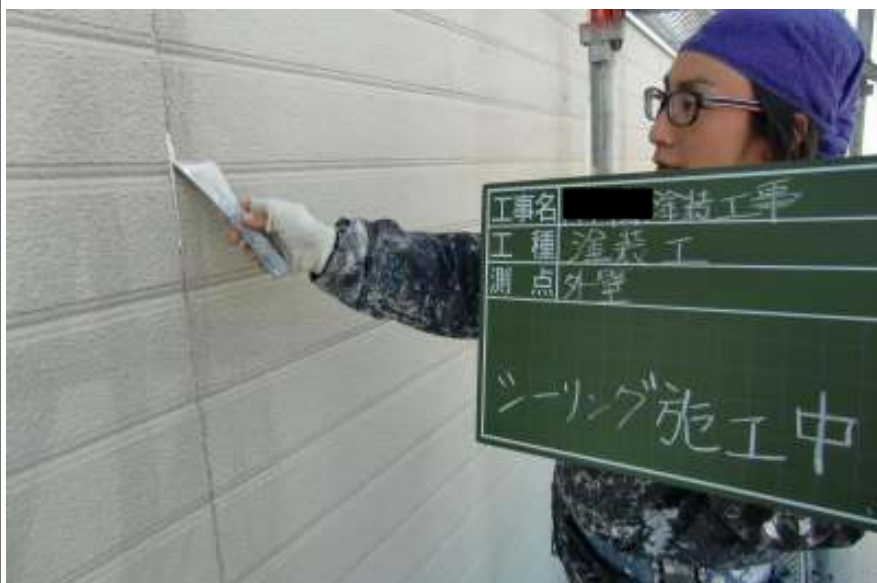
外壁シーリング施工中