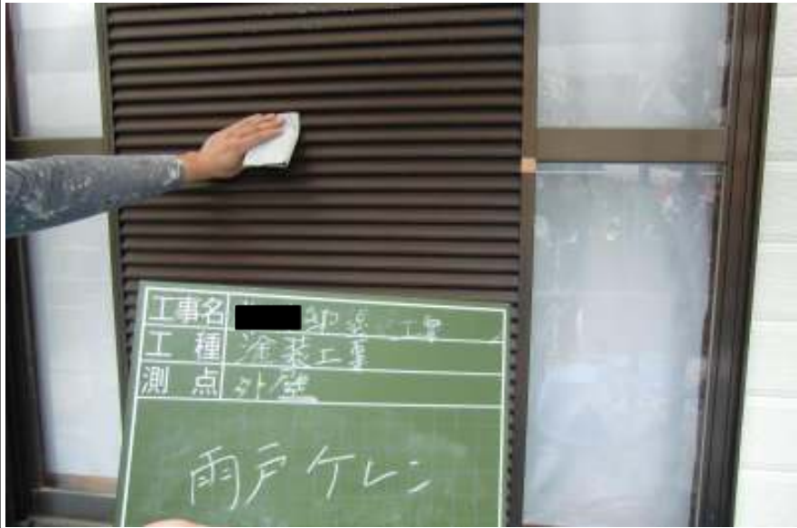
雨戸ケレン施工中