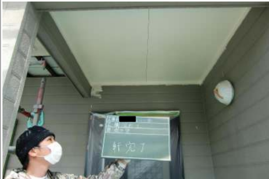
軒天塗装施工完了