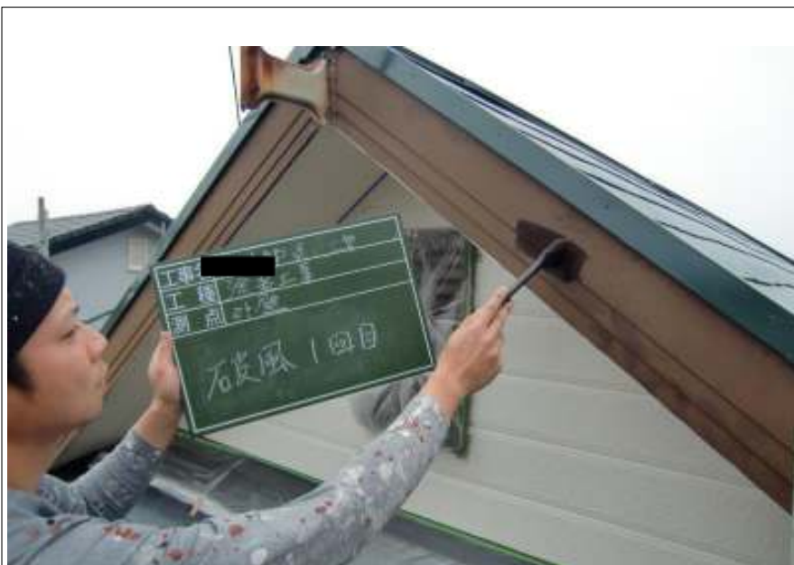
破風板塗装一回目施工中