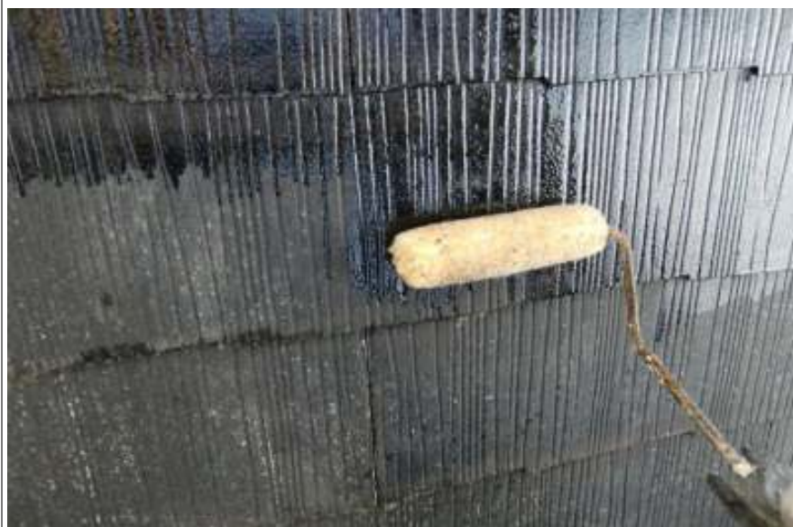
屋根塗装下塗り施工中