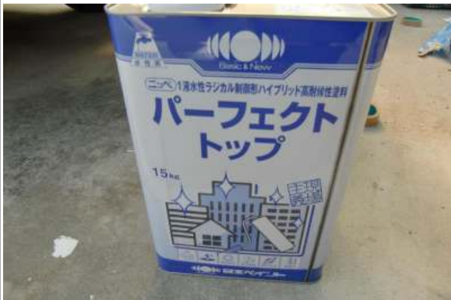
外壁中塗り・上塗り塗料缶