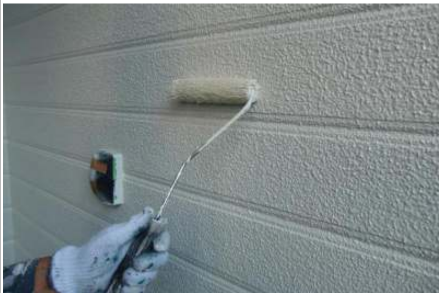
外壁塗装上塗り施工中