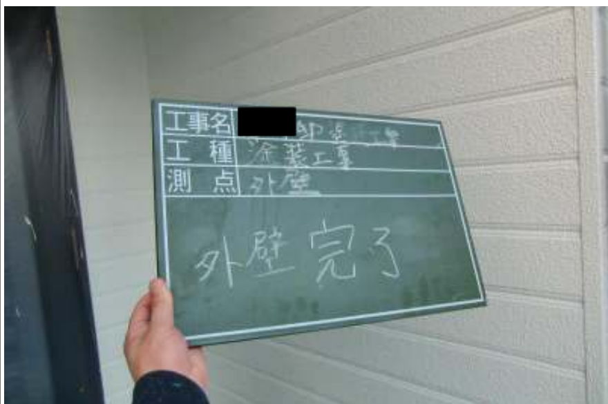
外壁塗装上塗り施工完了