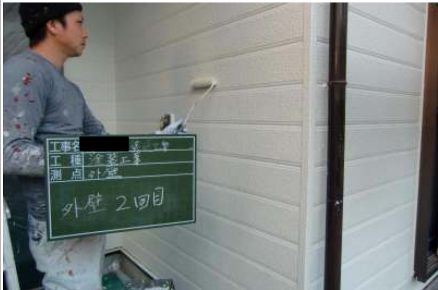
外壁塗装上塗り施工中