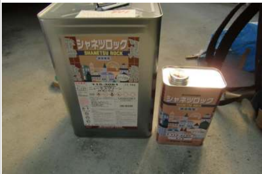
屋根中塗り塗料缶