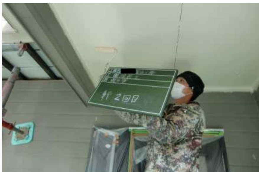
軒天塗装塗り施工中