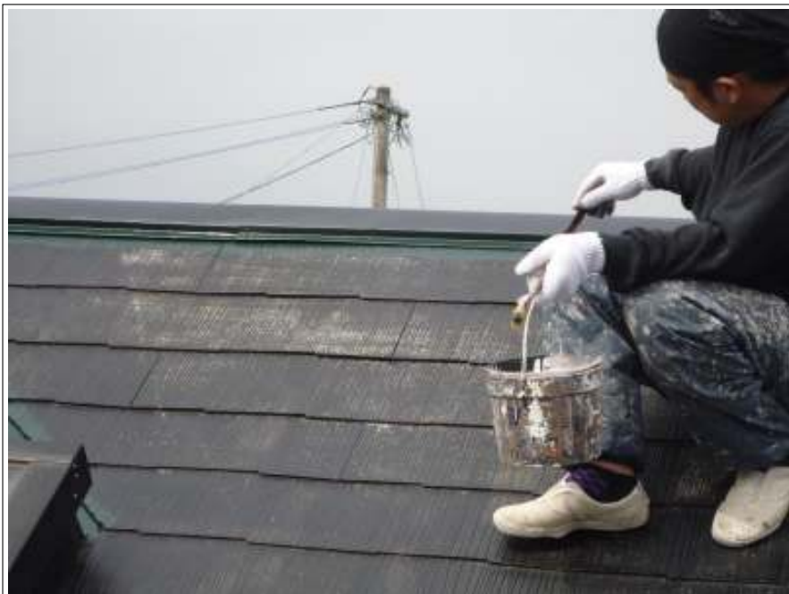
屋根塗装中塗り施工中