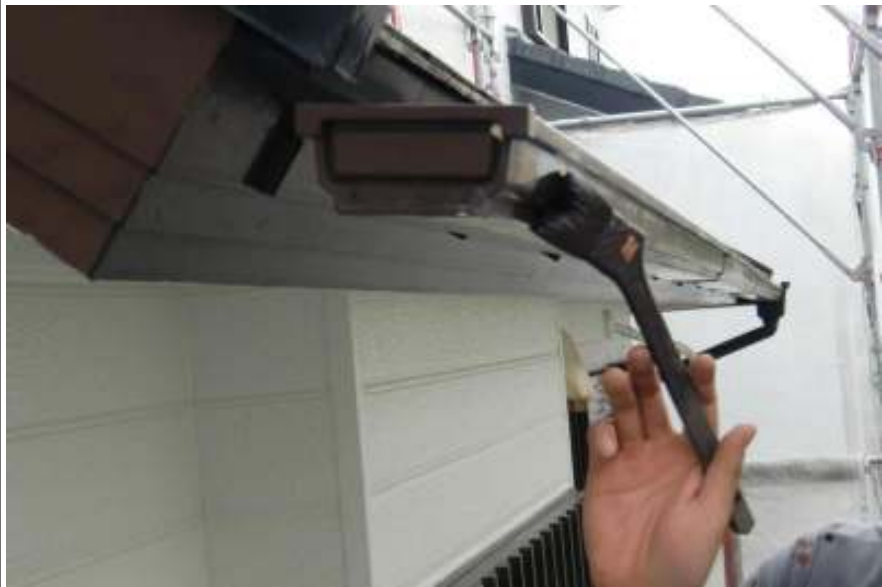
樋一回目塗装施工中