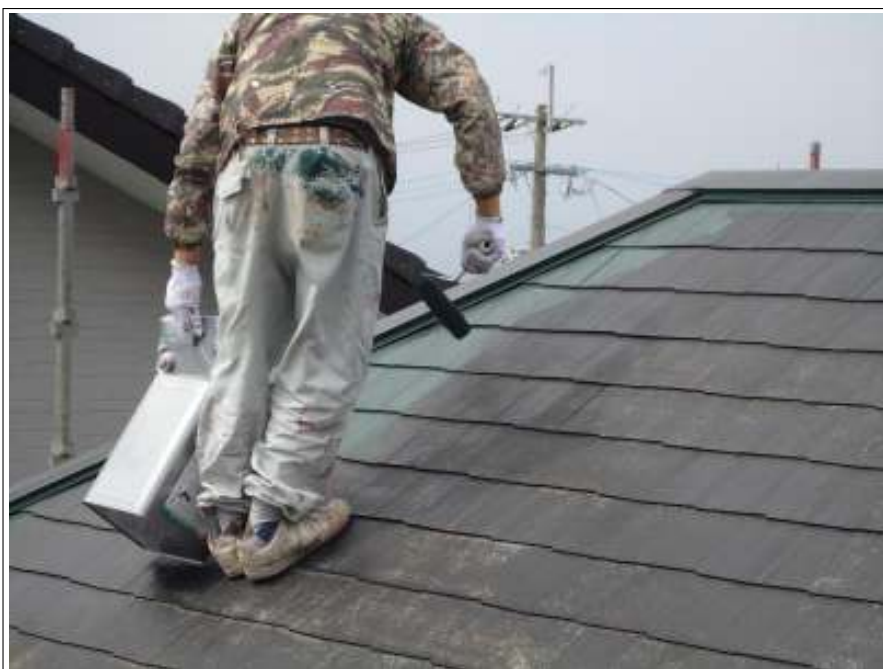
屋根塗装中塗り施工中