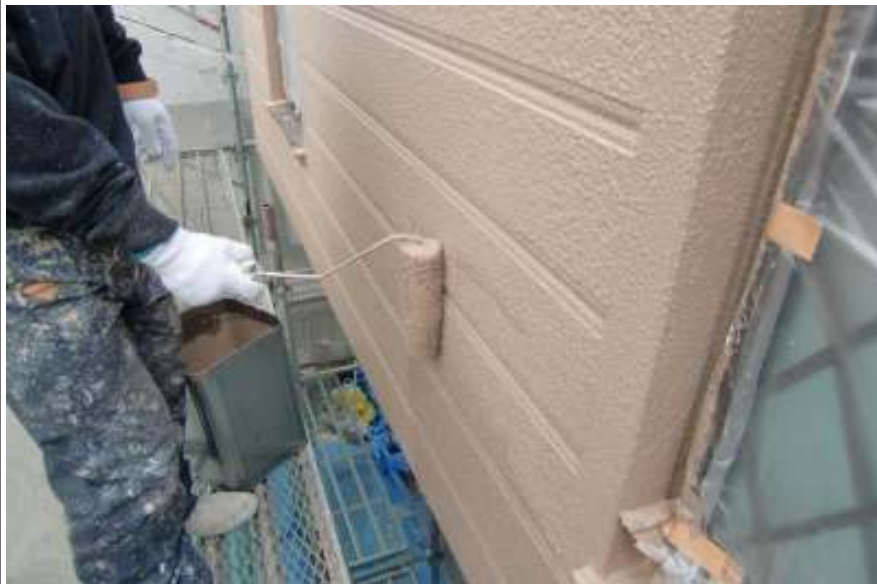
外壁塗装上塗り施工中