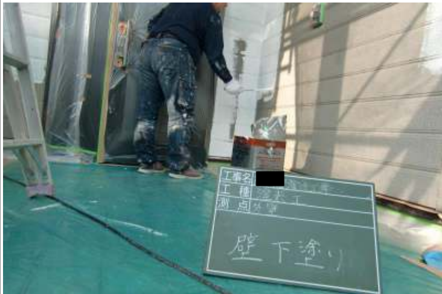
外壁塗装下塗り施工中