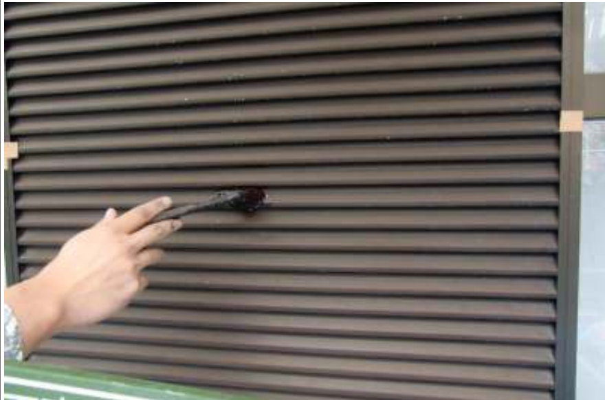
雨戸下塗り施工中