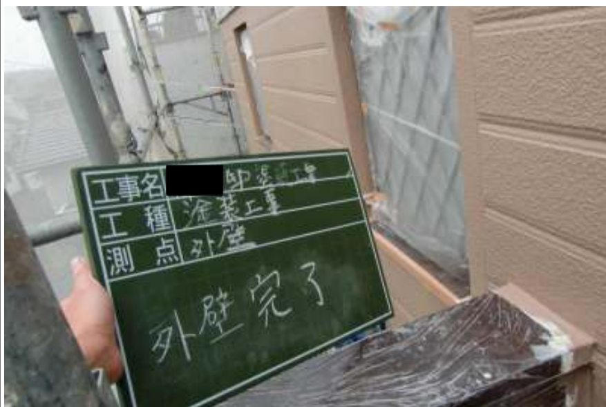
外壁塗装上塗り施工完了