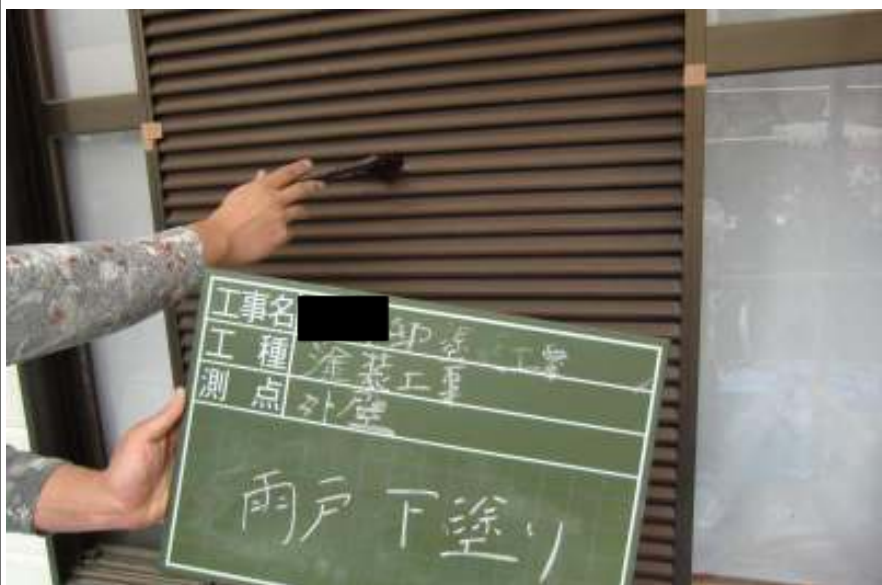
雨戸下塗り施工中