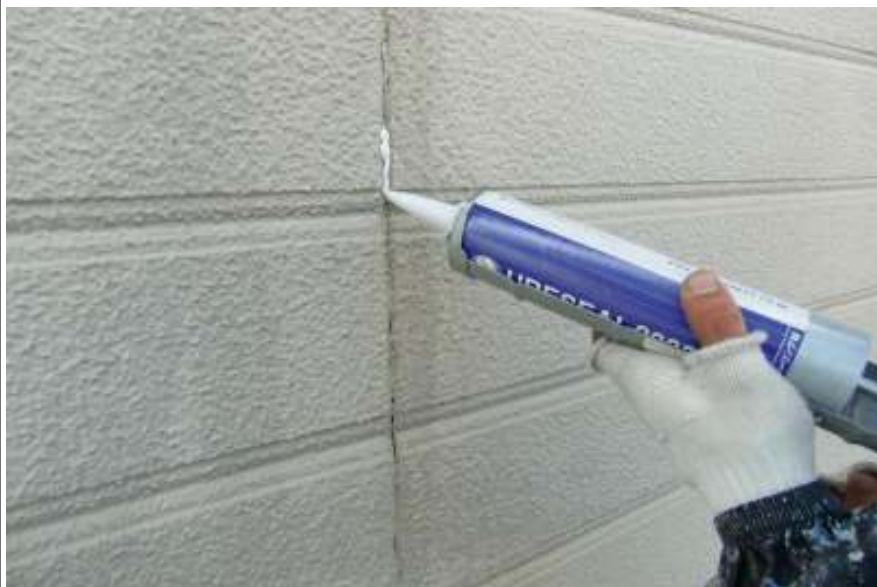
外壁シーリング施工中