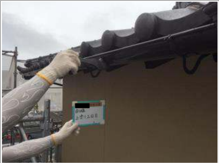
樋 上塗り（2回目）施工中