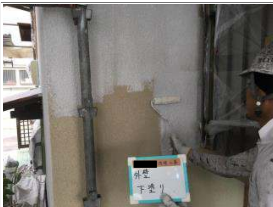
外壁 下塗り施工中