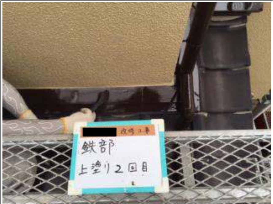
鉄部 上塗り（2回目）施工中