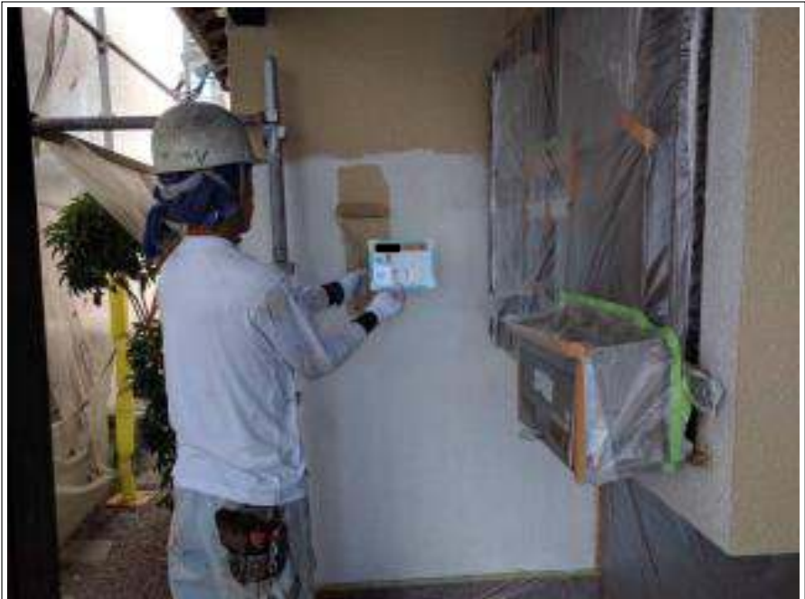
外壁 中塗り施工中