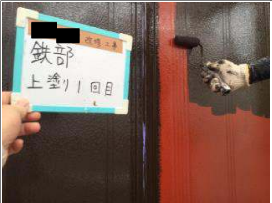
雨戸 上塗り（1回目）施工中