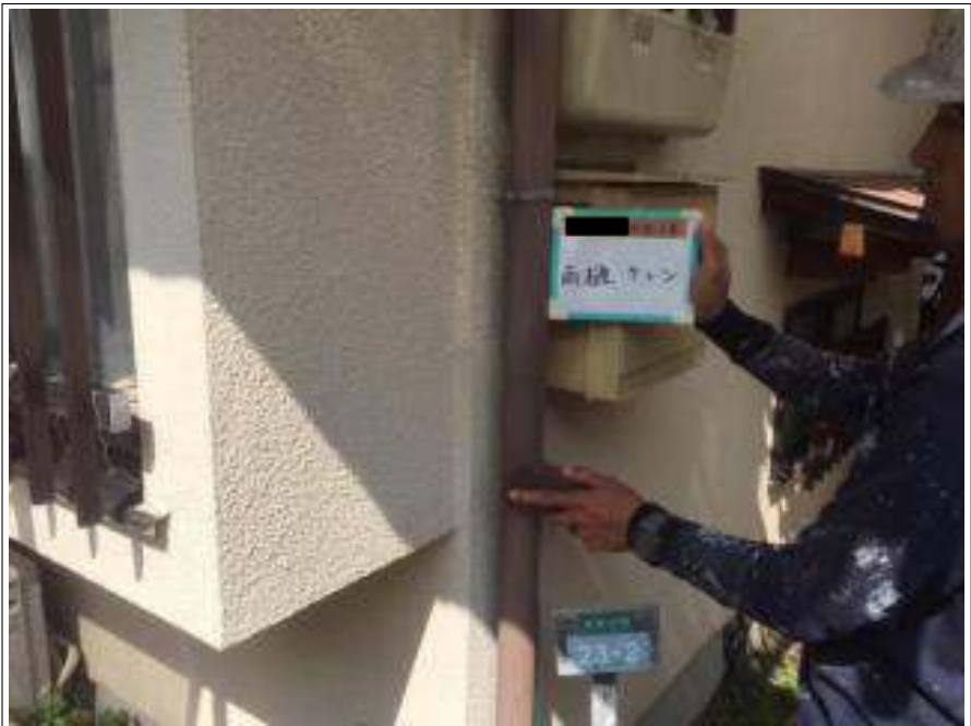
樋 ケレン処理施工中