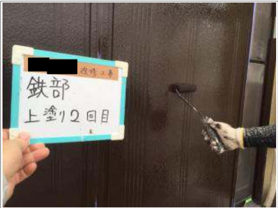
雨戸 上塗り（2回目）施工中