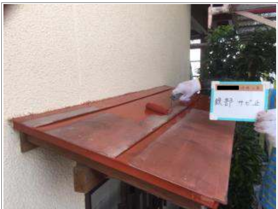
小庇 サビ止め塗布施工中