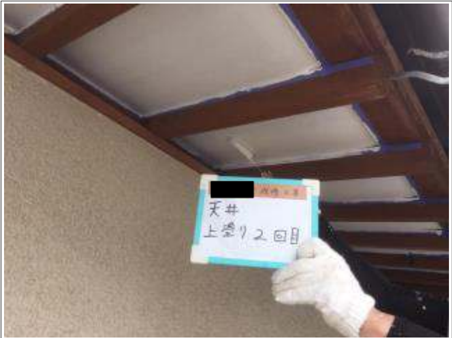
軒天 上塗り（2回目）施工中