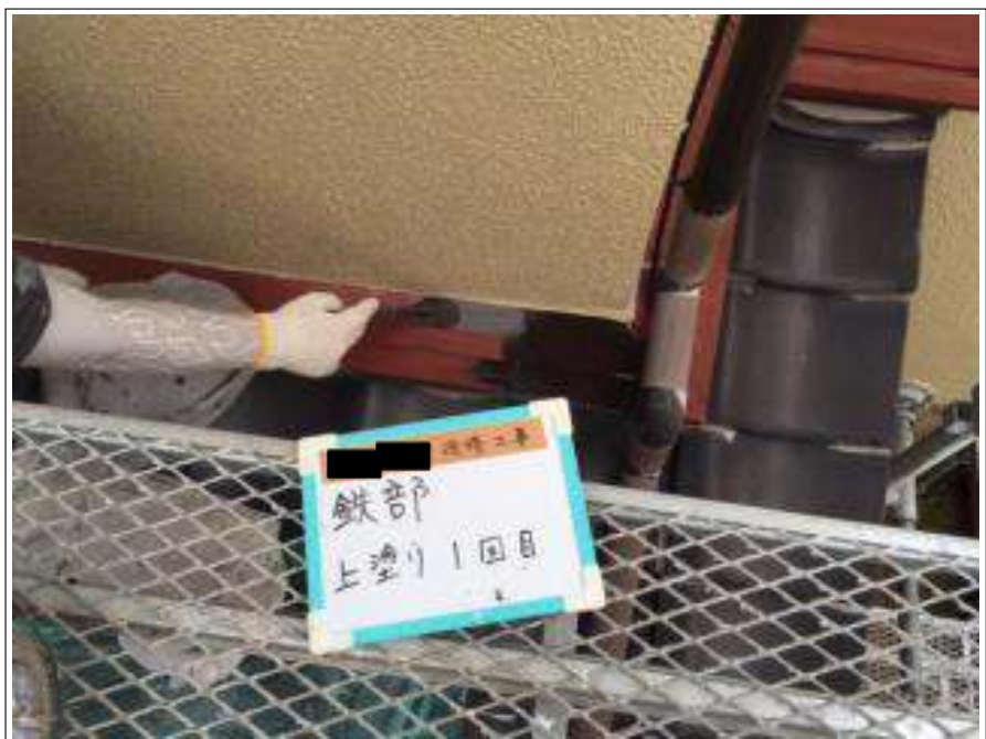
鉄部 上塗り（1回目）施工中