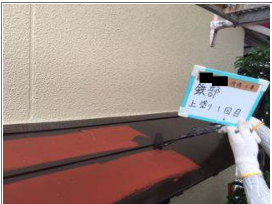
小庇 上塗り（1回目）施工中