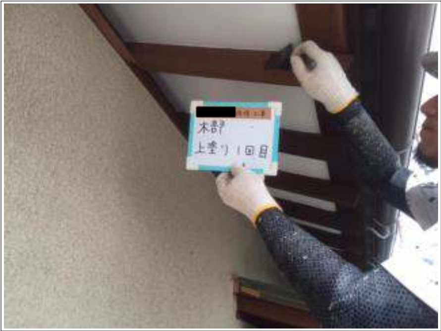
木部 上塗り（1回目）施工中