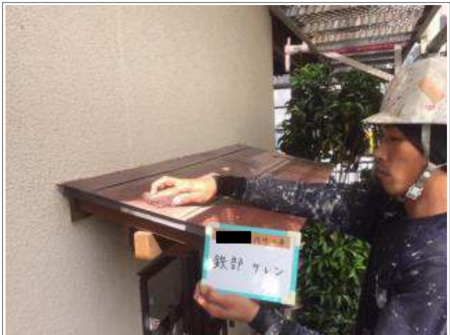
小庇 ケレン処理施工中