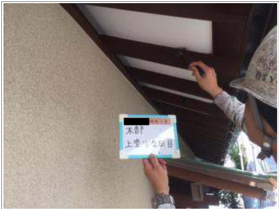
木部 上塗り（2回目）施工中