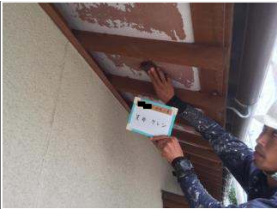
軒天 ケレン処理施工中