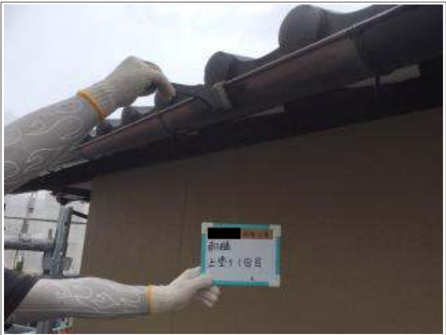
樋 上塗り（1回目）施工中