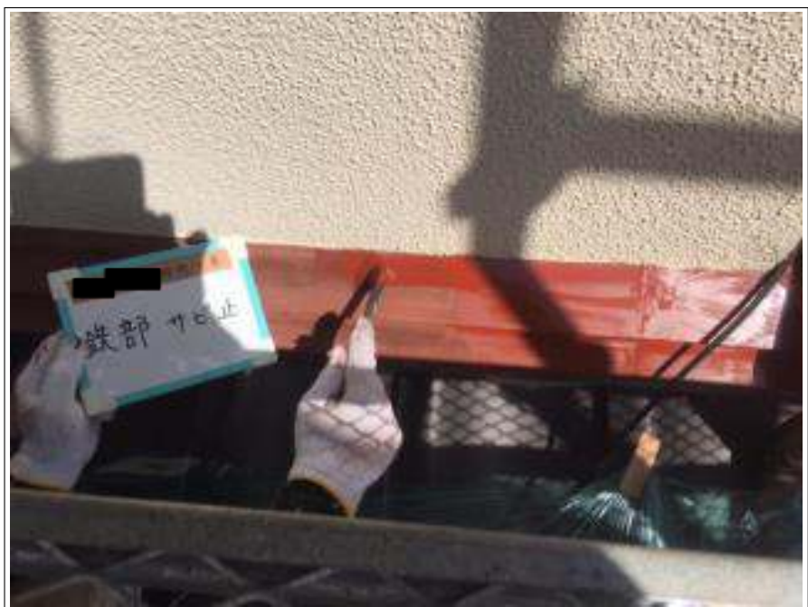
鉄部 サビ止め塗布施工中