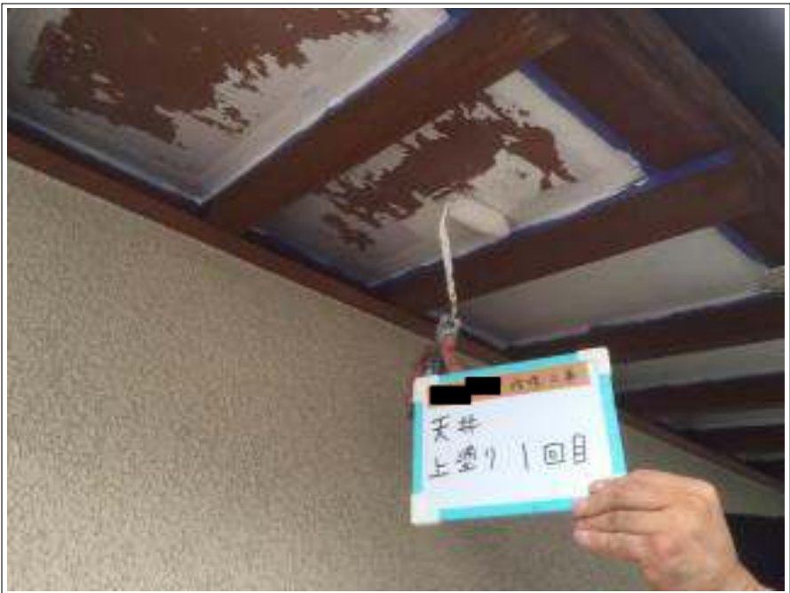
軒天 上塗り（1回目）施工中