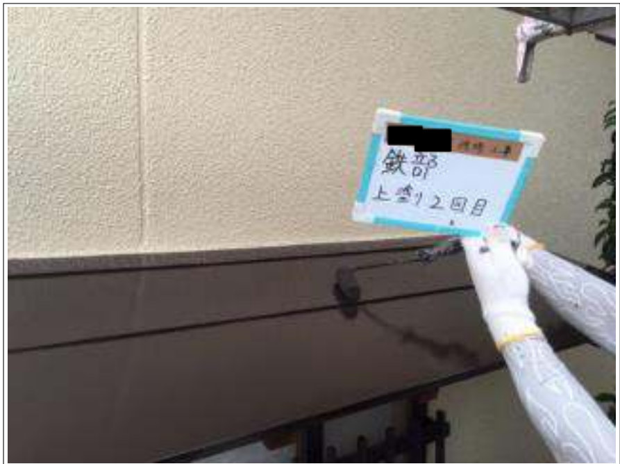
小庇 上塗り（2回目）施工中