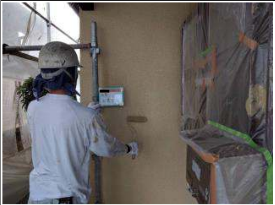
外壁 上塗り施工中