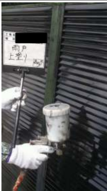
雨戸 上塗り 施工中