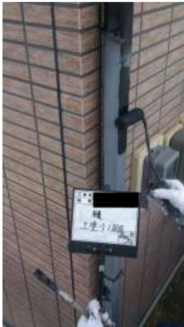
雨樋 上塗り（1回目）施工中