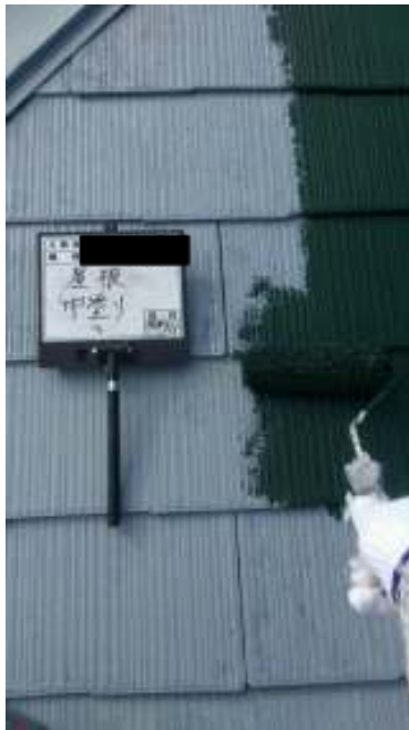
屋根 中塗り施工中