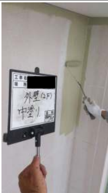
外壁(2F) 外壁 中塗り施工中