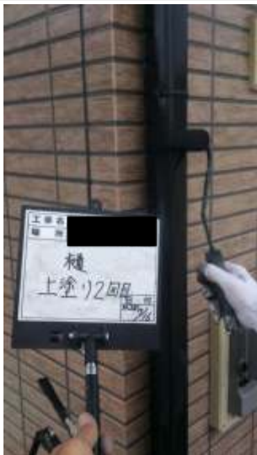
雨樋 上塗り（2回目）施工中