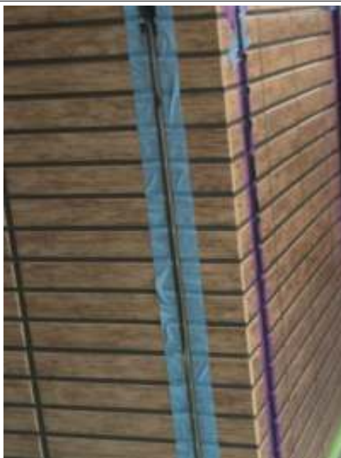
外壁(1F) シーリング撤去後