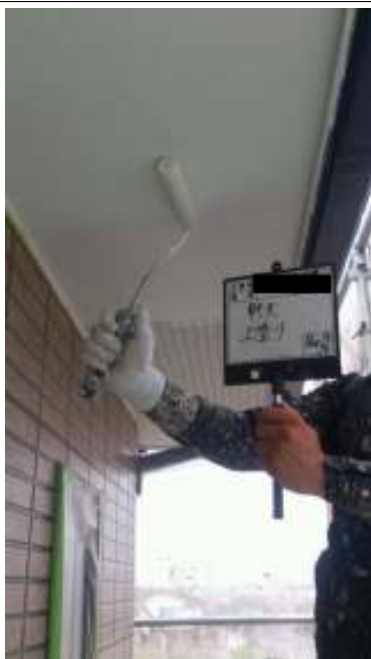
軒天 上塗り施工中