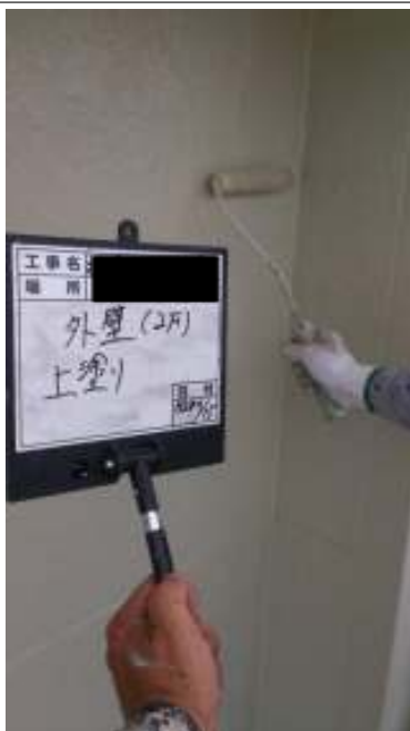
外壁(2F) 外壁 上塗り施工中