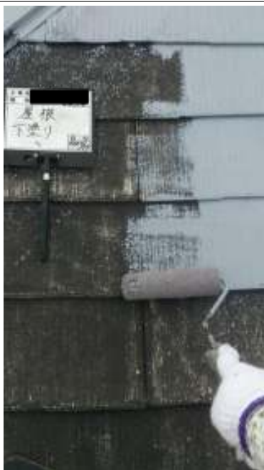
屋根 下塗り施工中