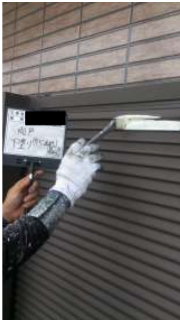
雨戸 サビ止め 施工中