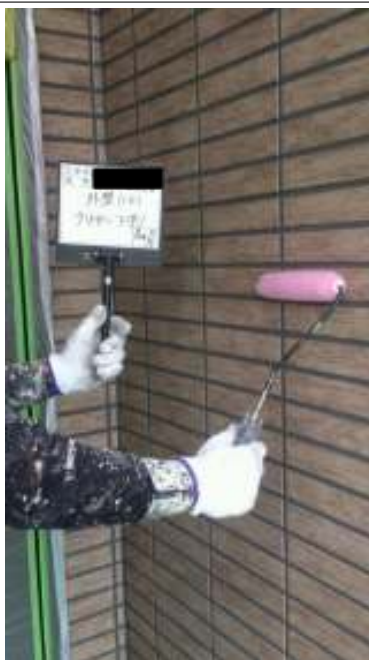
外壁(1F) 上塗り（1回目）施工中