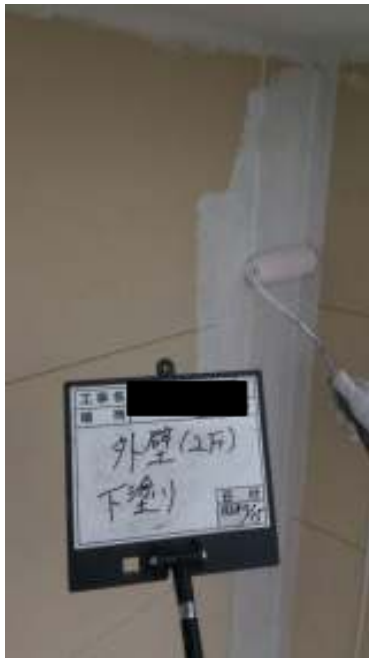
外壁(2F) 外壁 下塗り施工中