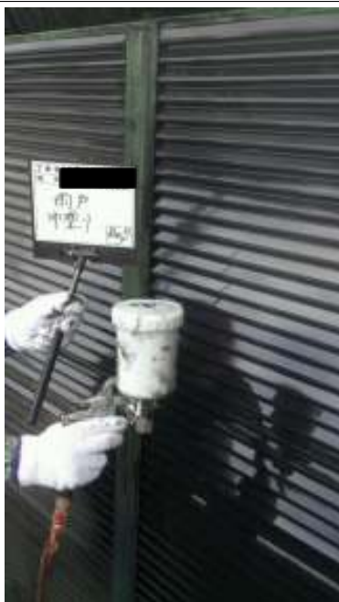
雨戸 中塗り 施工中