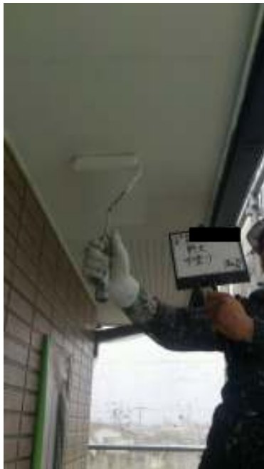
軒天 中塗り施工中