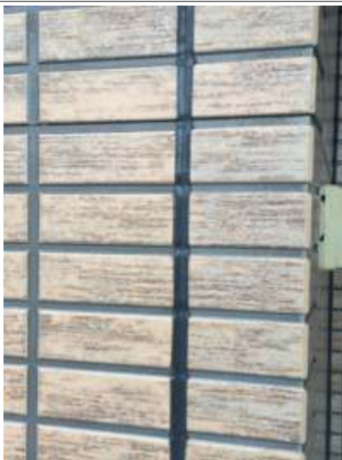
外壁(1F) シーリング施工後