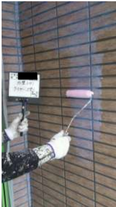
外壁(1F) 上塗り (2回目) 施工中