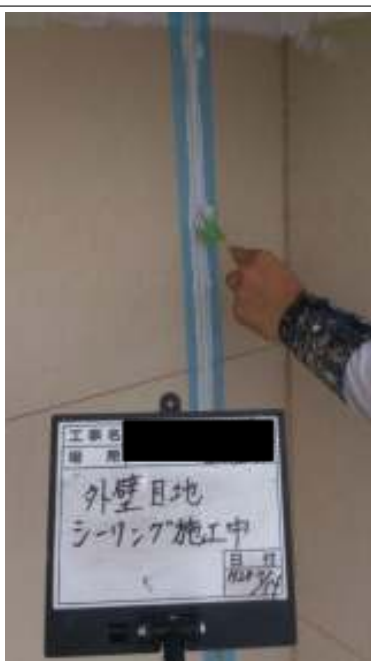
外壁(2F) シーリング施工中