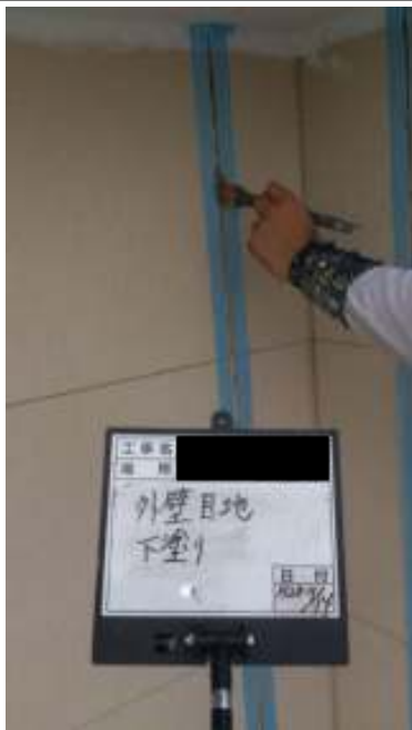
外壁(2F) シーリング下塗り施工中