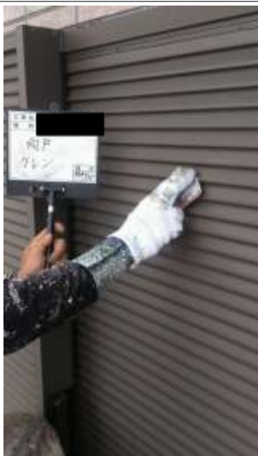
雨戸 ケレン 施工中