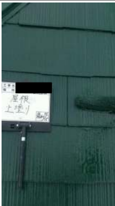
屋根 上塗り施工中