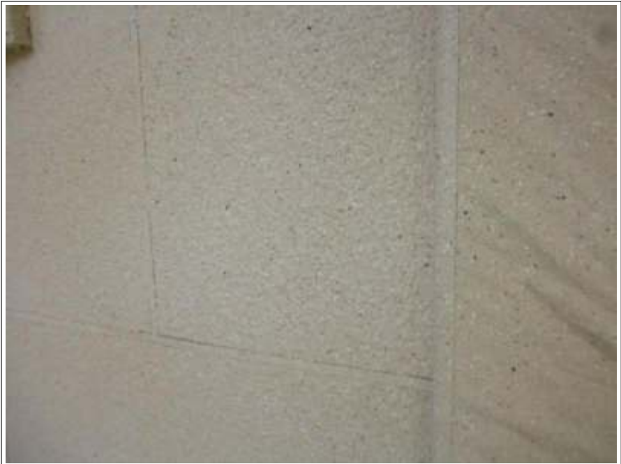
外壁 上塗り 施工後