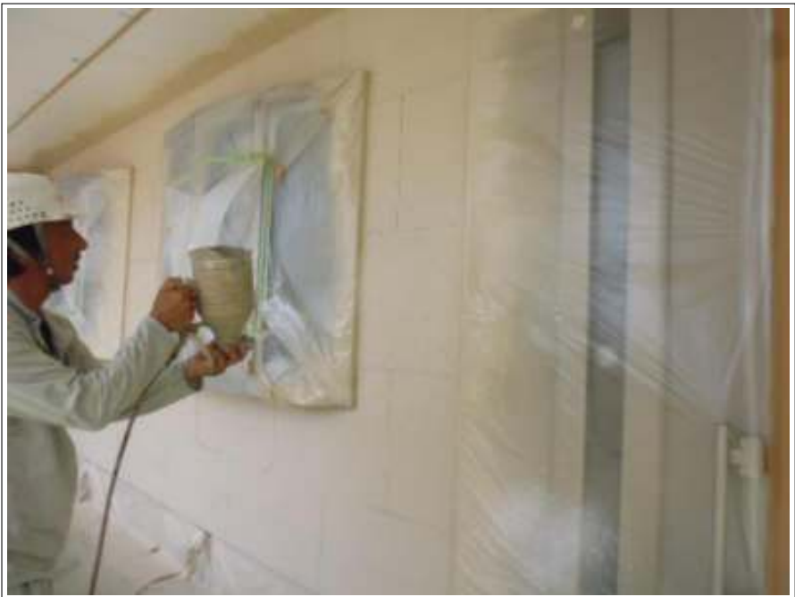
外壁 上塗り 施工中