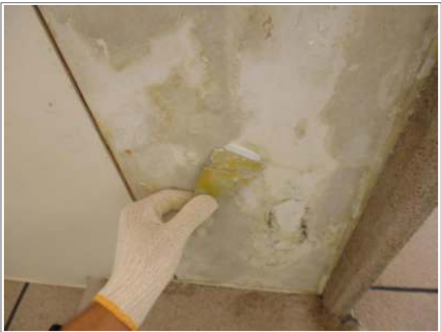
軒天 パテ補修 施工中