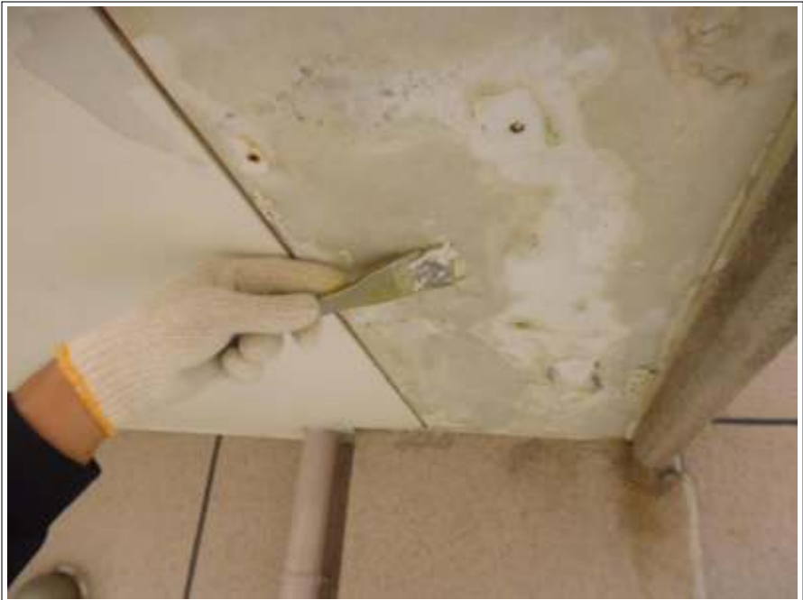
軒天 パテ補修 施工中