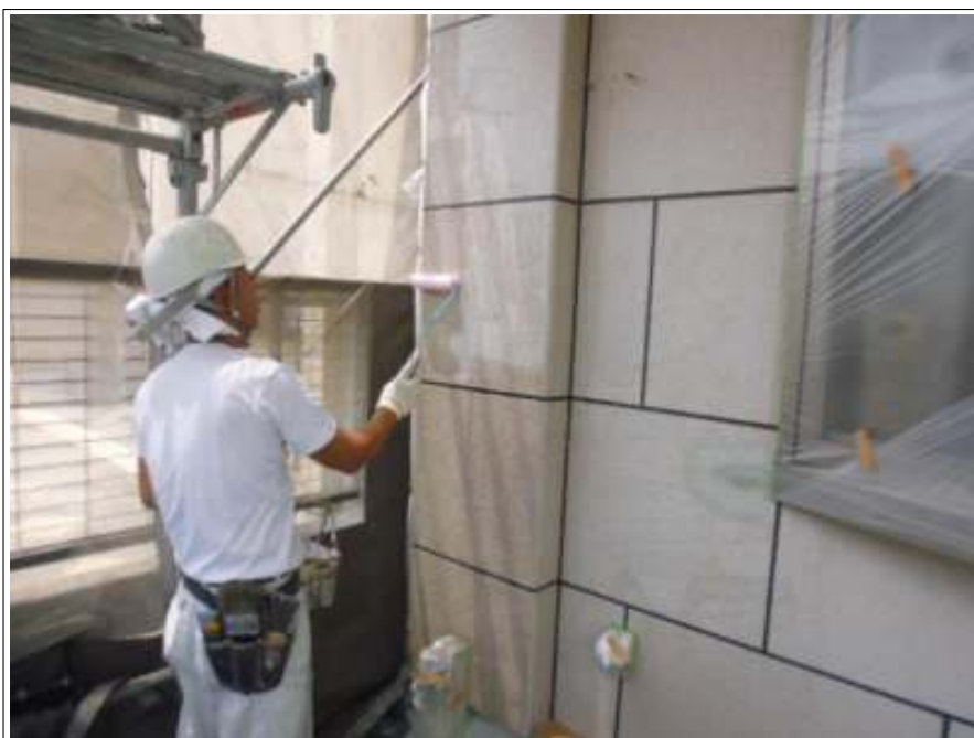
外壁 下塗り 施工中