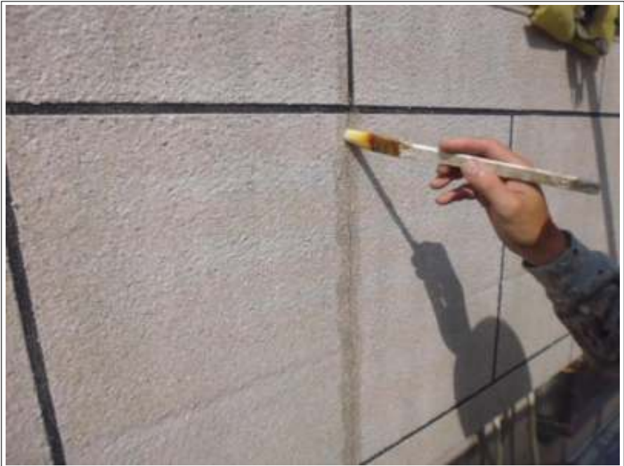
クラック補修 プライマー塗布