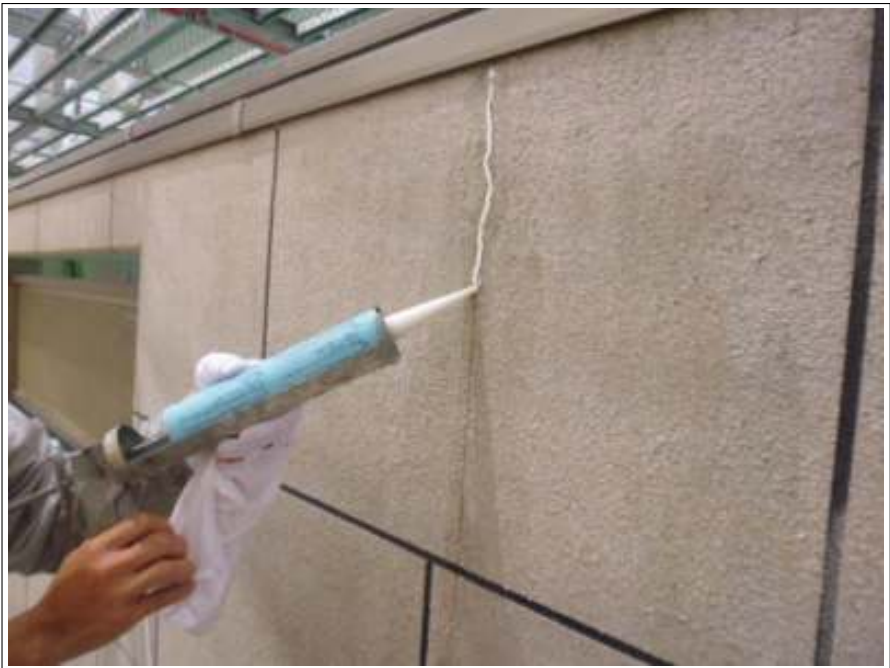
クラック補修 施工中