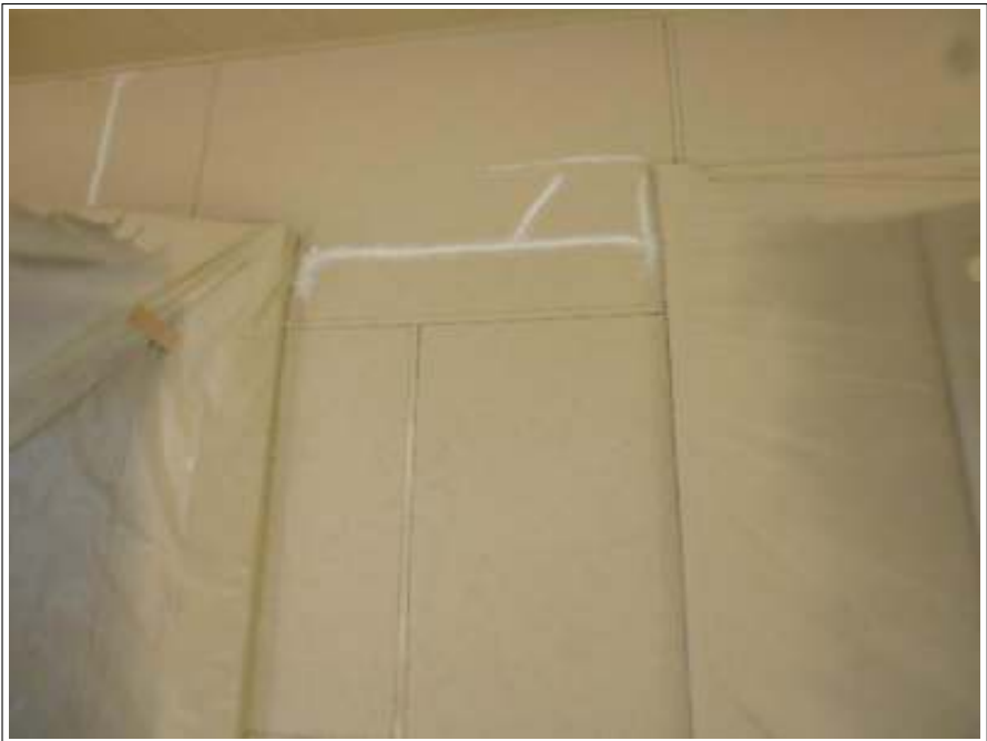
外壁 中塗り 施工中