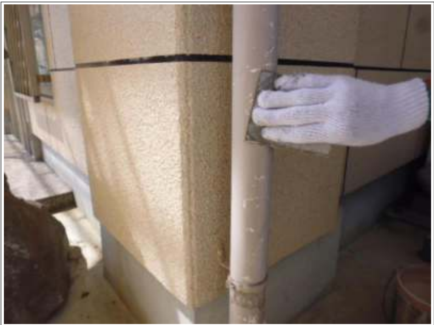
雨樋 ケレン 施工中