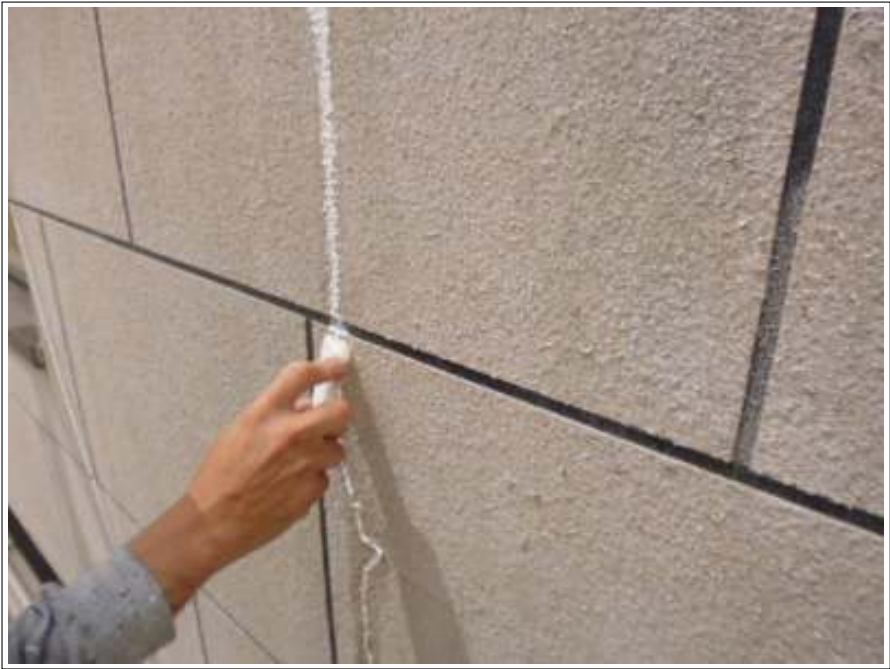
クラック補修 施工中