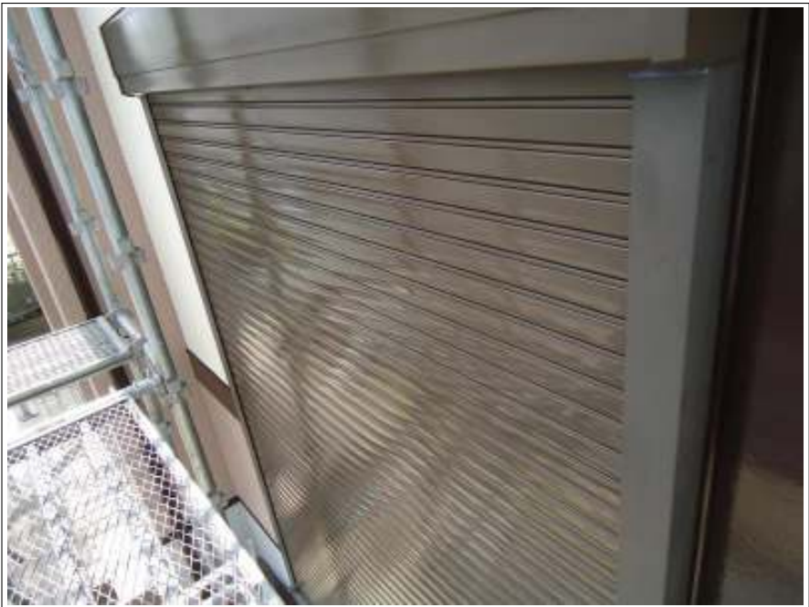
シャッター 施工後