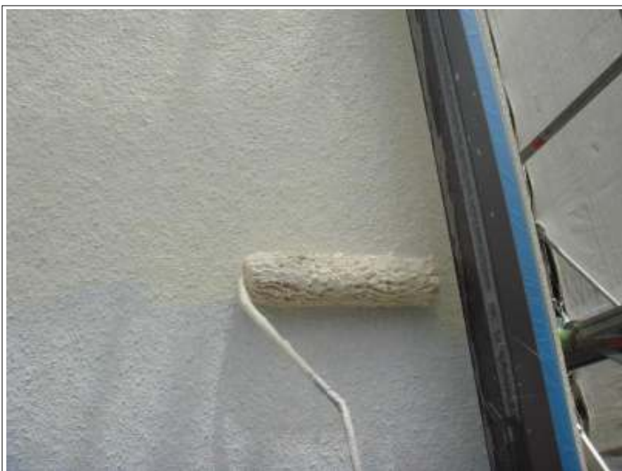
外壁 中塗り施工中