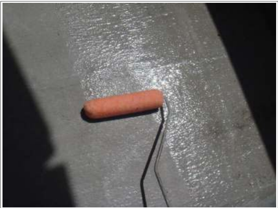
ベランダ 下塗り施工中