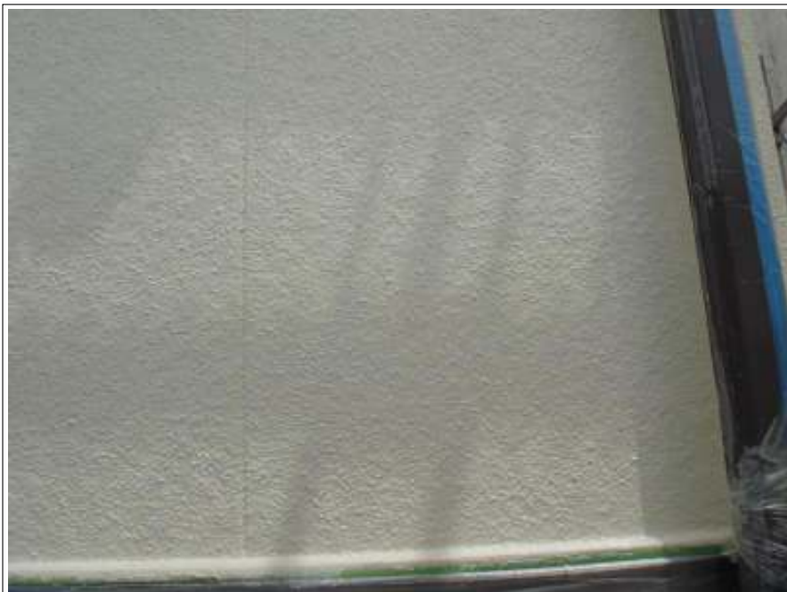
外壁 中塗り施工後