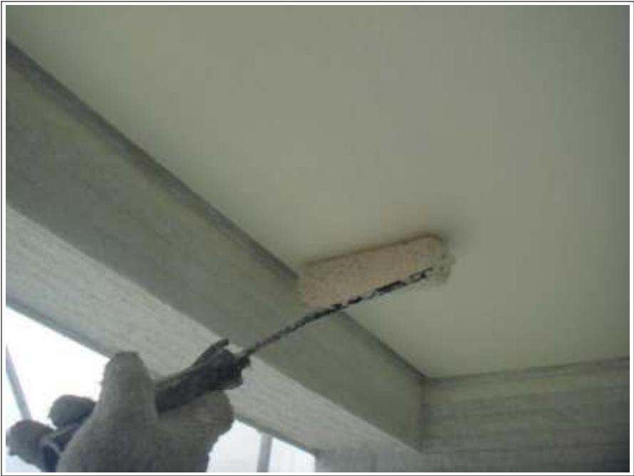
軒天 上塗り（2回目）施工中