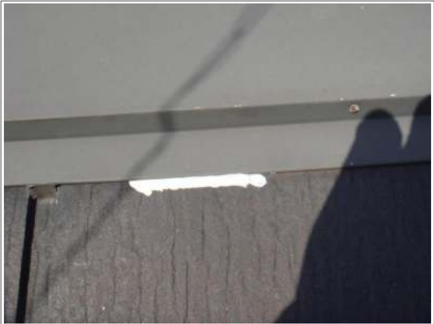
棟鉄板ラバー止め 施工後