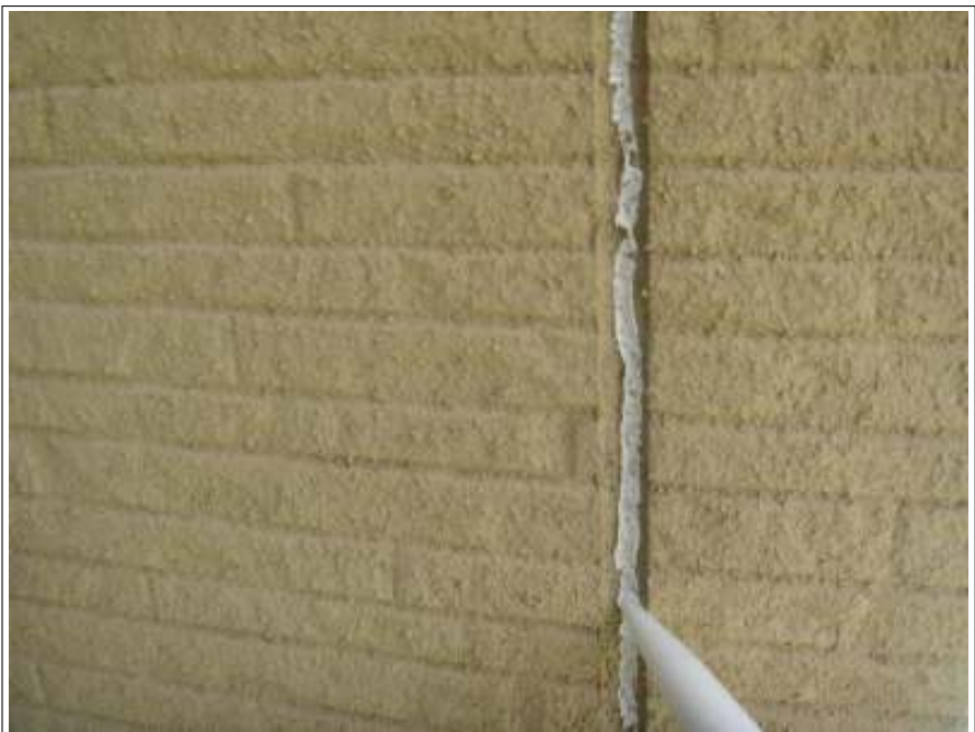
外壁 クラック補修施工中