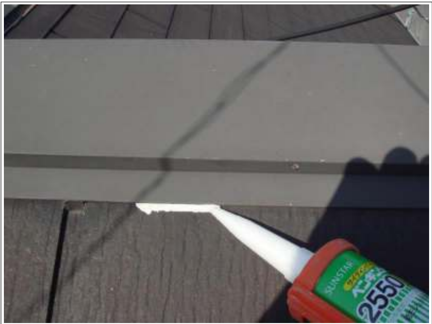
棟鉄板ラバー止め 施工中