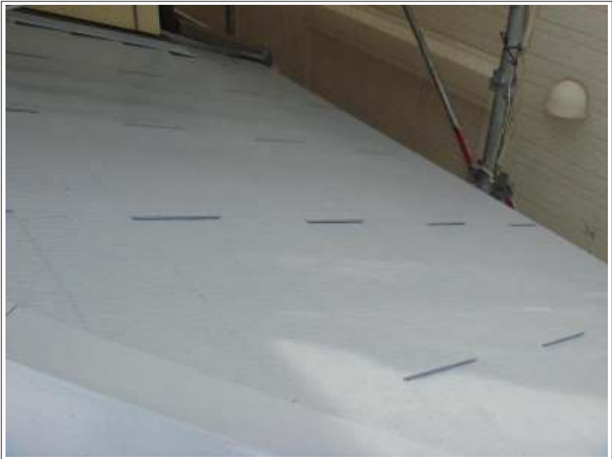
屋根 下塗り施工後