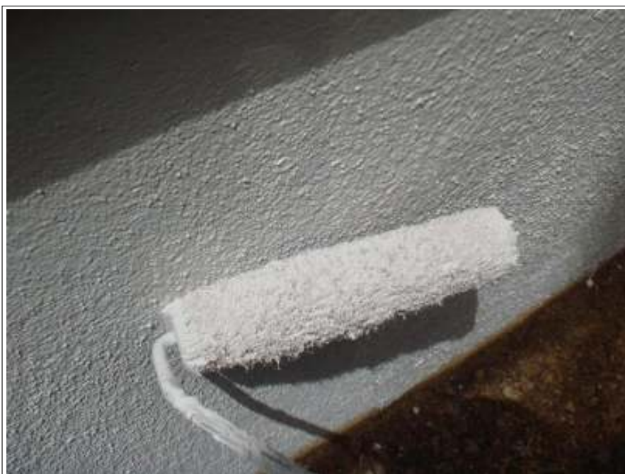
基礎塗り（2回目）施工中