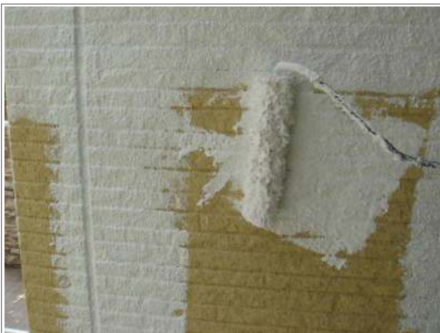
外壁 下塗り施工中