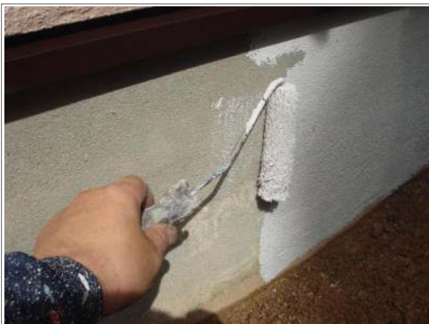
基礎塗り（1回目）施工中