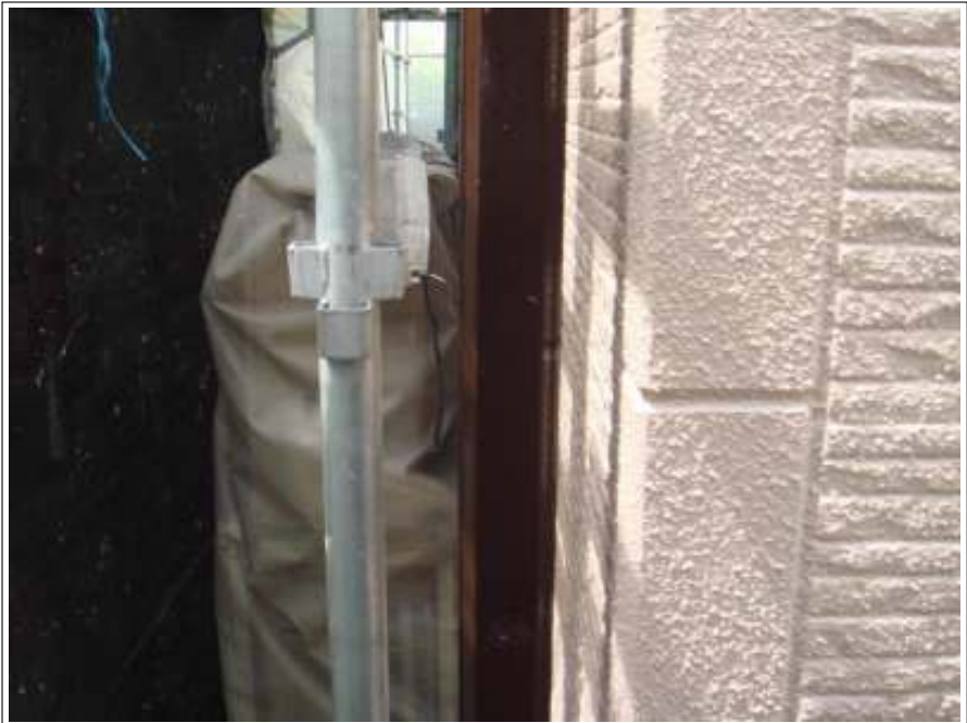
雨樋 上塗り施工後