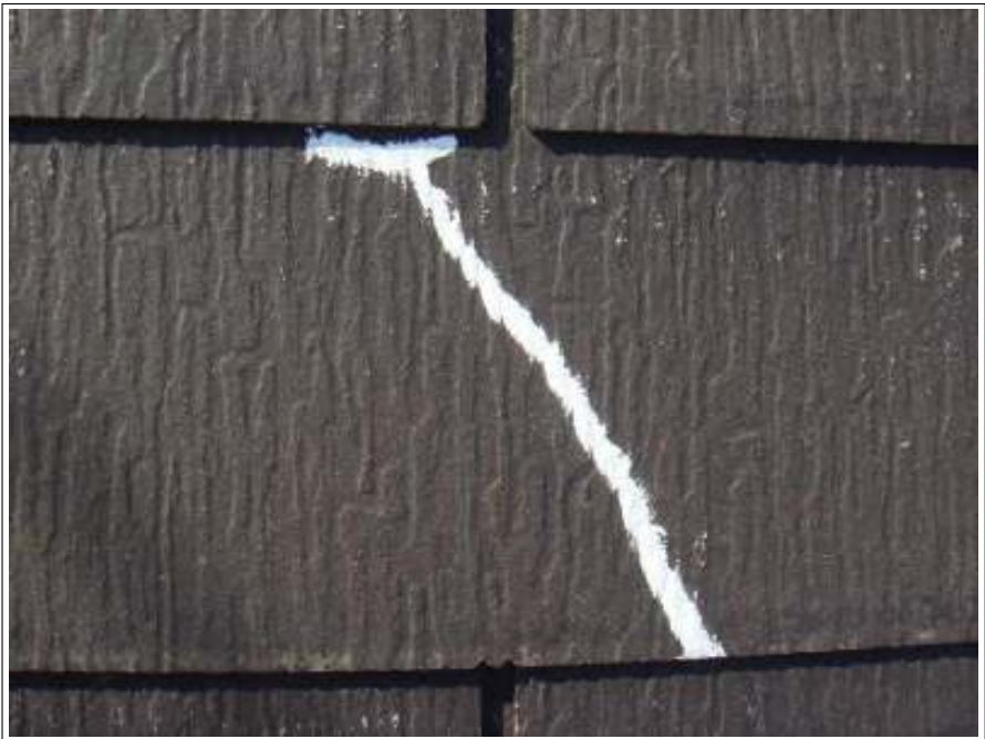
屋根 クラック補修施工後