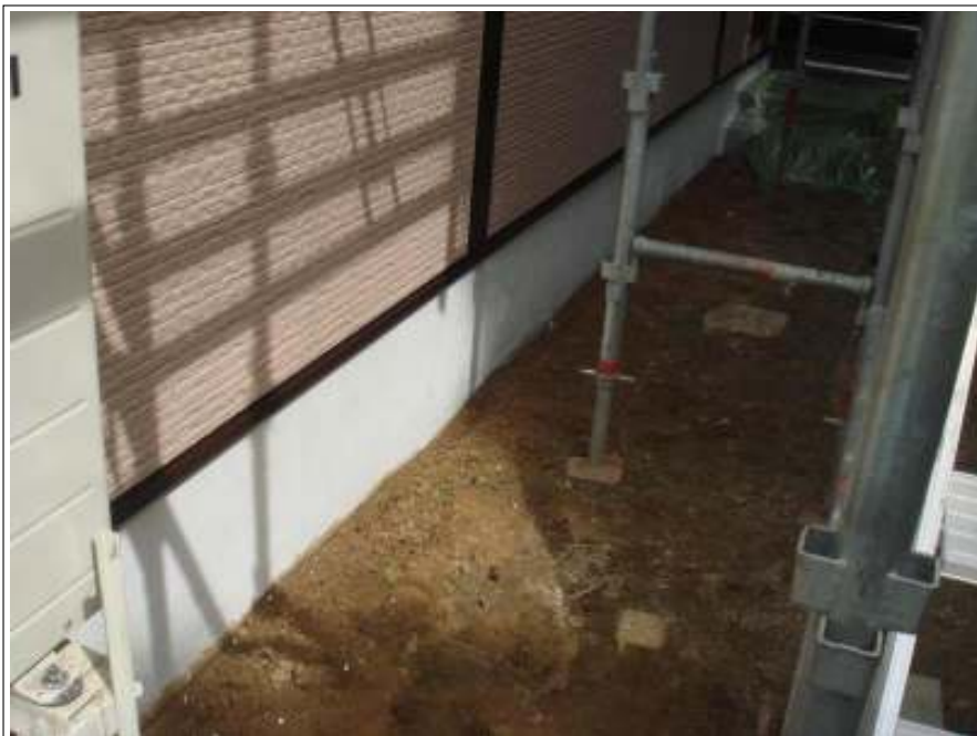
基礎塗り（1回目）施工後