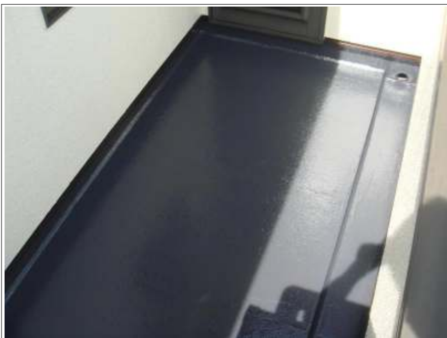
ベランダ 上塗り施工後