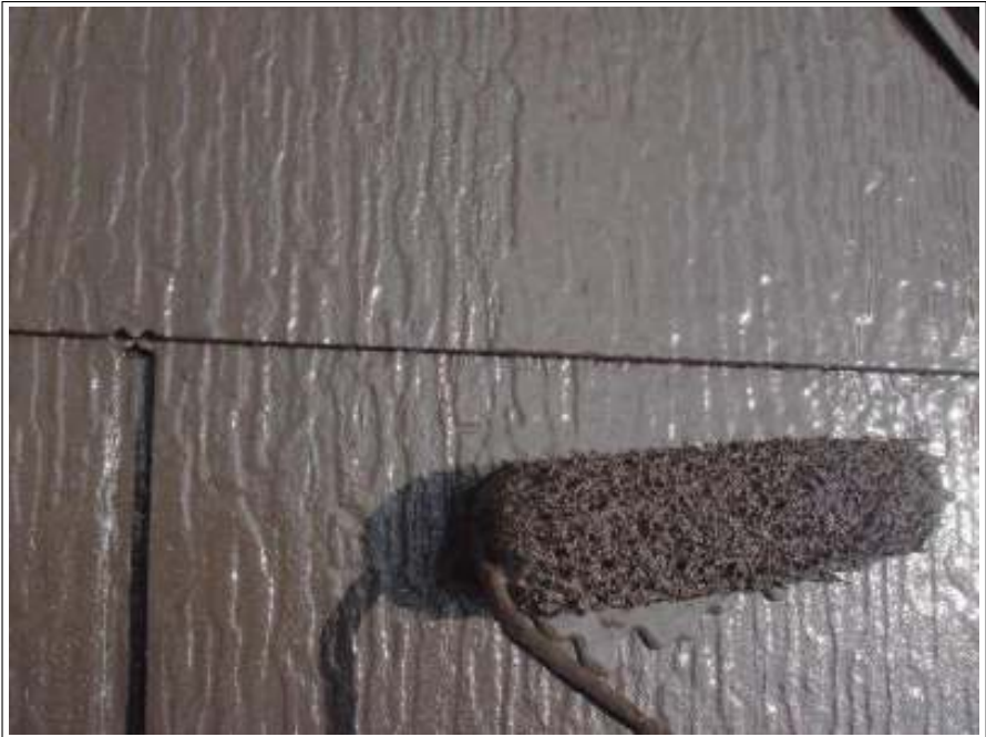
屋根 上塗り施工中