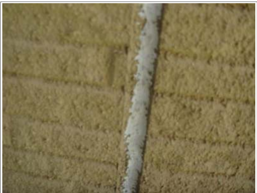
外壁 クラック補修施工後