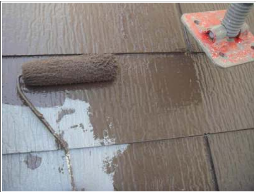
屋根 中塗り施工中