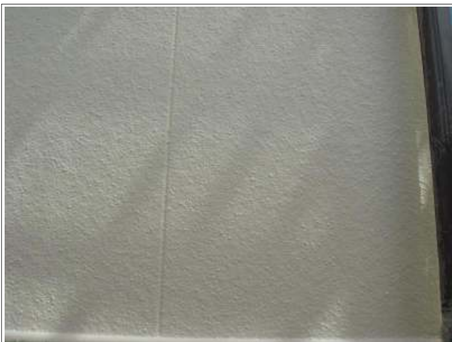
外壁 上塗り施工後