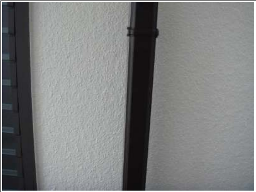
雨樋 上塗り施工後