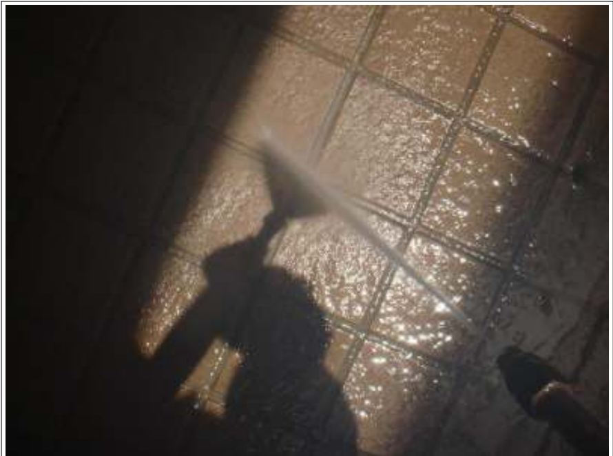
玄関床 高圧洗浄中