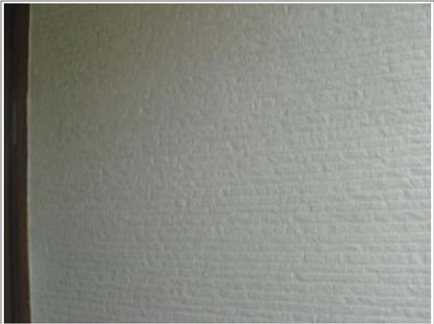
外壁 下塗り施工後