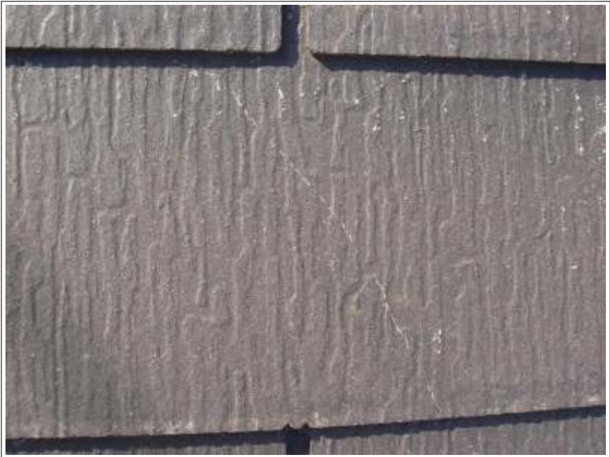
屋根 クラック補修施工前