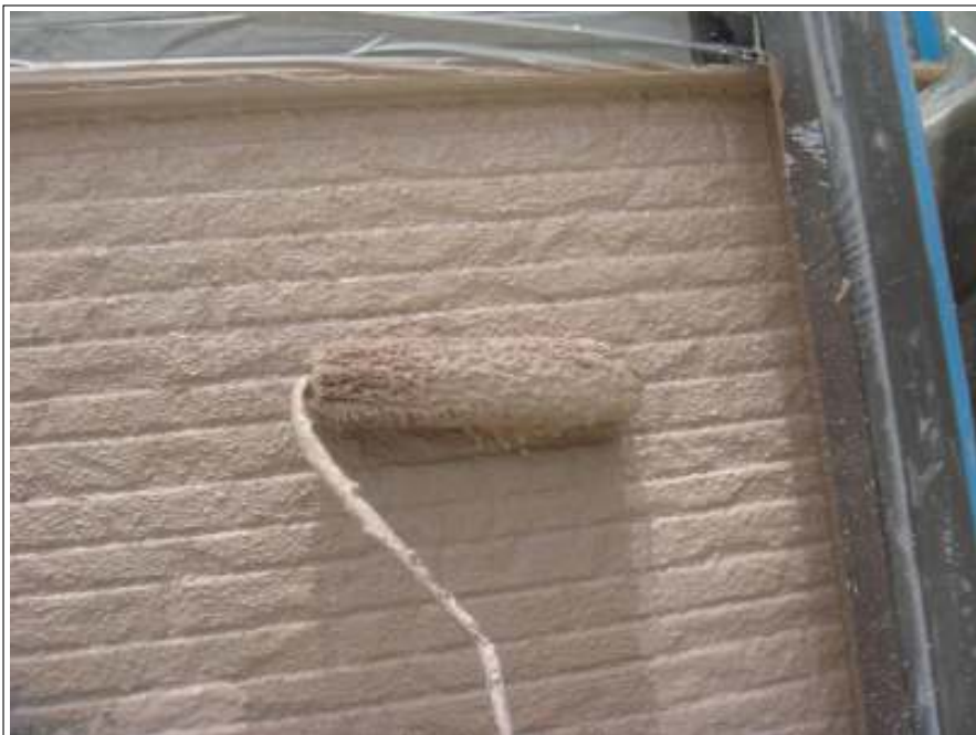
外壁 上塗り施工中