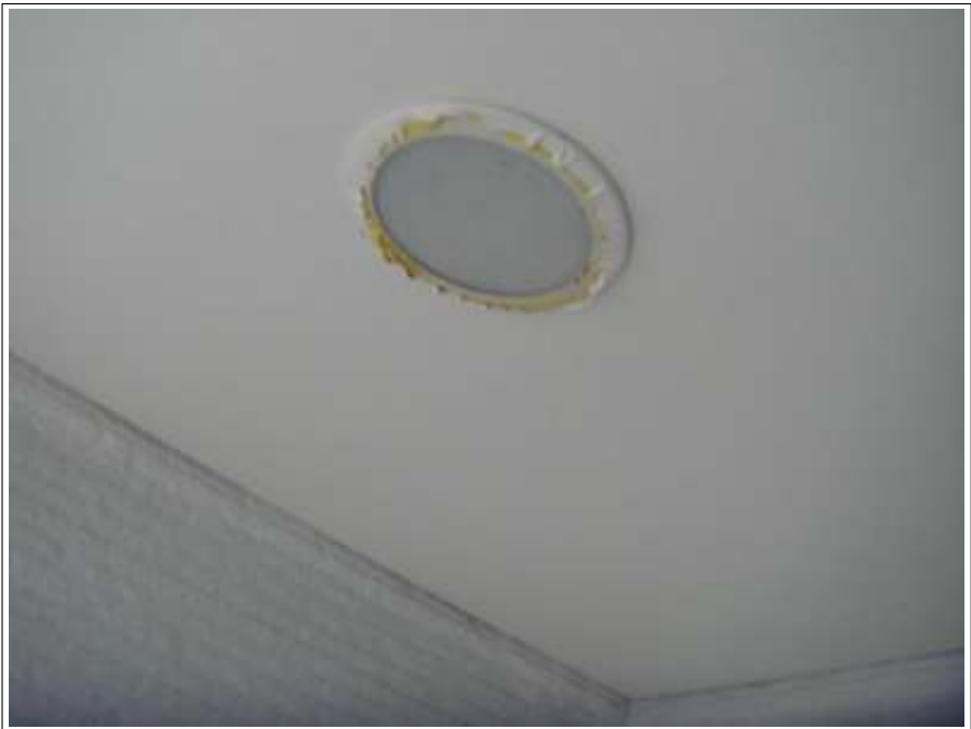
軒天 上塗り（1回目）施工後