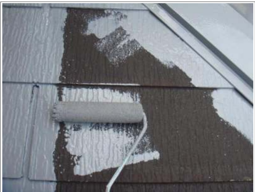
屋根 下塗り施工中