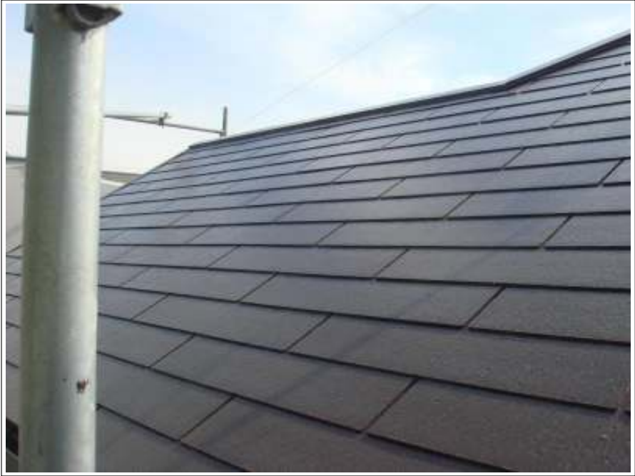
屋根 上塗り施工後