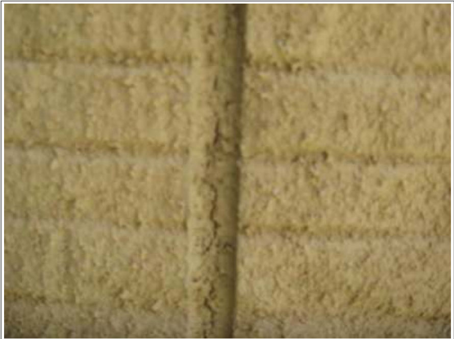
外壁 クラック補修施工前