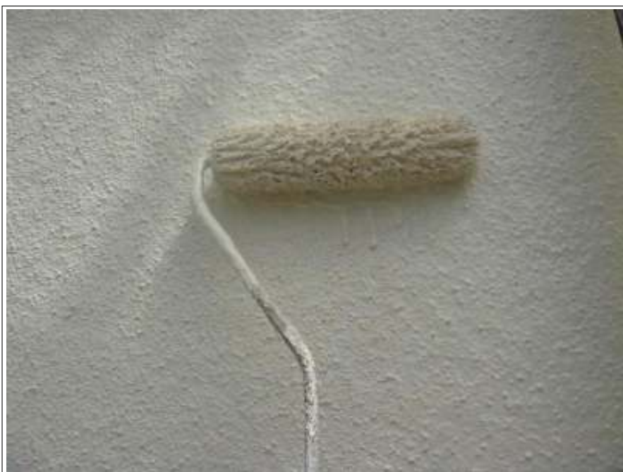
外壁 上塗り施工中