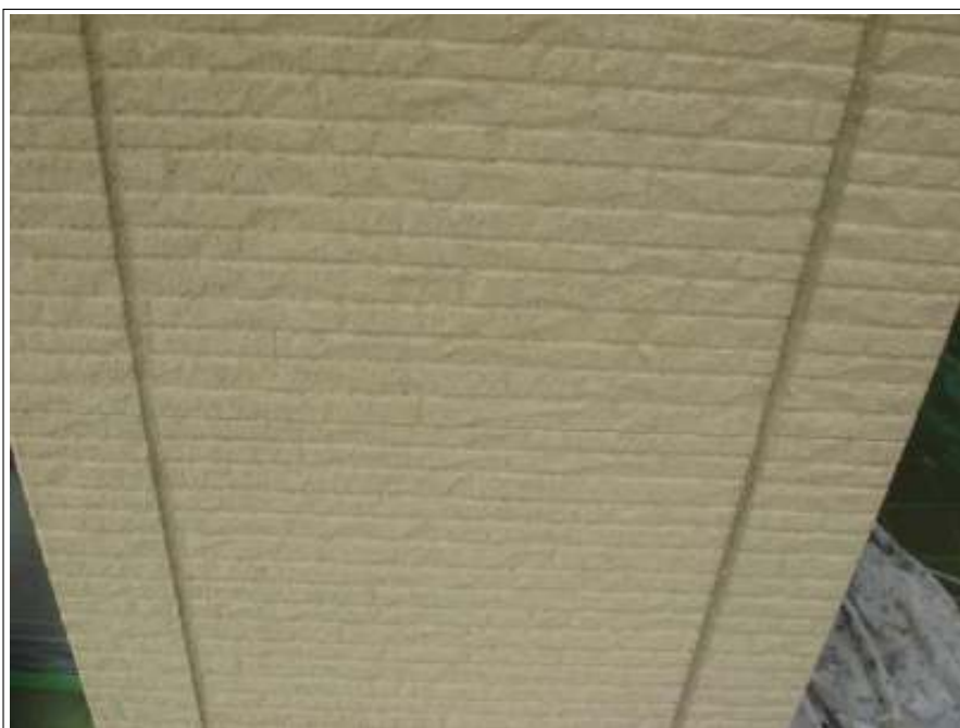
外壁 バリヤー塗布施工中