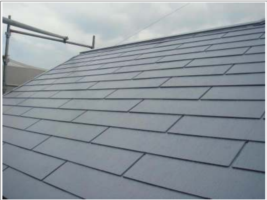
屋根 下塗り施工後