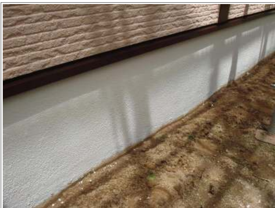
基礎塗り（2回目）施工後