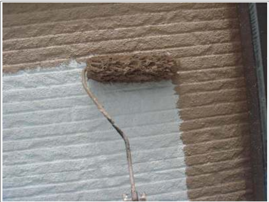
外壁 中塗り施工中