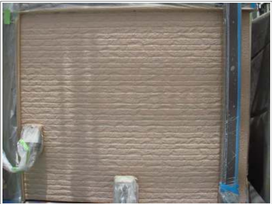
外壁 中塗り施工後