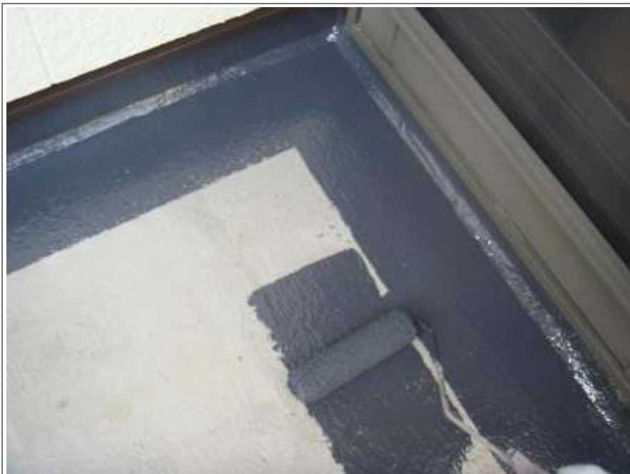
ベランダ 上塗り施工中