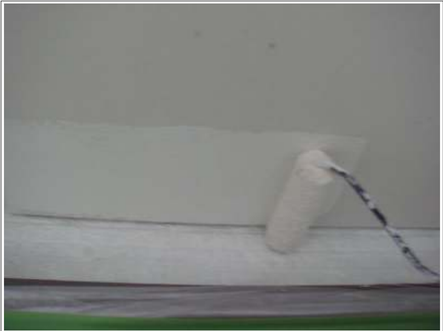
軒天 上塗り（1回目）施工中