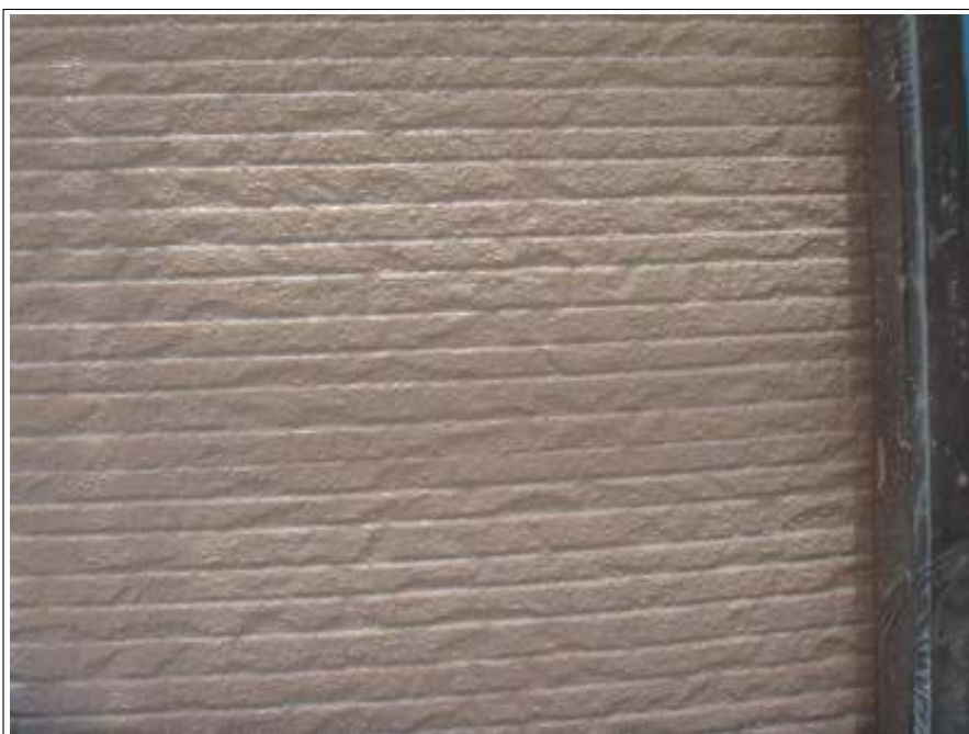
外壁 上塗り施工後