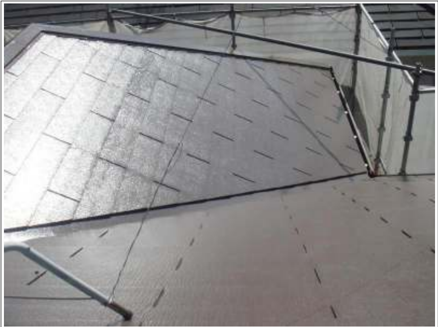
屋根 中塗り施工後