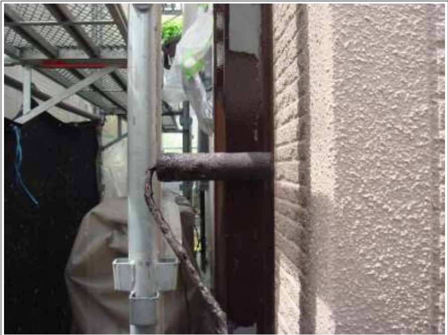
雨樋 上塗り施工中