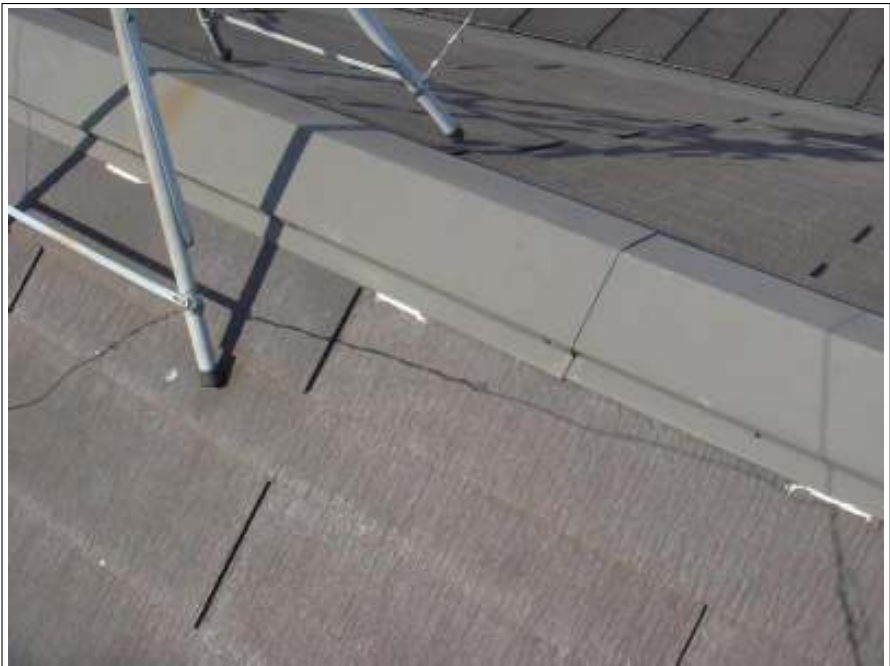
棟鉄板ラバー止め 施工後