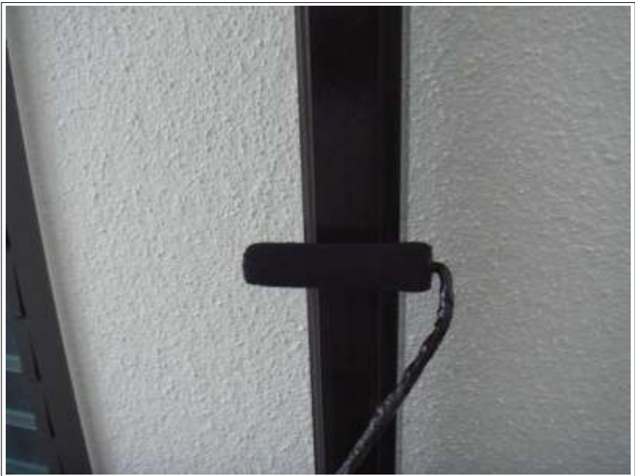
雨樋 上塗り施工中