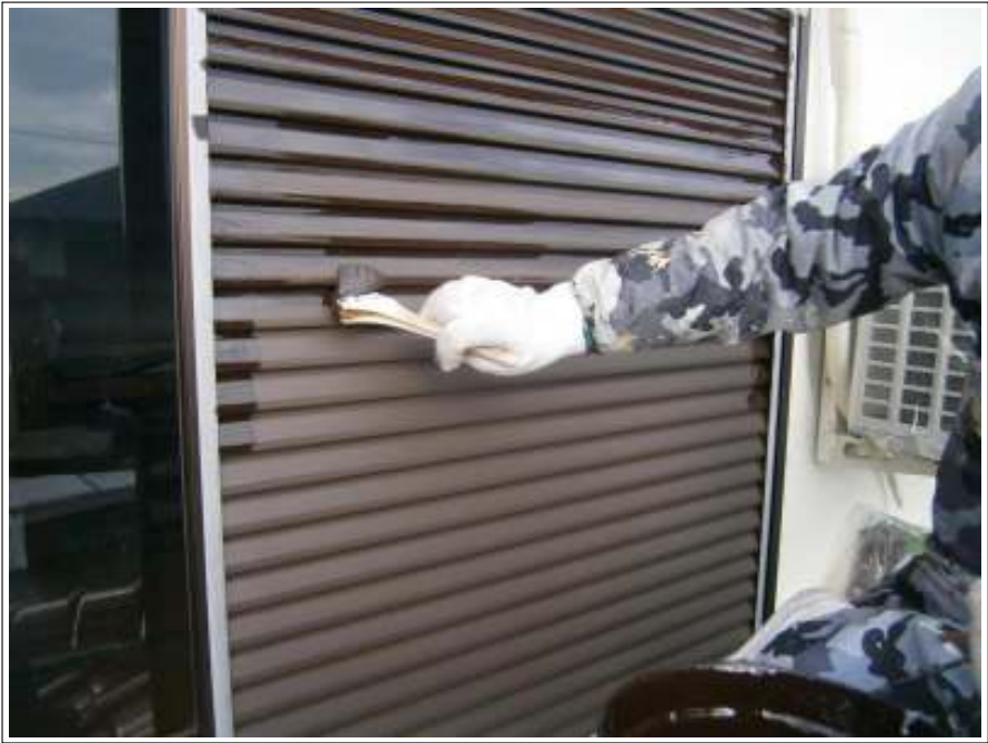
雨戸 上塗り（1回目）施工中