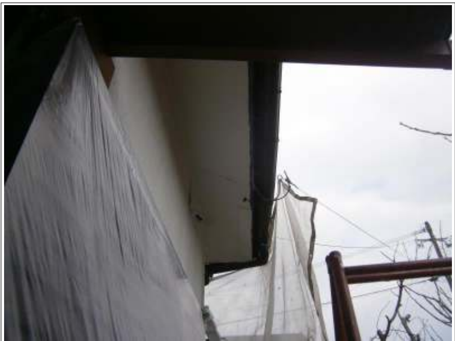
軒天 上塗り（2回目）施工後