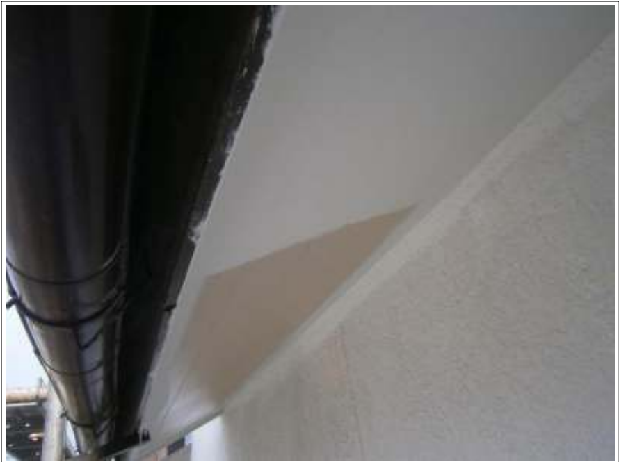
軒天 上塗り（1回目）施工中