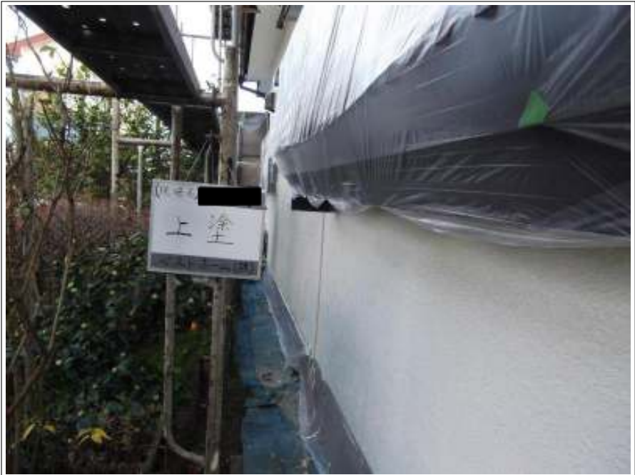
外壁 上塗り施工後