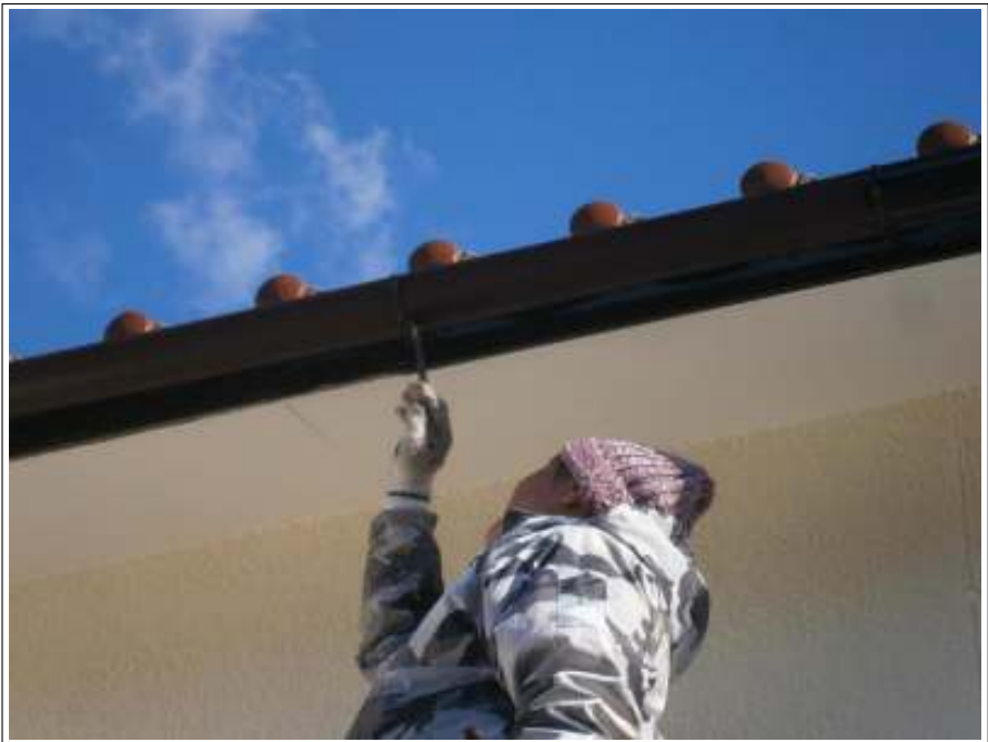
破風板・樋 上塗り施工中