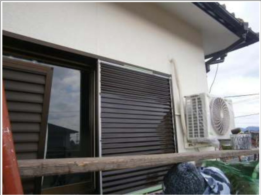
雨戸 上塗り（2回目）施工中