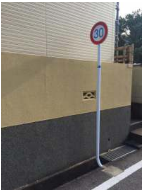
外構塀 非水塗布完了