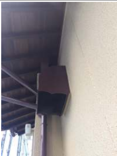
換気フード 上塗り施工後