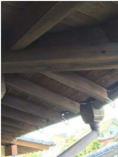
木部 キシラデコール施工中