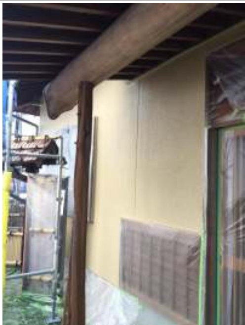
外壁 中塗り施工後