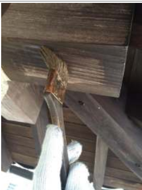
桁キシラデコール施工中