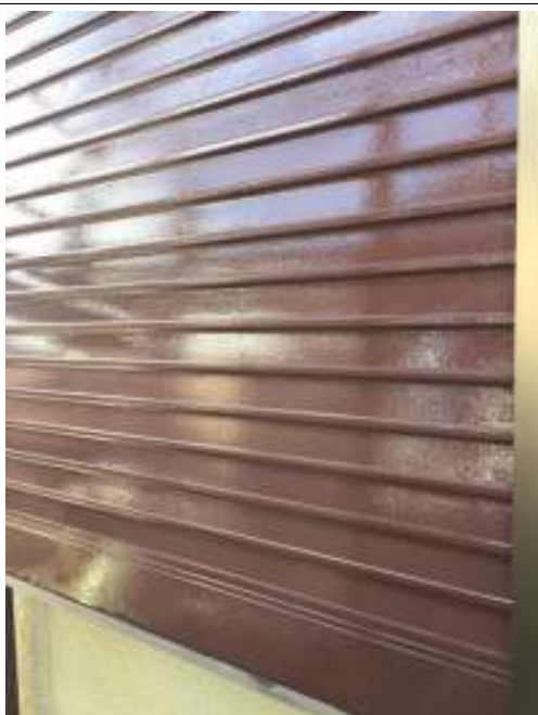
シャッター 上塗り（1回目）施工後