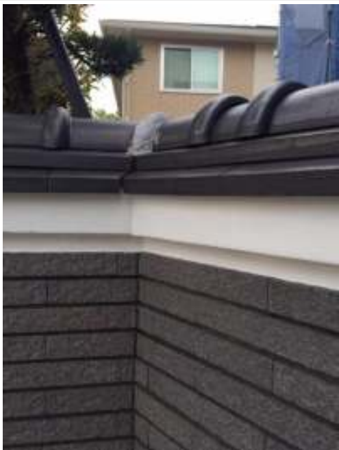
漆喰部 非水塗布完了