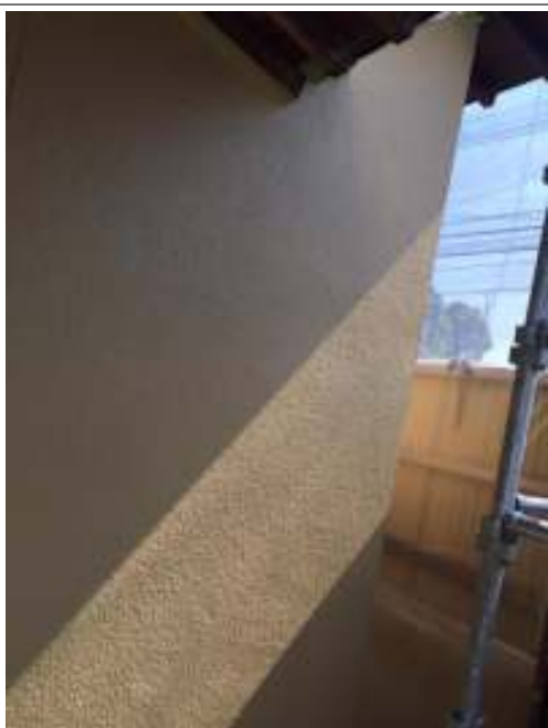
外壁 上塗り施工後