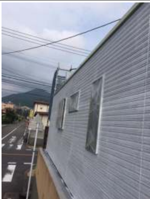
外壁 下塗り施工後