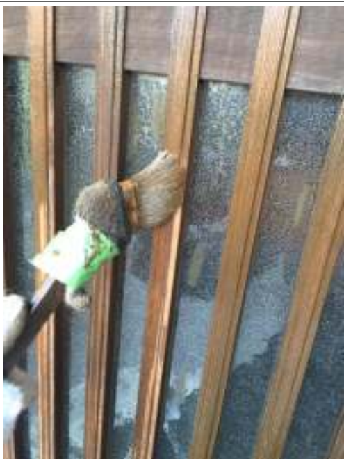
キシラデコール 施工中