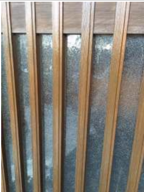
キシラデコール 塗布完了