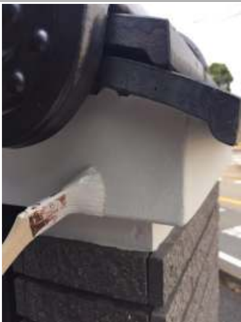
漆喰部 非水二回目塗布中