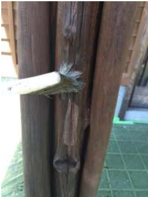
木部 染み抜き施工中