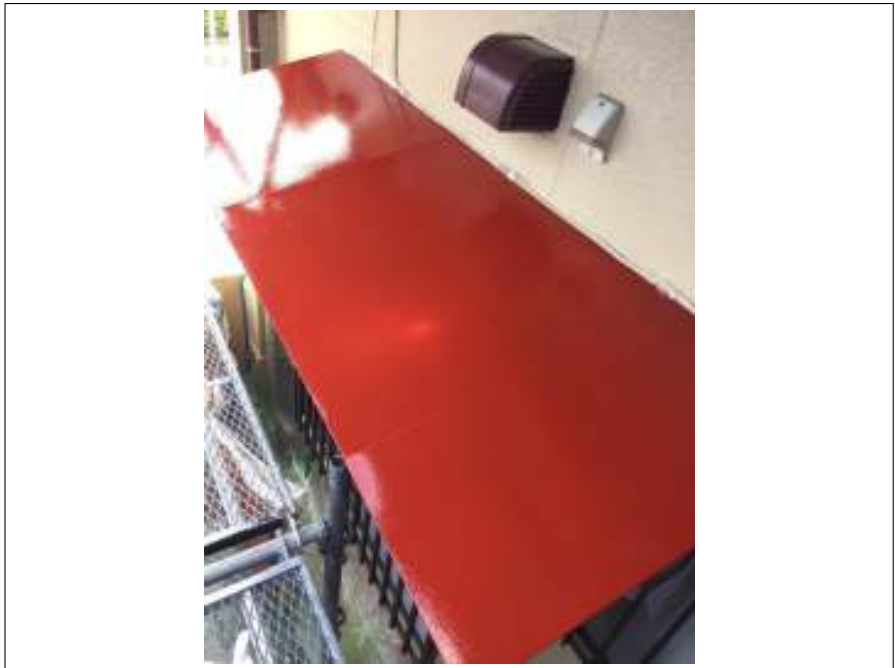
小庇 サビ止め塗布施工後