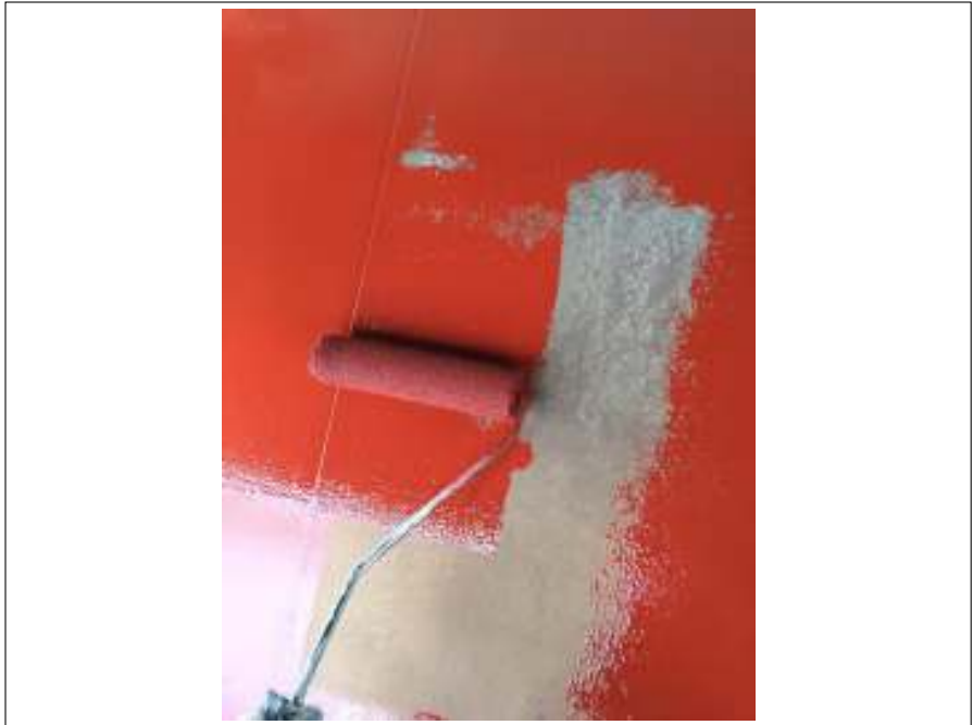
小庇 サビ止め塗布施工中