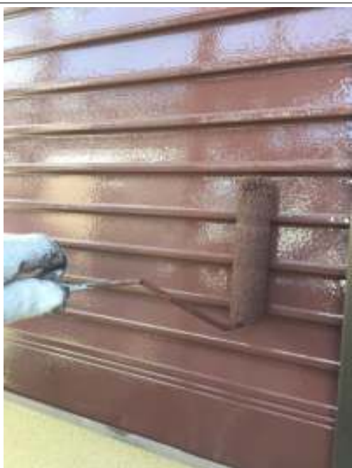
シャッター 上塗り（2回目）施工中