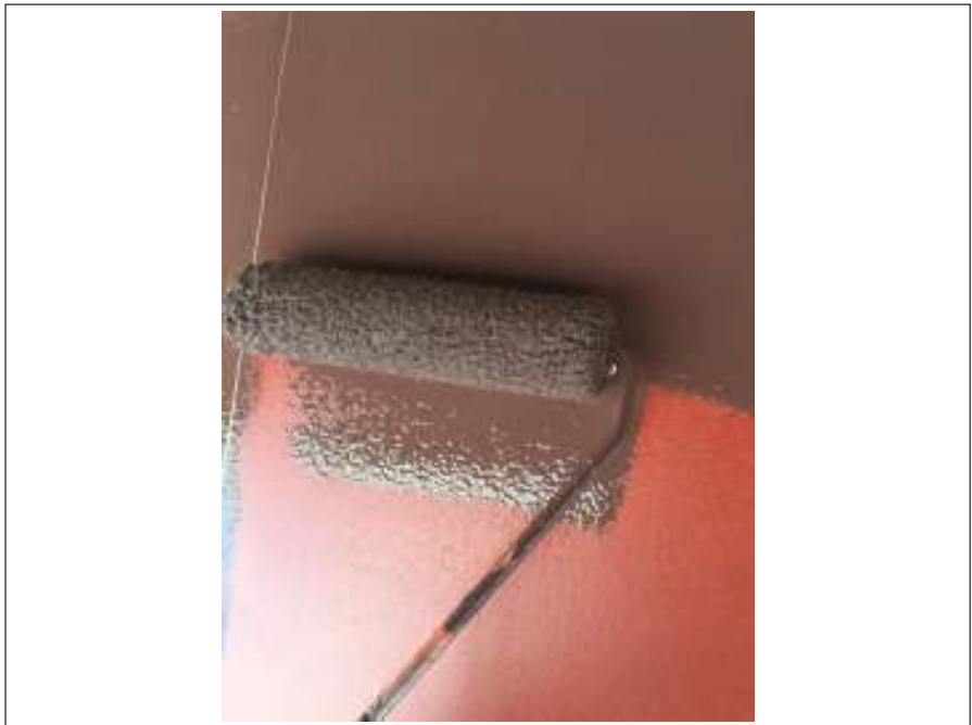
小庇 上塗り施工中