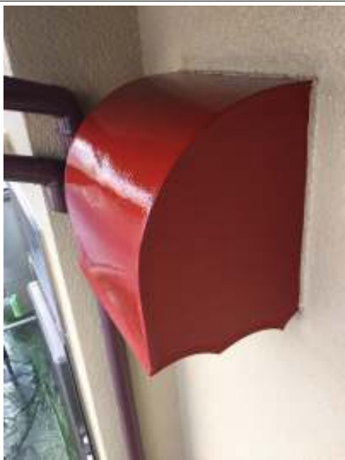
換気フード サビ止め施工後