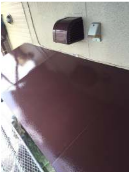
小庇 上塗り施工後