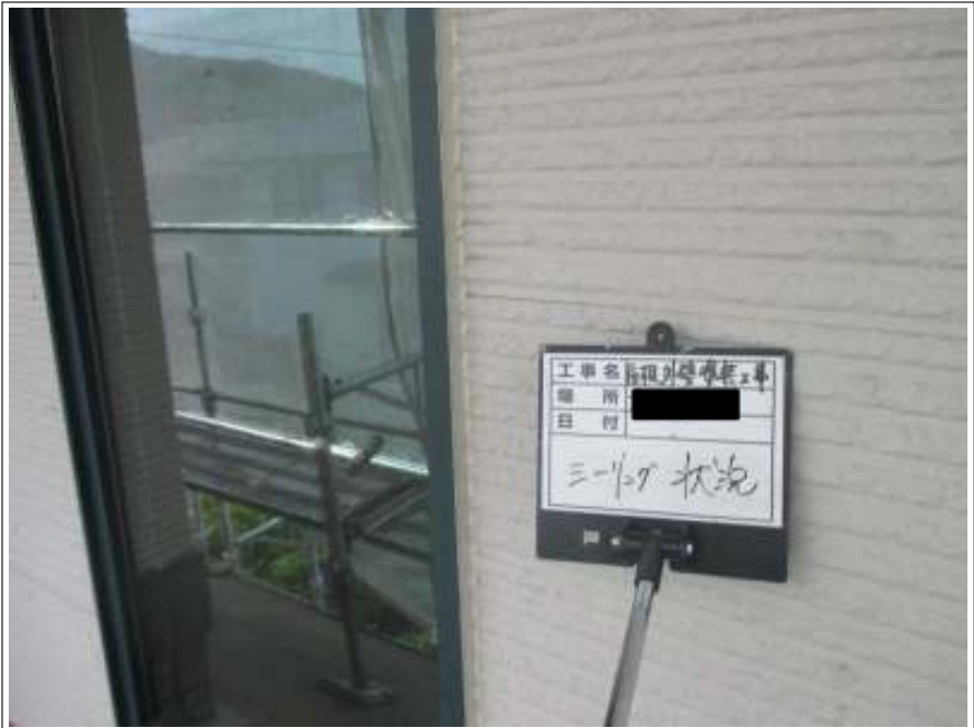
外壁 シーリング打替え完了