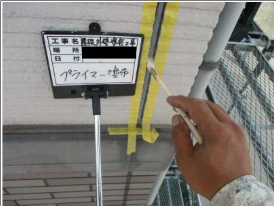
外壁 プライマー施工中