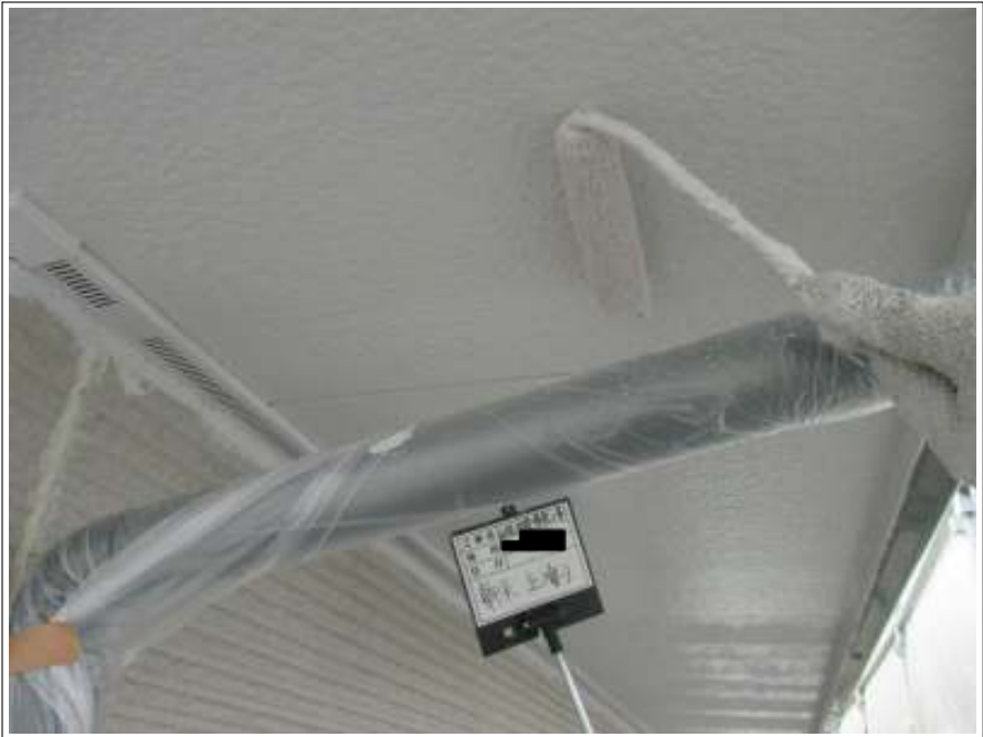
軒天 上塗り施工中