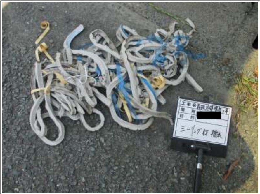
外壁 シーリング撤去施工中