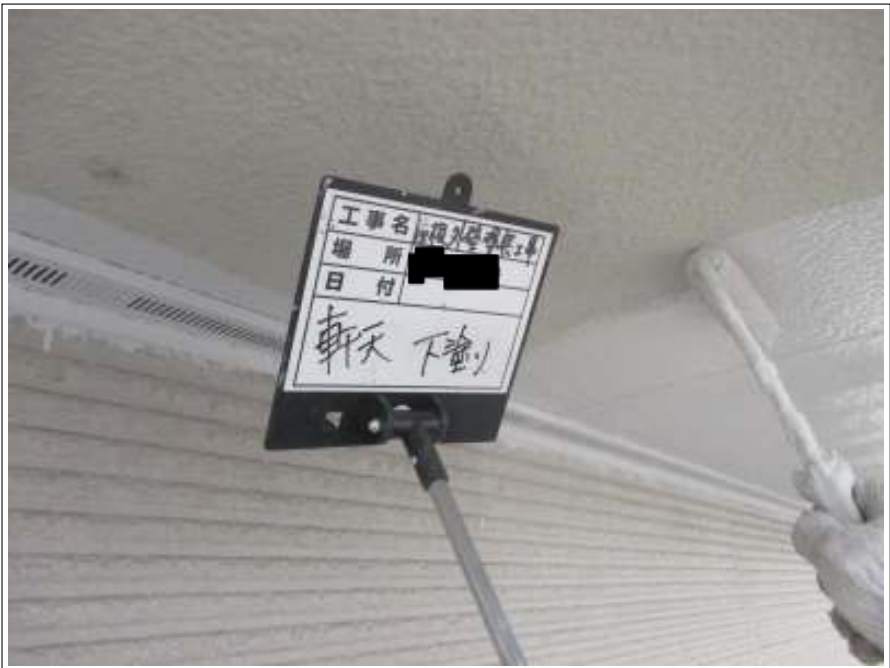
軒天 下塗り施工中