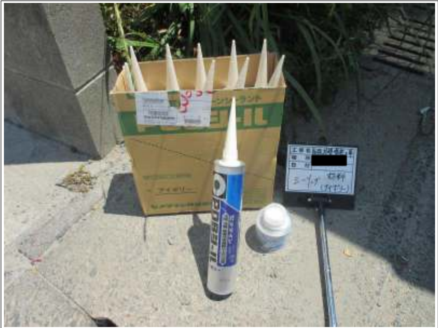
シーリング使用材料