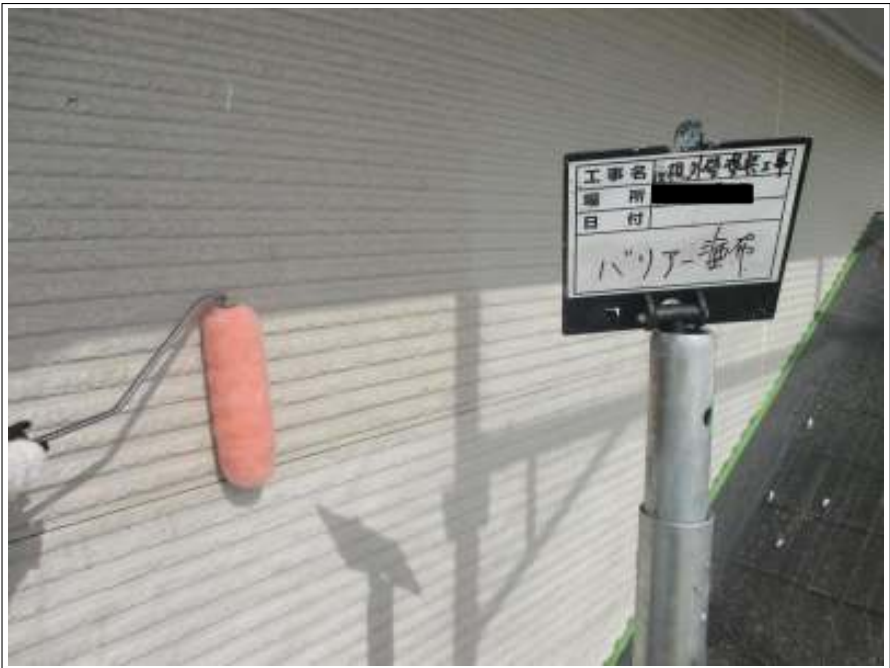
外壁 バリヤー施工中