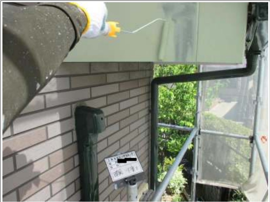
破風 下塗り施工中