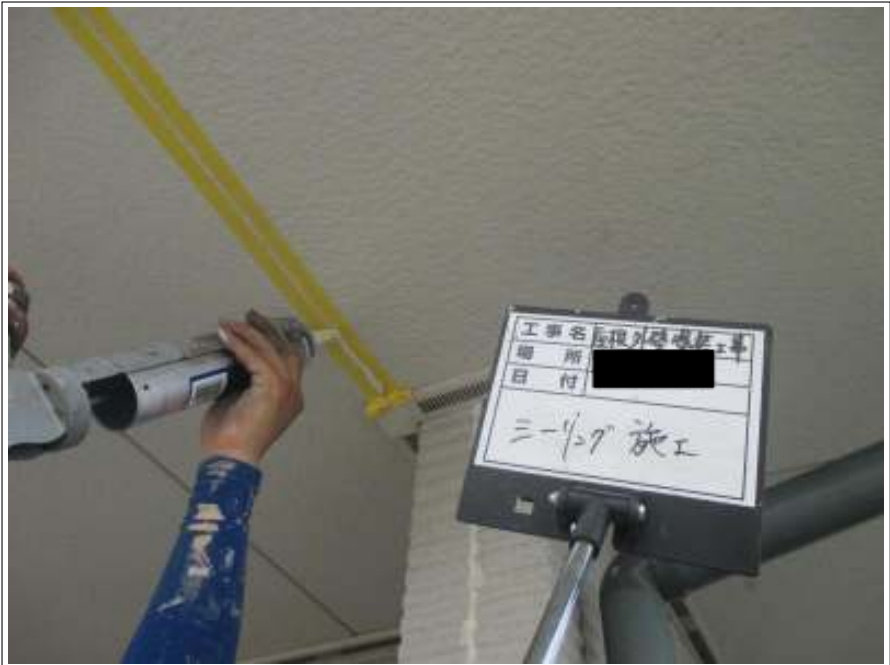
軒天 シーリング打替え施工中