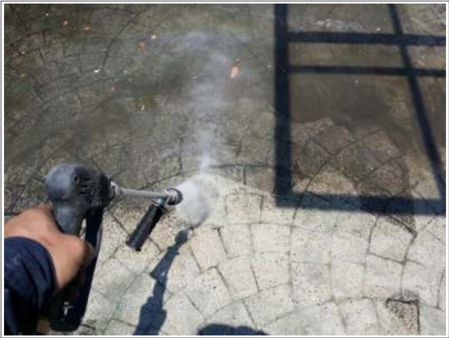
土間高圧洗浄施工中