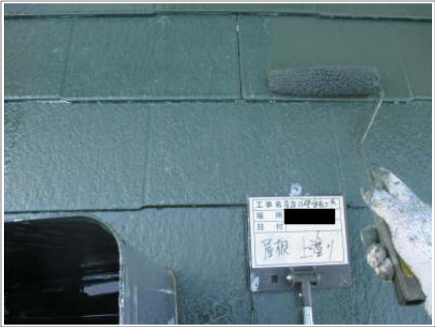
屋根 上塗り施工中