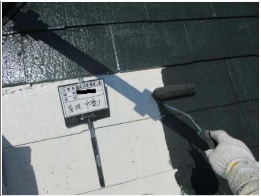
屋根 中塗り施工中