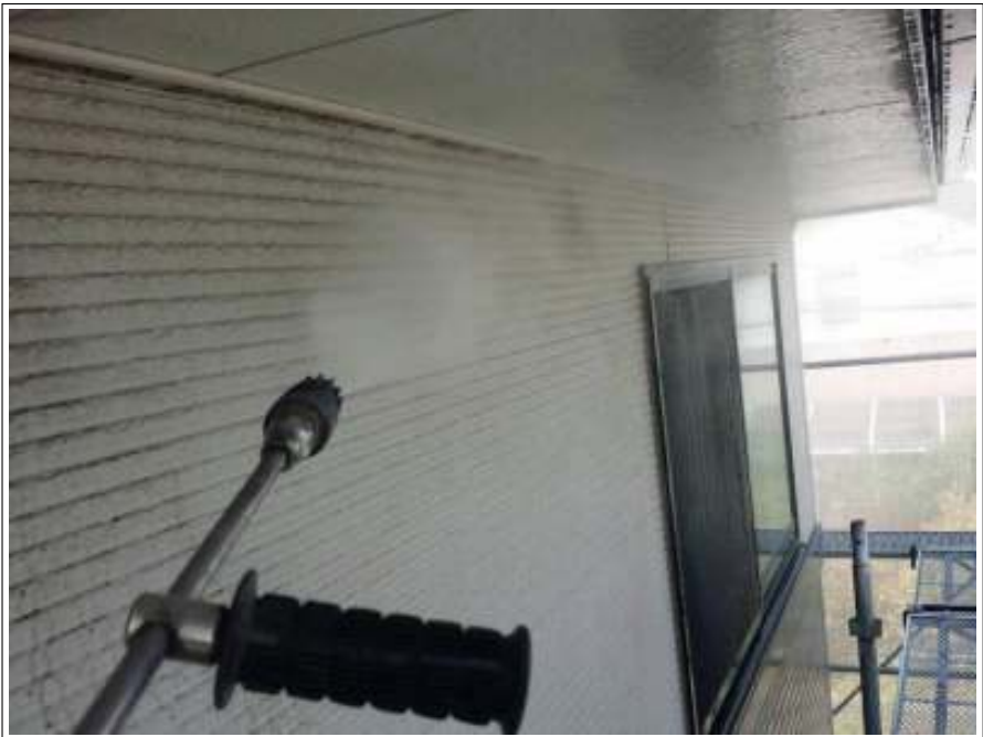
外壁高圧洗浄施工中