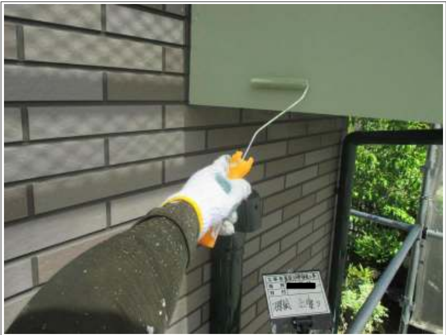
破風 上塗り施工中