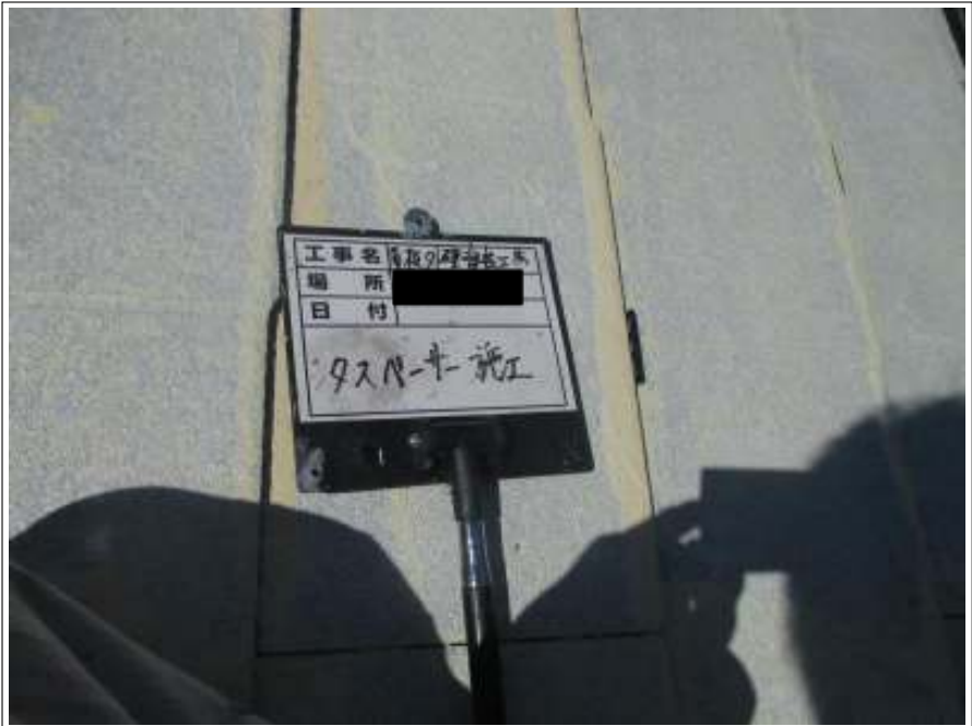
屋根 タスペーサー施工中