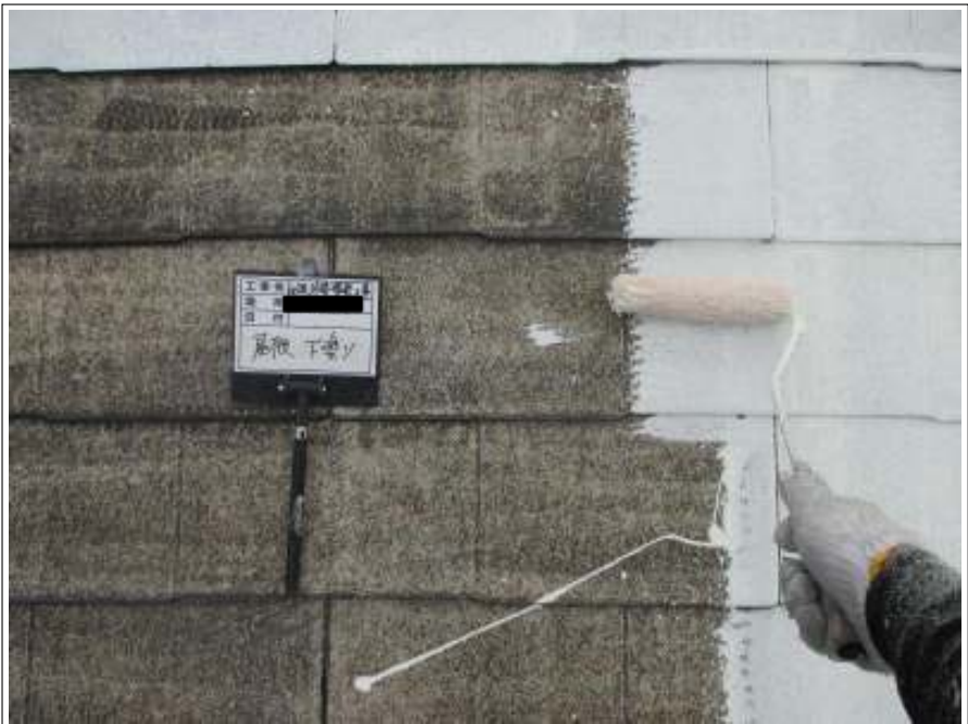
屋根 下塗り施工中