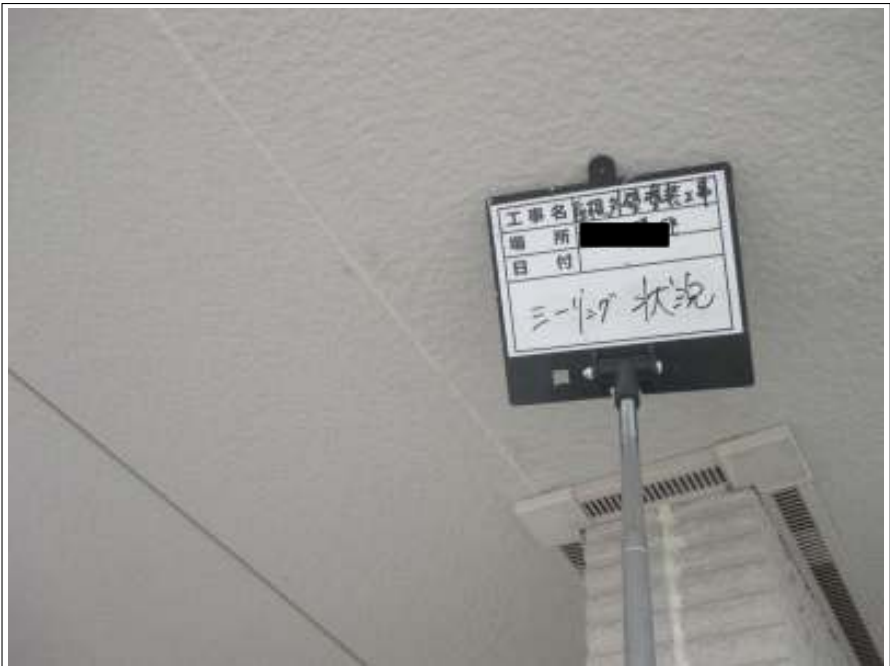
軒天 シーリング打替え施工完了