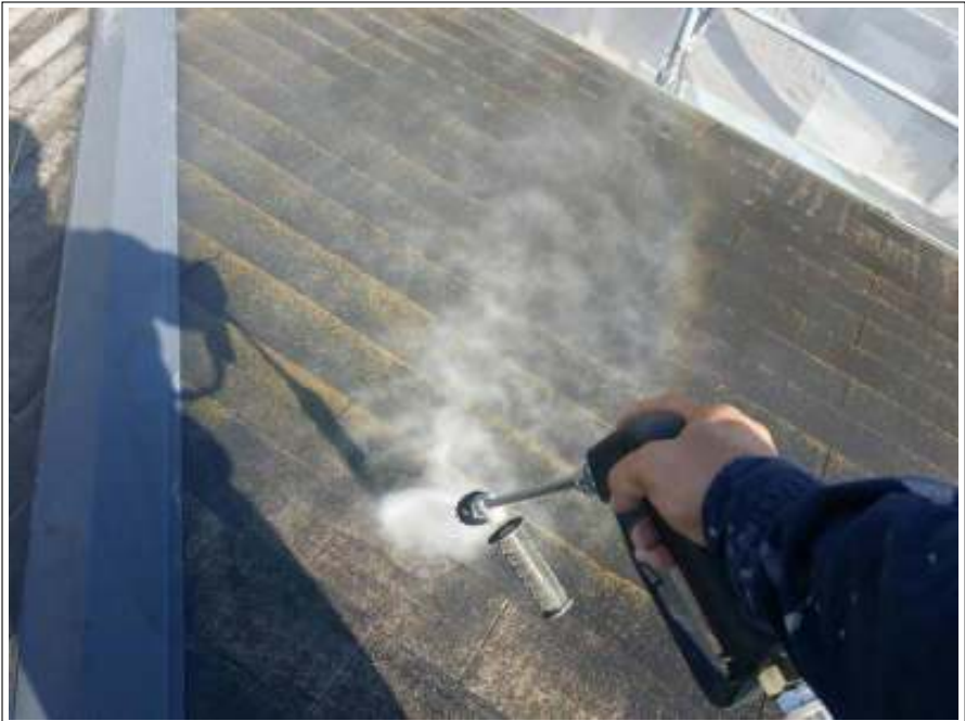
屋根高圧洗浄施工中