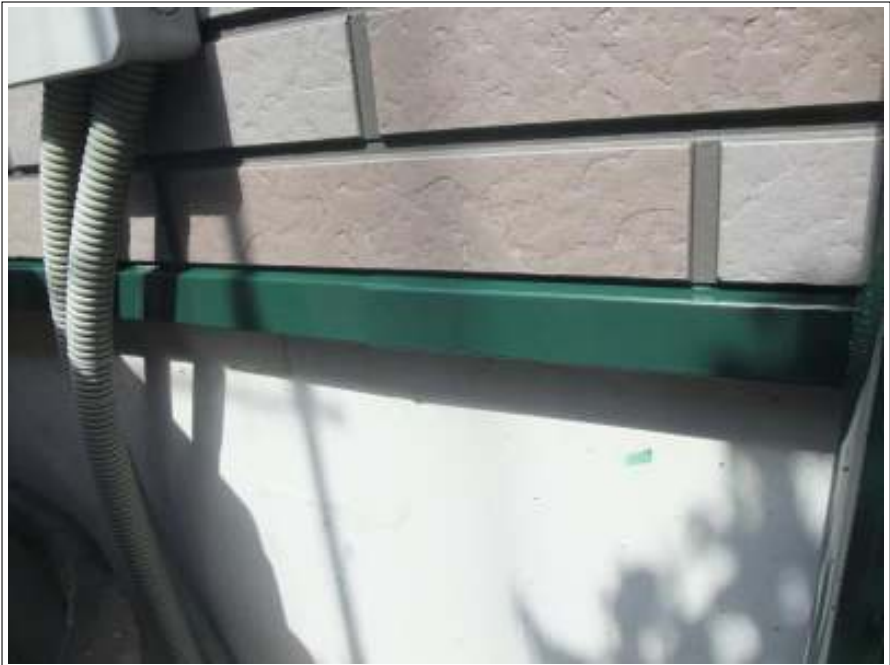
土台水切り 施工完了