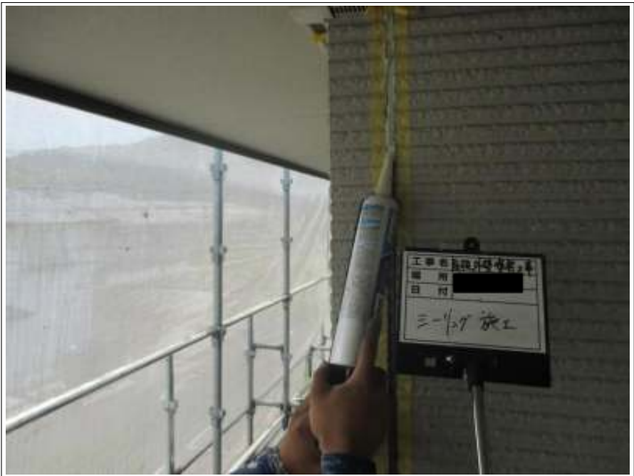
外壁 シーリング打替え施工中