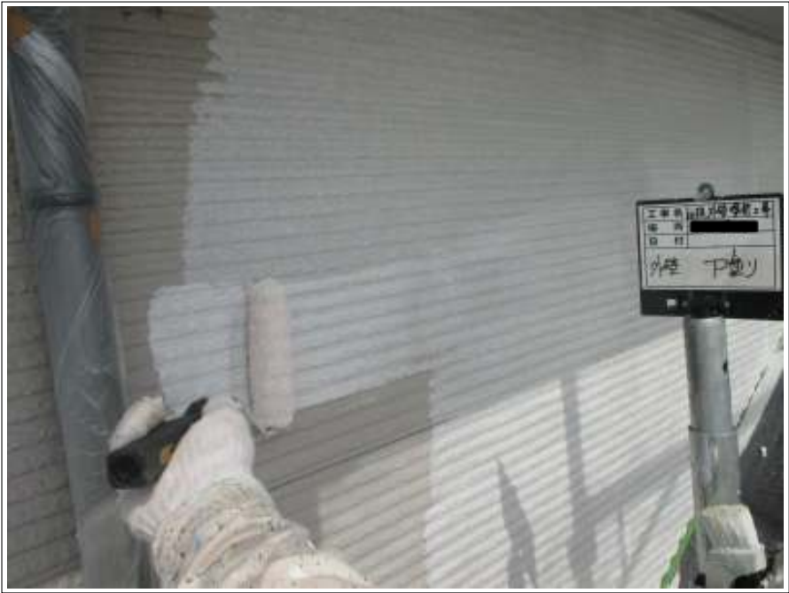
外壁 下塗り施工中