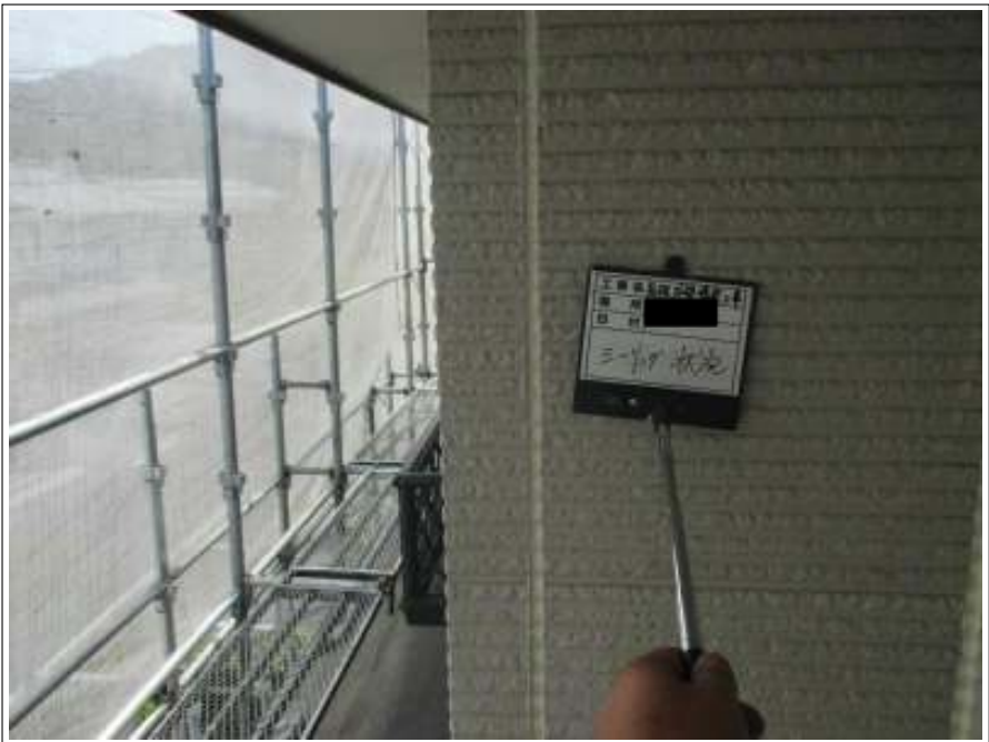
外壁 シーリング打替え完了