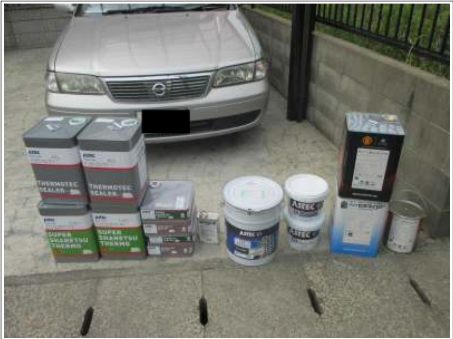
屋根・外壁使用材料