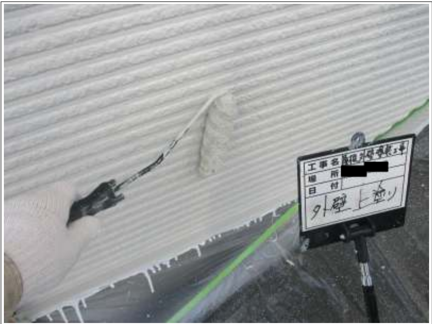
外壁 上塗り施工中