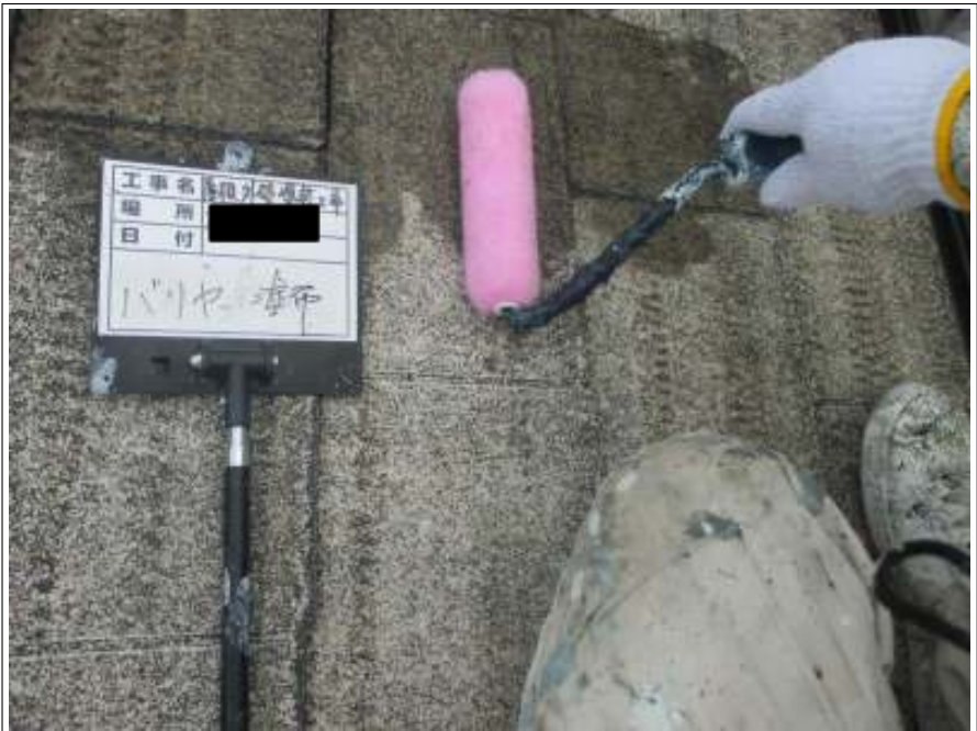
屋根 バリヤー施工中