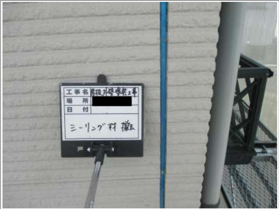
外壁 シーリング撤去施工中