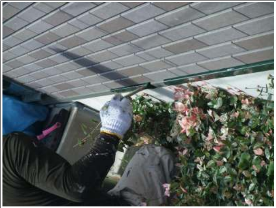
土台水切り 上塗り施工中