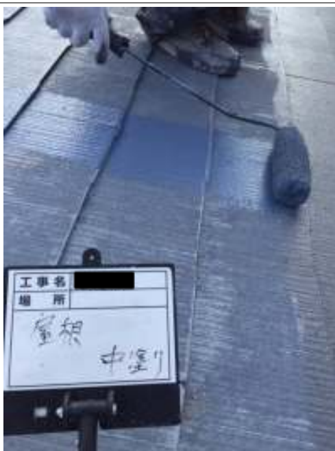
屋根 中塗り施工中