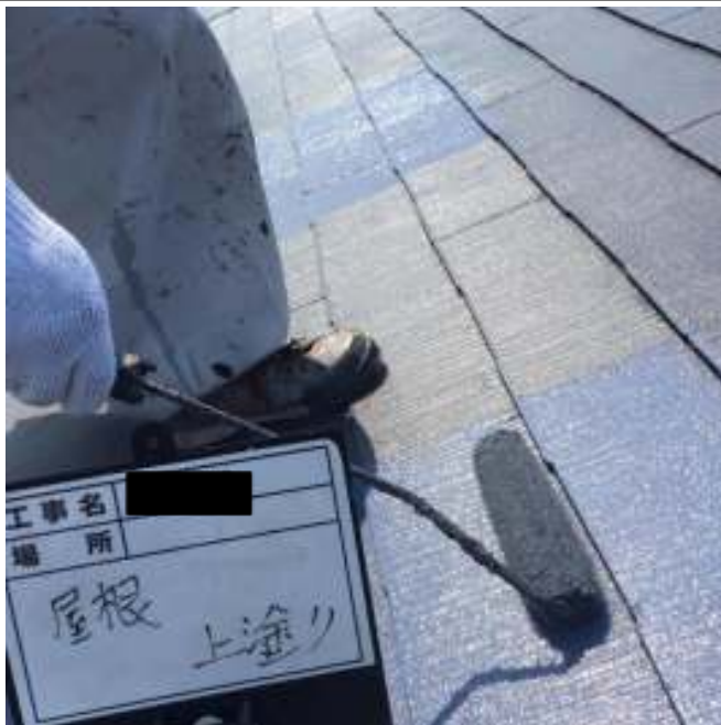
屋根 上塗り施工中