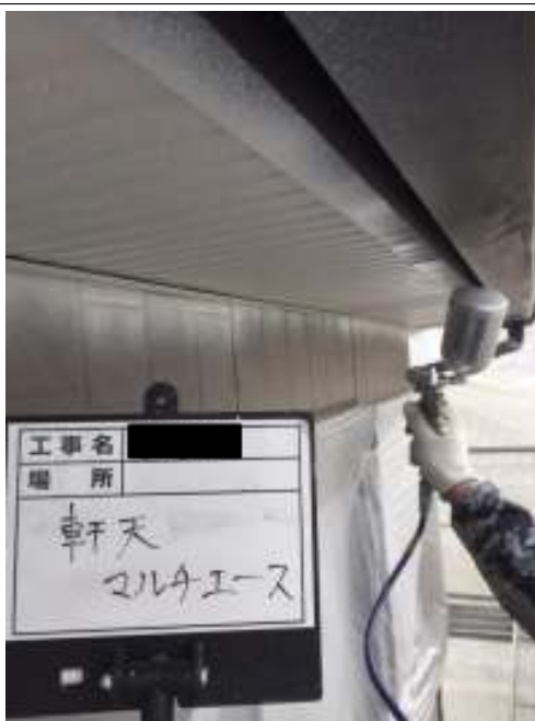
軒天 上塗り施工中