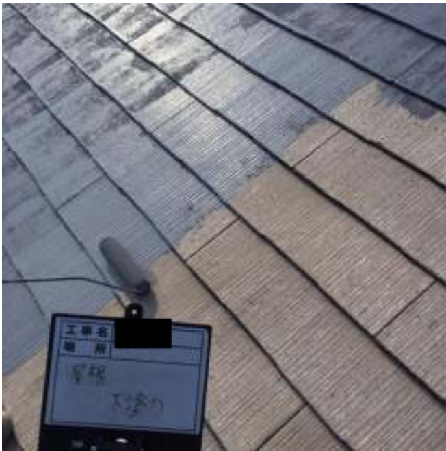
屋根 下塗り施工中