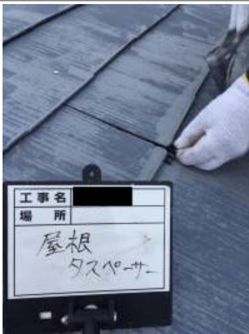
屋根 タスペーサー取付施工中