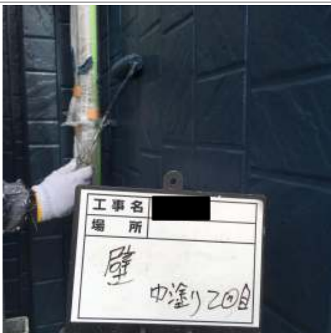
外壁 中塗り施工中（2回目）