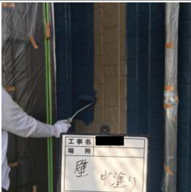
外壁 中塗り施工中（1回目）