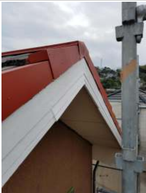
破風板 下塗り施工後