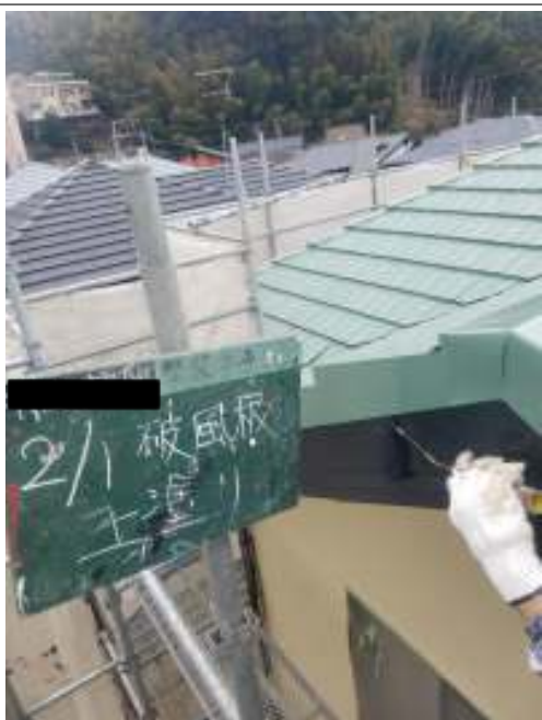
破風板 上塗り施工中