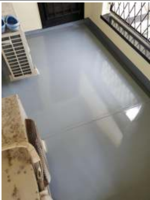
ベランダ 施工完了