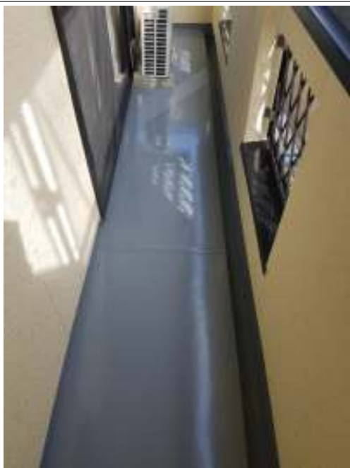
ベランダ 施工完了