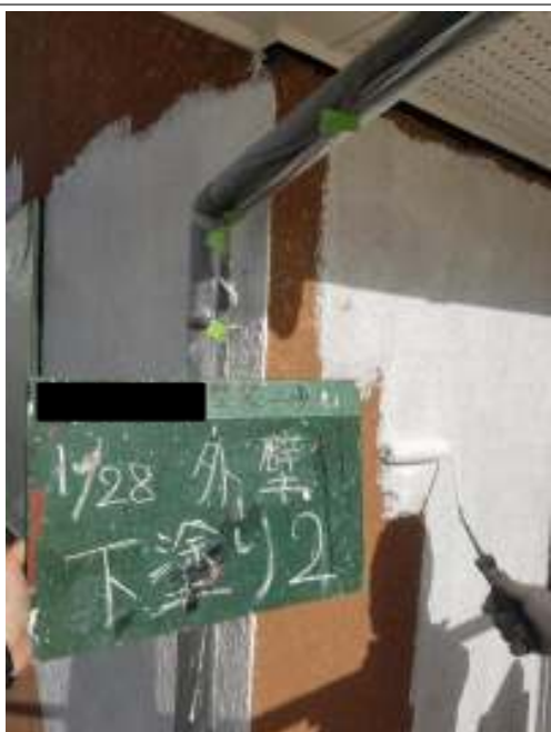
外壁 下塗り（2回目）施工中