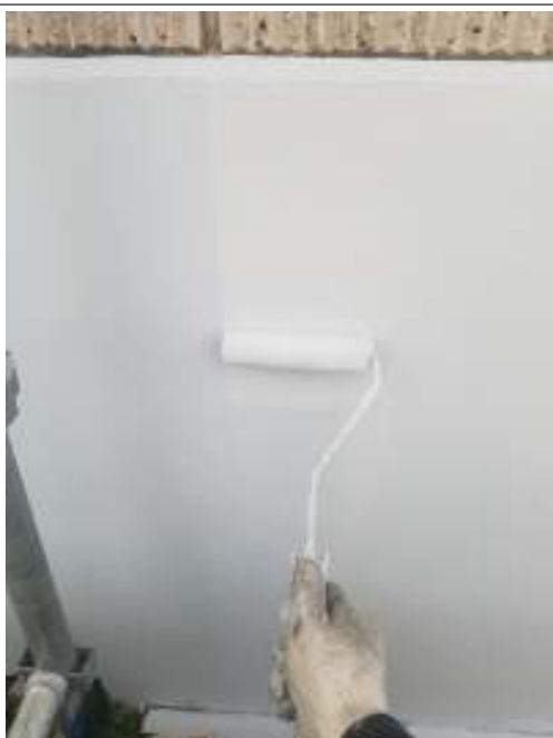
塀 上塗り（2回目）施工中