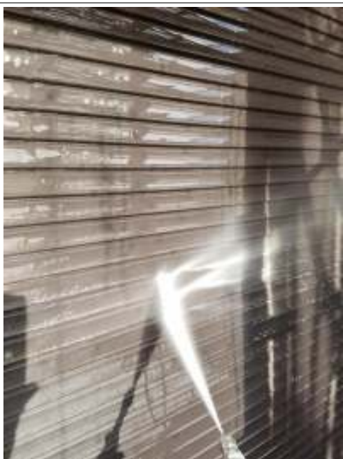
シャッター 高圧洗浄中