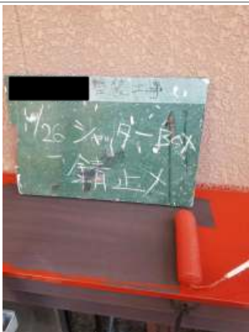
シャッターBOX サビ止め塗布