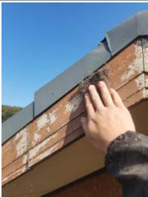
破風板 ケレン処理