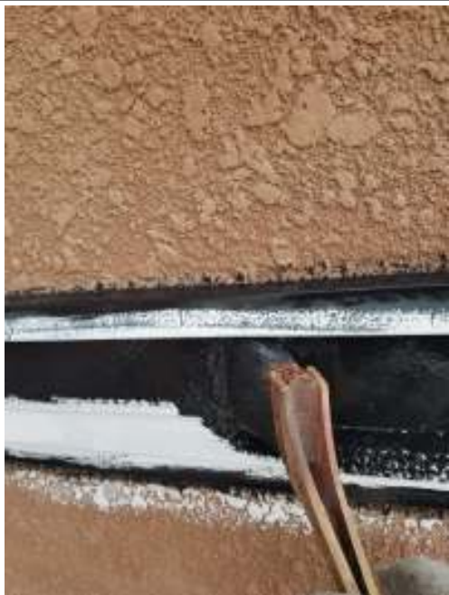
帯 上塗り（1回目）施工中