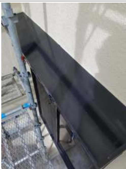
シャッター・シャッターBOX 施工完了