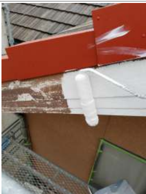
破風板 下塗り施工中