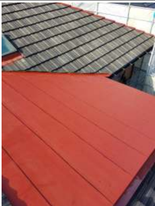
屋根 鉄部サビ止め施工中