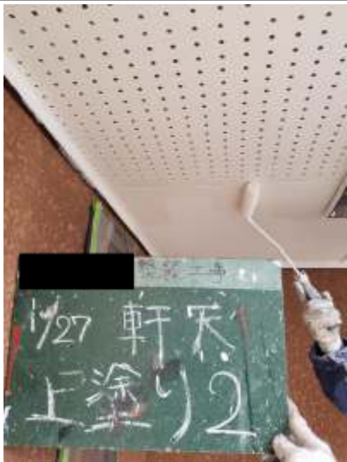
軒天 上塗り（2回目）施工中