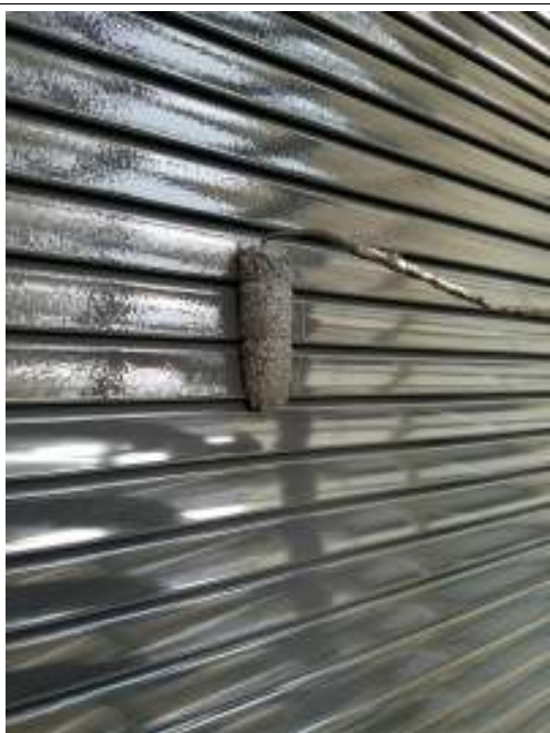
シャッター 上塗り(2回目) 施工中