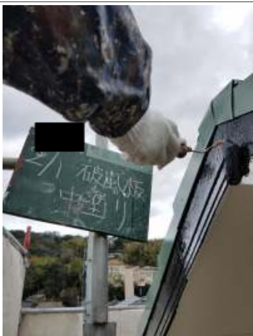
破風板 中塗り施工中