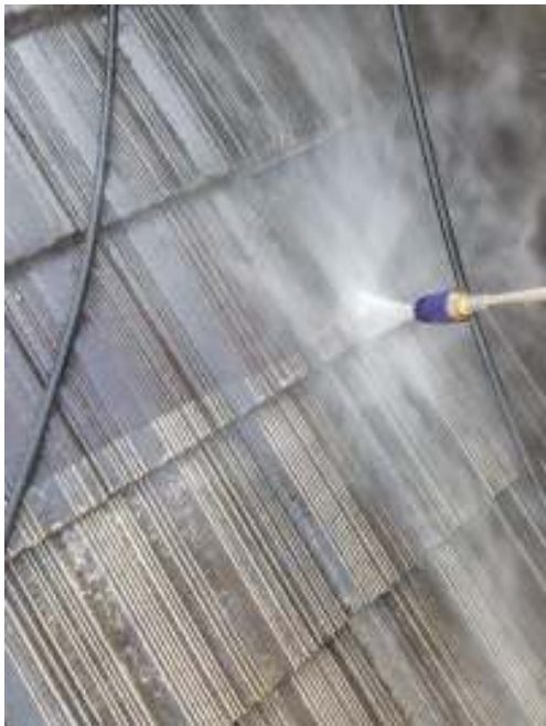
屋根 高圧洗浄中（1回目）