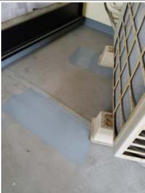
ベランダ 防水材塗布