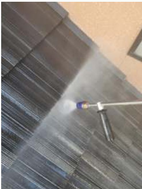
屋根 高圧洗浄中（2回目）