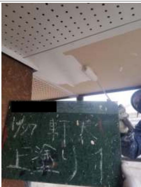
軒天 上塗り（1回目）施工中