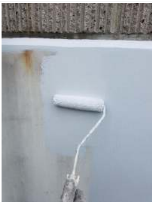
塀 上塗り（1回目）施工中