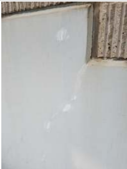
塀 下地処理施工後