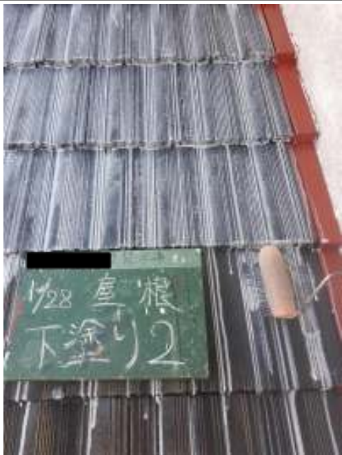
屋根 下塗り（2回目）施工中