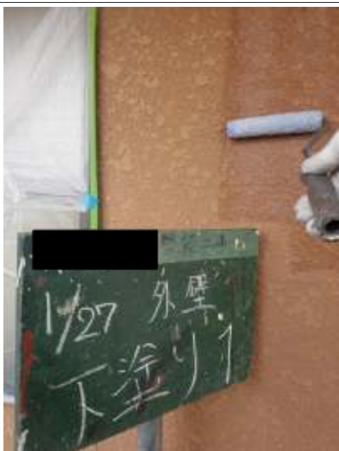
外壁 下塗り（1回目）施工中