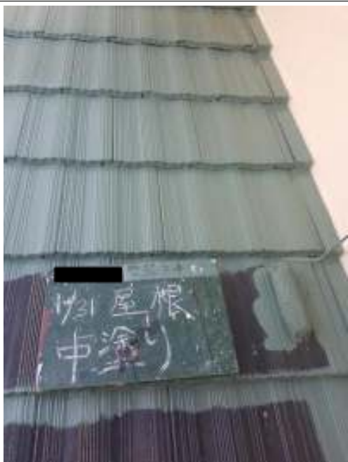
屋根 中塗り施工中