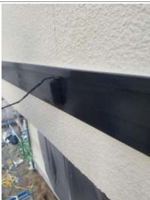
帯 上塗り（2回目）施工中