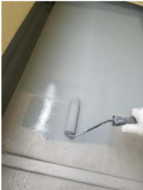
ベランダ 防水材塗布