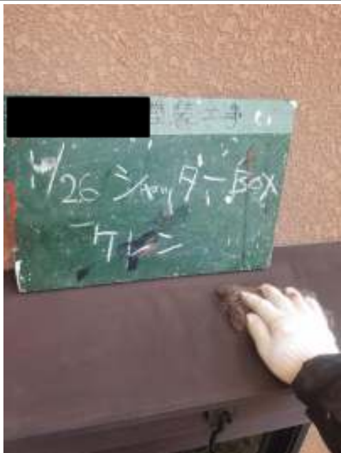
シャッターBOX ケレン処理