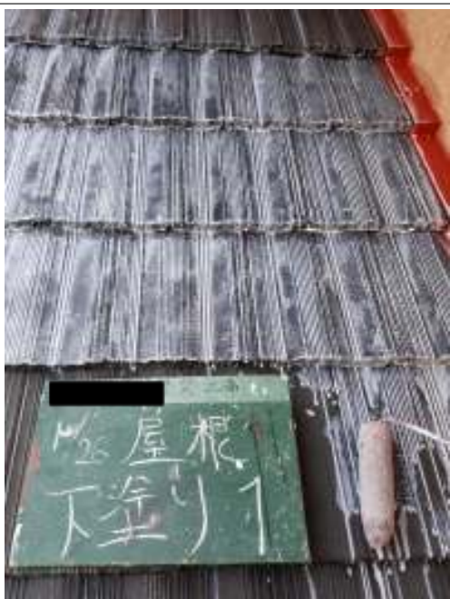
屋根 下塗り（1回目）施工中