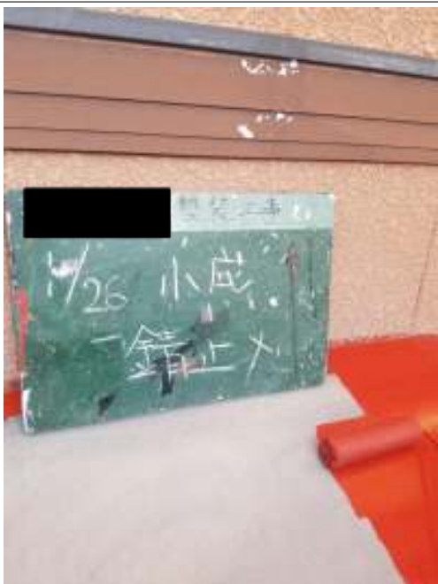
小庇 サビ止め塗布