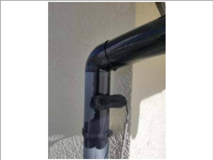
樋 上塗り（1回目）施工中