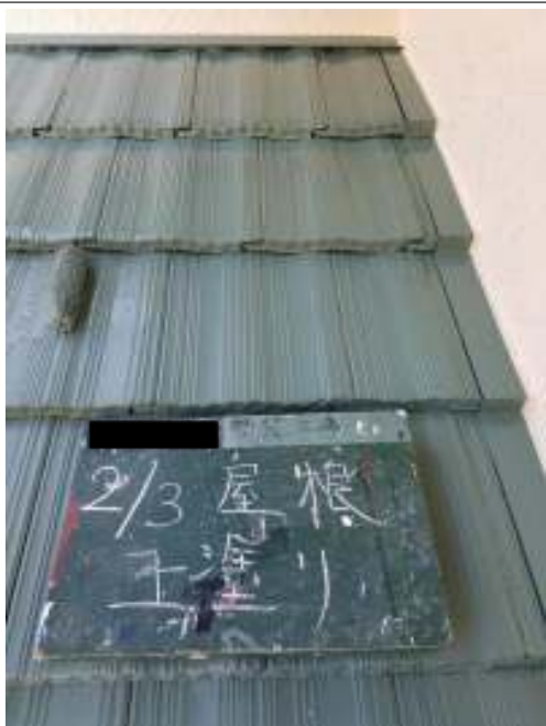
屋根 上塗り施工中