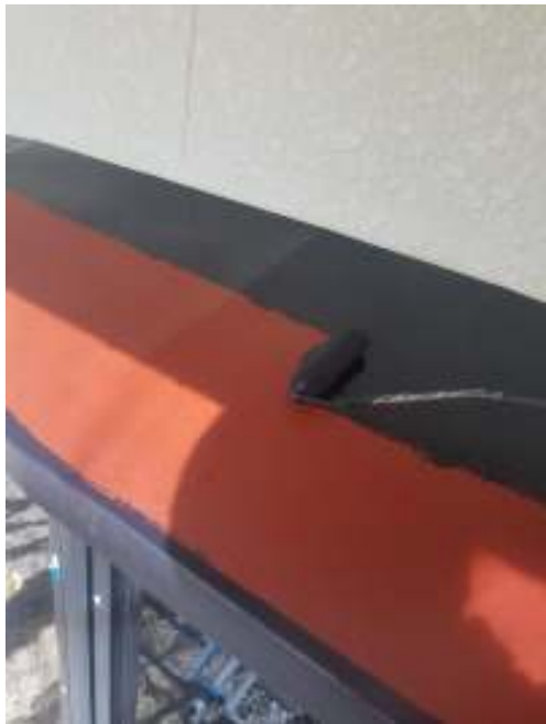
小庇 上塗り（1回目）施工中