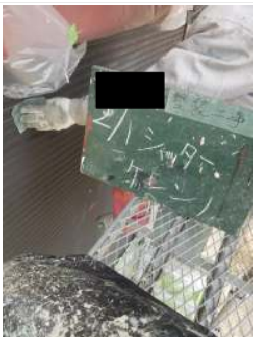
シャッター ケレン処理