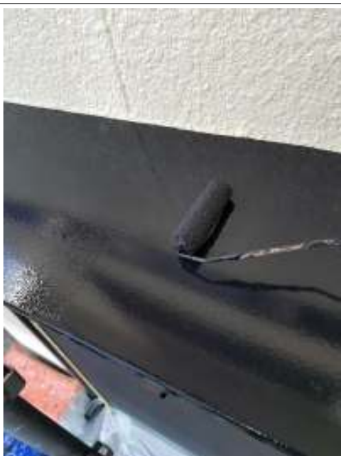
小庇 上塗り（2回目）施工中