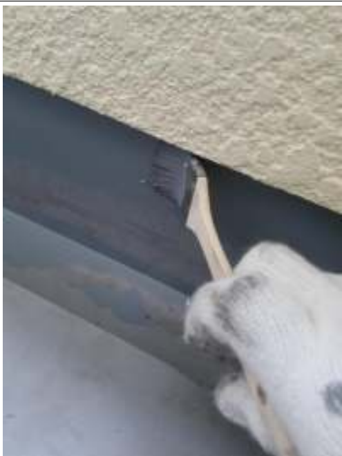
ベランダ 防水材塗布