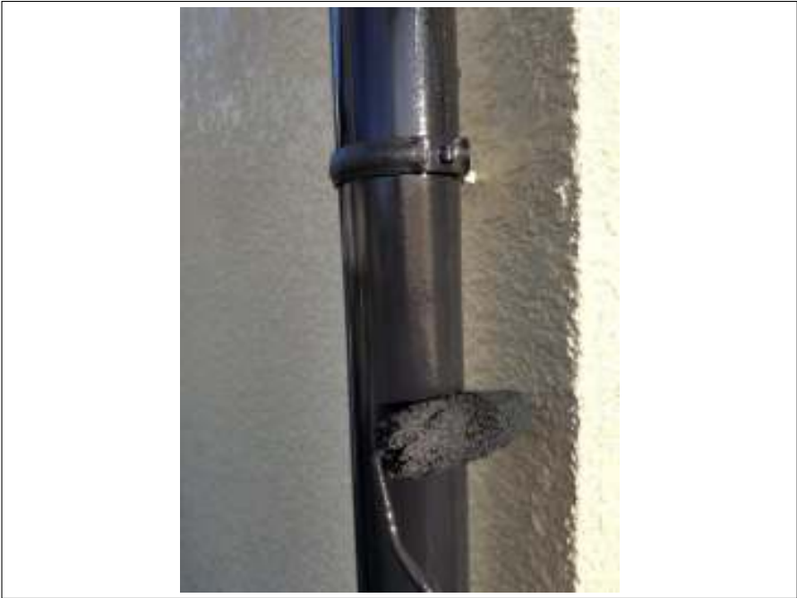
樋 上塗り（2回目）施工中