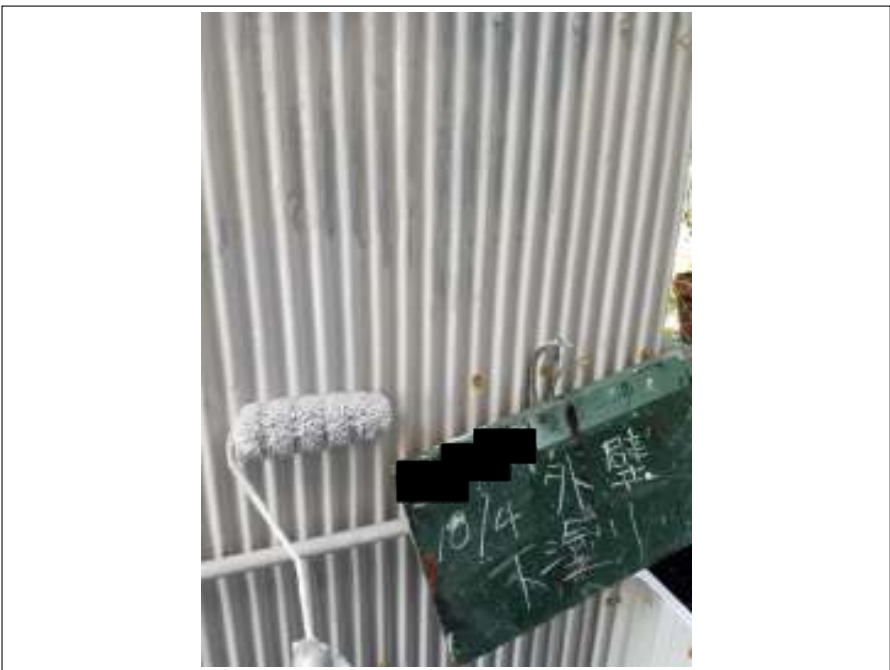
外壁 下塗り 施工中