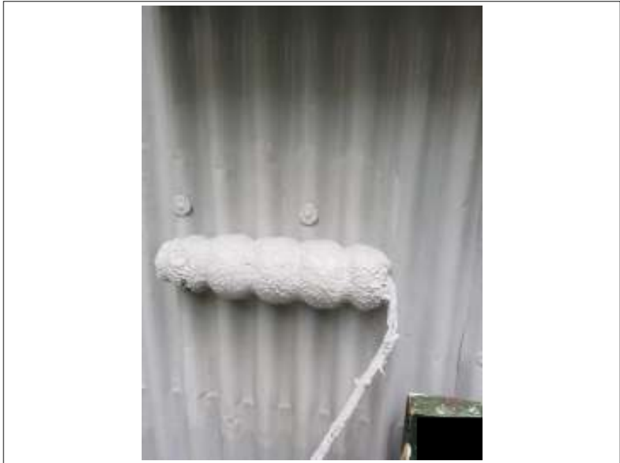
外壁 上塗り 施工中