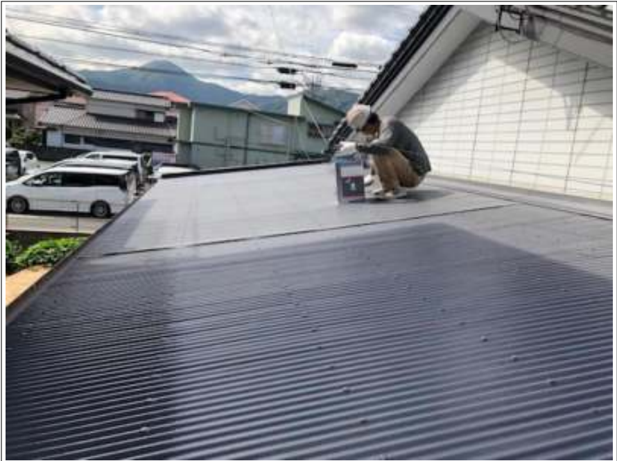
屋根 上塗り 施工中