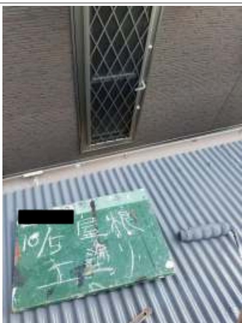
屋根 上塗り 施工中