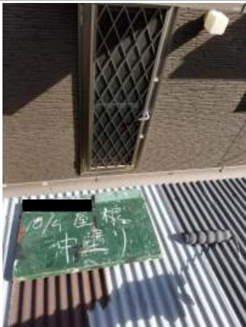
屋根 中塗り 施工中