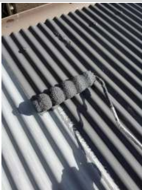
屋根 中塗り 施工中