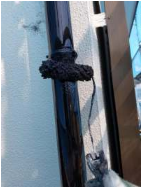
樋 上塗り（2回目）施工中