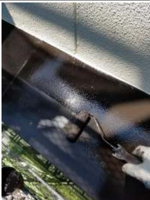
小庇 上塗り施工中