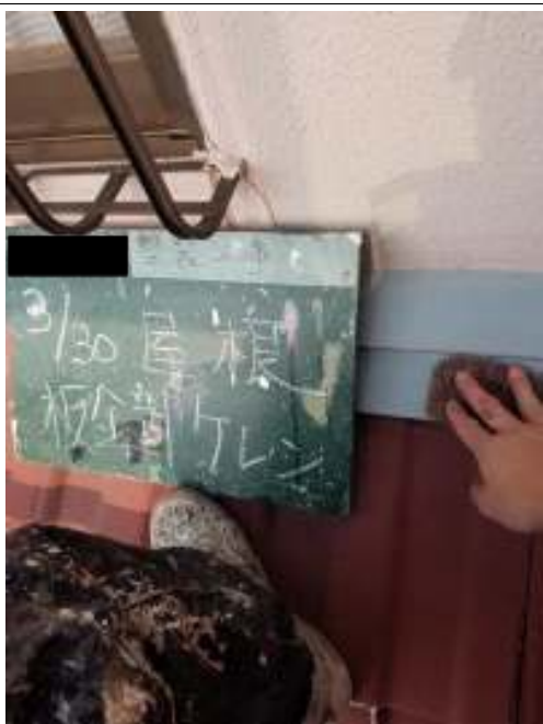
屋根 ケレン処理施工中