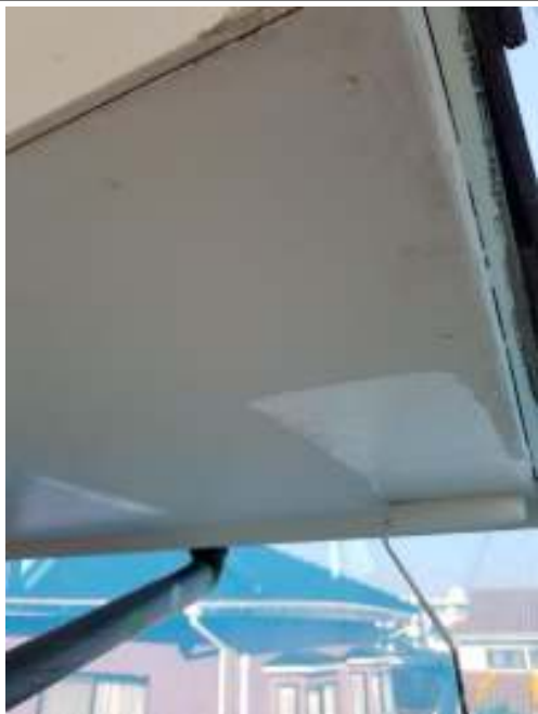
軒天 上塗り（1回目）施工中