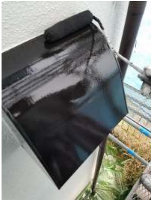
換気フード 上塗り(2回目)施工中