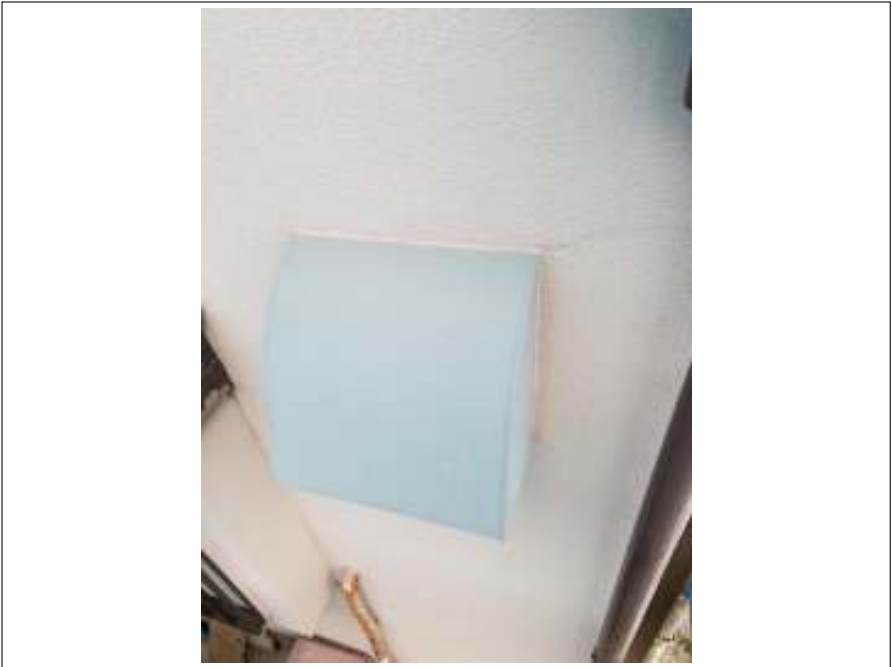
換気フード 施工前