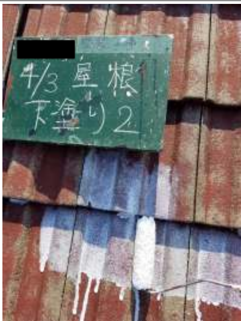
屋根 下塗り（2回目）施工中