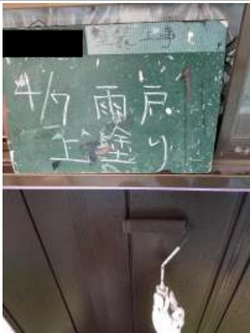
雨戸 上塗り施工中