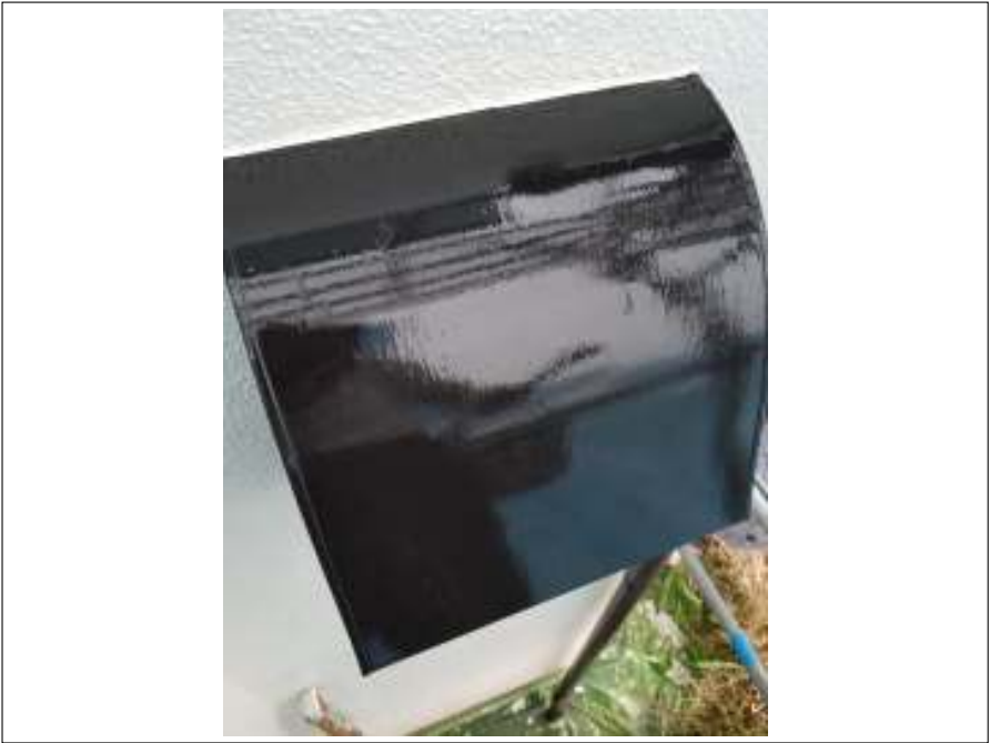
換気フード 上塗り(1回目)施工中