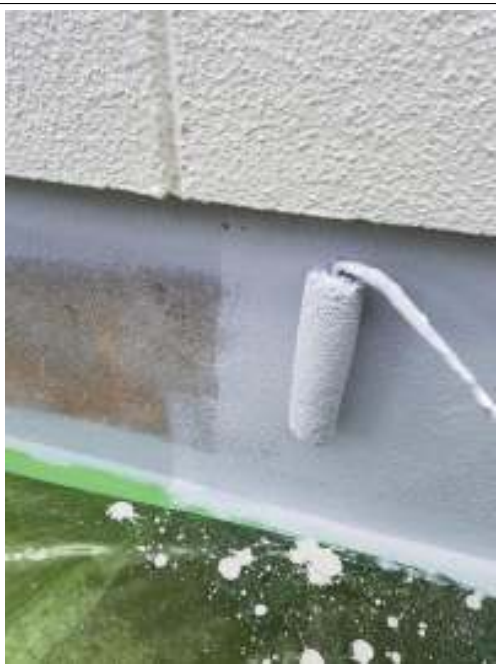
基礎 上塗り（1回目）施工中