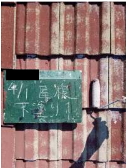
屋根 下塗り（1回目）施工中