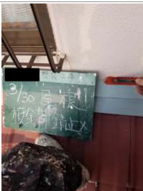
屋根 サビ止め塗布施工中