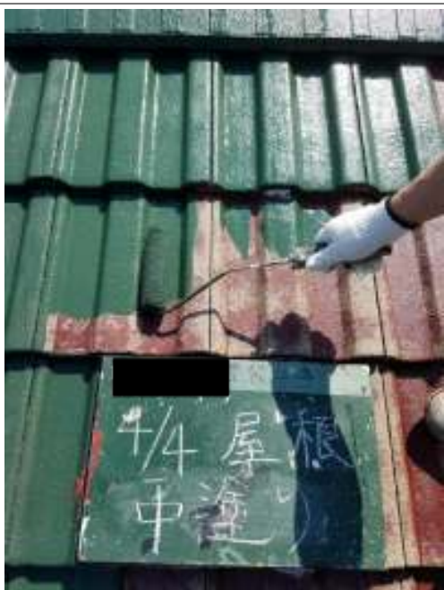
屋根 中塗り施工中