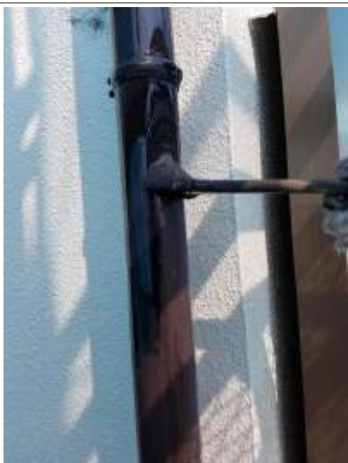
樋 上塗り（1回目）施工中