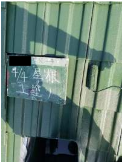
屋根 上塗り施工中