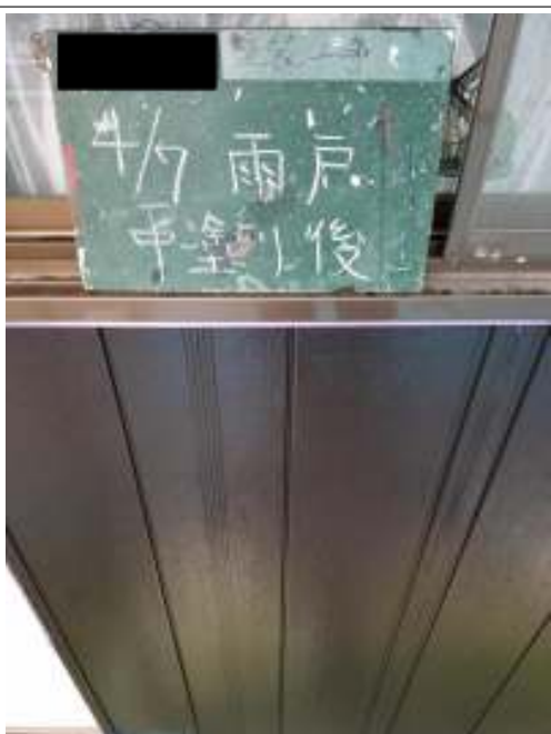
雨戸 中塗り施工後