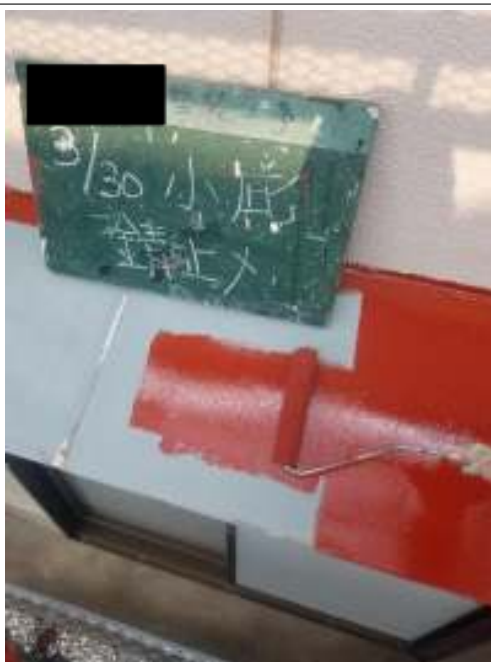
小庇 サビ止め塗布施工中