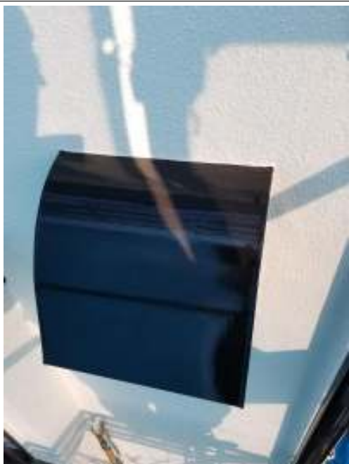
換気フード 施工完了