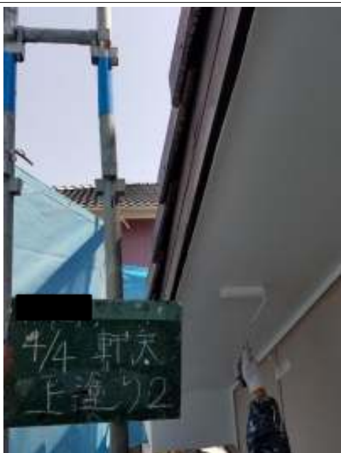
軒天 上塗り（2回目）施工中