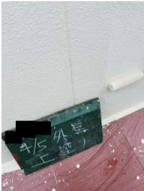
外壁 上塗り施工中