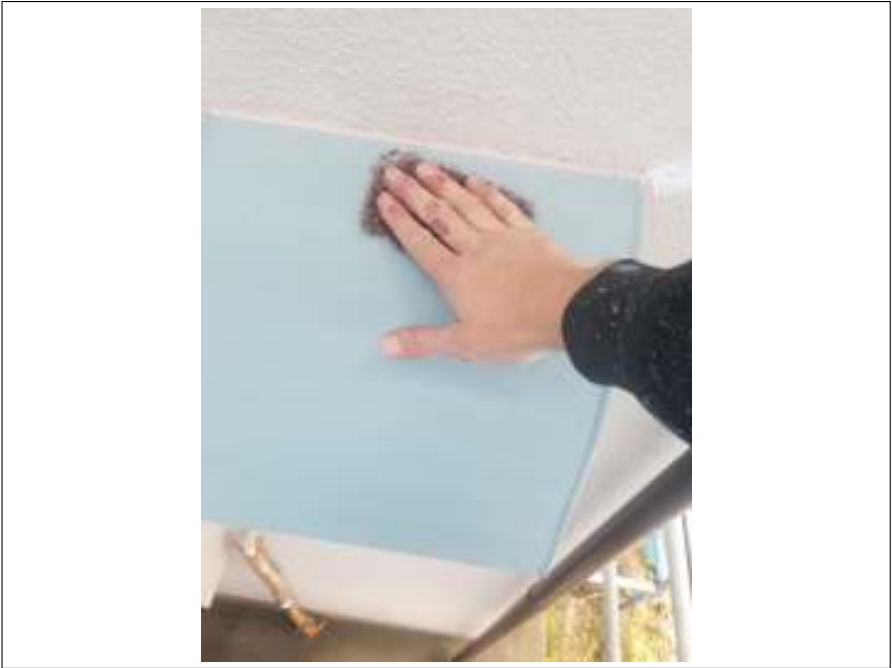
換気フード ケレン処理施工中