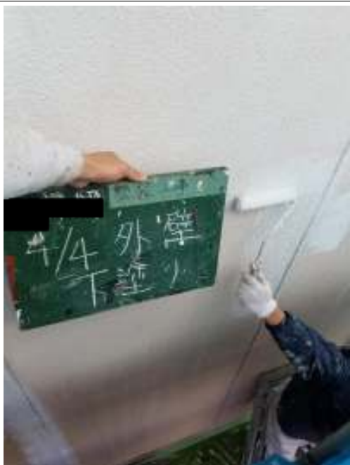
外壁 下塗り施工中