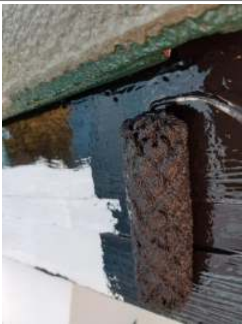
破風板 上塗り施工中