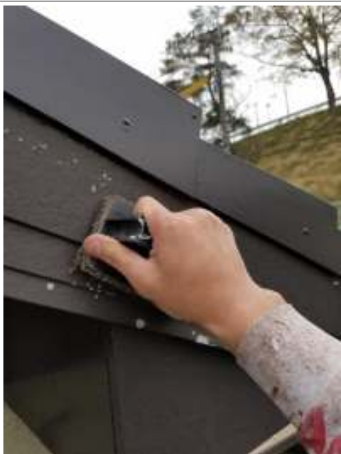
破風板 ケレン処理施工中