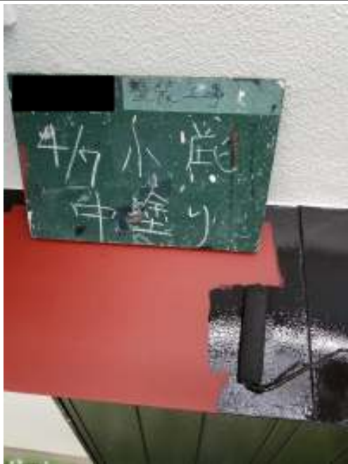
小庇 中塗り施工中