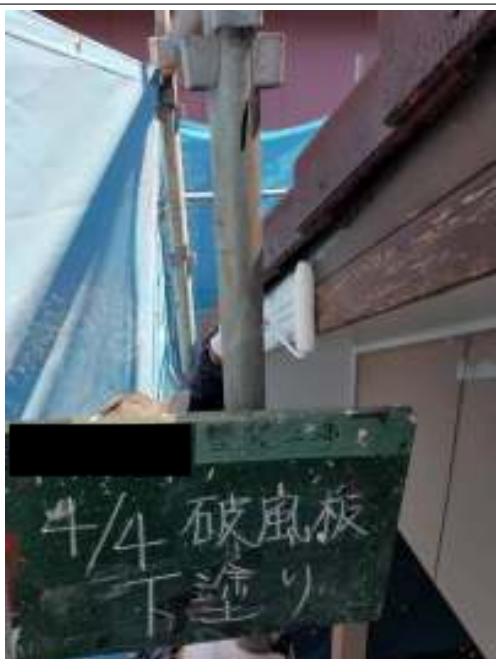
破風板 下塗り施工中