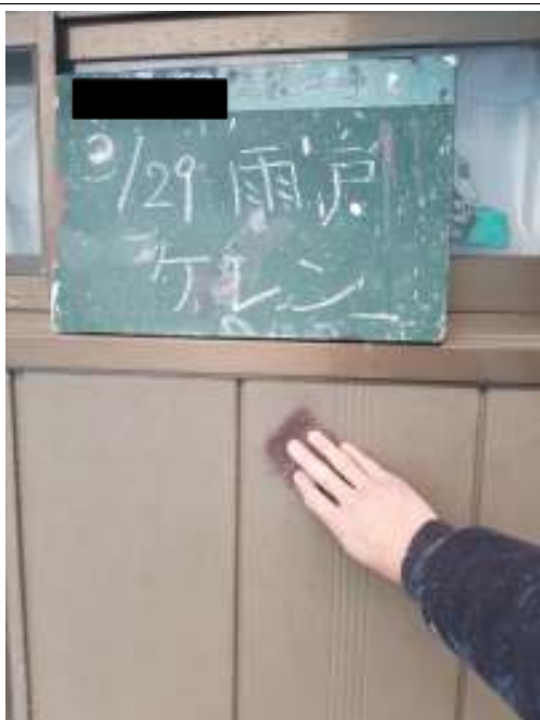
雨戸 ケレン処理施工中