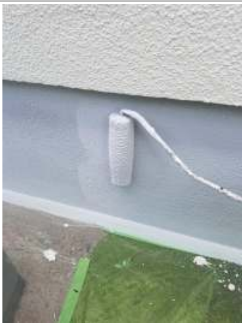
基礎 上塗り（2回目）施工中