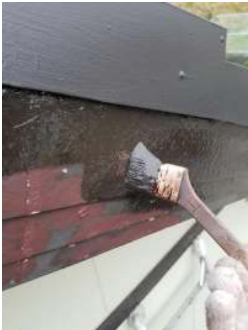
破風板 中塗り施工中