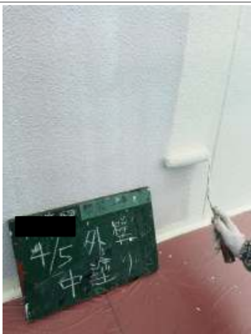
外壁 中塗り施工中