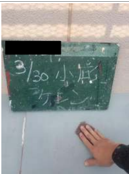
小庇 ケレン処理施工中