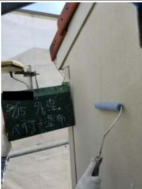
外壁（リシン仕上げ面）バリアー塗布