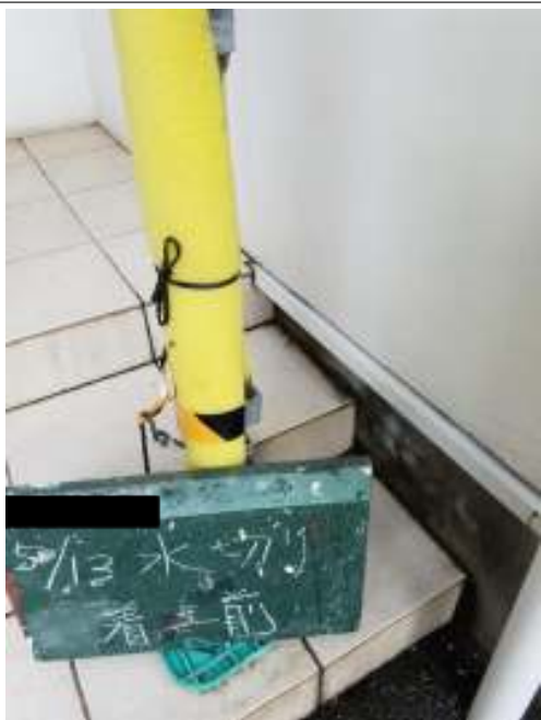
土台水切り 施工前