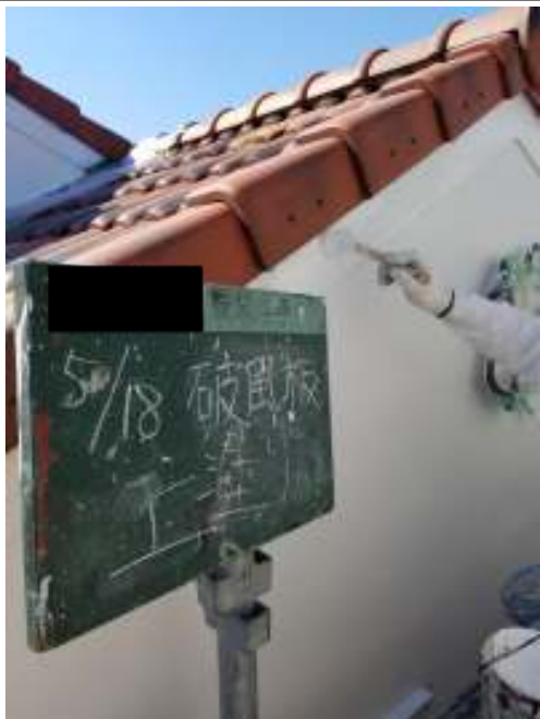
破風板 上塗り施工中