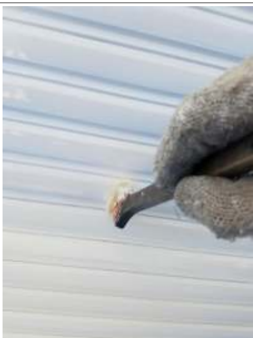
シャッター 上塗り(2回目) 施工中