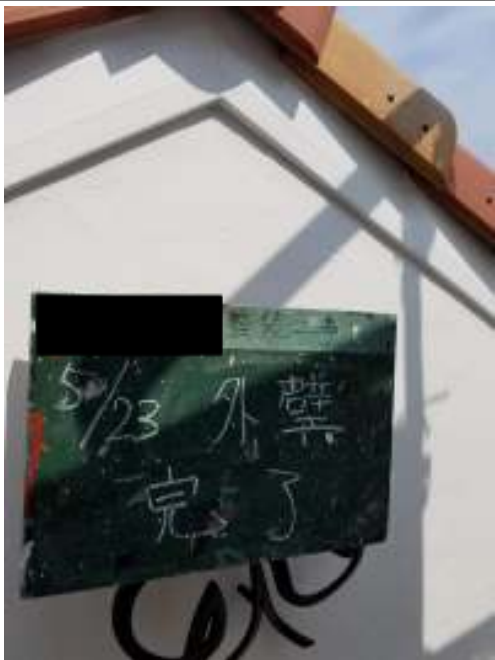
外壁（コテ仕上げ面）施工完了