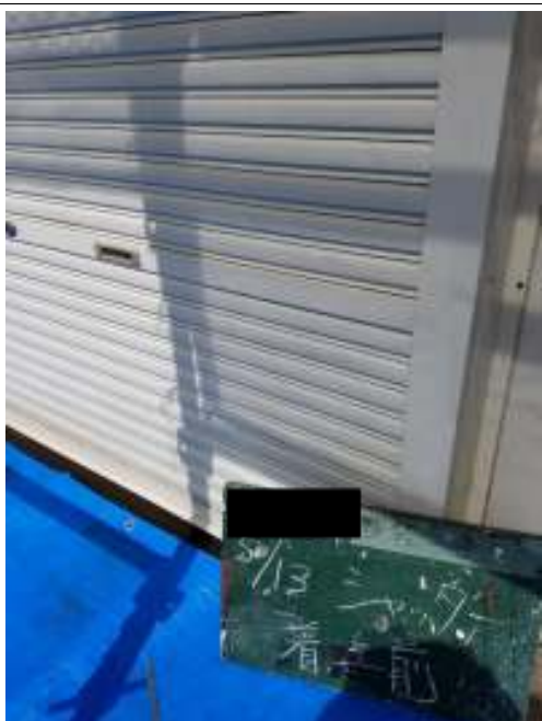
シャッター 施工前