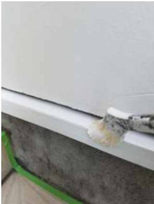
土台水切り 上塗り(1回目)施工中