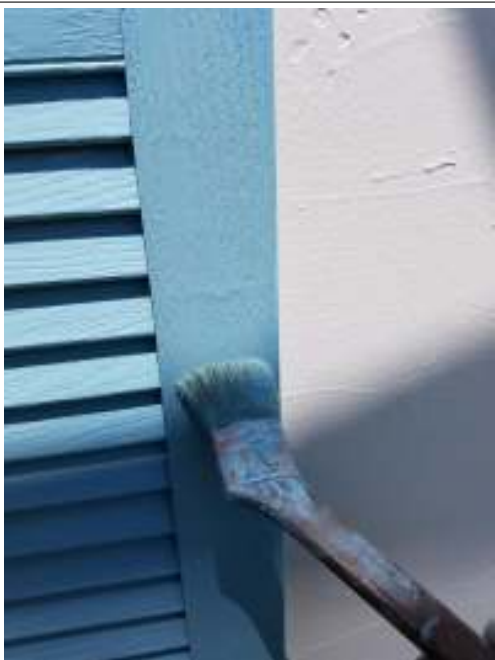
木部 上塗り（2回目）施工中