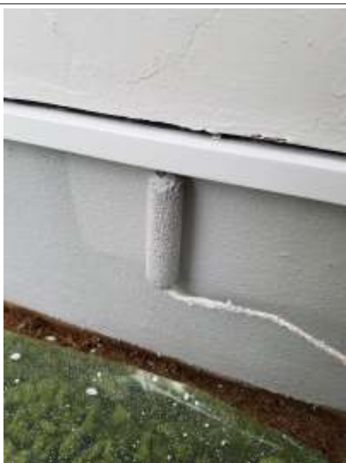
基礎 上塗り（2回目）施工中