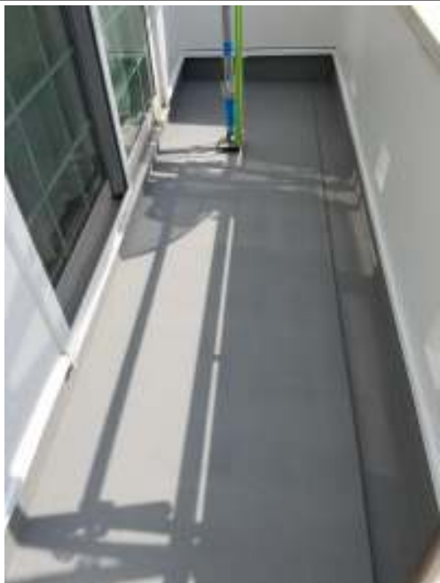
ベランダ 施工完了