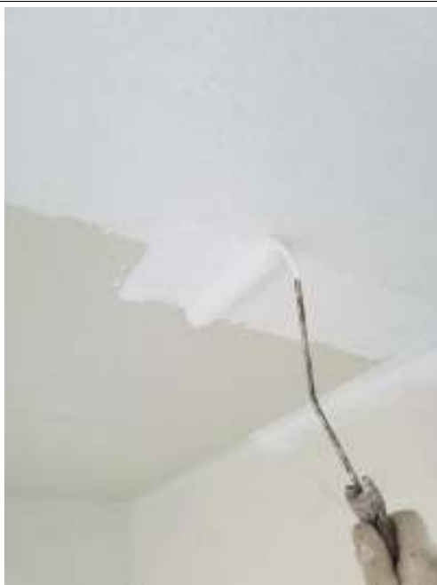
軒天 上塗り（1回目）施工中