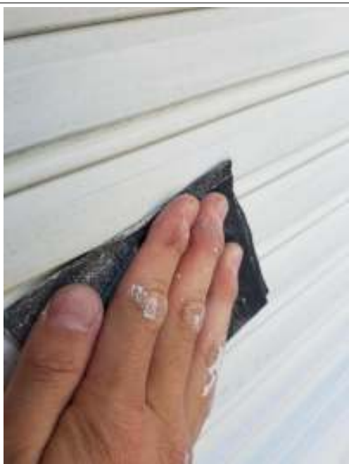
シャッター ケレン処理施工中