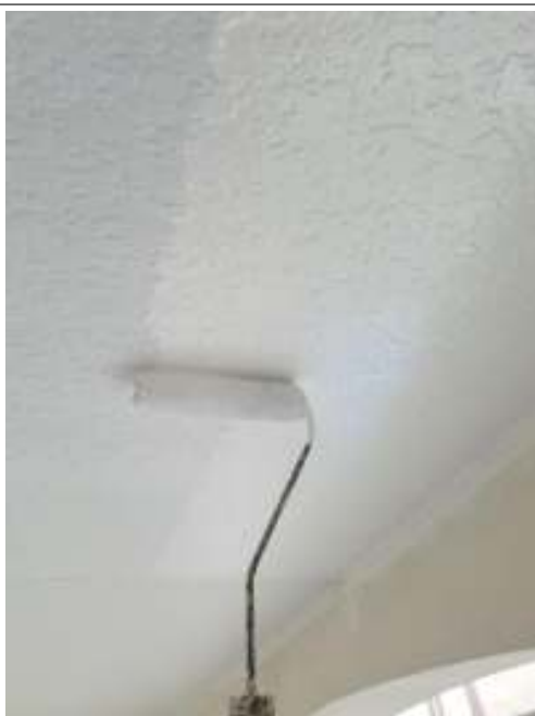
軒天 上塗り（2回目）施工中