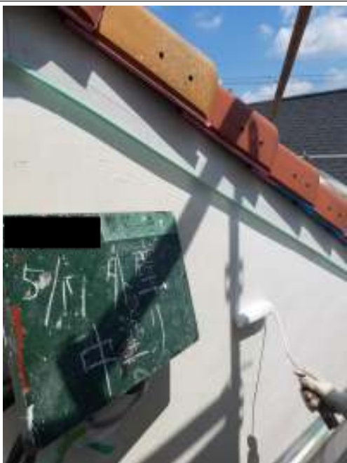
外壁（コテ仕上げ面）中塗り施工中