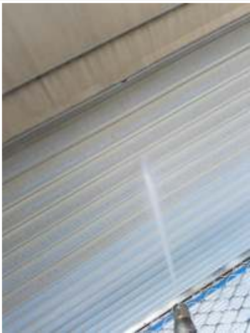
シャッター 高圧洗浄中