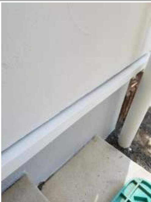
土台水切り 施工完了