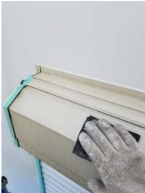
シャッターBOX ケレン処理施工中