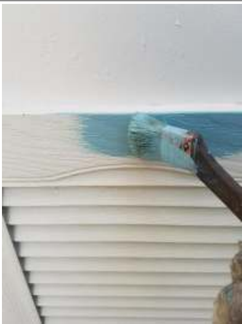
木部 上塗り（1回目）施工中