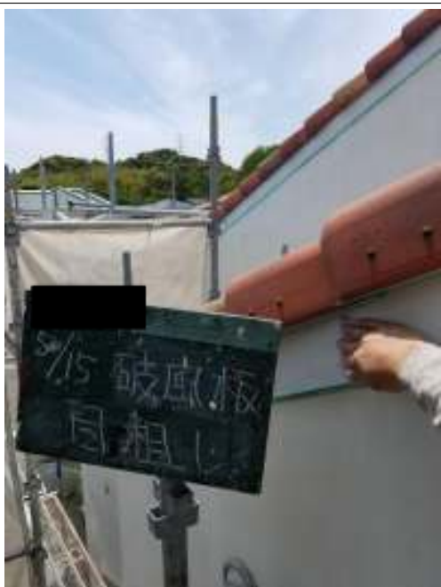
破風板 目粗し施工中