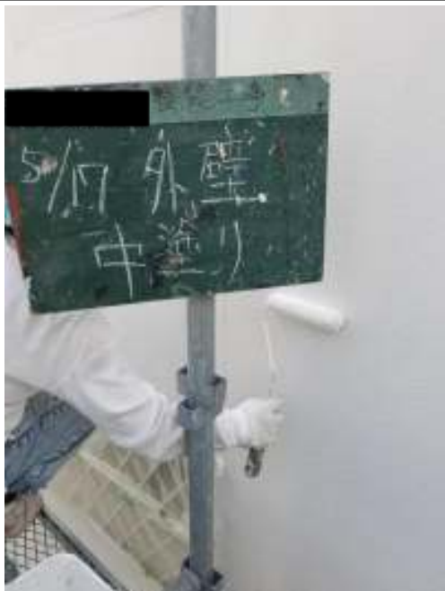
外壁(リシン仕上げ面) 中塗り施工中