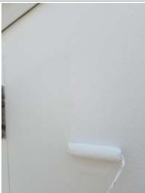
外壁(リシン仕上げ面) 上塗り施工中