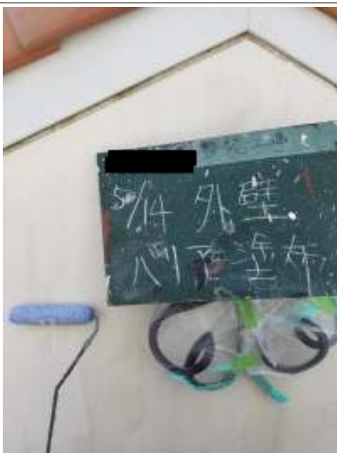
外壁（コテ仕上げ面）バリアー塗布