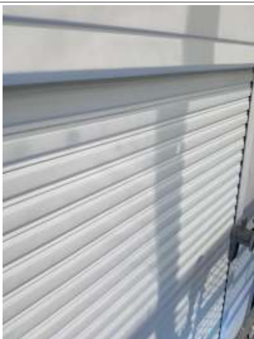
シャッター 施工完了