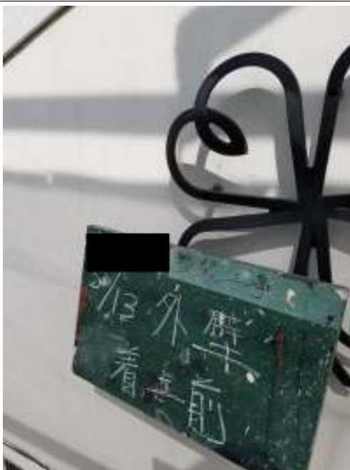
外壁（コテ仕上げ面） 施工前