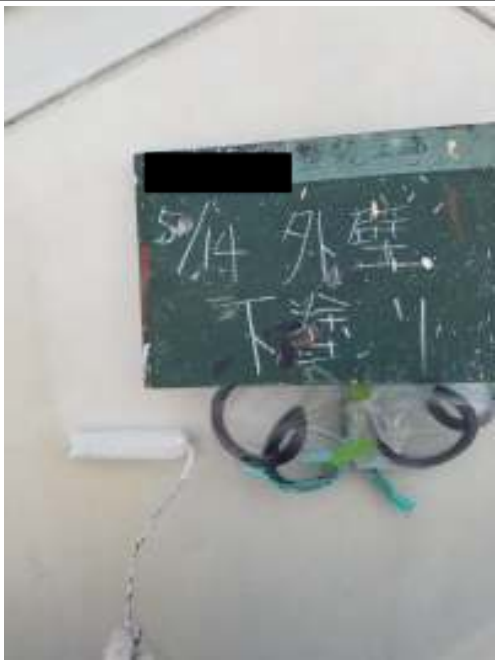
外壁（コテ仕上げ面）下塗り施工中