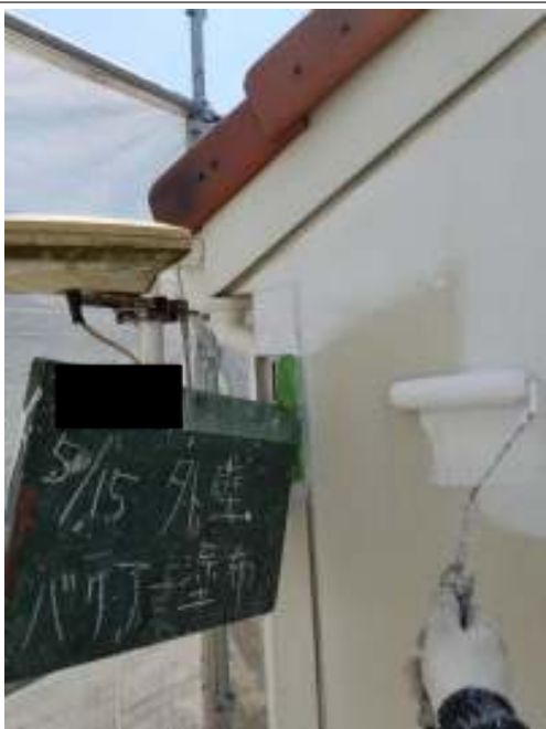
外壁（リシン仕上げ面）下塗り施工中