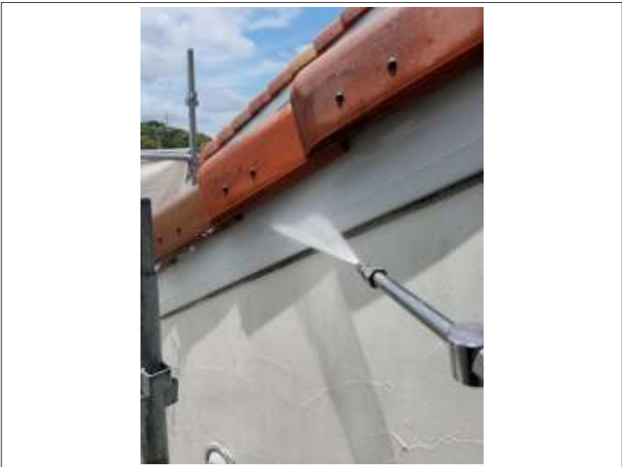
破風板 高圧洗浄中