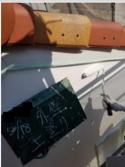
外壁（コテ仕上げ面）上塗り施工中