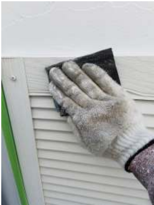
木部 ケレン処理施工中