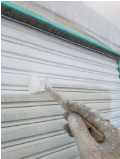
シャッター 上塗り(1回目) 施工中