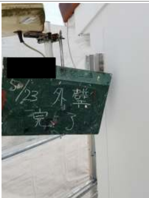
外壁(リシン仕上げ面) 施工完了