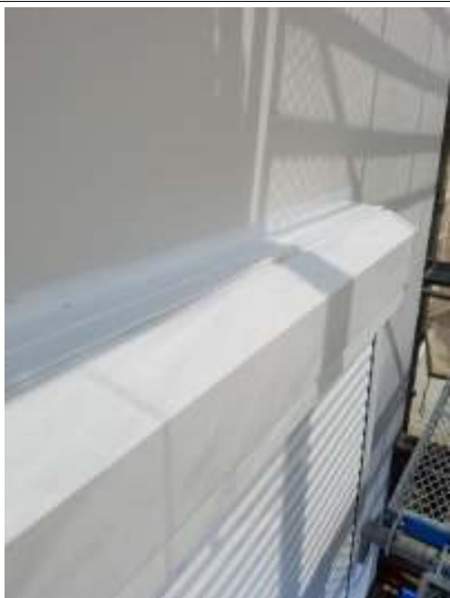
シャッターBOX 施工完了