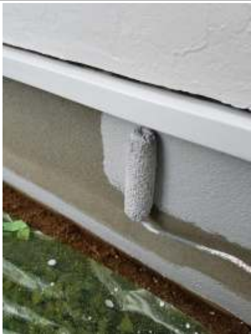
基礎 上塗り（1回目）施工中