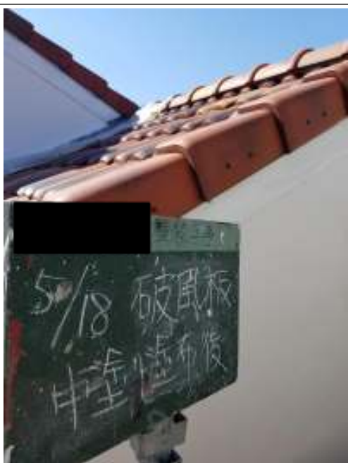
破風板 中塗り施工後