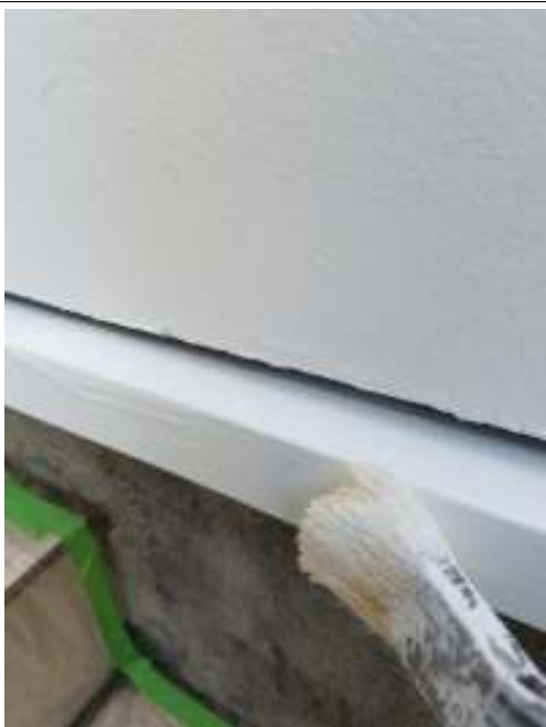
土台水切り 上塗り(2回目)施工中