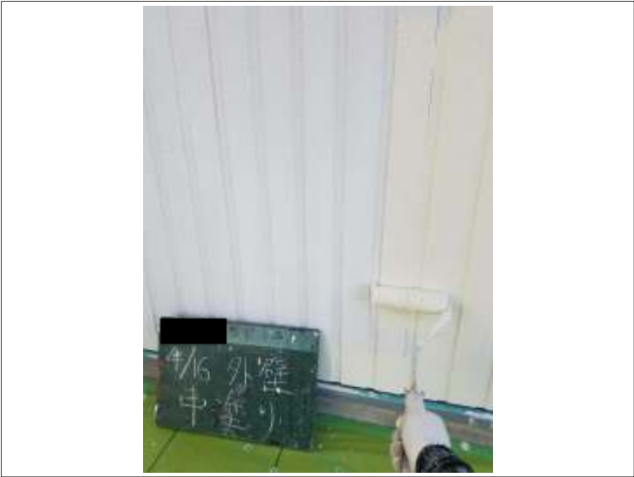
外壁 中塗り施工中