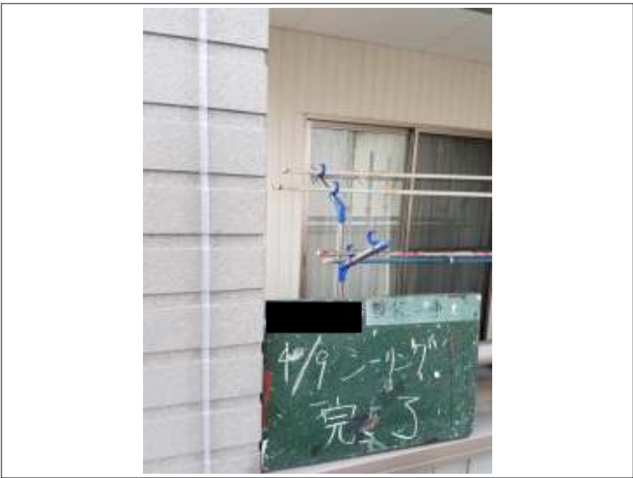
シーリング打ち替え 施工完了