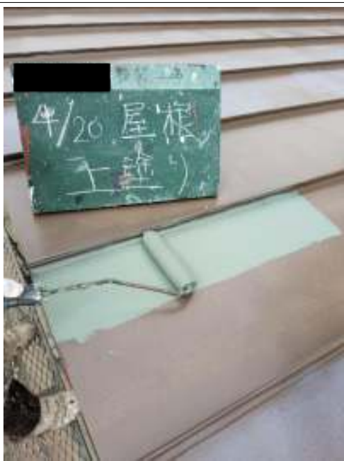
屋根 上塗り施工中