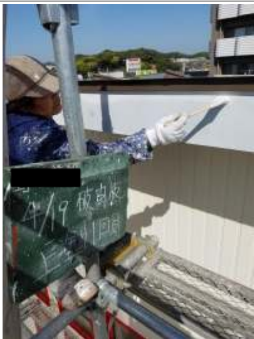
破風板 上塗り（1回目）施工中