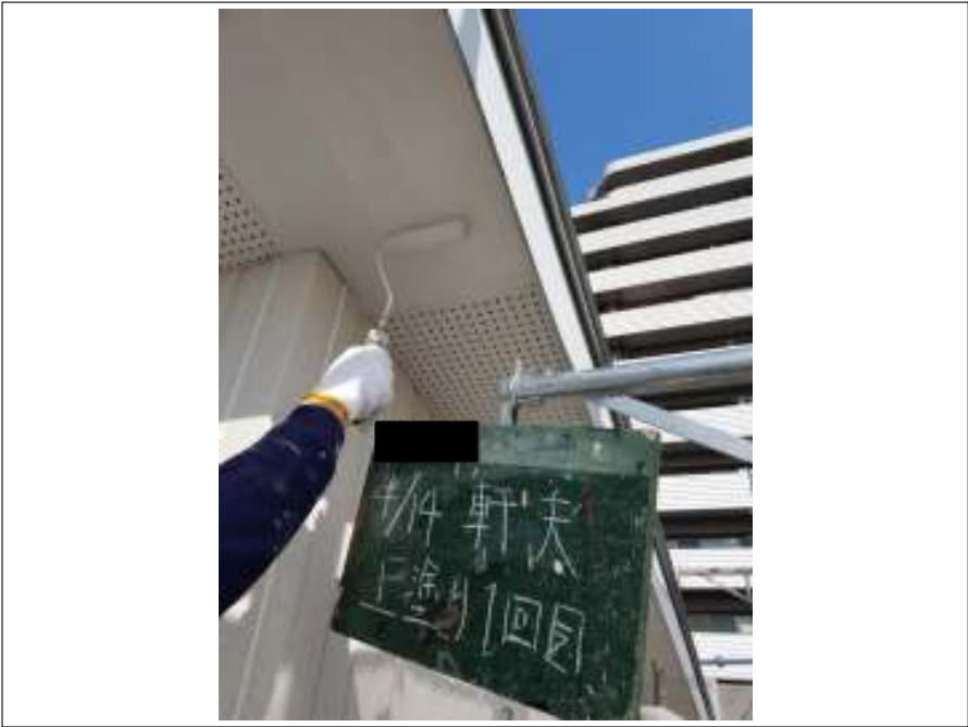
軒天 上塗り（1回目）施工中