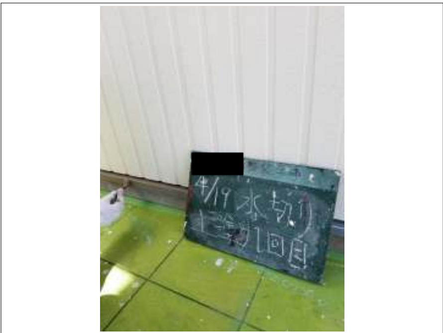
土台水切り 上塗り(1回目)施工中