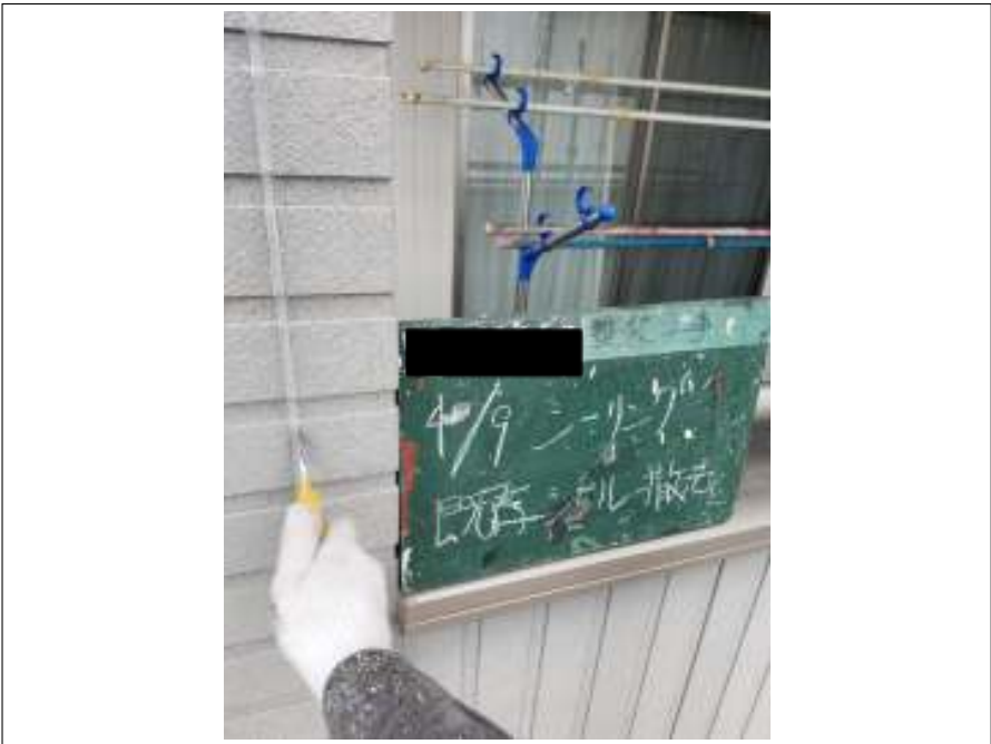
既存シーリング撤去