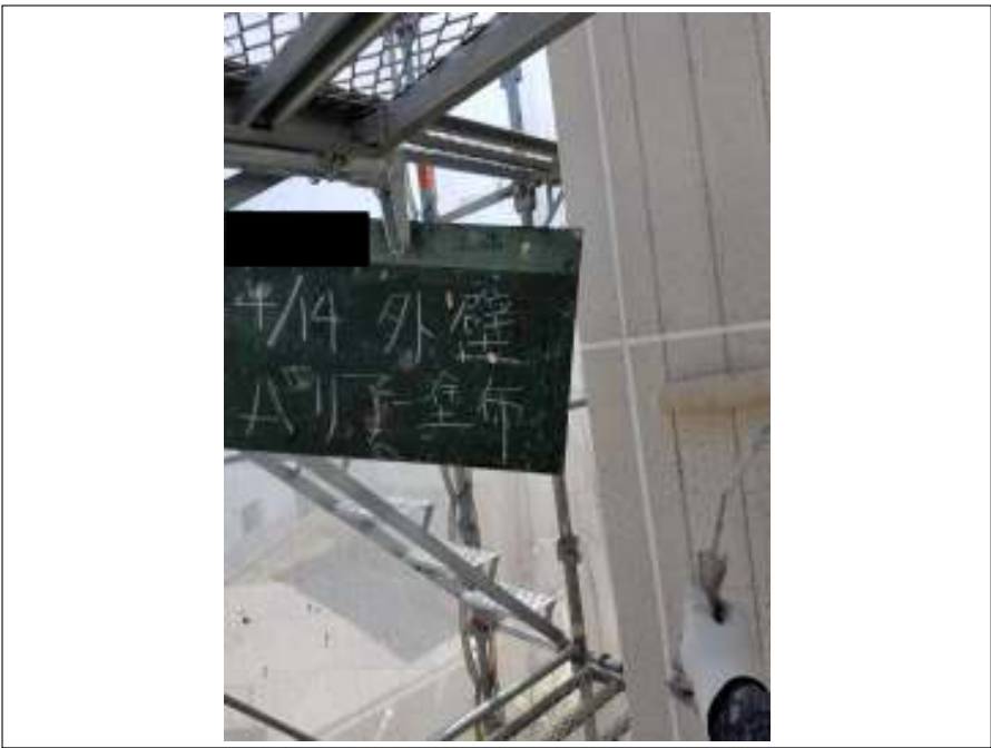
外壁 バリアー塗布