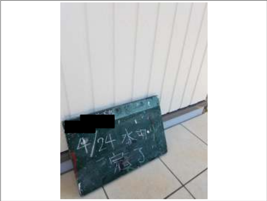
土台水切り 施工完了