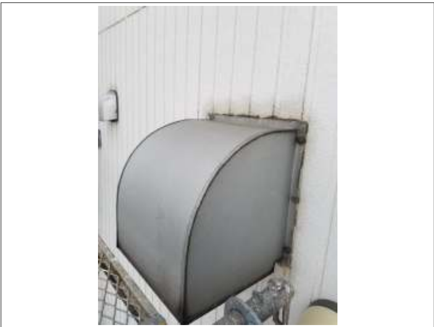
換気フード 施工前