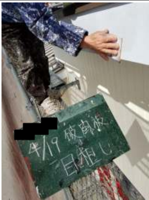
破風板 目粗し施工中