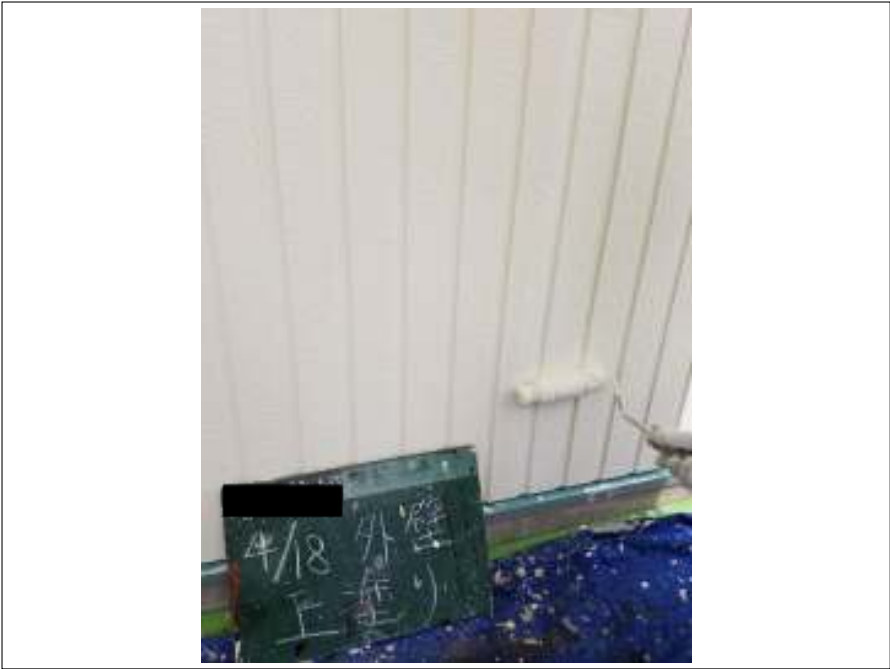
外壁 上塗り施工中