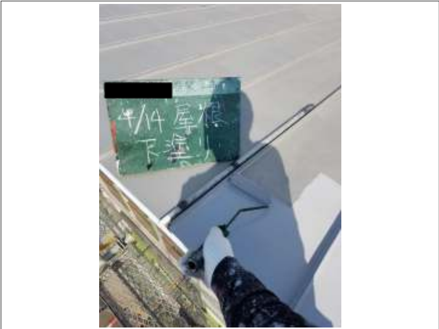
屋根 下塗り施工中