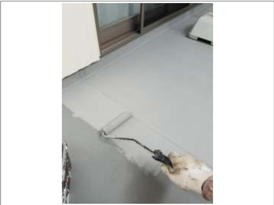
ベランダ 上塗り施工中