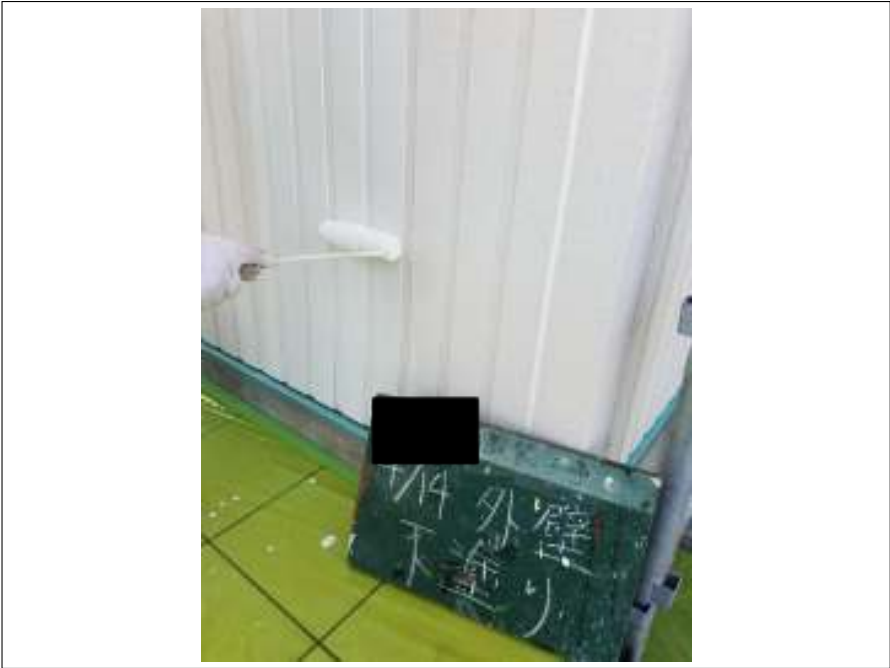
外壁 下塗り施工中