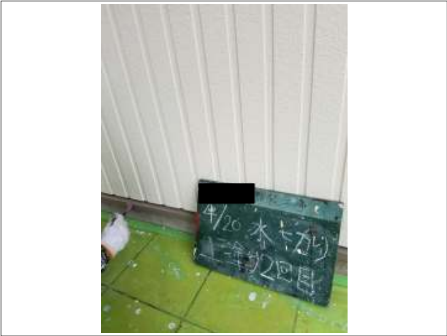
土台水切り 上塗り(2回目) 施工中