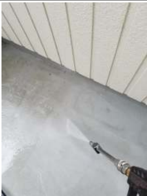
ベランダ 高圧洗浄中