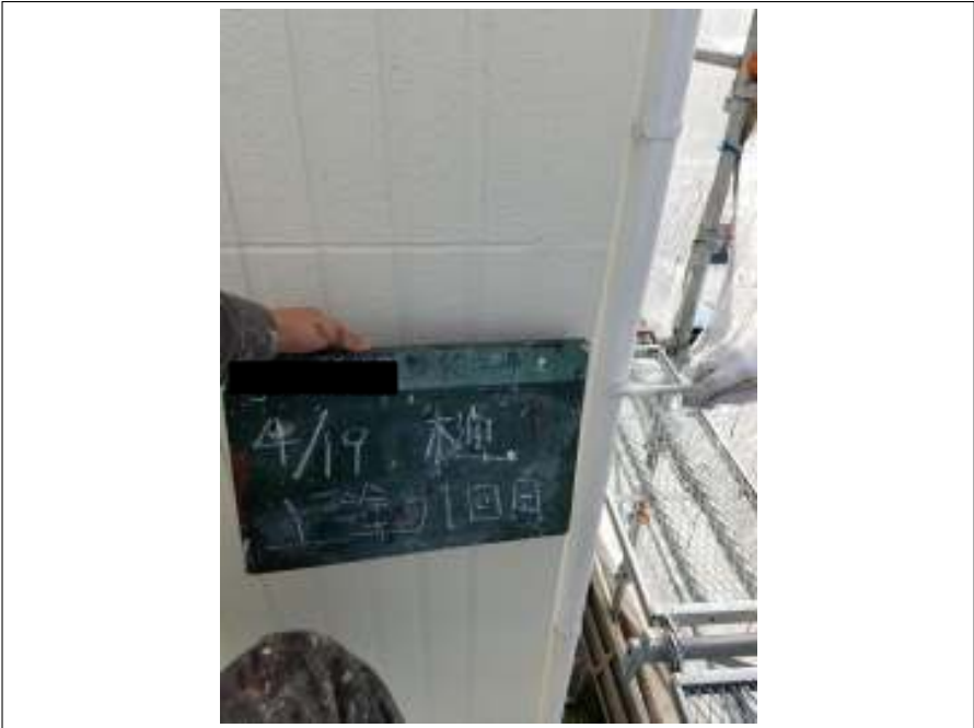
樋 上塗り（1回目）施工中