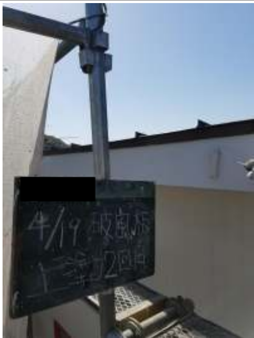
破風板 上塗り(2回目) 施工中