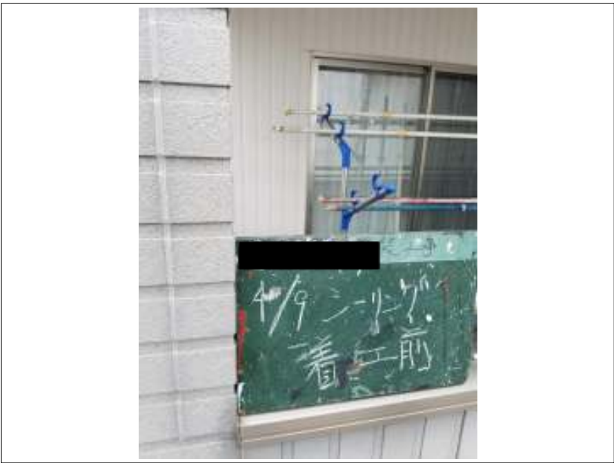
シーリング打ち替え 施工前