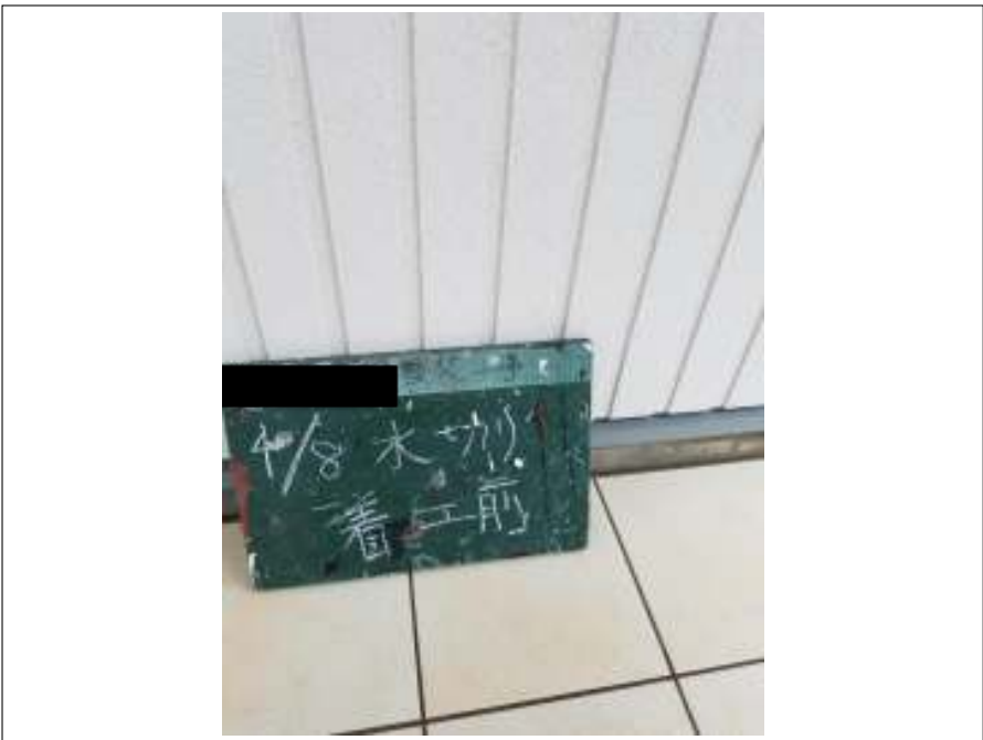
土台水切り 施工前