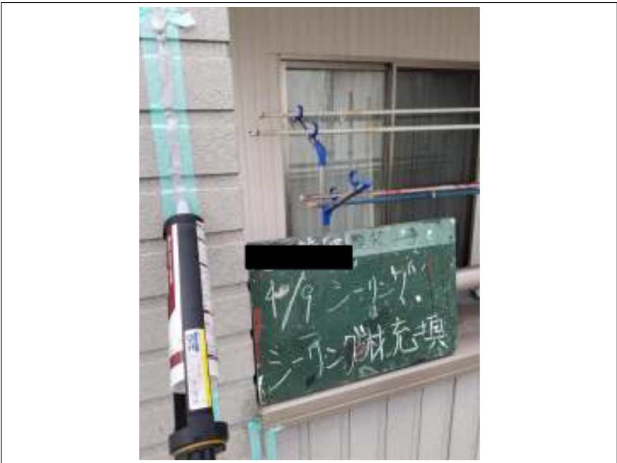
シーリング材充填