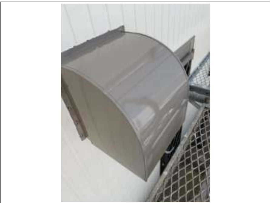
換気フード 施工後