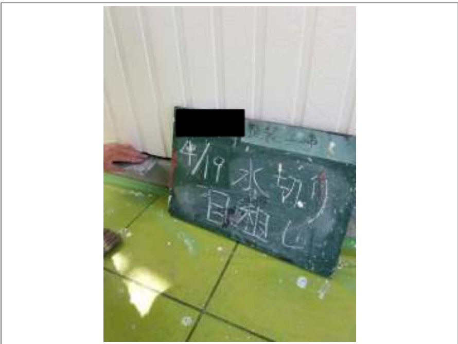
土台水切り 目粗し施工中