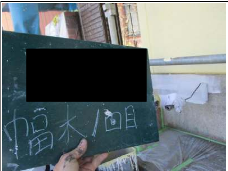
基礎 上塗り（1回目）施工中