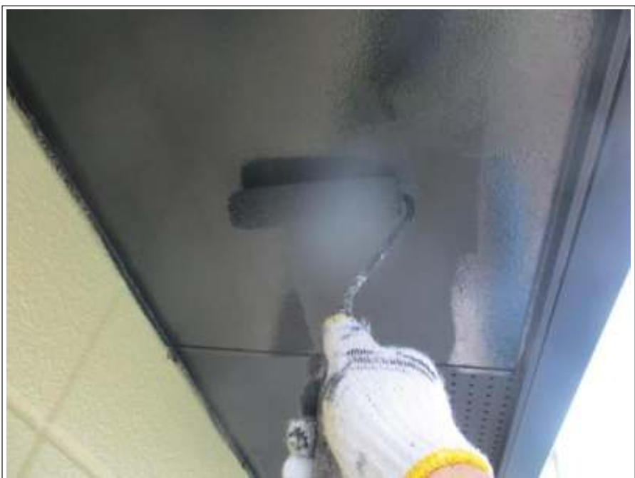
軒天 上塗り（2回目）施工中