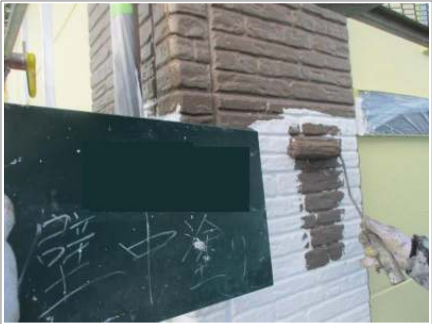
外壁(アクセント部) 中塗り施工中