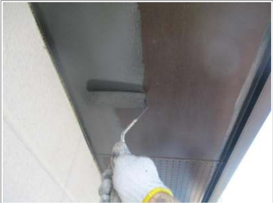
軒天 上塗り（1回目）施工中