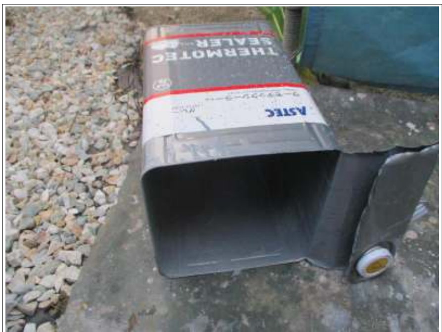
屋根 下塗り使用材料空缶