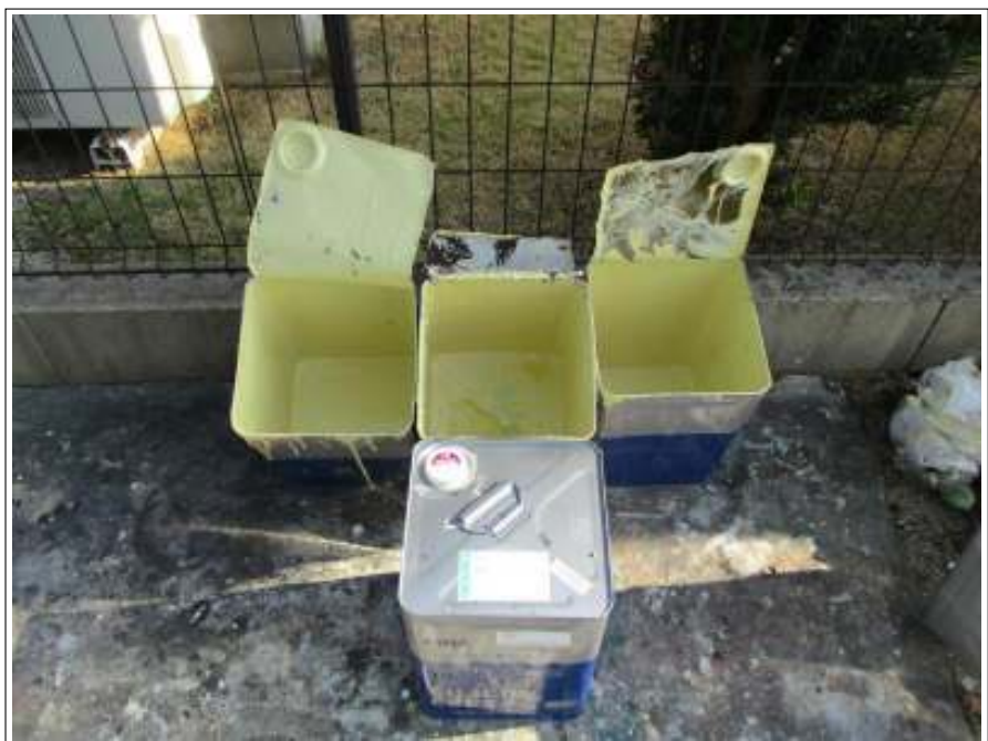
外壁 上塗り使用材料空缶