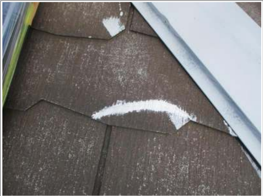
屋根 クラック補修