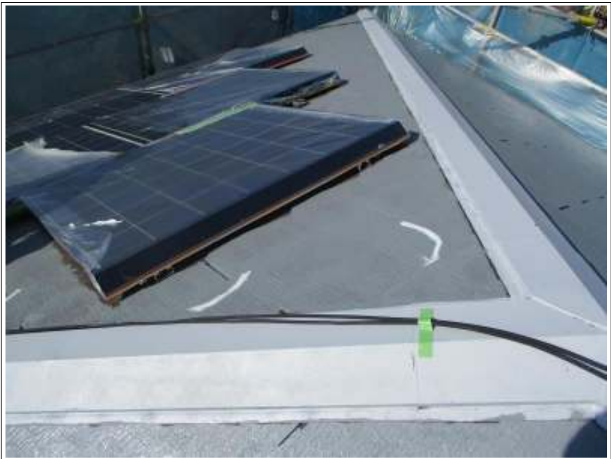
屋根 シーリング補修後