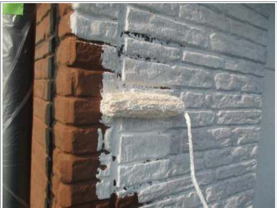
外壁(アクセント部) 下塗り施工中