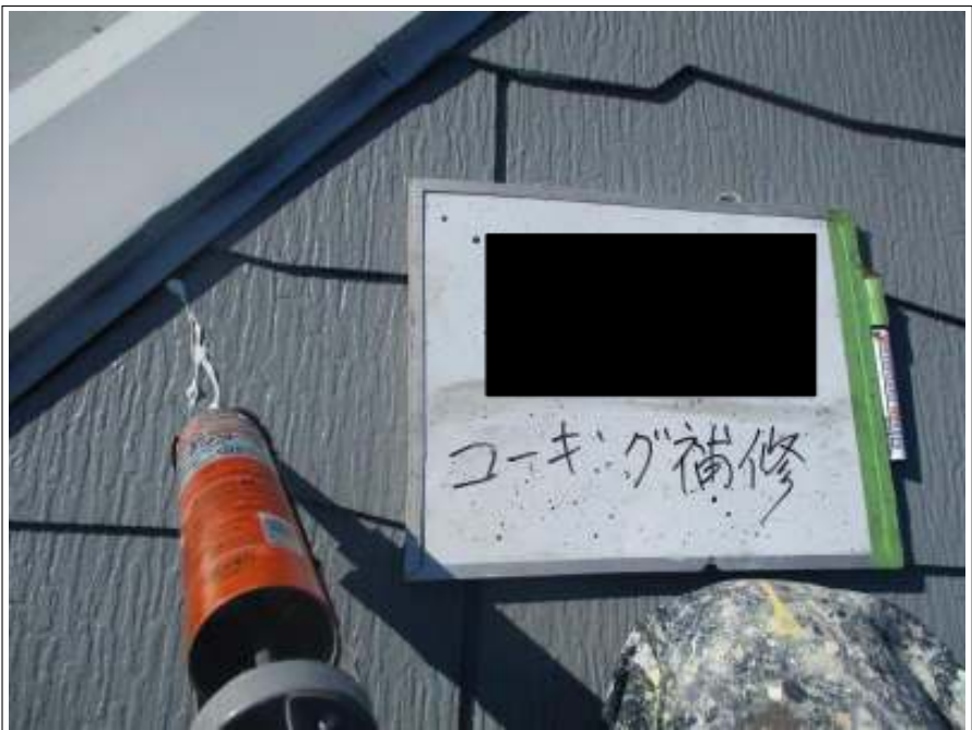
屋根 シーリング補修