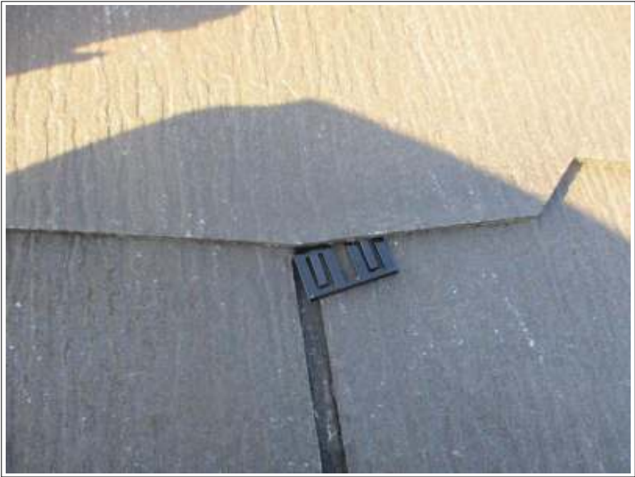
屋根 タスペーサー取付