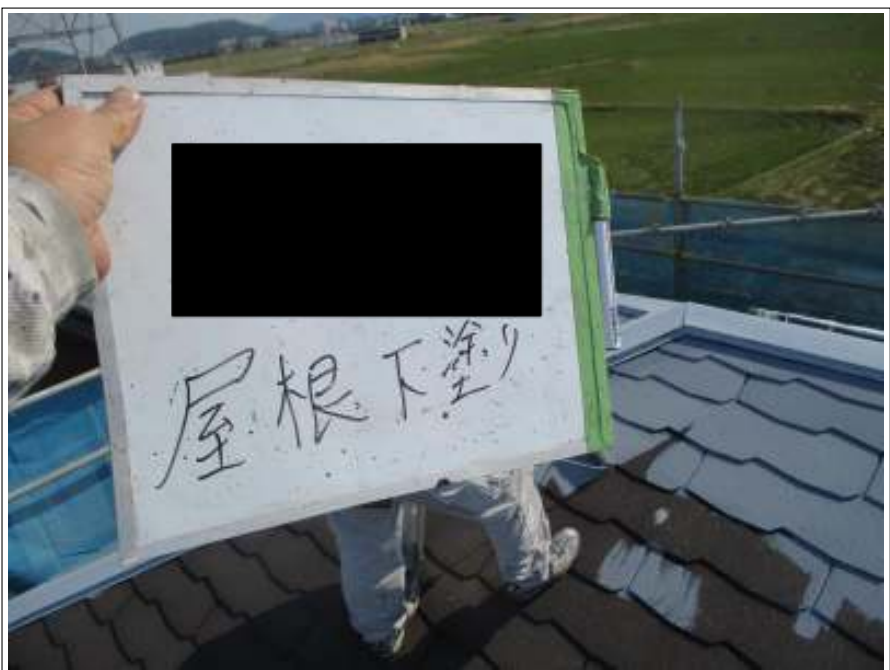
屋根 下塗り施工中