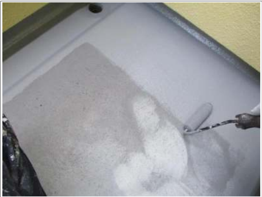
ベランダ 上塗り施工中