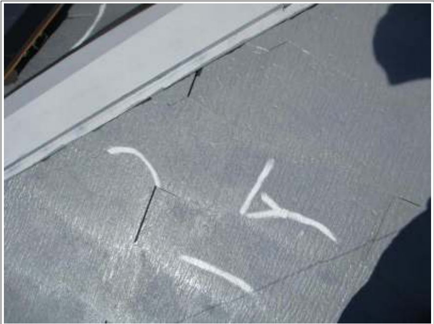
屋根 シーリング補修後