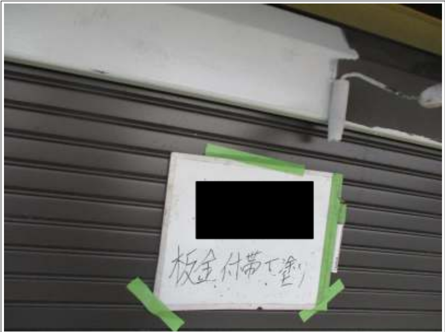
シャッターBOX サビ止め施工中