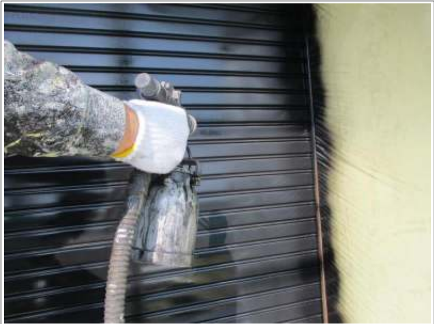
シャッター 上塗り（2回目）施工中