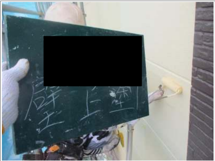
外壁(メイン部) 上塗り施工中