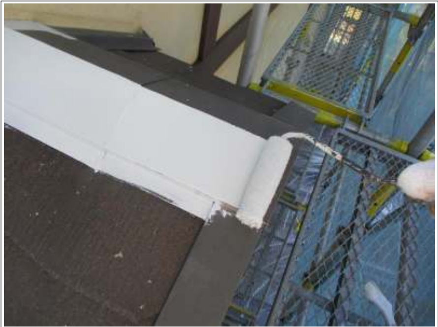
屋根板金部 サビ止め塗布