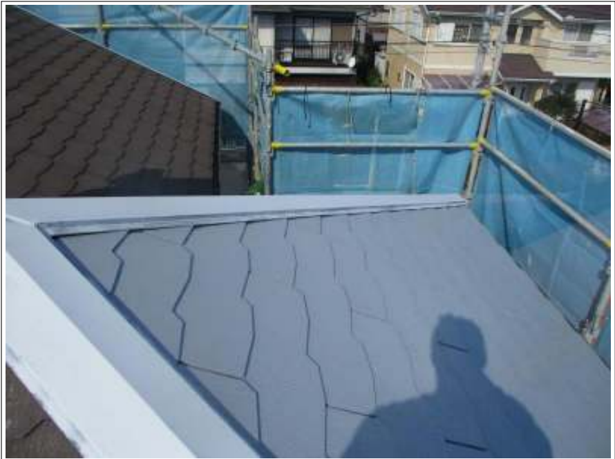
屋根 下塗り施工後