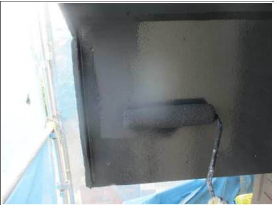
破風板 上塗り（2回目）施工中