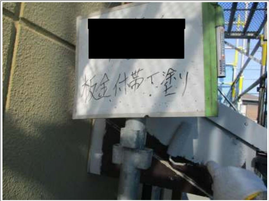
破風板 下塗り施工中