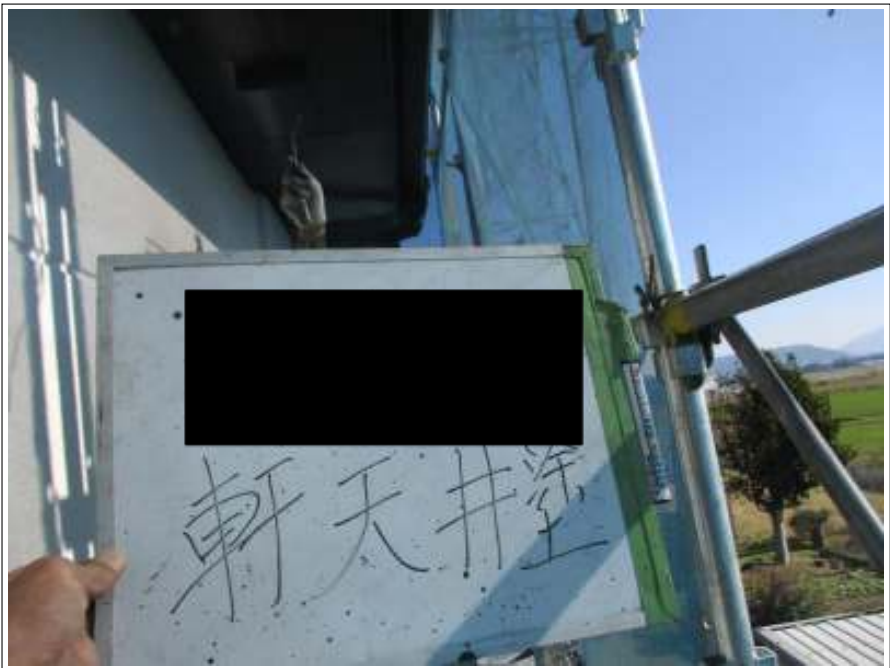
軒天 上塗り（1回目）施工中