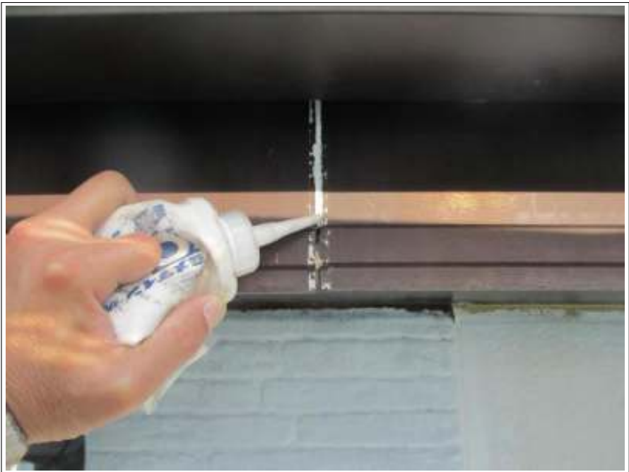
シーリング補修中