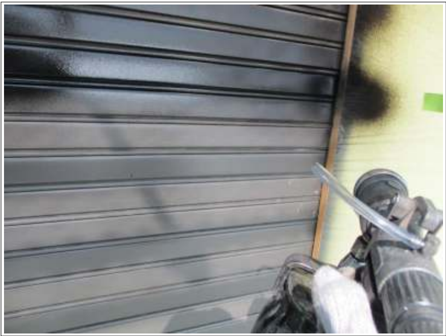
シャッター 上塗り(1回目) 施工中