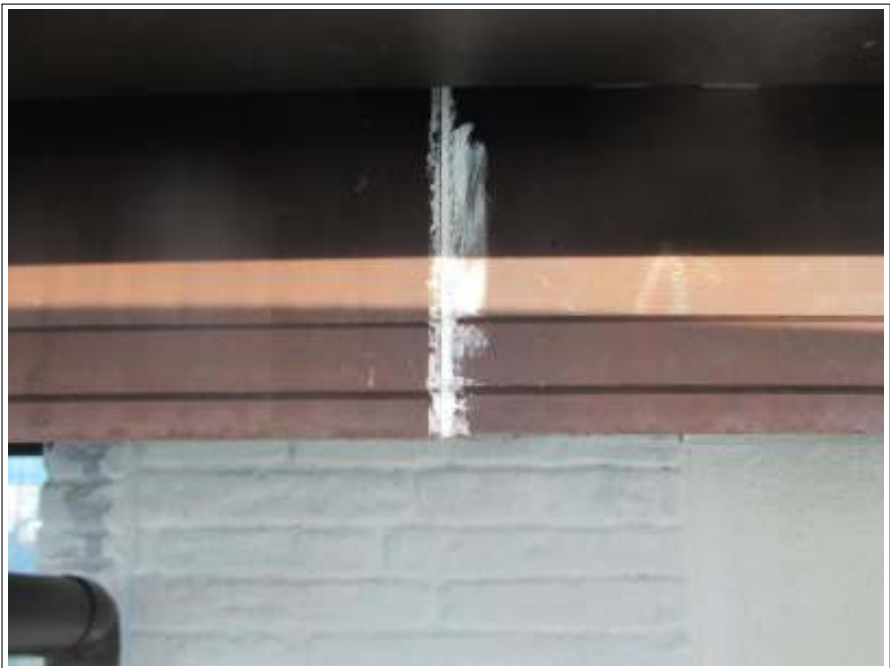
シーリング補修後