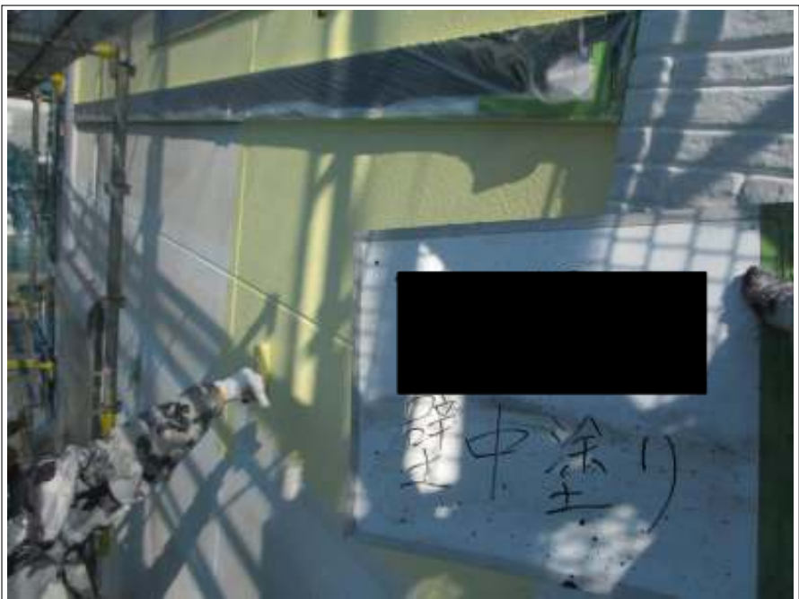
外壁(メイン部) 中塗り施工中