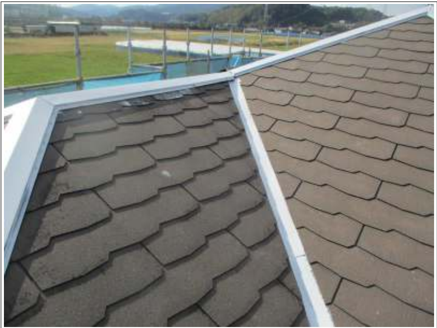
屋根板金部 サビ止め塗布後