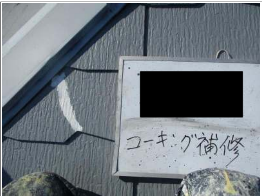
屋根 シーリング補修後