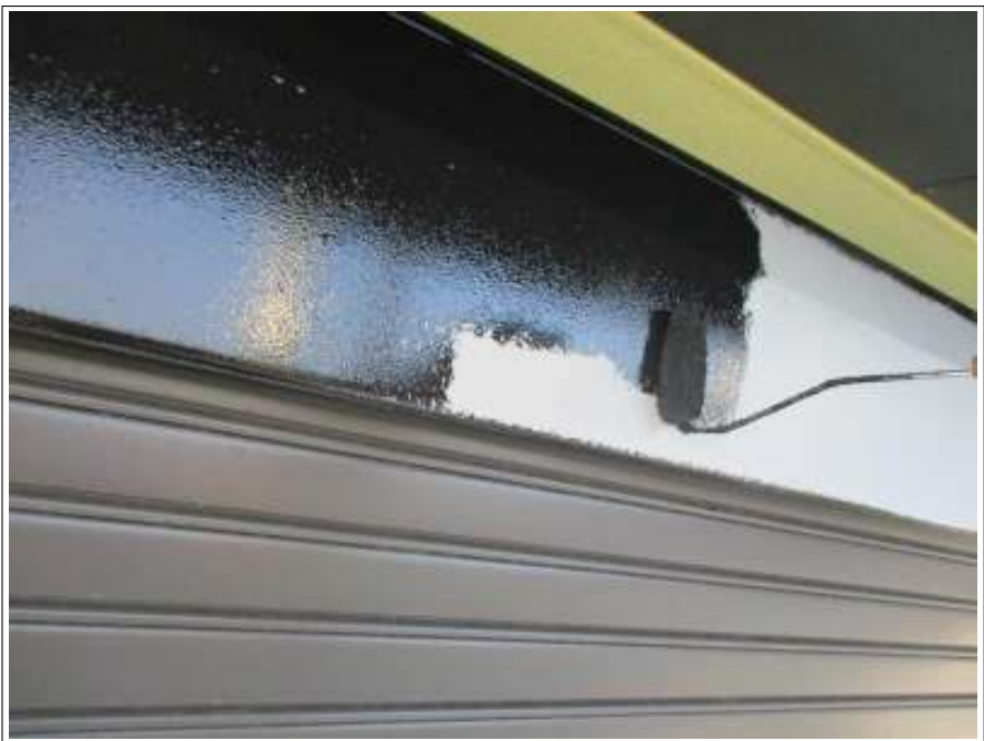
シャッターBOX 上塗り施工中