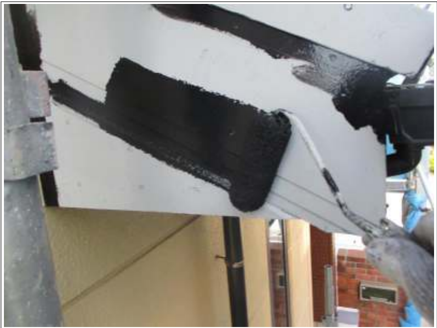
破風板 上塗り（1回目）施工中