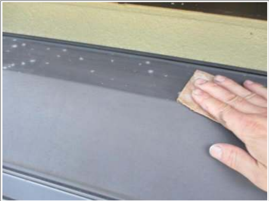
シャッター ケレン処理施工中