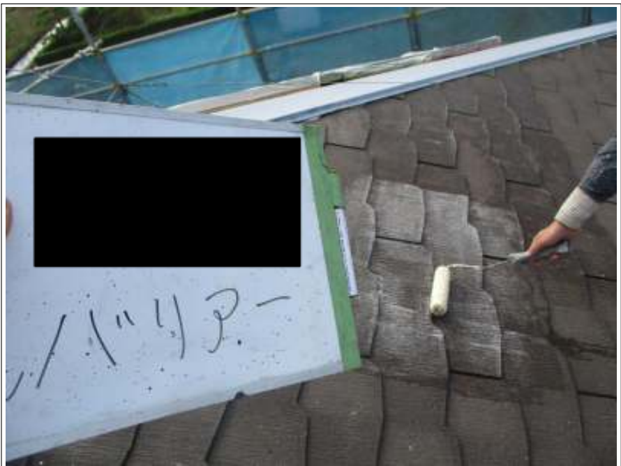
屋根 バリアー塗布