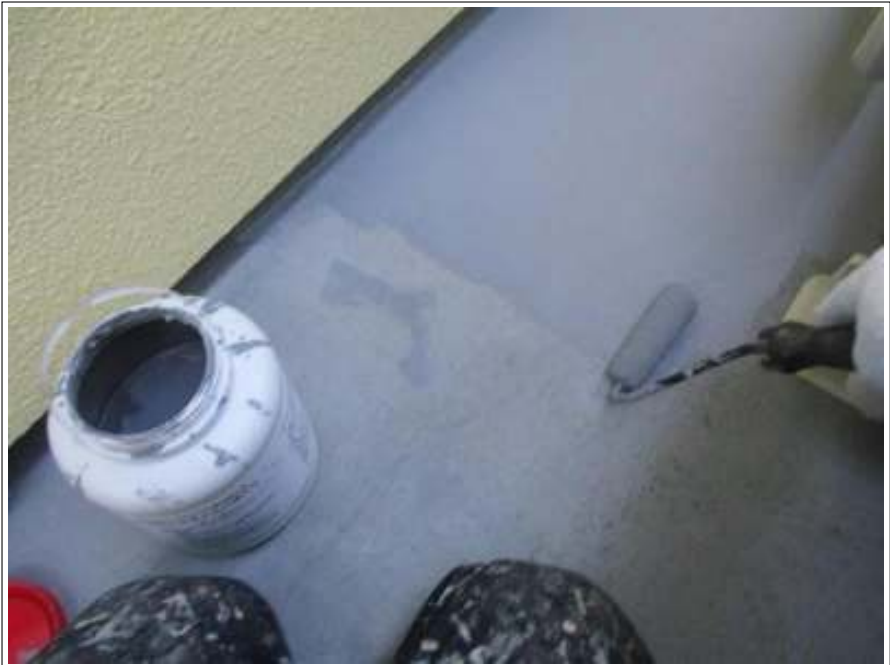
ベランダ 上塗り施工中