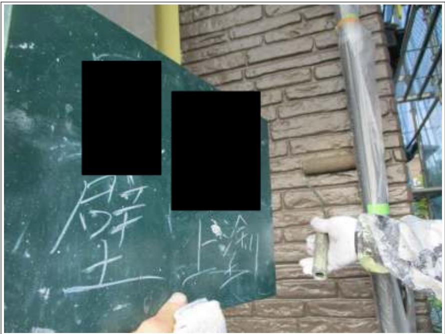
外壁(アクセント部) 上塗り施工中