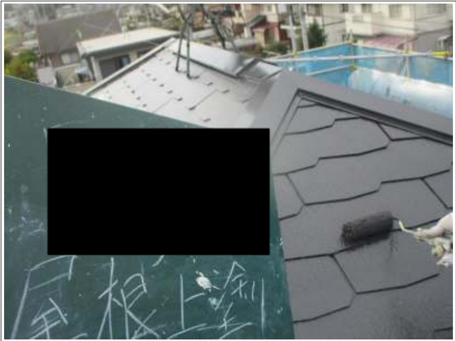
屋根 上塗り施工中