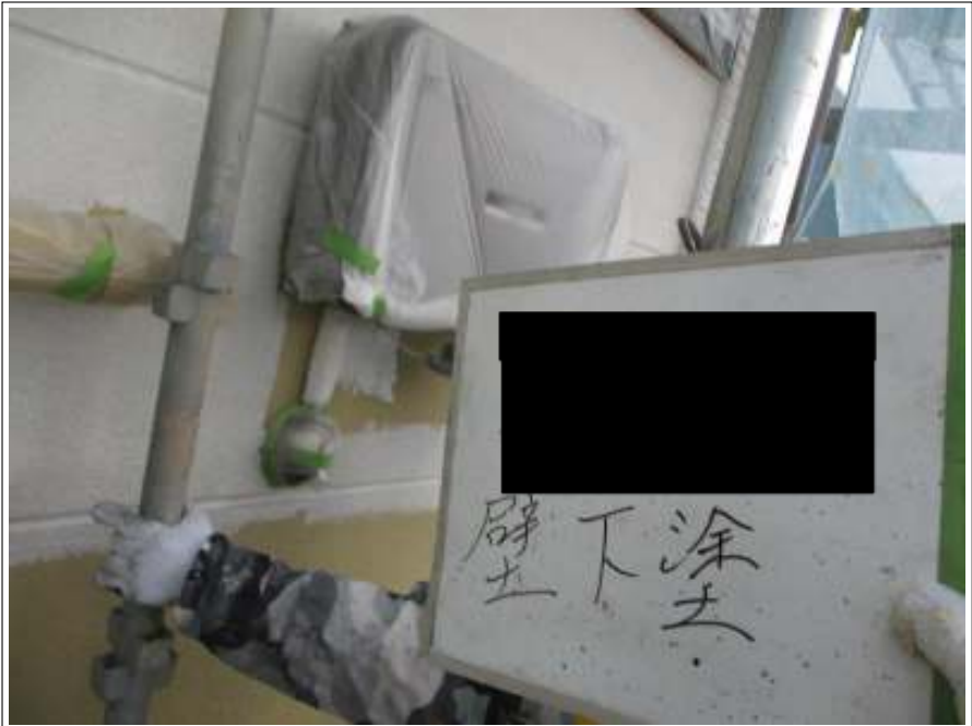
外壁(メイン部) 下塗り施工中