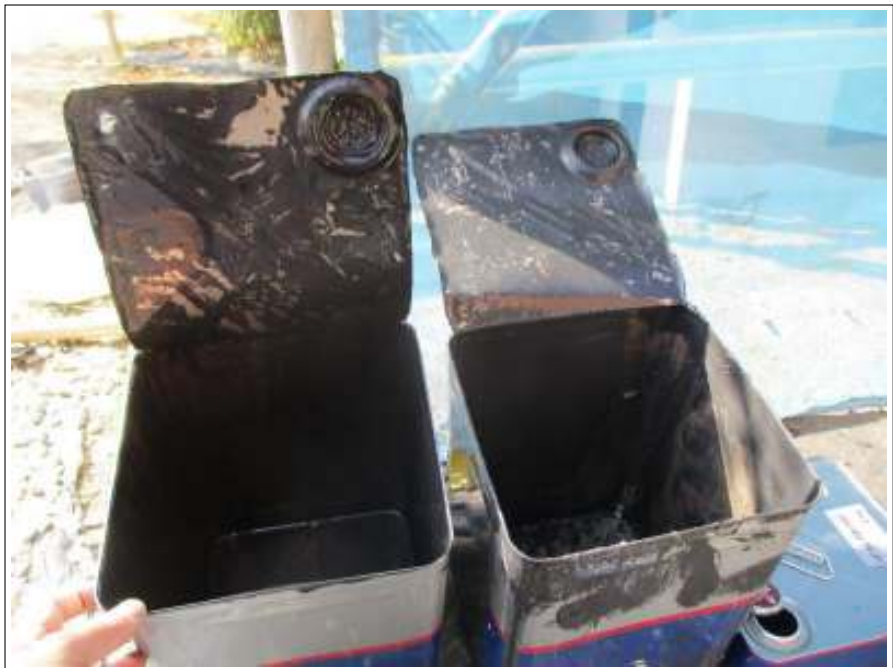
屋根 上塗り使用材料空缶