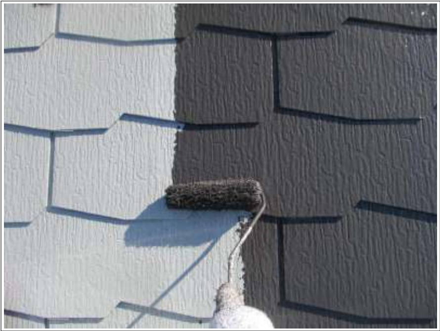
屋根 中塗り施工中