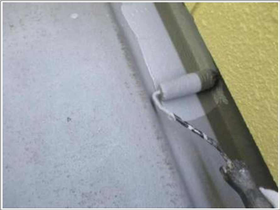
ベランダ 上塗り施工中