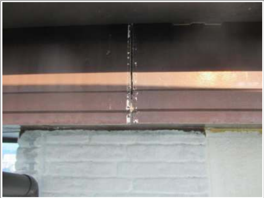
シーリング補修前