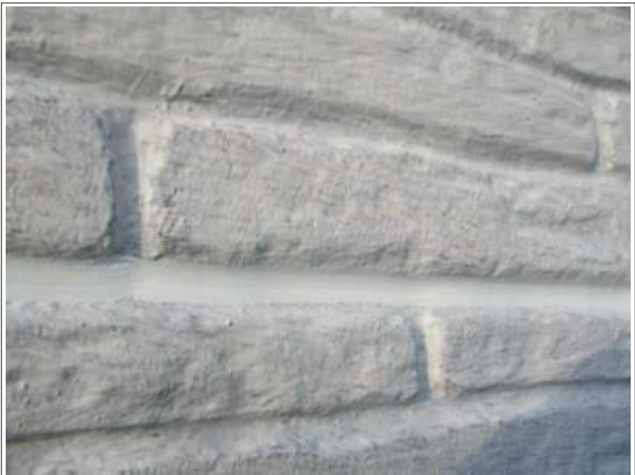
シーリング補修後