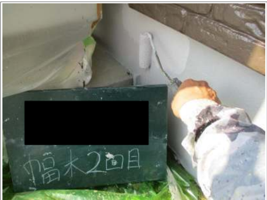
基礎 上塗り（2回目）施工中