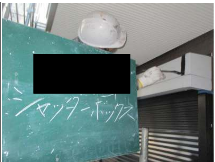
シャッターBOX 上塗り施工中