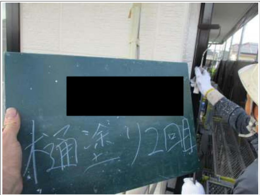
桶 上塗り（2回目）施工中