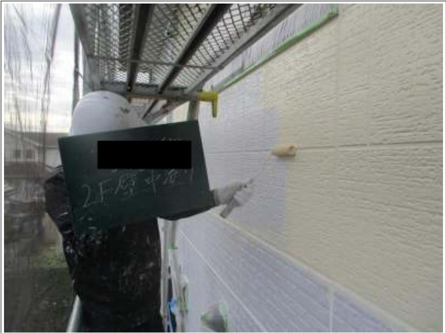
外壁（2F） 中塗り施工中