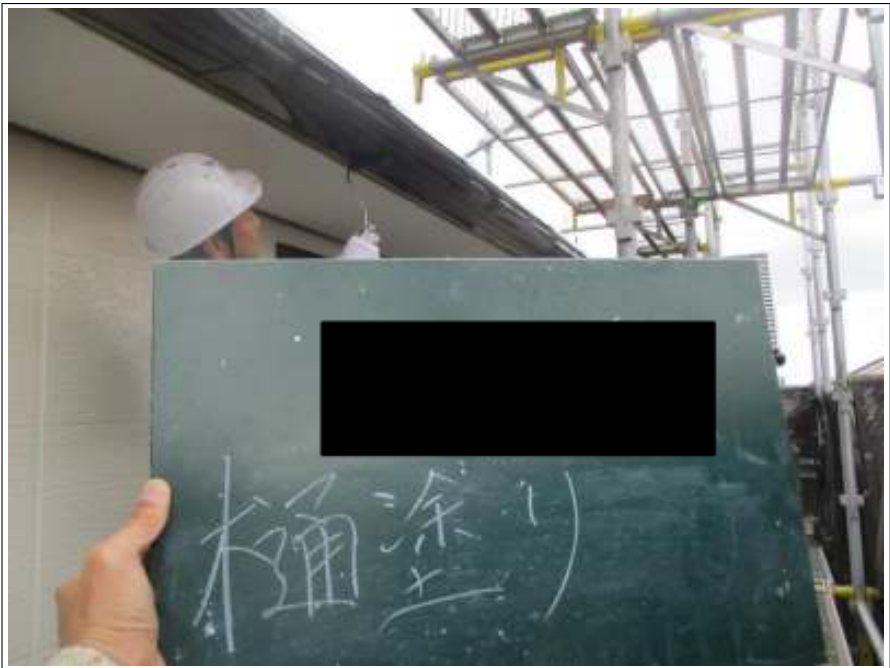
桶 上塗り（1回目）施工中