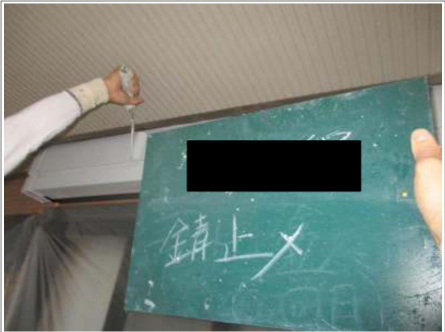
シャッターBOX サビ止め塗布