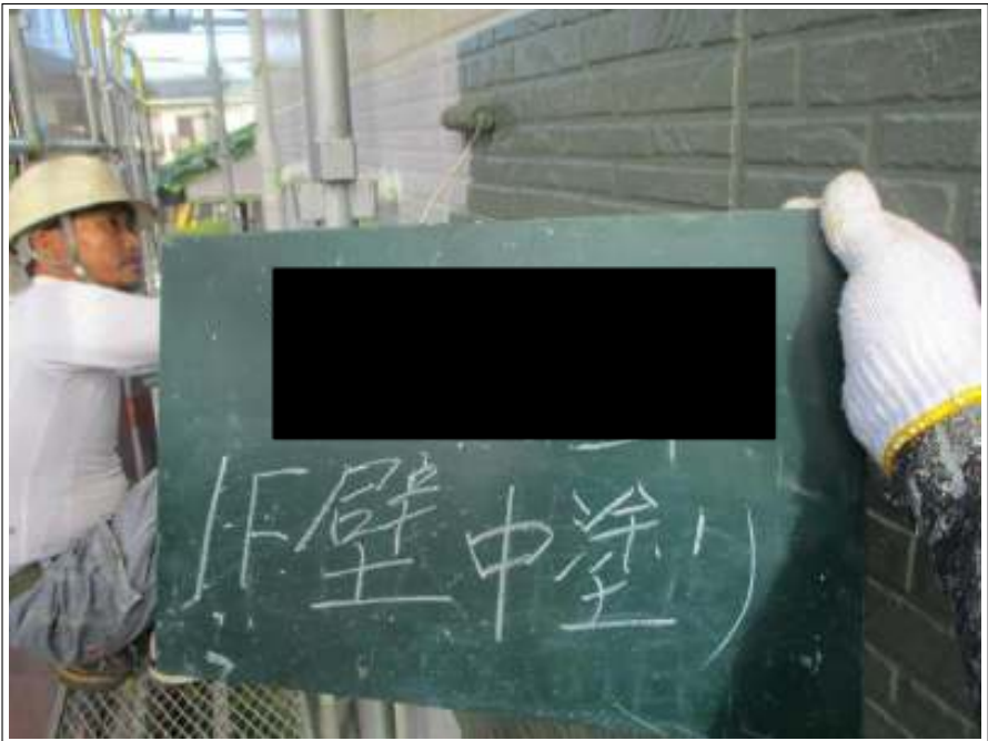
外壁（1F） 中塗り施工中