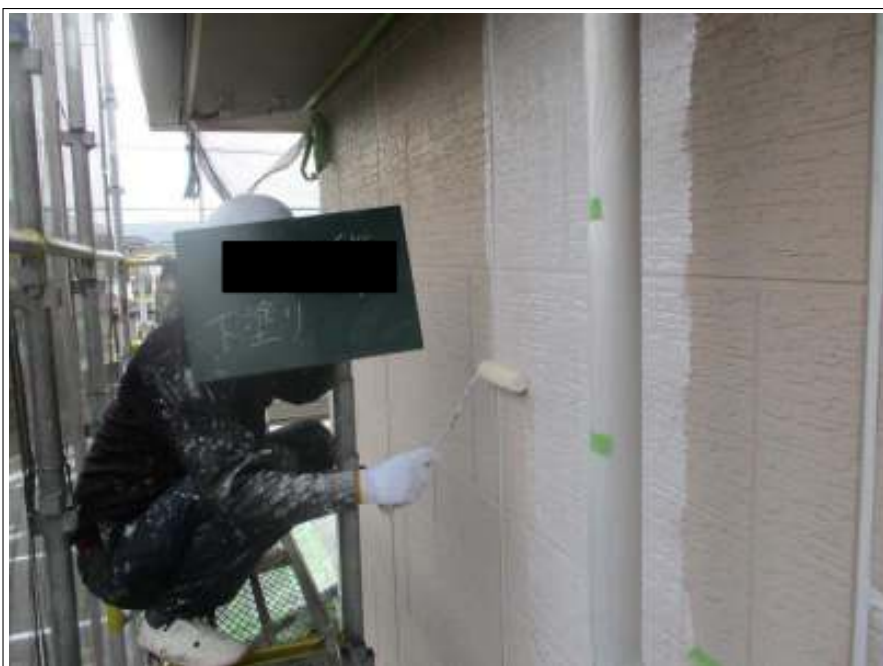
外壁 下塗り施工中