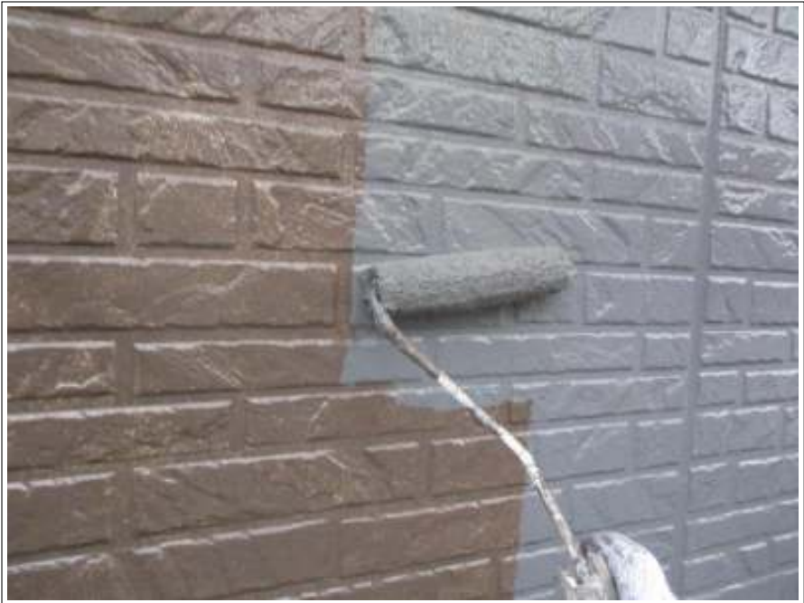
外壁（1F） 上塗り施工中