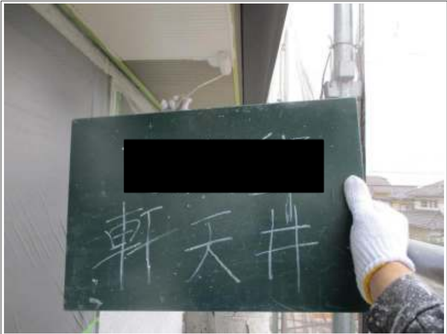
軒天 上塗り（1回目）施工中