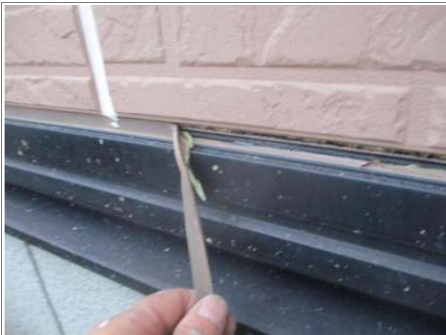
シーリング 既存撤去