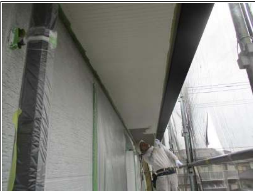
軒天 上塗り（1回目）施工中