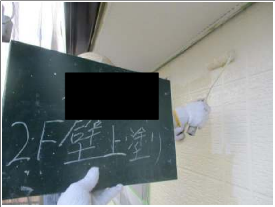
外壁（2F） 上塗り施工中