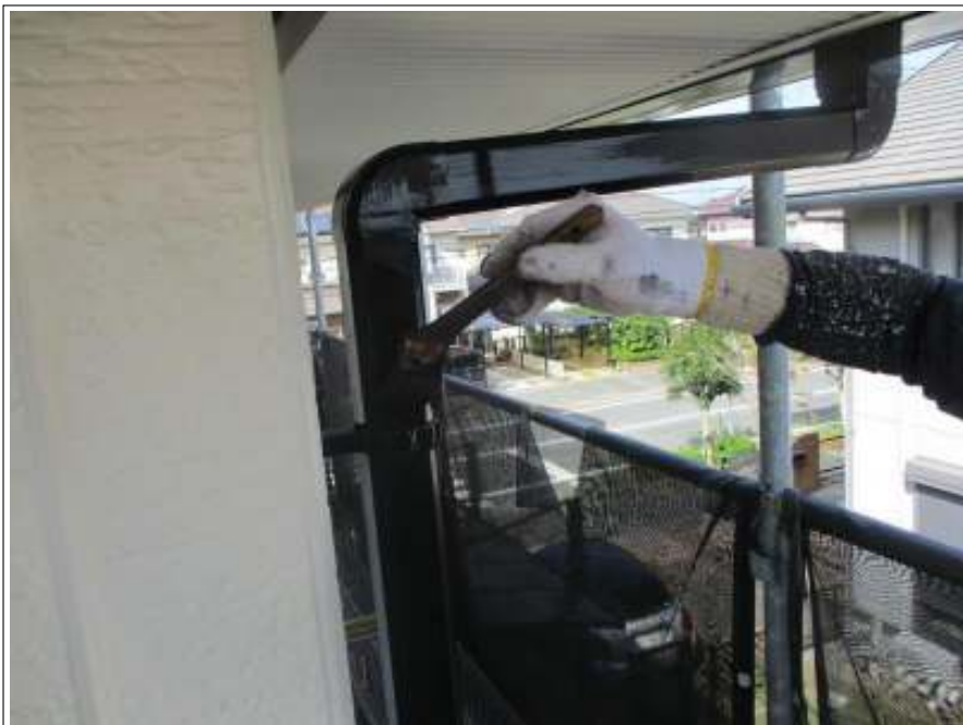
樋 上塗り（2回目）施工中