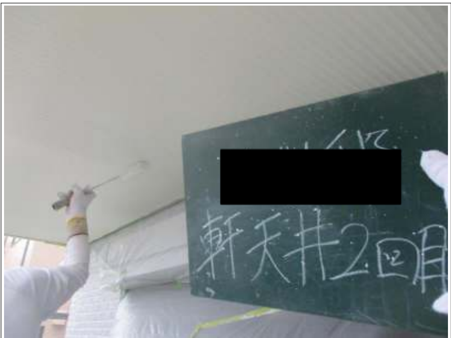
軒天 上塗り（2回目）施工中