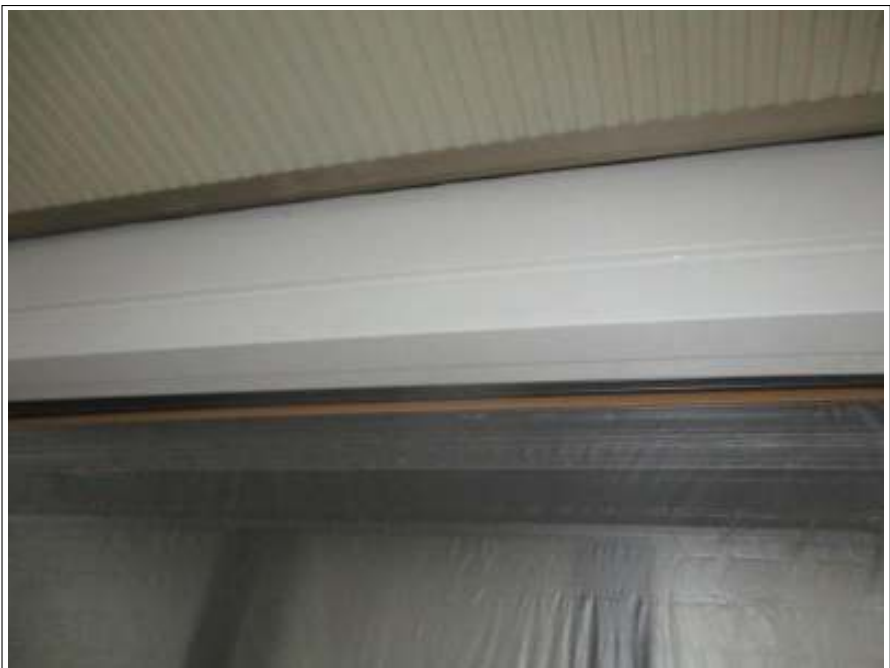
シャッターBOX サビ止め塗布後