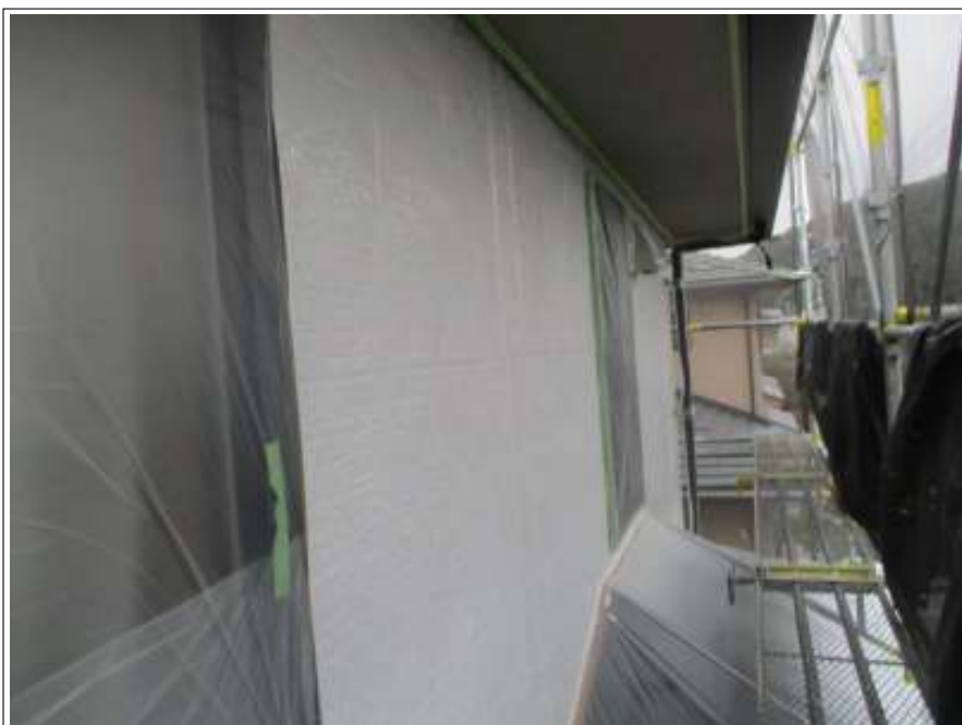
外壁 下塗り施工後