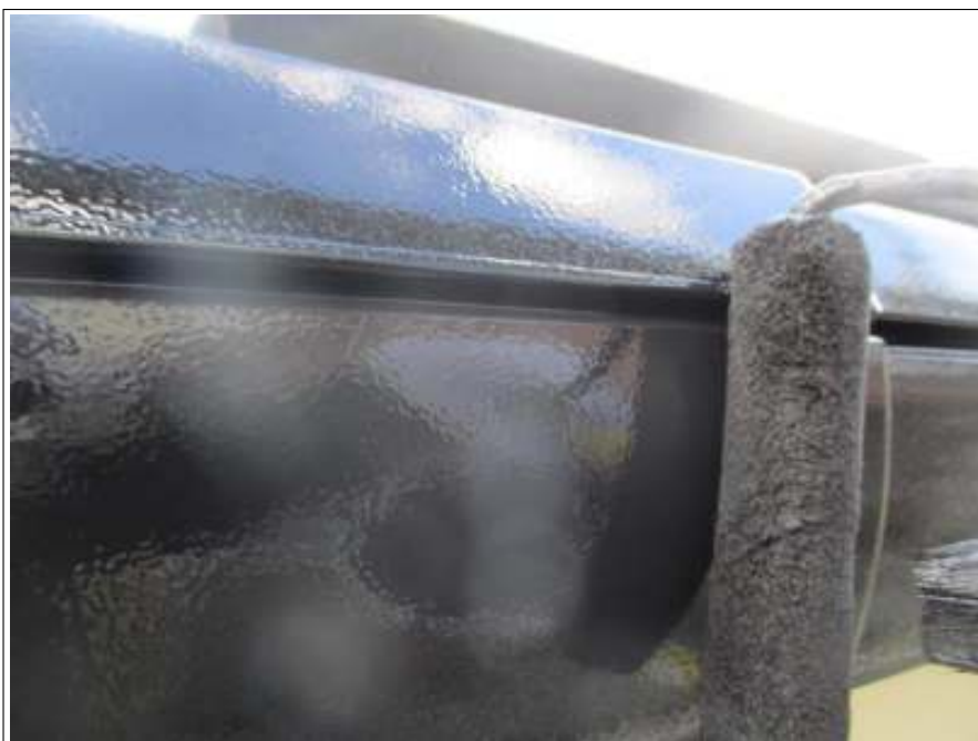
樋 上塗り（2回目）施工中