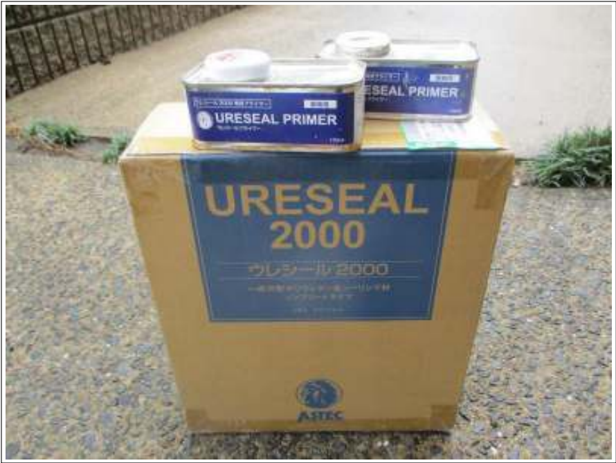
シーリング 使用材料