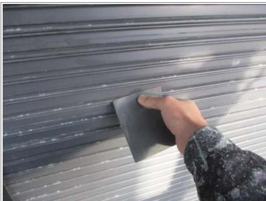
シャッター ケレン処理施工中