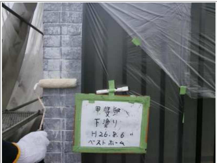
外壁塗装下塗り施工中