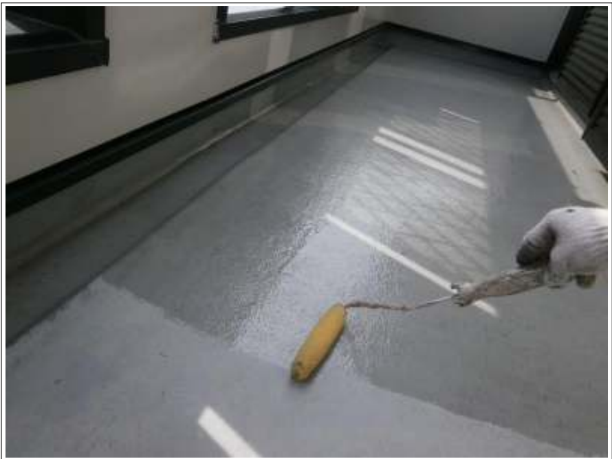
ベランダ床塗装下塗り施工中