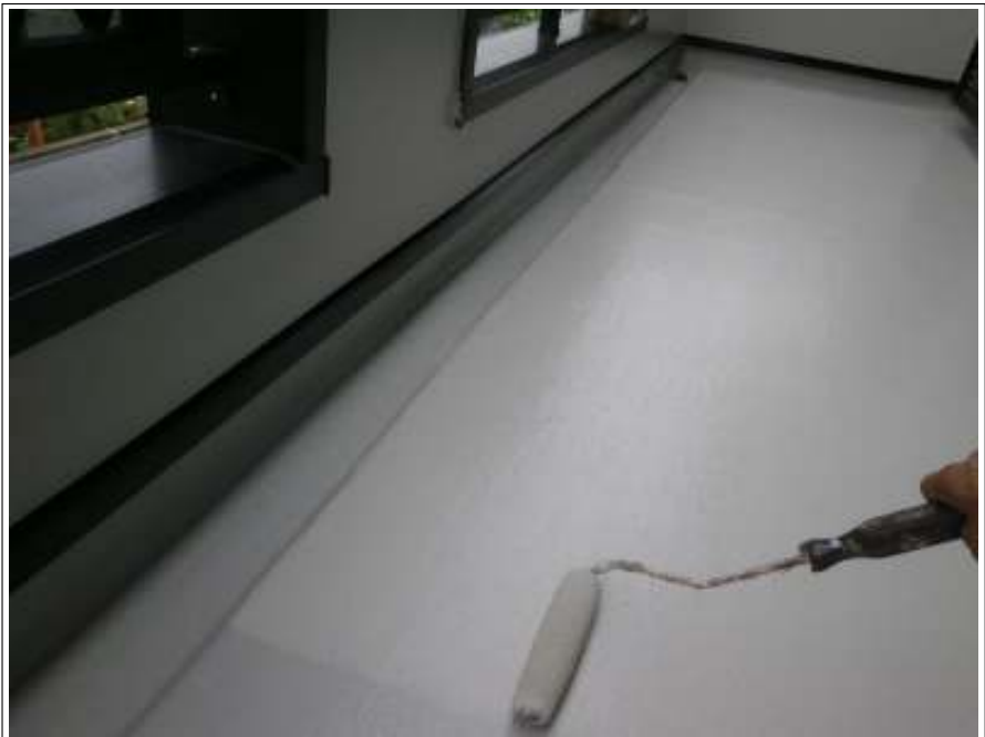
ベランダ床塗装上塗り施工中