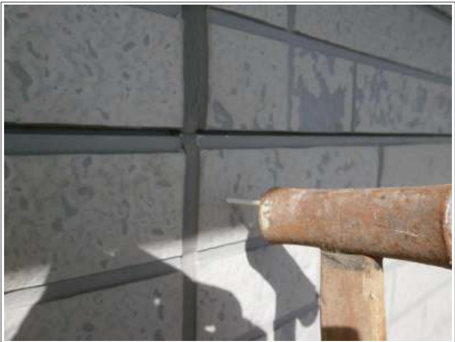
外壁サイディング部補修施工中