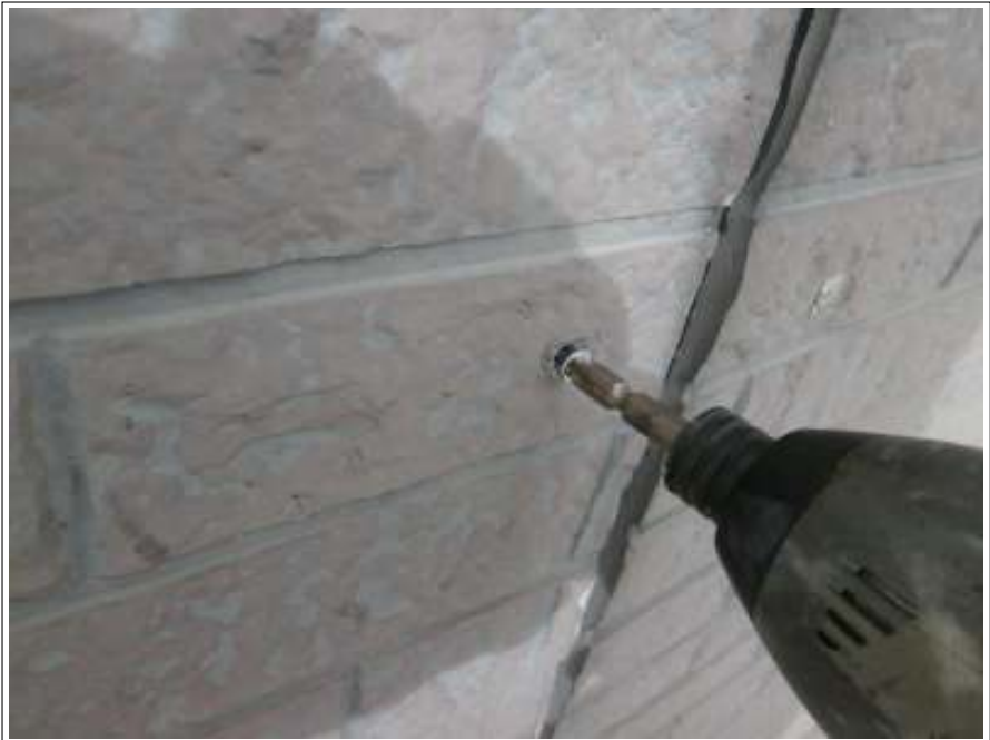
外壁サイディング部補修施工中