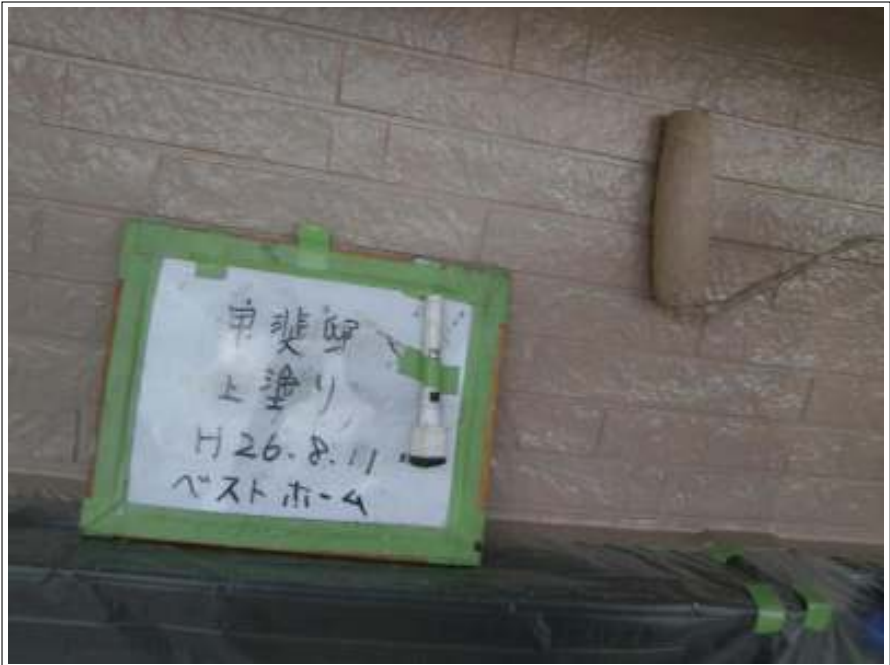
外壁塗装上塗り施工中