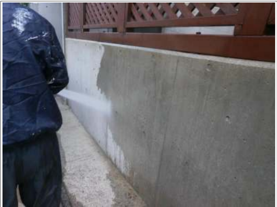
塀高圧洗浄施工中