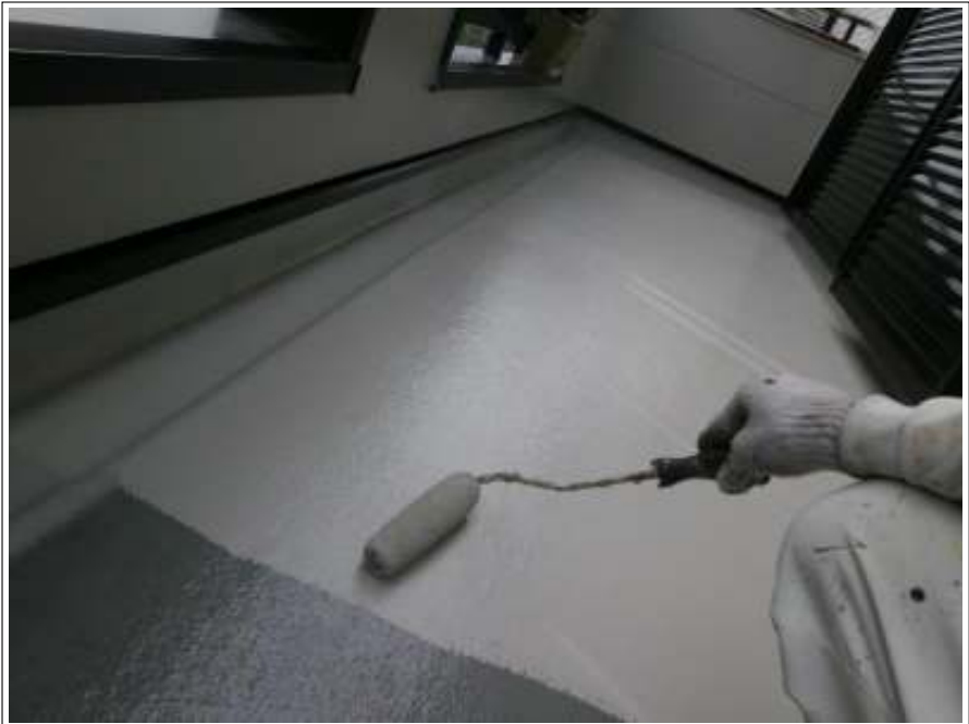
ベランダ床塗装中塗り施工中