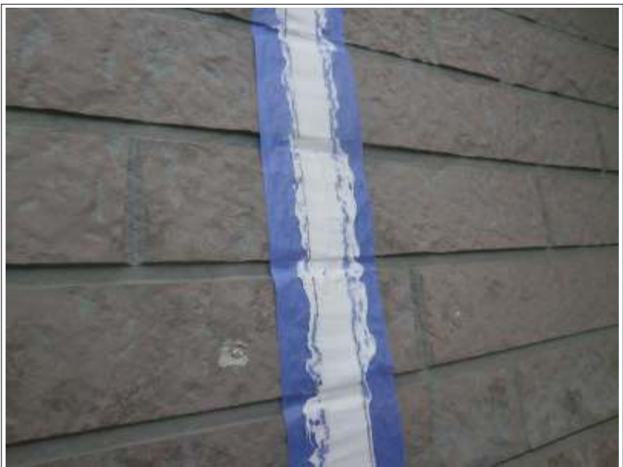
外壁シーリング補修施工完了