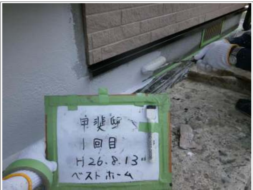
基礎塗装 1 回目施工中