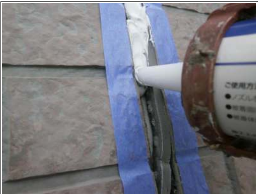
外壁シーリング補修施工中