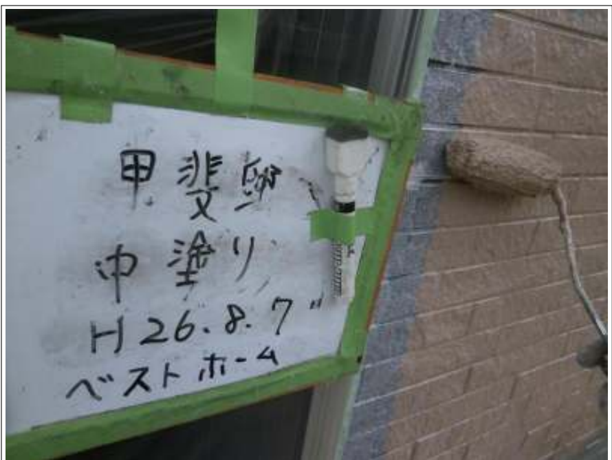
外壁塗装中塗り施工中