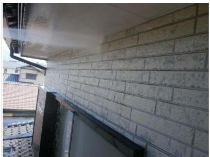
外壁高圧洗浄施工中